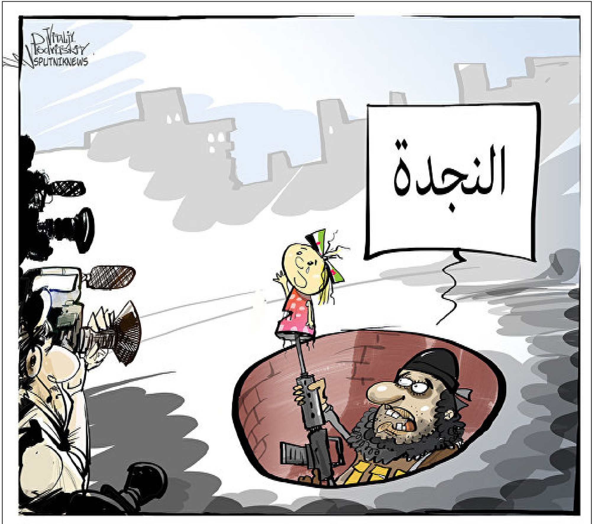
عن موقع «كارتون سياسي»