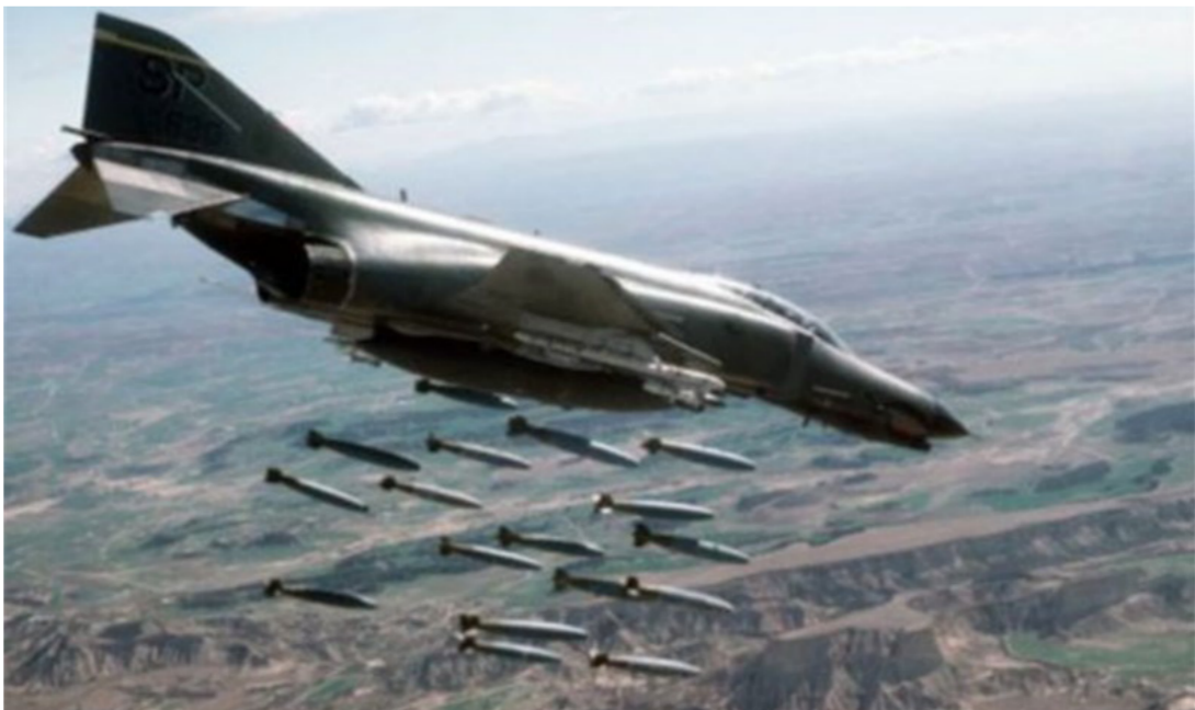
طائرة تابعة للتحالف الدولي تقصف مواقع لداعش في العراق

في عدة تقارير لعدد من المراقبين لسير المعارك في الموصل وحُرك الجماعات المسلحة من ضمنها «داعش» اشاروا الى ان «استعادة مدينة الموصل مستحيلة خصوصا بعد وصول ما يقارب من 50 آلية عسكرية متنوعة. من مدرعات وسيارات همر نقل العنترات من وحدات المارينز الأميركية. من ضمنها وحدات هندسية. والذين اتخذوا من بعض الأبنية التابعة لقاعدة القيادة والبعيدة عن القطعات العسكرية العراقية داخل القاعدة مقرا لهم إلى حين جُهيز القاعدة من قبل الوحدة الهندسية المرافقة.» وأشاروا الى ان «مباحثات ولقاءات متعددة كانت قد جمعت الجانب العراقي بالجانب الاميركي بقيادة التحالف الدولي في سبيل بحث خطة وموعد عمليات التحرير التي ستكون بإشراف القائد العام للقوات المسلحة رئيس الوزراء حيدر العبادي ويتواصل مستمر مع طيران الجو التابع لقوات التحالف الدولي». كما اشار المراقبون الى ان وزير الدفاع الاميركي. أشتون كارتر. لح في عدة تصريحات إلى إمكانية استمرار التواجد