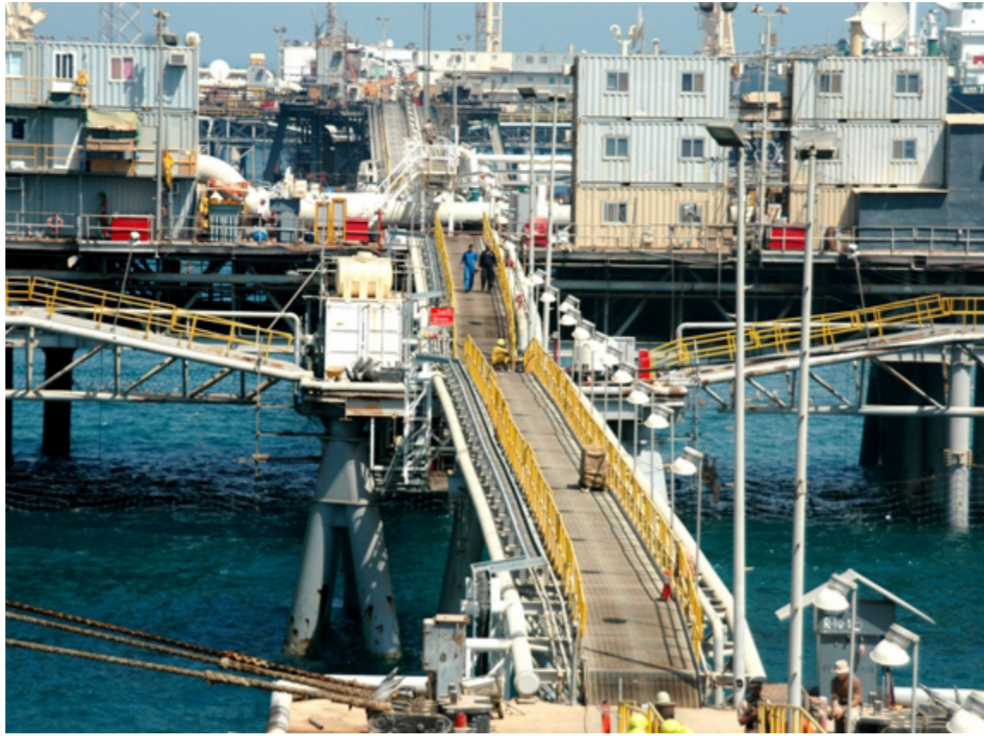
إحدى المنشآت النفطية في البصرة

مضيفة انها صدرت نحو 18 مليون برميل من النفط. موضحة ان «مجموع صادرات النفط يوميا كان 598 برميل من النفط». وتابعت الوزارة ان «مبيعات النفط خلال الشهر الماضي كانت نحو 568 مليون دولار، وان المبلغ التقني لحكومة الاقليم كان 374 مليون دولار». مشيرة الى ان «الاقليم باع برميل النفط خلال الشهر الماضي بـ 35 دولاراً».