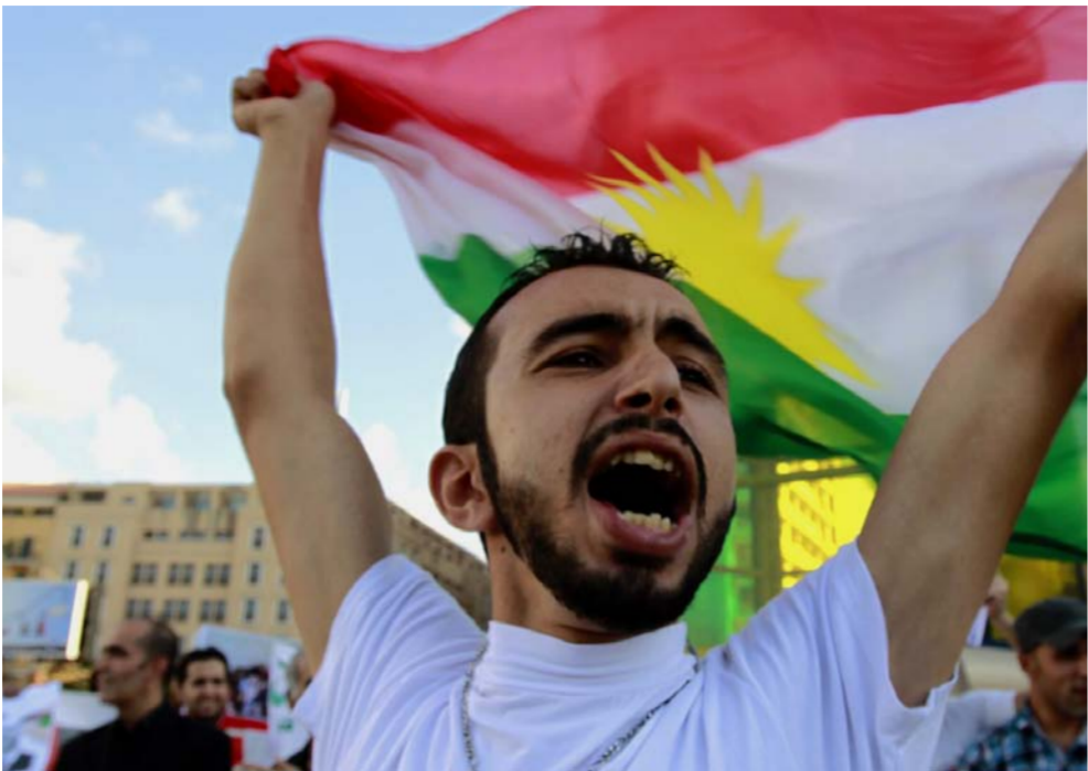
الاحتفال بيوم العلم الكردي

...على الشعب الكردي ان يكون واعيا وحذرا من الاعيب هذه الشرذمة الحاكمة التي تتلاعب بشعارات وطنية لغايات ومصالح شخصية وعائلية وحزبية