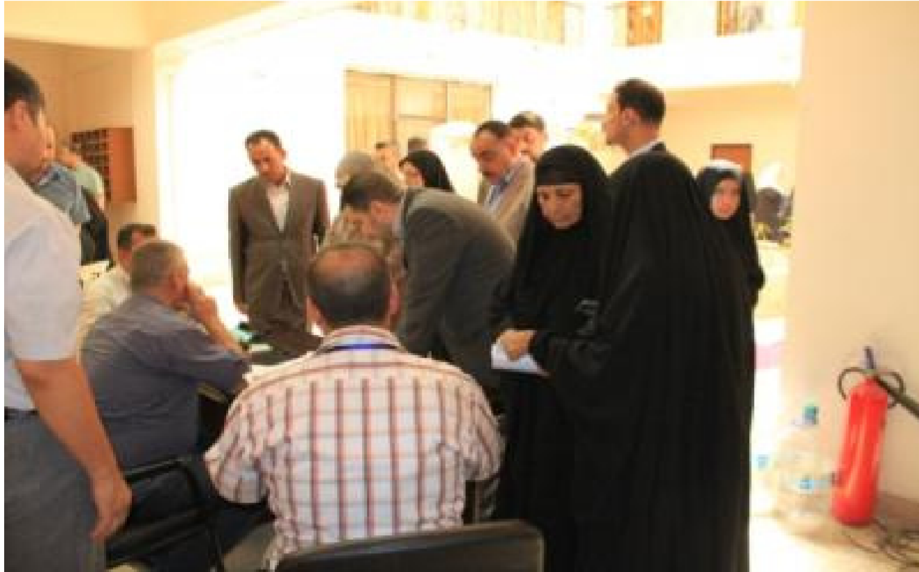
الاسر المشمولة بالإعانة الاجتماعية

وشددت الموسوي على إعطاء الأولوية للمرأة لما تعانيه من صعوبات في المجتمع وخاصة المرأة فاقدة المعيل التي لا تمتلك أي مصدر دخل لضمان حياة كريمة لها في ظل الظروف الصعبة التي تمر بها البلاد. ودعت الموسوي رؤساء أقسام دائرة الحماية الاجتماعية الذين حضروا الاجتماع الى الإسراع بالأجراءات الخاصة باصدار البطاقات الذكية للمستفيدات المشمولات حسب الآلية الجديدة . لافتة الى ان تأخير إصدار البطاقات يمنح فرصاً كثيرة لبقاء المرأة أسيرة للمعاناة الناجمة عن الضغوط الاجتماعية.