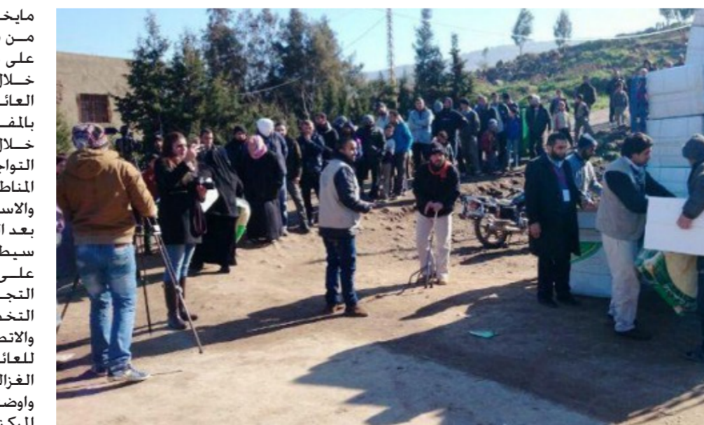
تجهيز الاغذية للمناطق المحررة

مايخدم اهلنا في المناطق التي خرتت من داعش الجرم كذلك تم التأكيد على مقاطعة المعلومات والاجابة خلال فترة وجيزة على جردوات العائلات المتواجدة لتأمين تجهيزها بالمفردات الغذائية بصورة منتظم خلال اللمدة المقبلة مع التأكيد على التواجد المستمر للملاكات الوزارة في المناطق المحررة وتأمين متطلباتها والاسهام في تذييل معوقات الحياة بعد الصعوبات التي واجهتها نتيجة سيطرة عصابات داعش الجرمية. على صعيد متصل أعلنت وزارة التجارة عن قيام فريق من دائرة التخطيط والمتابعة وقسم الاعلام والاتصال الحكومي بجولة تفقدية للعائلات النازحة في مخيم الغزالية. وأوضح رئيس لجنة العمل التطوعي المركزية ان الفريق أشرف على تجهيز العائلات خلال تلك الجولة بـ (10)