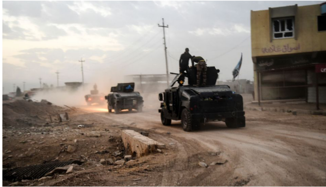
قوات مكافحة الإرهاب توشك على تحرير الجانب الأيسر بالكامل

من عصابات داعش الإرهابية. وبين إن "عمليات التحرير جري بدقة وحذر وذلك لتواجد المدنيين في أغلب المناطق التي يتحصن بها داعش الإرهابي. مشيراً الى ان "الساحل الأيسر يوجد فيه ما يقارب 500 ألف نسمة إضافة إلى الساحل الأيمن الذي يحتوي على 750 ألف نسمة. وأوضح الناطق باسم قيادة العمليات إن "القوات الأمنية أعدت خطة محكمة ستفاجئ داعش الإرهابي في الساحل الأيمن بعد ان تم قطع جميع الجسور بالساحل الأيسر وبذلك فقد جميع إمداداته ومحاصرته بنحو كامل. مؤكداً ان أبطال الجهد الهندسي سيعيدون بناء الجسور بأسرع وقت ممكن بعد الانتهاء من عملية تحرير الموصل. من جانبه أعلن القائد في جهاز مكافحة الإرهاب اللواء الركن معن السعدي، عن طرد إرهابي تنظيم داعش في أكثر من 40 حياً من أحياء الساحل الأيسر لمدينة الموصل.