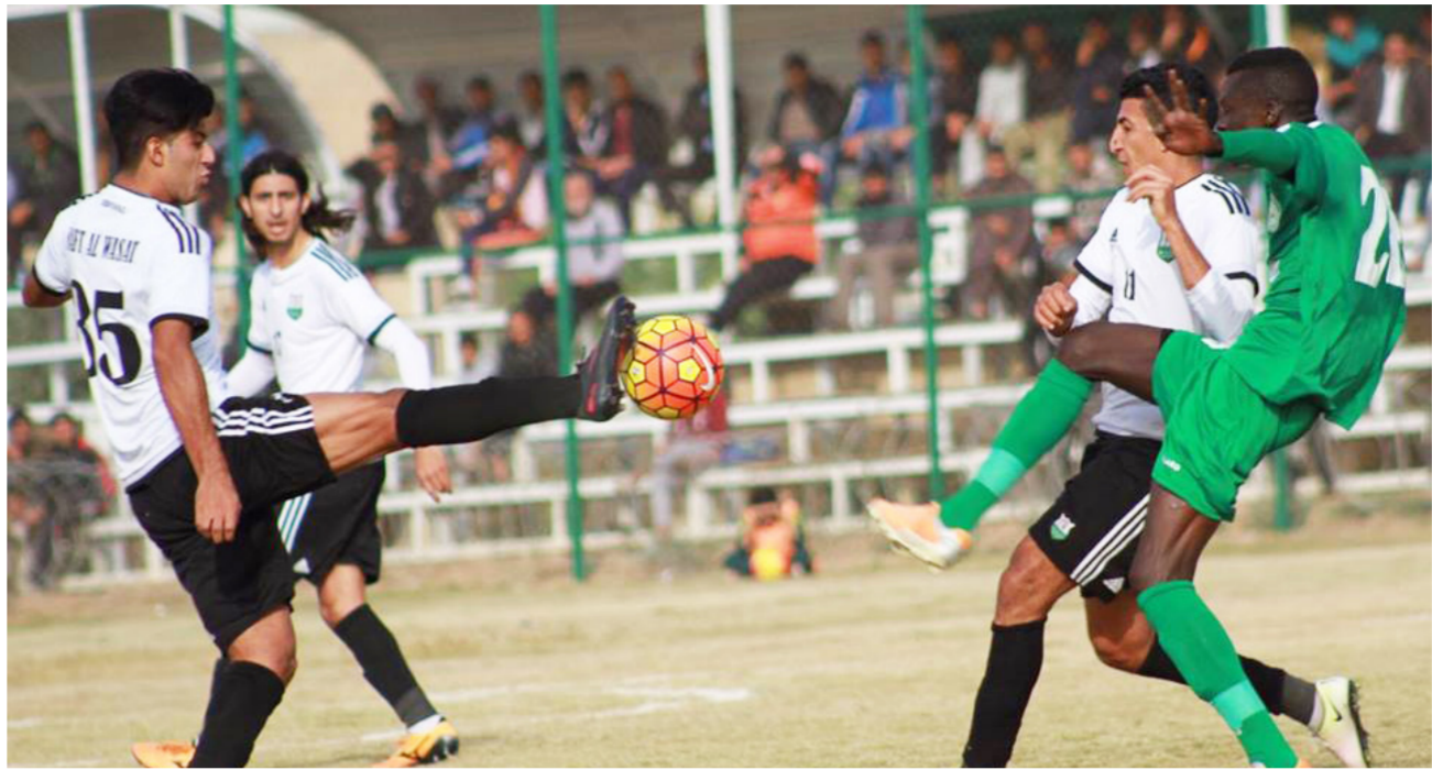
نفط الوسط يواصل تفوقه في الدوري الممتاز