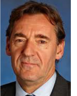
جيم أونيل الرئيس السابق لبنك جولدمان ساكس لإدارة الأصول

ويالحكم من خلال اتهاماته للصين، يبدو أن ترامب بيساطة بنير اللقالق ويستنهض أنصاره - ولا يتقدم بأية