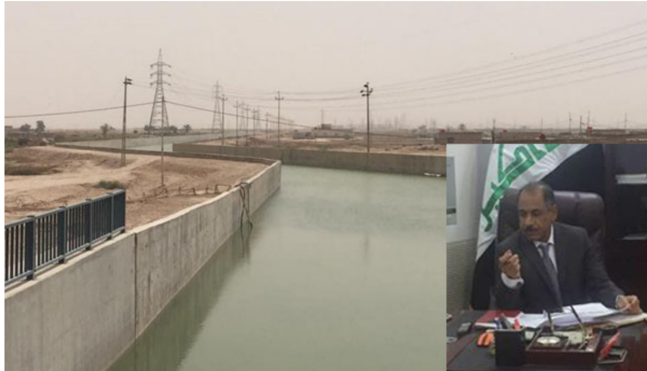
مدير مشروع ماء البصرة ولقطة من القناة المفتوحة الممتدة على طول 238 كم و 200 متر