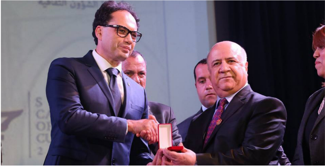
جانب من الاحتفال