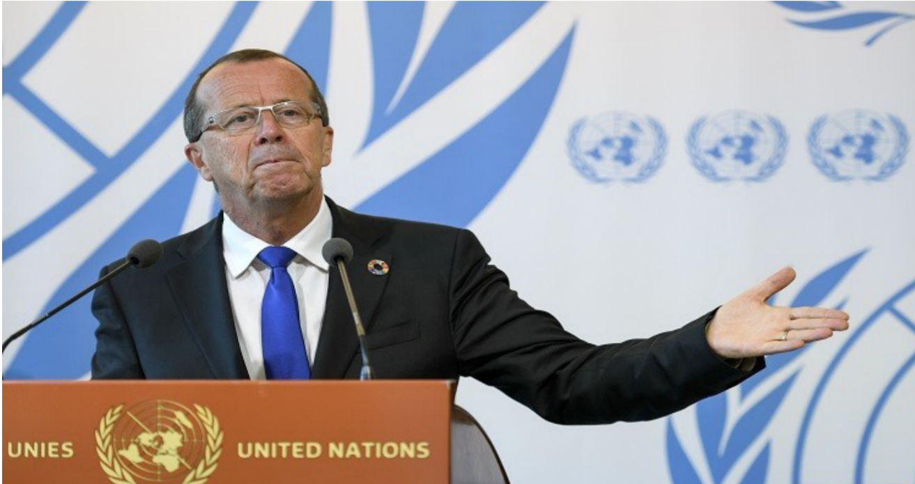
مبعوث الأمم المتحدة في ليبيا مارتن كوبر

الثامنة من الأحكام الإضافية من الاتفاق السياسي، بما يحفظ استمرار المؤسسة العسكرية واستقلاليتها وإبعادها عن التجاذبات السياسية. وكذلك إعادة النظر في تركيبة مجلس الدولة ليضم أعضاء المؤتمر الوطني العام المنتخبين في 2012، وإعادة هيكلة المجلس الرئاسي على اتخاذا القرار لتدارك ما ترتب على التوسعة من إشكاليات وتعطيل. هذا، وإن نقاط الاتفاق التي تم التوصل إليها في اجتماعات القاهرة، تم التباحث فيها خلال زيارة المبعوث الأممي كوبر إلى العاصمة المصرية في أواخر الشهر الماضي، حيث تم التوافق على عقد اجتماع آخر للأطراف الليبية الفاعلة لمناقشة ما تم التوصل إليه. على ضوء المشاورات المحلية والإقليمية والدولية الجارية، ولتبني الحلول اللازمة لإنهاء الأزمة الليبية.