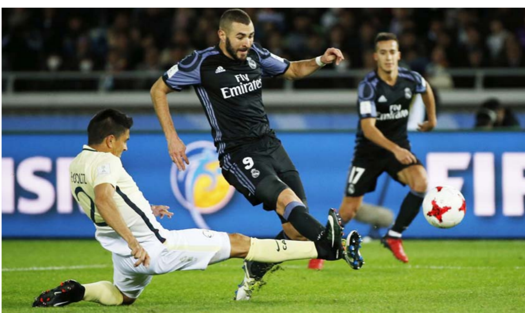
جانب من احدي مباريات ريال مدريد في مونديال العالم

ويتطلع الهادف البرتغالي رونالدو لحصد لقب جديد مع المراد الأسباني بعد أيام قليلة من فوزه بجائزة الكرة الذهبية التي تمنحها مجلة «فرانس فوتبول» لأفضل لاعب في العالم. للمرة الرابعة في مسيرته. واستهل ريال مدريد رحلته في مونديال المربع الذهبي بهدفين نظيفين محلاً توقيع كريم بنزيمة ورونالدو. في الوقت الذي خاض فيه كاشيما ثلاثة لقاءات في طريقه للمباراة النهائية حيث فاز في افتتاح البطولة على أوكلاند سيتي النيوزيلندي 2-1. ثم فاز على