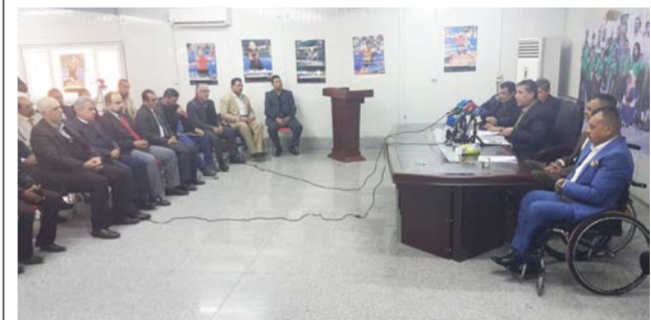
جانب من اجتماع البارالمبية

المعاقين وحسب القانون الدولي البارالمبي في جميع دول العالم ولا يجوز اضافة كلمة (الاصحاء). وأكد: ان خديده رواتب المكتب التنفيذي ب (750000) سبع مائة وخمسون الف دينار والمستشار القانوني (1000000) مليون دينار يعد خلافا لقوانين وزارة المالية وطنبنا اخضاع الرواتب الى قانون الموازنة العام وتعليمات وزارة المالية وقوانينها. ووضح: ان اشراك اللجان البالغة (18) لجنة ضمن الهيئة بسبب ارباك في عملية انتخاب المكتب التنفيذي عند الترشيح وكانت الفقرة الموجودة تنص على اشراك المناطق البالغة خمس مناطق بالهيئة العامة (علما ان انتخابهم يصبح لمرتين اي في الاخابات وفي