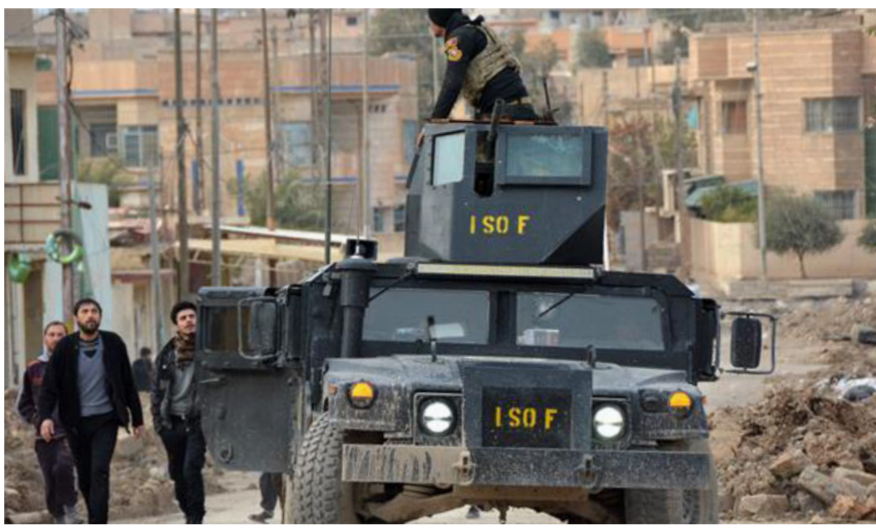
قوات مكافحة الإرهاب داخل أحياء الموصل

بغداد - أسامة نجاح: أعلنت قيادة قوات جهاز مكافحة الإرهاب، أمس الأحد، عن اقتحام قواتها لحي الفلاحات في الساحل الأيسر لمدينة الموصل وتوغلت فيه بعد معارك شرسة خاضتها ضد زمر داعش الإرهابية، وفيما أشارت قيادة قوات العمليات المشتركة عن خرب 29 قرية في الساحل الأيسر من الموصل من قبل قوات جهاز مكافحة الإرهاب والفرقة التاسعة التابعة للجيش العراقي أكدت ان القوات المشتركة تقترب من التحرير الكامل لجميع احياء الساحل الأيسر من الموصل وقال القائد في جهاز مكافحة الإرهاب الفريق الركن عبد الوهاب الساعدي أمس الأحد ان "قوات مكافحة الإرهاب اقتحمت حي الفلاحات شرقي الموصل وتخوض معركة شرسة لتطهيره من زمر داعش". وأضاف الساعدي في حديث خاص لصحيفة "الصباح الجديد" ان "قطعاعات جهاز مكافحة الإرهاب اقتحمت حي الفلاحات وسائل الإعلام تناقلت خبراً عن تعرض الجيش العراقي لضربات خاطئة من طيران التحالف الدولي"، موضحة أن "طيران التحالف قدم إسناداً كبيراً وما زال مستمر بإسناده للعمليات ولم يؤشر انه ارتكب أي خطأ ضمن قاطع عمليات قادمون"، ياتينوي.