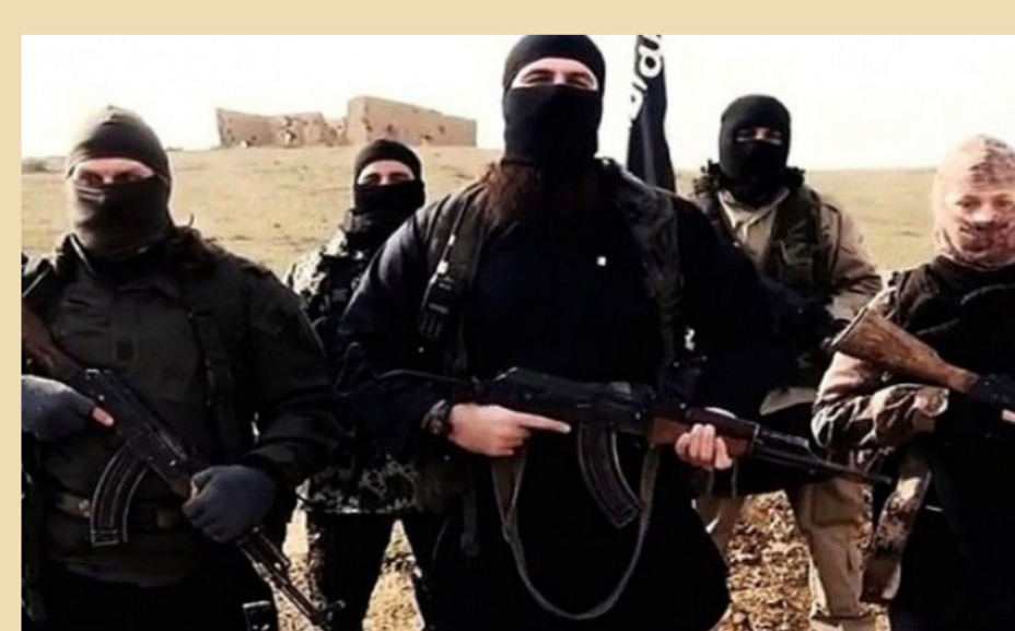
مقاتلو داعش في العراق "ارشييف"

بغداد - الصباح الجديد: نشرته صحيفة الصنادي تلغراف في عددها الصادر، أمس بعنوان "تنظيم داعش يحتضر" ويجب على الغرب أن يدفع، فيما عدت الأمانة بأنه أشبه بقطع رأس وحش متعدد الرؤوس، فإذا لم يتبه التحالف المناهض للتنظيم، قد ينمو للتنظيم رؤوس جديدة. وتقول سامويل، إن "وقت تنظيم داعش يوشك على النفاد"، فمع تقدم الجيش العراقي في الموصل، آخر معقل مدني للتنظيم في العراق، تثنى القوات المدعومة من الولايات المتحدة هجوماً منفصلاً على الرقة، معقل التنظيم في سوريا. وتضيف، "على الرغم من البطء في تقدم عملية الموصل وحصدتها مئات الأرواح، إلا انها مستمرة مقترية من قلب