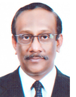
ماريلاند شهيد الحق وزير خارجية بنغلاديش.

مع مراقبة صارمة لهذه الآلية . ولا يجب النظر إلى هذه الخيارات على أنها متعارضة . فإذا ما سادت الديناميات وتم صياغة ترتيبات دولية بحرص . يمكن أن يتخيل المرء نتيجة مشابهة لاتفاق باريس للمناخ الذي أبرم في عام 2015 من التزامات ملزمة في بعض المناطق ومبادئ إرشادية غير ملزمة في مناطق أخرى ووعد مشترك الذي يحرزونه بصورة منتظمة . وسيساعد مثل هذا النهج على ضمان الفعالية . ورئيسة للمنتدى العالمي للهجرة والتنمية . ستنتقل بنجلاديش توصيات قمة دكا لمفاوضي الدول وستدفع نحو التوصل إلى اتفاق بين الزعماء السياسيين في مؤتمر ما بين الحكومات المزمع عقده في عام 2018 والذي يطور بصورة كبيرة كيفية إدارة الهجرة وبهذا سنجعل المهاجرين أكثر أمناً والمجتمعات أكثر انسجاماً والاقتصادات أكثر ازدهاراً