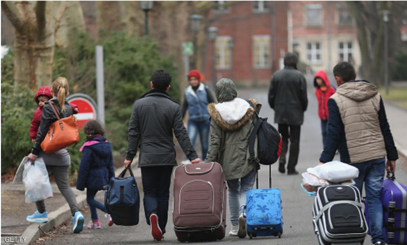
اللاجئون في ألمانيا

اجتماعية. ما تزال ألمانيا وحكومات اوروبية اخرى لا تفصل كثيراً بين نشاطات ألمانيا وما بين مارسة الجالجات المسلمة شعائنها وطقوسها المدنية بعيدا عن التطرف.