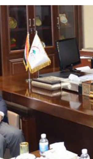
جانب من اللقاء

الحكومية . وجرت مداوالات ومناقشات عديدة وبثارة بين الخدمات الصحية العادلة في تقديم الخدمات الصحية في العراق وبلدان العالم . مشيراً الى تقارير المنظمة الدولية بهذا الشأن والتعاون والتنسيق بين المنظمة ووزارة الصحة وبقية الوزارات والجهات