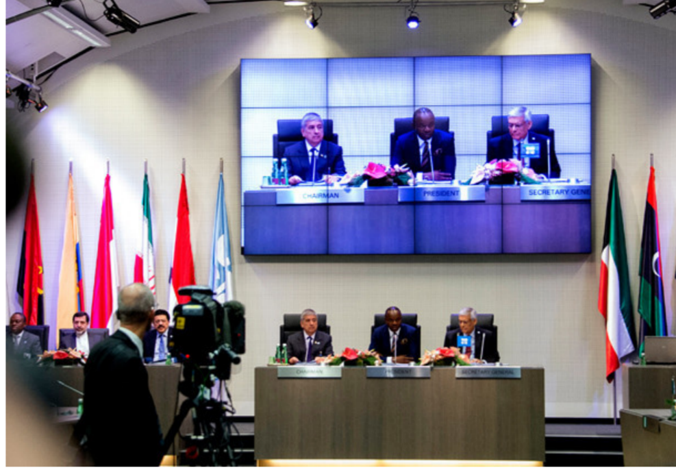
اجتماع سابق لأوبك