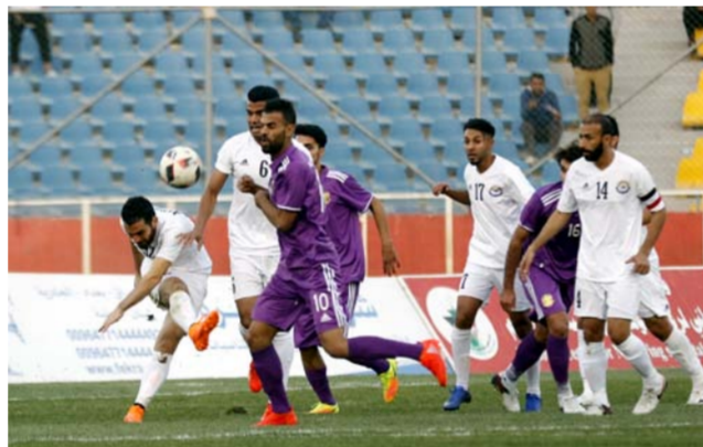
من مباراة الزوراء والشرطة

أقيمت أمس. عن فوز الجوية على ضيفه الميناء بهدفين مقابل هدف واحد للميناء. وبالنتيجة ذاتها فاز الطلبة على نطق ميسان. وتعادل امانة بغداد ونطق سلبا. وهي النتيجة ذاتها التي آلت قطر وكذلك لارتباطه العائلي هناك. لافتاً إلى أن الجهاز الفني سيناقش الخيارات البديلة مؤكداً أنه لم يطرح اسم مدرب محدد بخلافه صابر. الى ذلك. أسفرت مباريات دوري الكرة بجولة الحادية عشرة التي