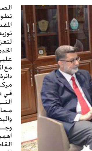
جانب من اللقاء

كما ناقش اللقاء متابعة المستشفيات المنفذة في عدد اخر من محافظات البلاد لاسيما مستشفى الامام الصادق عليه السلام في محافظة بابل والذي ياشتر بتقديم خدماته النوعية الى ابناء بابل والمناطق