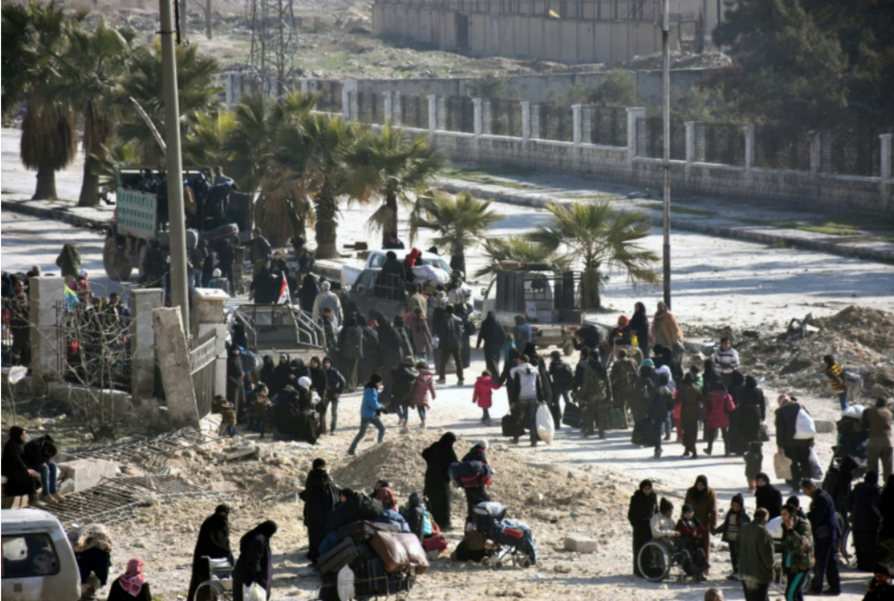
مدنيون يفرون من حلب

منازلهم وأعلن وزير الدفاع الأميركي، أشتون كارتر، السبت، أن الولايات المتحدة ستترسل مئتي جندي إضافي إلى سورية «من أجل ضمان جّاح عزل الرقّة»، وسيُنضم هؤلاء، وفق قوله، إلى «300 عنصر من القوات الخاصة في سورية وذلك من أجل مواصلة التنظيم والتدريب والتجهيز».