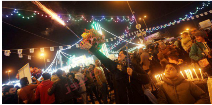
احتفالات المولد النبوي

بغداد - الصباح الجديد: احتفلت الامة الاسلامية والعربية بالمولد النبوي الشريف والذي صادف يوم امس الأحد 12 ربيع الأول. اقيمت الاحتفالات في ليلة يوم السبت في مدينة الاعظمية في بغداد، وايضا في مدينة النجف. اعلانا من العراقيين عن وحدتهم في هذا اليوم، وقد اصبحت منارات مقام الامام ابو حنيفة النعمان في الاعظمية، وسط حشد كبير من المتحمليين بهذا اليوم، مع حفلات المولد التي تنعقد بالرسول "ص" وبأخلاقه وصفاته مع اصوات المدفوف الجميلة والمميزة.