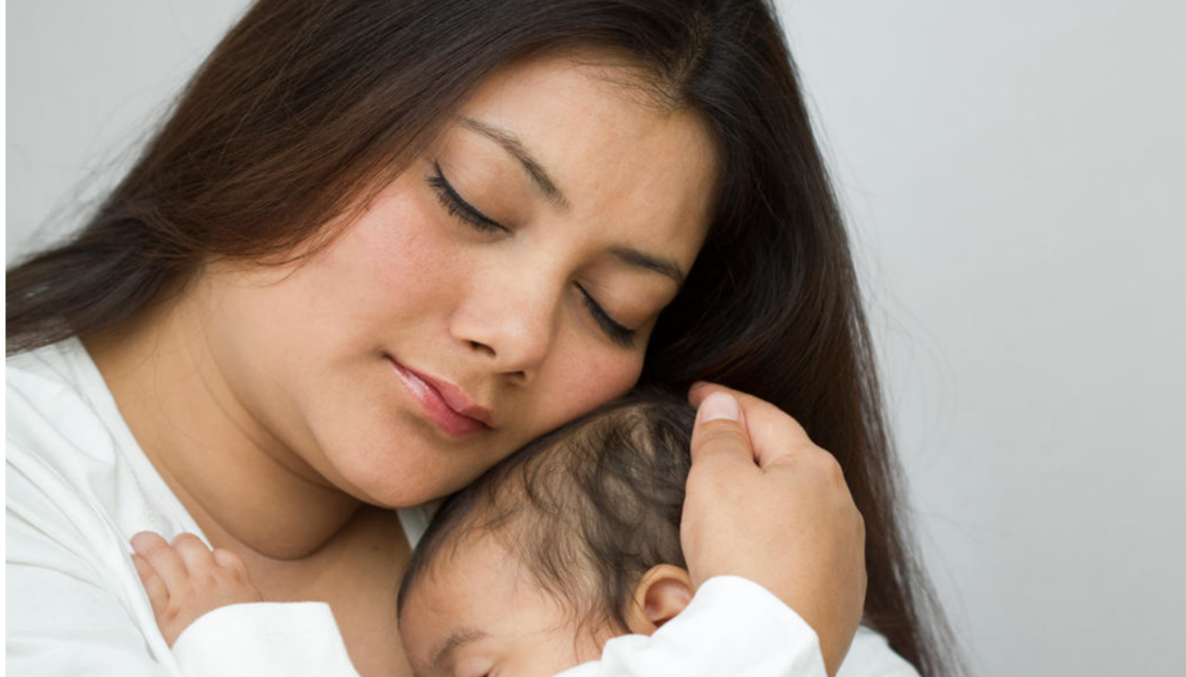
فرع طب الأطفال بكلية طب البصرة يقيم العديد من المؤتمرات والندوات وورش العمل

الاطفال هي لأغراض المعالجة الصحيحة والمبكرة للعدوى لمرضى الاعتلال الهيموغلوبيني ومرضى سرطان الدم وقد اوصى المشاركون باستخدام العلاج الوقائي المتمثل باللقاحات الإضافية لمرضى فقر الدم المنجلي والمرضى الذين يحتاجون عملية رفع الطحال وتوفير معطيات التشخيص ومنها أجهزة BONE SCAN