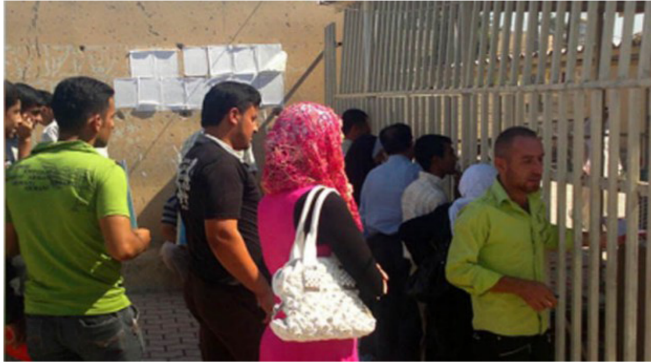
الباحثون عن التعيينات في العراق "ارشيف"

الاختصاصي والتربوي ومدير الملاك ومسؤول لجنة الخدمة الفرعية وممثل مكتب الفتش العام في المديرية تتولى الإشراف على عمل اللجان الفرعية. 4 - تشكيل لجنة فرعية في كل قضاء وناحية في الوحدات الإدارية التابعة للمديرية وتتألف هذه اللجان من رئيس قسم التربية في القضاء أو وجد عضوية مشرف اختصاصي ومشرف تربوي وموظف من لجنة الخدمة وموظف قانوني تتولى هذه اللجنة تسلم طلبات المتقدمين وتدقيقها في حالة عدم وجود مدير قسم في القضاء والناحية تتألف اللجان برئاسة مشرف اختصاص. 5 - يكون الترشيح للتعين حسب الحاجة الفعلية للاختصاص وبنسبة 60% للذكور و40% للإناث وتلتزم المديرية العامة للتربية بالاختصاصات التي حددتها التربوية التي الوزارة بحيث يجب أن تطابق التعيينات مع الاختصاصات التي حددت من قبلكم ولا يقبل أي تغيير إلا بعد استحصال موافقة الوزارة