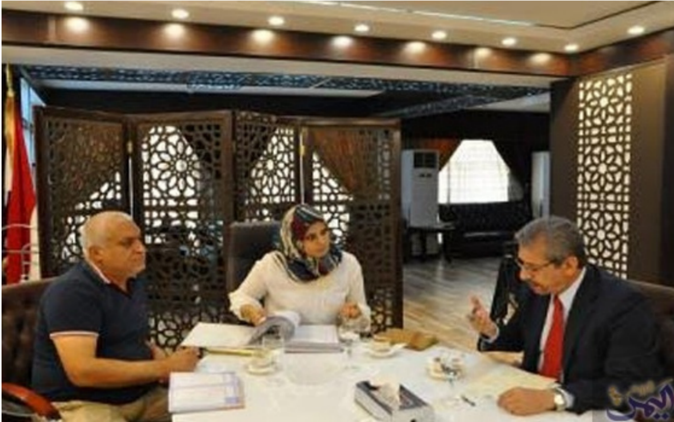
اللجنة الفنية للسياحة العربية

وكان أكبر عدد من الاتفاقيات السياحية من نصيب مصر التي عقدت 11 اتفاقية ثنائية مع دول عربية مختلفة، وتتمثل أهم أحكام تلك الاتفاقيات في تبادل الخبرات السياحية والمعلومات والإحصاءات والتدريب والتأهيل، إضافة إلى توحيد القوانين والتشريعات السياحية، ووضع أسس مشتركة للخدمات والمنشآت السياحية والحفاظ على البيئة والتراث، وتبسيط إجراءات نقل السياح، ولدعم جهود التنمية السياحية في إطار جامعة الدول العربية تم إنشائها كل من المجلس الوزاري العربي للسياحة في عام 1997 والمنظمة العربية للسياحة