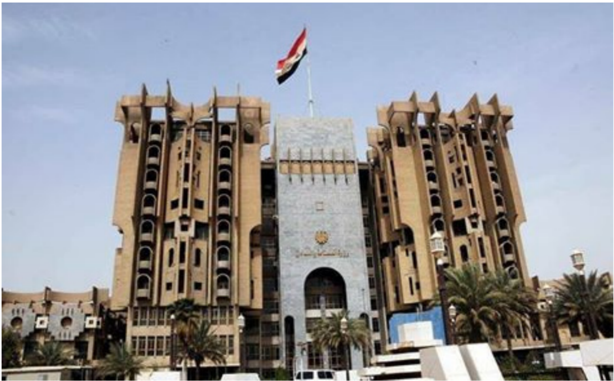
مبنى وزارة الصناعة

واعداد عقود معيارية بين تلك الجهات فضلا عن التنسيق مع المنظمات الدولية في مجال دعم خصخصة الشركات العامة وغيرها من المهام الأخرى. الجدير بالذكر ان وزارة الصناعة والمعادن اعلنت في وقت سابق عن سعيها للحصول على قرض من البنك الدولي للمساعدة في تمويل عمليات إعادة هيكلة الشركات العامة اذ ان الجاز قاعدة القروض.