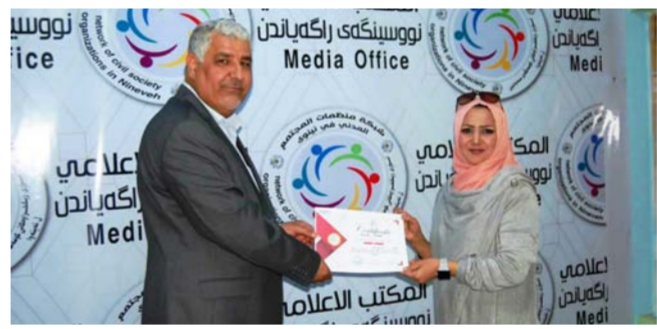
جانب من التكرم