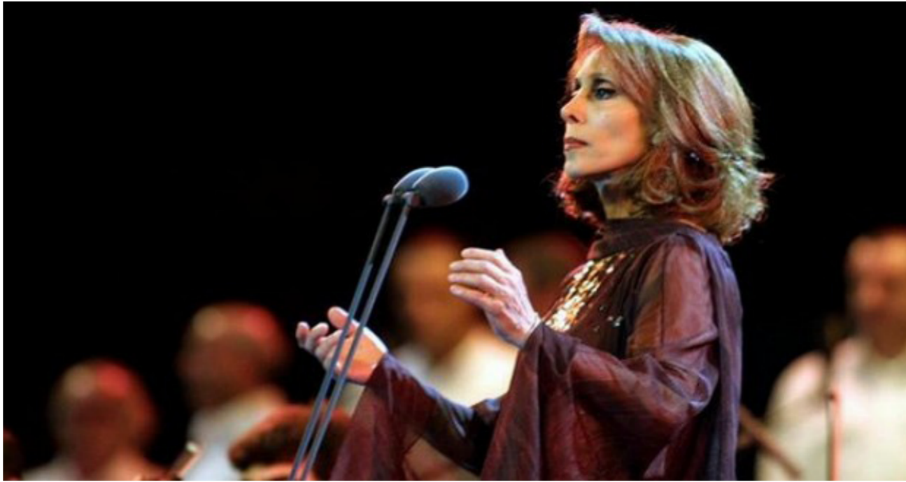
جانب من إحدى حفلات فيروز الأخيرة

ذهب الزمان وضوعه العطر .. وغنت للشام عدداً كبيراً من الأغنيات منها قولها « شام ماالجذ انت المجد لم يغب » وبالطبع الكلمات للشاعر عقل ، وغنت للبنان الكثير أيضاً ، منها « وطني يا جيل الغيم الأزرق » وكذلك « ولصبر » مصرعات شمسك الذهب