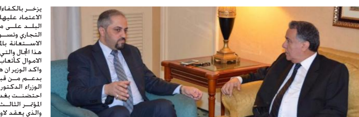
وزير العدل العراقي مع رئيس مجلس الوحدة الاقتصادية في الجامعة العربية

محمد الربيع رئيس مجلس الوحدة الاقتصادية في الجامعة العربية والشيخ مشعل الصباح رئيس المحكمة العربية للتحكيم التجاري وتسوية المنازعات. عرض الوزير خلال اللقاء للوفد الزائر الخطوات المتخذة من قبل وزارة العدل بخصوص موضوع التحكيم والسعي لتأسيس قاعدة من المحكمين العراقيين اصحاب الخبرة والكفاءة وتدريب الملاكات الجديدة للارتقاء بمستوى مهاراتها لتكون مواكبة للمحكمين العرب والاجانب. اذ ان العراق