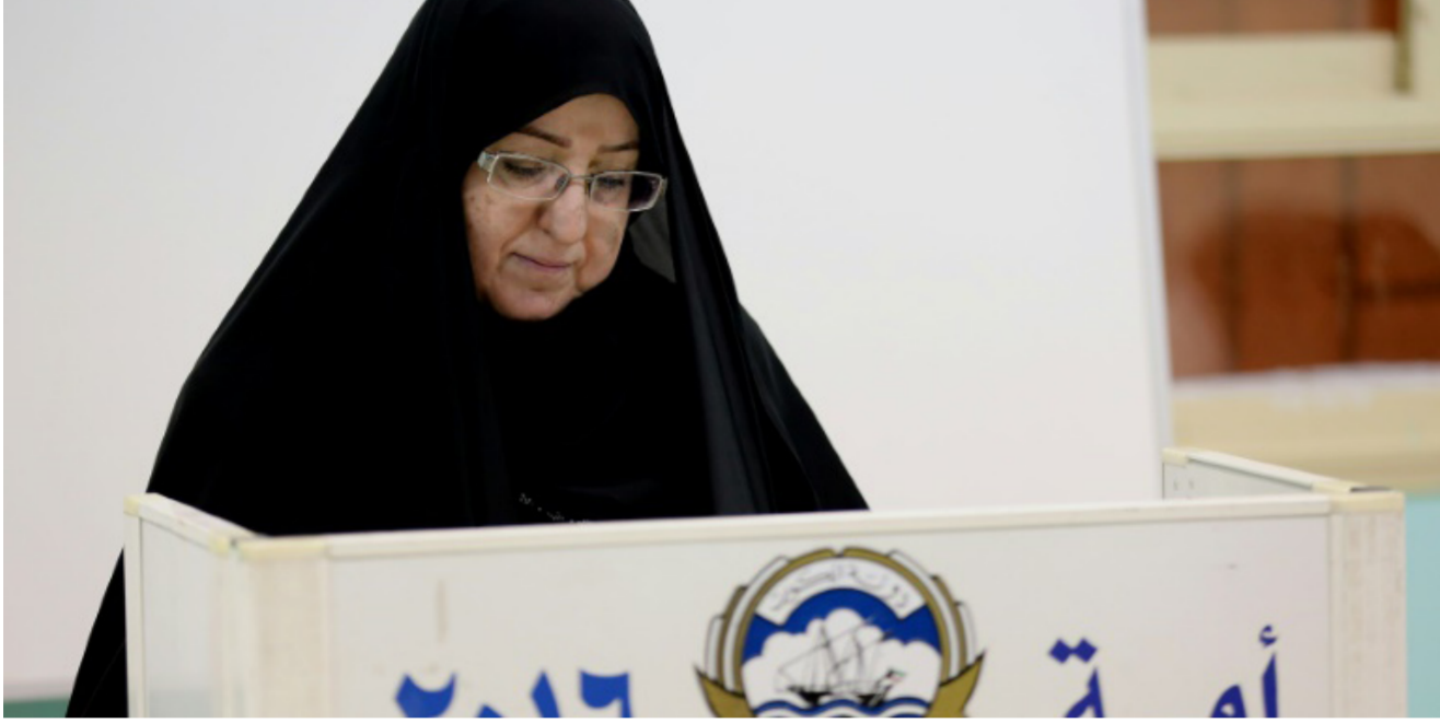
كويتية تدلي بصوتها في انتخابات مجلس الأمة

الخصوصية، وبالتالي عدم ترشحهما للانتخابات. ويرى الكندي، وهو أحد النواب السابقين الخمسة الذين استقالوا من مجلس الأمة السابق، بعد تسعة أشهر من حارسيتهم العمل النيابي، أن هناك عدة معطيات تقف وراء قراره الترشح مجدداً، ضمنها عودة المقاطعين للمشاركة الانتخابية، ونوه الكندي بالمشاركة الكثيفة للشباب في اقتراع امس، ولم يغفل بدوره الحديث عن ضرورة تعديل النظام الانتخابي، وعزا معاناة الكويت من العجز الاقتصادي، والعجز في الموازنة إلى الهدر المستشري، وليس إلى الأزمة الاقتصادية العالمية.