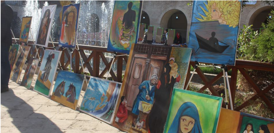
جانب من المعرض

التي قام بعملها المرضى الراقدين وهي ضمن الأعمال الخاصة بتأهيل المرضى والتي تتضمن أعمالاً فنية متنوعة والعروض المسرحية وكذلك البطولات الرياضية التي تقيمها المستشفى من أجل الراقدين فيها ليكونوا مؤهلين في المجتمع . وأضاف إن الدائرة عملت على تقديم الخدمات التأهيلية والفندقية من خلال تقديم الطعام للسلفان والأول مرة في تاريخ المستشفى . فضلاً