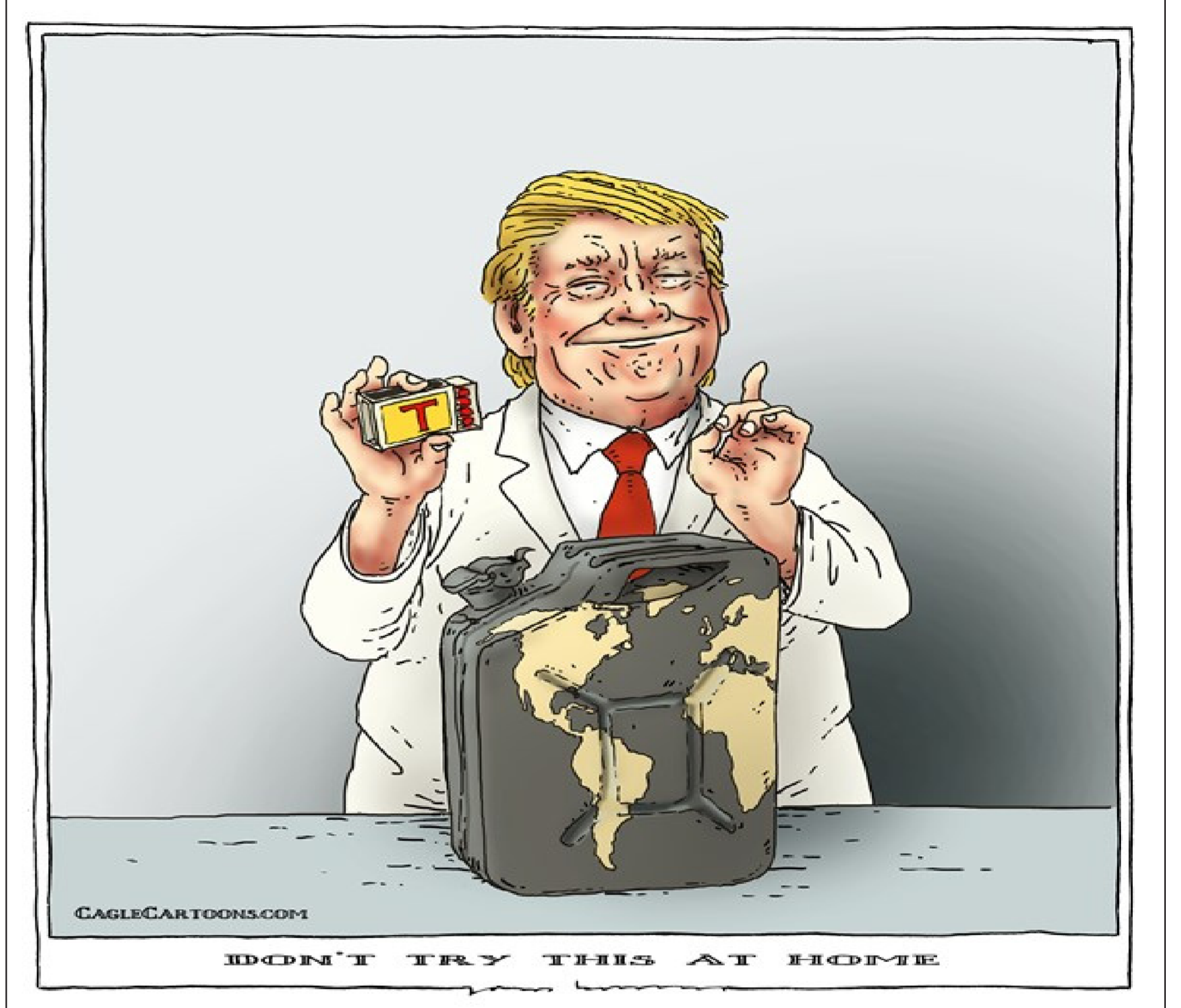
عن موقع «كارتون سياسي»