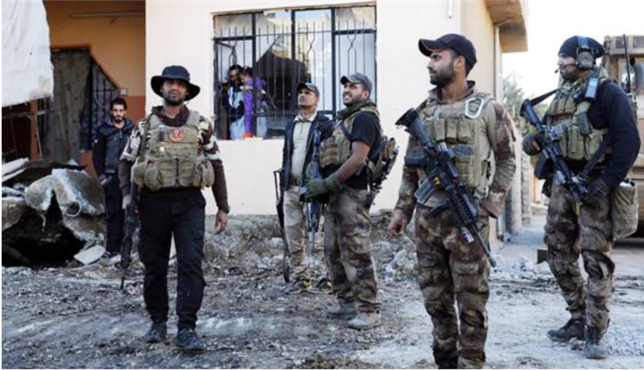
قوات مكافحة الإرهاب داخل أحد أحياء الموصل

بغداد - أسامة نجاح: أعلنت قيادة قوات جهاز مكافحة الإرهاب يوم أمس السبت، عن تحرير أحياء النصرى والجامعة ودور الأمن في الساحل الأيسر لمدينة الموصل، فيما حررت أحياء المصارف والقاهرة والأمن في الساحل الأيسر من المدينة. وقال القائد في جهاز مكافحة الإرهاب الفريق الركن عبد الوهاب السامعي في حديث خاص لصحيفة "الصباح الجديد" ان "القوات الأمنية حررت أحياء النصرى وحى الجامعة ودور الأمن بالكامل من سيطرة عصابات داعش الإرهابية في الموصل". وأضاف ان "قطعاً مكافحة الإرهاب توغلت إلى منتصف حي القاهرة في الساحل الأيسر للمدينة تمهيداً لتطهيره بالكامل". وبين السامعي ان "قطعاً جهاز مكافحة الإرهاب اقتحمت يوم أمس السبت أحياء المصارف والقاهرة والأمن في الساحل الأيسر من مدينة الموصل بعد