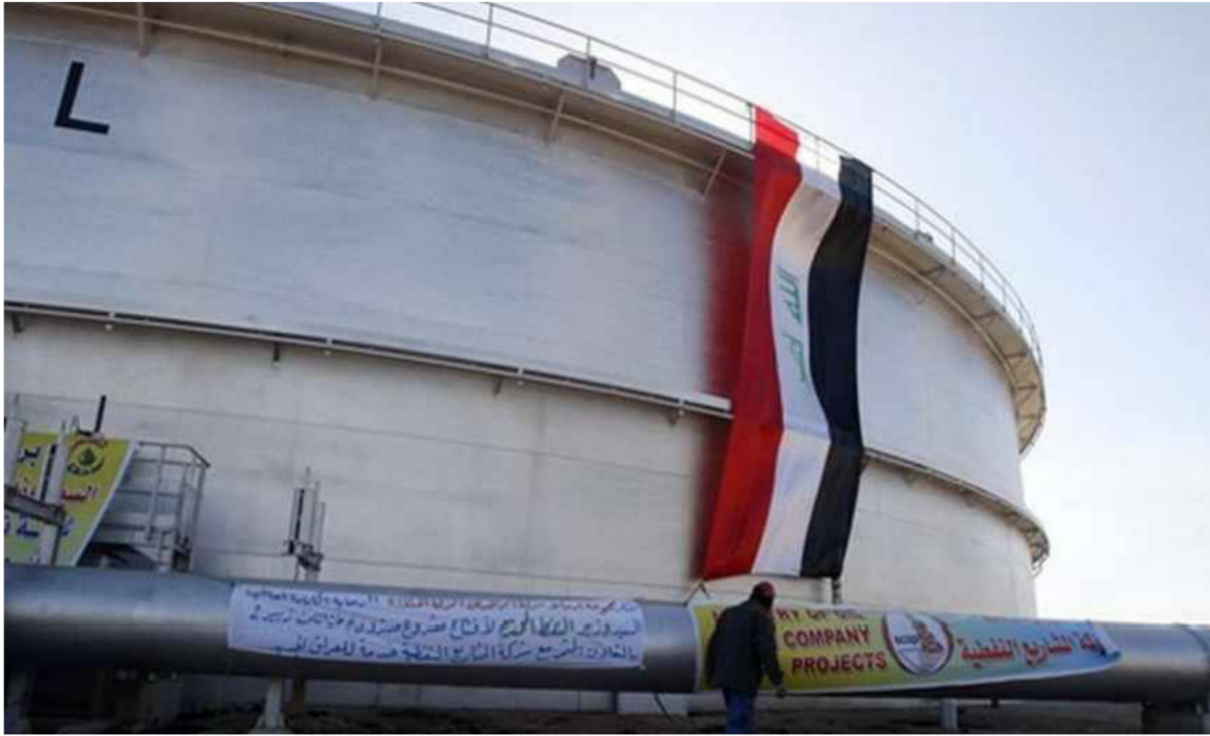
أحد مشاريع إنتاج النفط في العراق

بإلغاء الاجتماع الذي عُقد في وقت سابق لكن جرى إقناعها من قبل أعضاء آخرين بالحضور بهدف عدم إحراج المنظمة. وبالرغم من الجهود الدبلوماسية المكثفة منذ أيلول لإيزال اتفاق أوبك يواجه انتكاسات من دعوة العراق إلى إغفائه من الاتفاق ومن قبل إيران التي ترغب في زيادة الإمدادات لأن إنتاجها تضرر بسبب العقوبات.