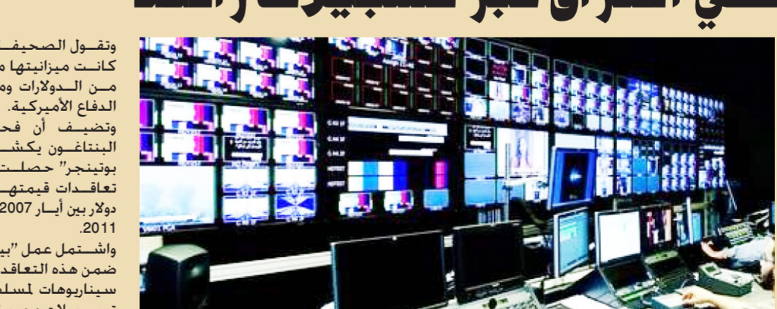
من احد ستوديوهات صناعة المواد الإعلامية "ارشيف"

"بيل بوتينجر" وكان دوره بدء حملة توعية تعرف باسم "العراق".