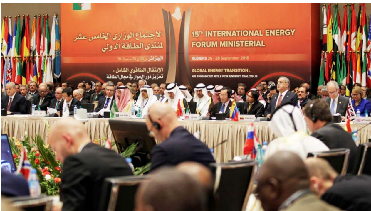
جانب من اجتماع "أوبك" الذي عقد في الجزائر

بنحو رسمي من خلال إقليم كردستان. بيتن أن "اتفاقاً من الممكن أن يحصل خلال الأيام القليلة المقبلة مع حكومة اربيل