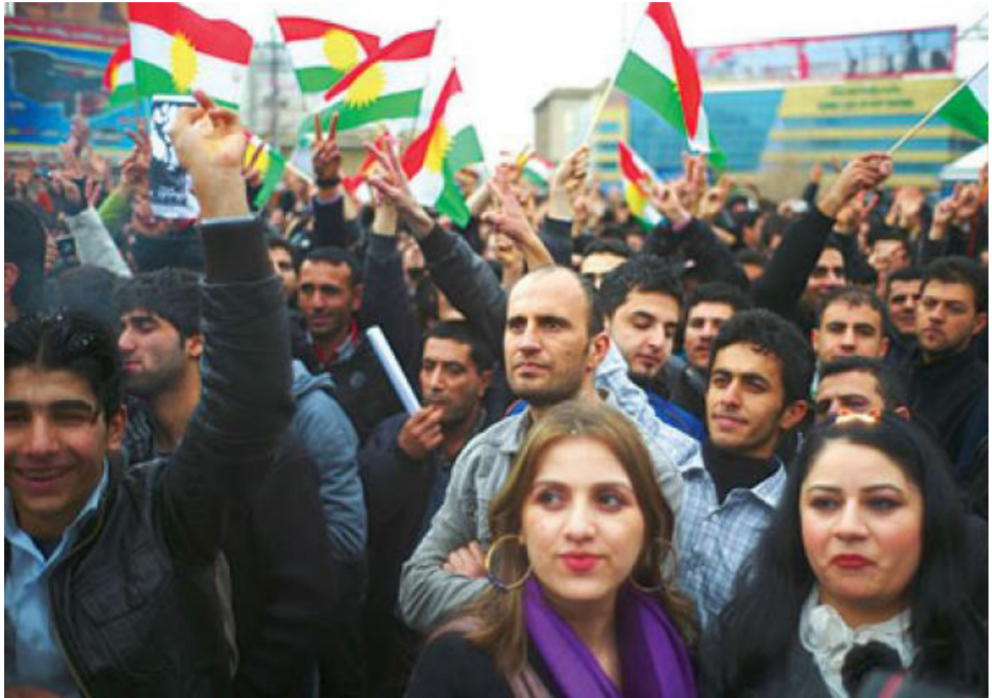
جانب من تظاهرات السليمانية

مقاطعة الدوام الرسمي لن تخل مشكلاتهم التي خلفتها الازمة الاقتصادية التي تواجه الاقليم، وكانت المدارس في محافظتي السليمانية وحلبجة والاقضية والنواحي التابعة لهما قد اغلقت ولم تفتح ابوابها للاعلان عن البدء بالعمل الدراسي الجديد الذي حددت وزارة التربية في الاقليم الاول من اكتوبر الجاري للبدء به، ورفعت احدي المدارس بمحافظة حلبجة لافتحة كتب عليها نعتذر من طلبتنا وابنائنا للاعزاء لعدم قدرتنا على فتح ابواب المدارس امامكم. من جهته دعا نائب رئيس اللجنة الاقتصادية في برلمان كردستان علي حمه صالح الجماهير في اربيل وهوك الى الخروج في