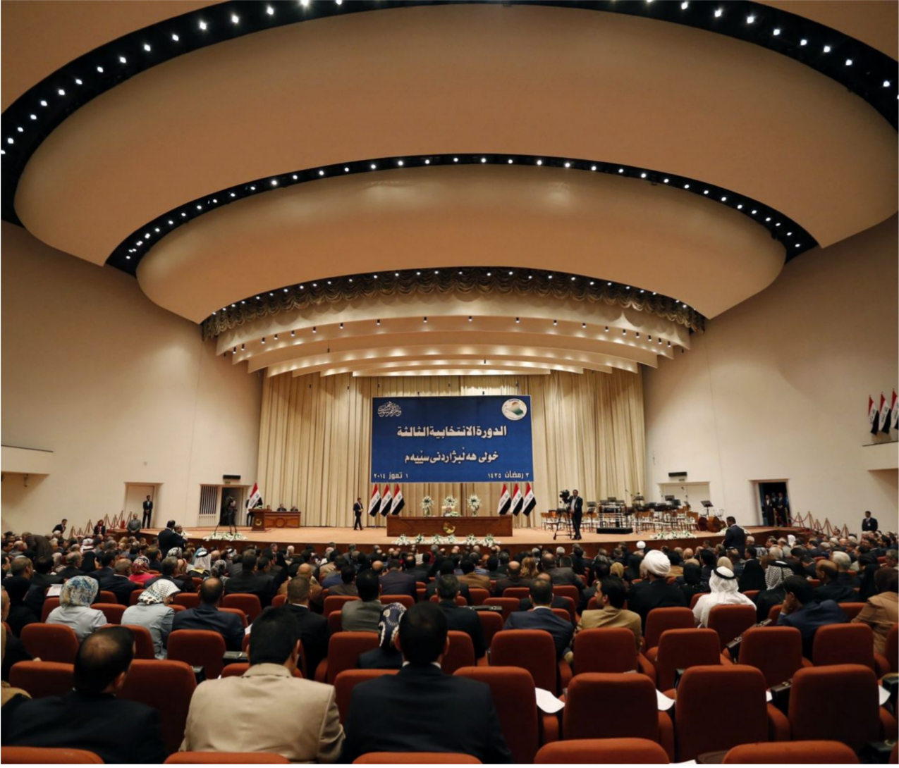
مجلس النواب العراقي