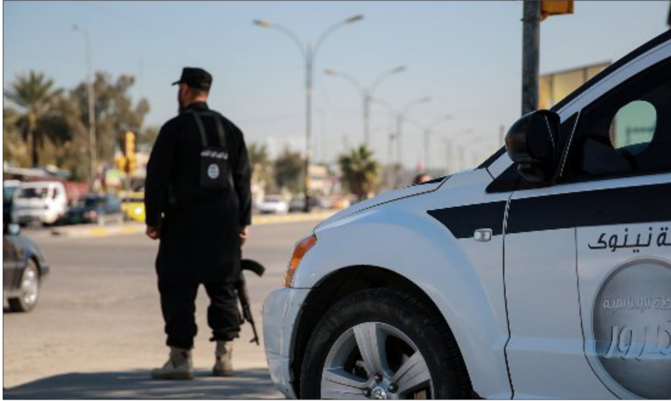
انتشار لشرطة داعش في الموصل