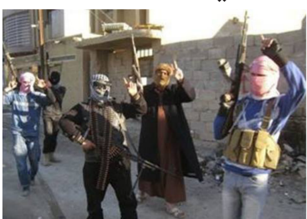
عناصر داعش في الحويجة "ارشيف"

بغداد - الصباح الجديد: أفاد مصدر محلي في كركوك. بأن "داعش" منح نصف راتب لعناصره في قضاء الحويجة جنوب غربي المحافظة. عازياً السبب إلى فقدان التنظيم لأغلب موارده المالية. وقال المصدر في حديث لـ السومرية نيوز إن "تنظيم داعش منح عناصره نصف راتب في قضاء الحويجة جنوب غربي كركوك". وأضاف المصدر الذي طلب عدم الكشف عن اسمه. أن "منح نصف راتب جاء بسبب فقدان تنظيم داعش أغلب موارده المالية". مؤكداً أن "التنظيم أرغم على إلغاء العديد من برامج الدعم المالي لمؤيديه. فضلاً عن تأخر تسديد رواتب عناصره".