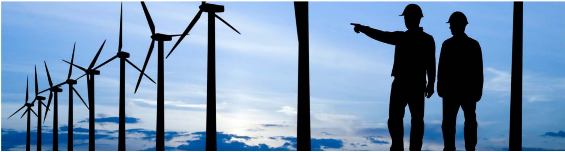
مزارع الطاقة الشمسية والرياح تحتاج إلى مساحات كبيرة من الأراضي

الوقت نفسه الحد من المدخلات المطلوبة من الطاقة، الواقع أن بعض الدول الأكثر كثافة سكانية على مستوى العالم تواجه عائقاً مزدوجاً: فهي غالباً الدول الأكثر عرضة للآثار السلبية المترتبة على تغير المناخ، وبما يكون بناء اقتصادات منخفضة الكربون أكثر صعوبة، وعلى العكس من ذلك فإن الدول الغنية والمزدهمة بالسكان – مثل الولايات المتحدة وأستراليا وتشيلي – تتمتع بمساحة كافية لبناء أنظمة الطاقة المنخفضة الكربون بتكلفة منخفضة للغاية وتأثيرات ضئيلة على المناخ من الأراضي للزراعة أو المناظر الطبيعية الجمالية.