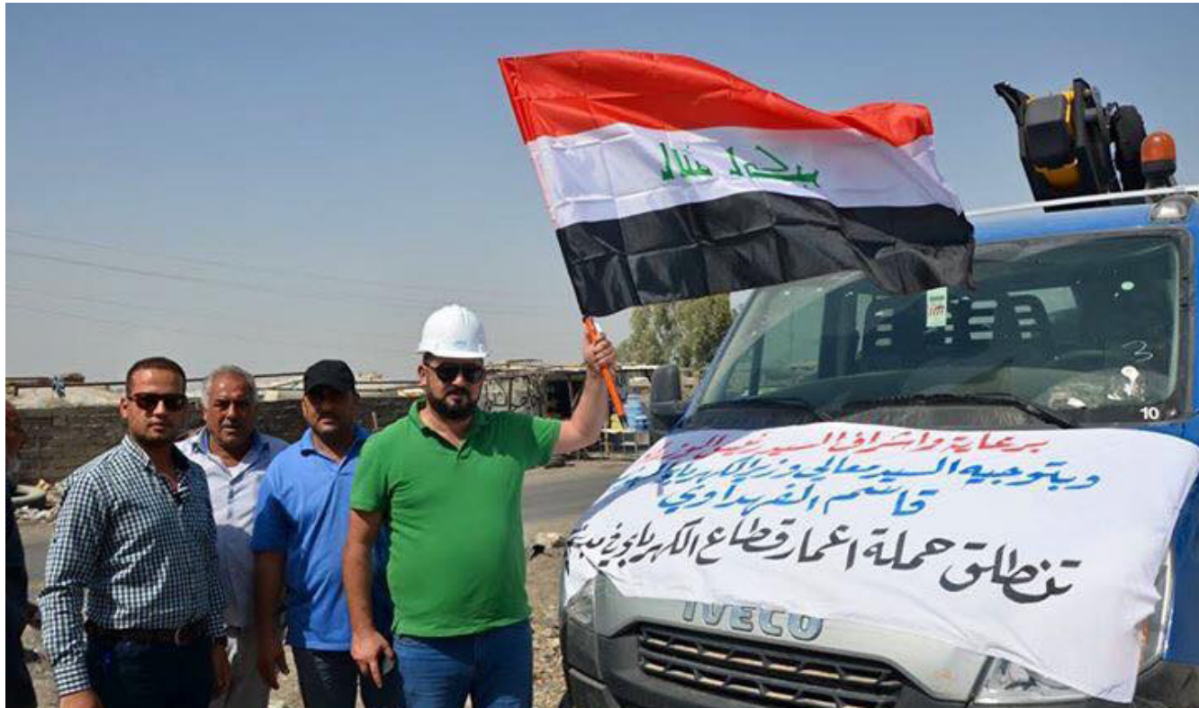
مدير كهرباء الفلوجة بلوح براية العراق للبدء بحملة إعمار شبكات التوزيع

هذا وأستنفرت وزارة الكهرباء و بأشراف مباشر من وزير الكهرباء المهندس قاسم الفهداوي . جميع ملاكاتها الهندسية والفنية والحرفية في دوائر التوزيع التابعة لها ومصادرها كذلك تم خديد وشبكات النقل للضغط العالي المضطربة والعوارض الفنية التي تعرضت لها شبكات التوزيع نتيجة الأعمال العسكرية والتي أدت إلى خروج المغذيات المسؤولة عن تغذية الأحياء السكنية وبالتالي انقطاع التيار الكهربائي عنها . على الرغم من وجود طاقات توليدية فائضة تكفي لسد الحاجة كليا وتحقيق حالة استمرارية التيار الكهربائي للمدينة.