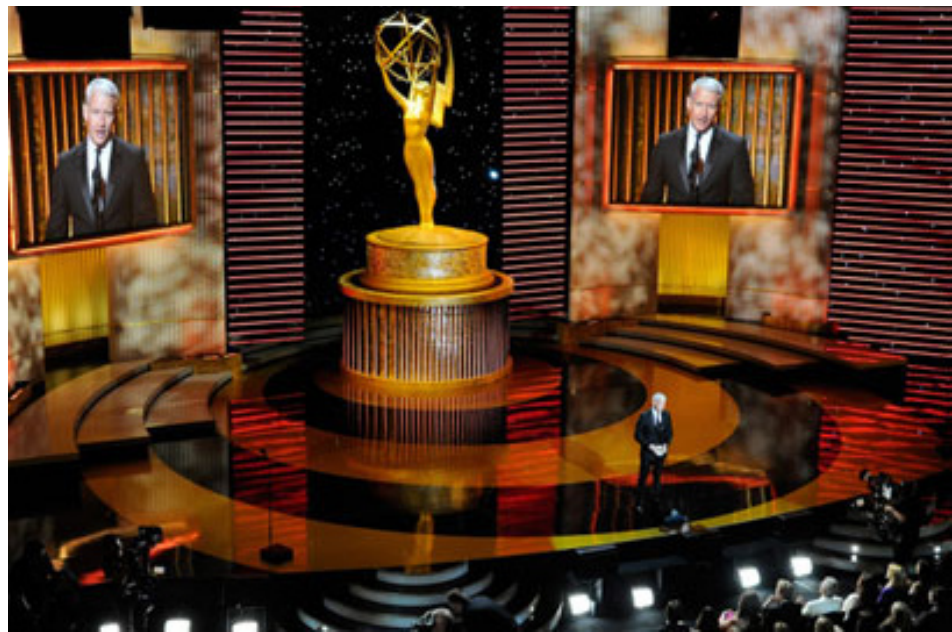
جانب من الحفل

واشنطن - وكالات : كان وسيم (هاينستاغ) "أوسكار وايت" سبباً في تكدير أجواء الاحتفال بتوزيع جوائز الأوسكار الأرفع في عالم السينما على مستوى العالم لكن بعد سنته أشهر فإن الترشيحات لجوائز إيمي التلفزيونية خُكي قصة مختلفة وأكثر تنوعاً. فقد تم ترشيح نحو 21 ممثلاً من شتى الأعراق لجوائز إيمي هذا العام، وللمرة الأولى في تاريخ الجوائز التلفزيونية الأرفع الممتد عبر 68 عاماً يجري ترشيح ممثلين ملونين في كل فئات التمثيل الست الرئيسية.