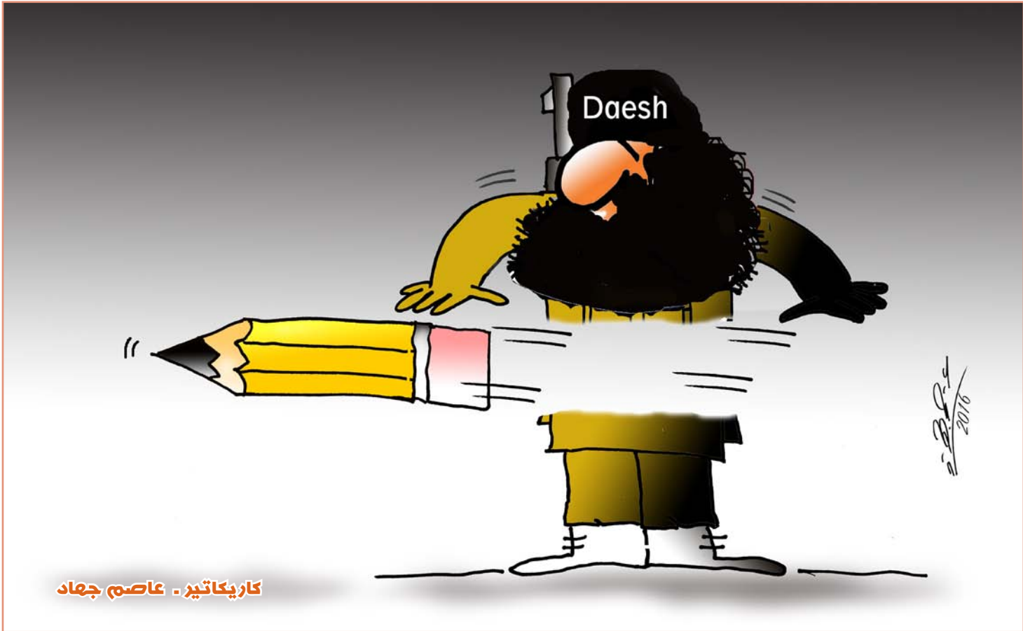
كاريكاتير - عاصم جهاد