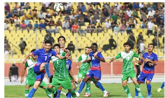
من مباراة الطلبة والشرطة "عدسة: رياض السراج"

ثامر بهدفين لملهما، سجل للكرخ علي سعد، في حين سجل لأربيل فرحان شكور والسوري ثامر الحجاج، وفي ملعب نبط الوسط، تعادل أهل الدار مع ضيوفهم النقط بهدفين لملهما، وكذلك تعادل نبط ميسان في ملعبه أمام نبط الجنوب بهدف لملته.