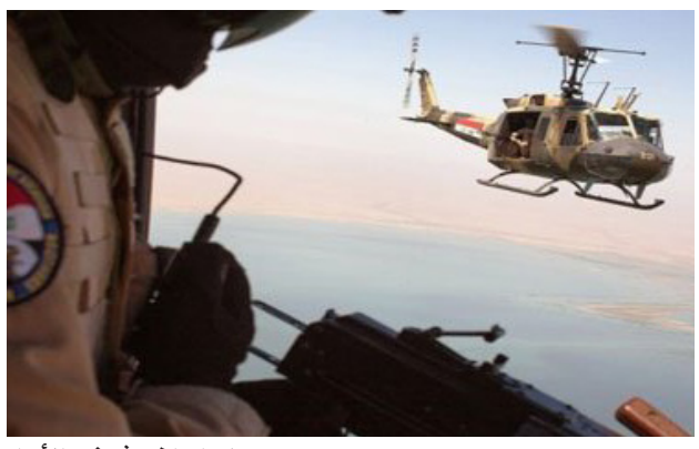
طيران الجيش في الأنبار

بغداد - أسامة نجاح: أعلنت قيادة عمليات الجزيرة والبادية في محافظة الأنبار، يوم أمس السبت عن مقتل خمسة من عناصر تنظيم داعش وتدمير مضافة لهم بقصف جوي لطيران الجيش العراقي استهدف جمعا للتنظيم، غربي الرمادي، فيما ذكر المشد العشائري في الأنبار، بأن القوات الأمنية تكنت من صد هجوم شنه عناصر داعش على جزيرة البيوندياب شمالي الرمادي. قال قائد عمليات الجزيرة اللواء الركن قاسم الحمدي إن "طيران التحالف وجه ضربة جوية استهدفت جمعا لتنظيم داعش في حي البركضن قاطع جزيرة هيت غرب الرمادي ما أسفر عن مقتل خمسة من عناصر