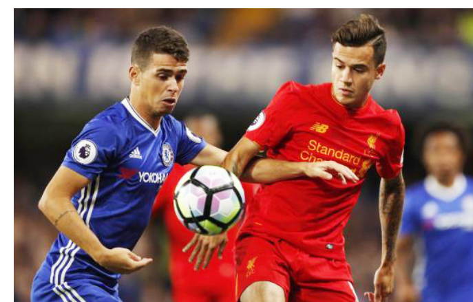
صراع على الكرة في مباراة ليفربول وتشيلسي

كونتي، مدرب تشيلسي الإنجليزي، إنه لا يشعر بالخطر بالرغم من الخسارة التي تلقاها أمام ليفربول بهدفين، لكننا لعنا جيداً واستحققتنا الفوز بالنقاط الثلاث». وحول هدفه المتع، قال: «فقط حاولت أن أفسد الكرة بطريقة جيدة وأضعها في الزاوية التي ذهبت إليها من الجيد تسجيل مثل هذا الهدف ولكن في النهاية الأهم هو الفوز». من جانبه، قال الإيطالي أنطونيو