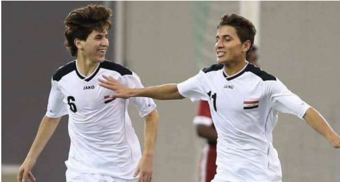
فرحة لاعبي الناشئة بالفوز