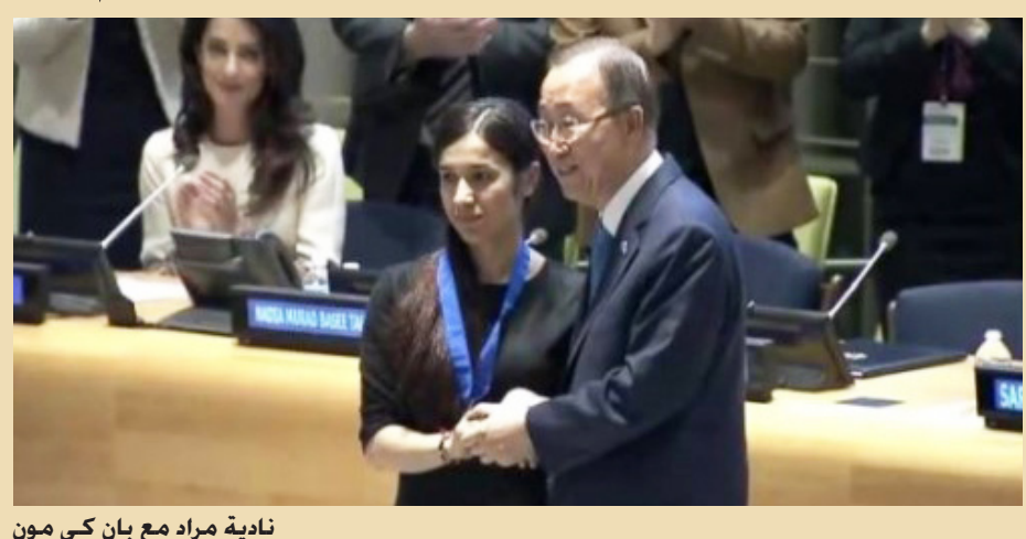
نادية مراد مع بان كي مون

بلدة سنجان العراقية في أغسطس 2014 واقتادوها إلى معقلهم بالموصل، حيث