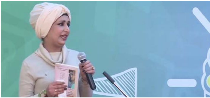
الشاعرة الراحلة وجدان النقيب

السّعي جانب عدوها وبهملها اربع سنين كي تمارس بها كل احلامها فلا تشعر بالموت الروحي قبل موتها جسديا بدأت رحلتها الجادة مع الحياة والموت واتخذت القرار بان تترك ارضاً لها يبيضها حبة بعيون القراء والاهل. بدأت بكتابة مجموعة قصائد شعبية وقررت ان جمعها بديوان منذ عام 2015. وكان ديوانها "حجل واحلام الطفولة" وهو مجموعة شعرية كثرية في السنة الشعر الشعبي. اكملتها في يوم 2016/1/1 فكان هذا العام عام الخلود وعام الموت بالنسبة اليها. وقد صنفها الجمهور من خلال موقع التواصل الاجتماعي الفيس بوك على انها الشاعرة والقاتلة الحارسة. عاشت وجدان النقيب وهي من مواليد 1991 وسط عائلة مثقفة فوالدها واخوها كاتبان معروفان بالوسط الثقافي. خططت لديوانها لكنها لنتم تضع خططا ما بعد الديوان لكنها تشجعت اكثر على الاستمرار من خلال الظهور الاعلامي والمهرجانات بعد ما لمستته من اعجاب وحب من قبل الجمهور لما كتبه في الديوان.