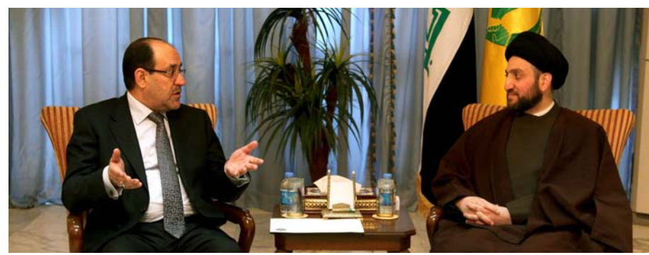
لقاء سابق جمع بين المالكي والحكيم