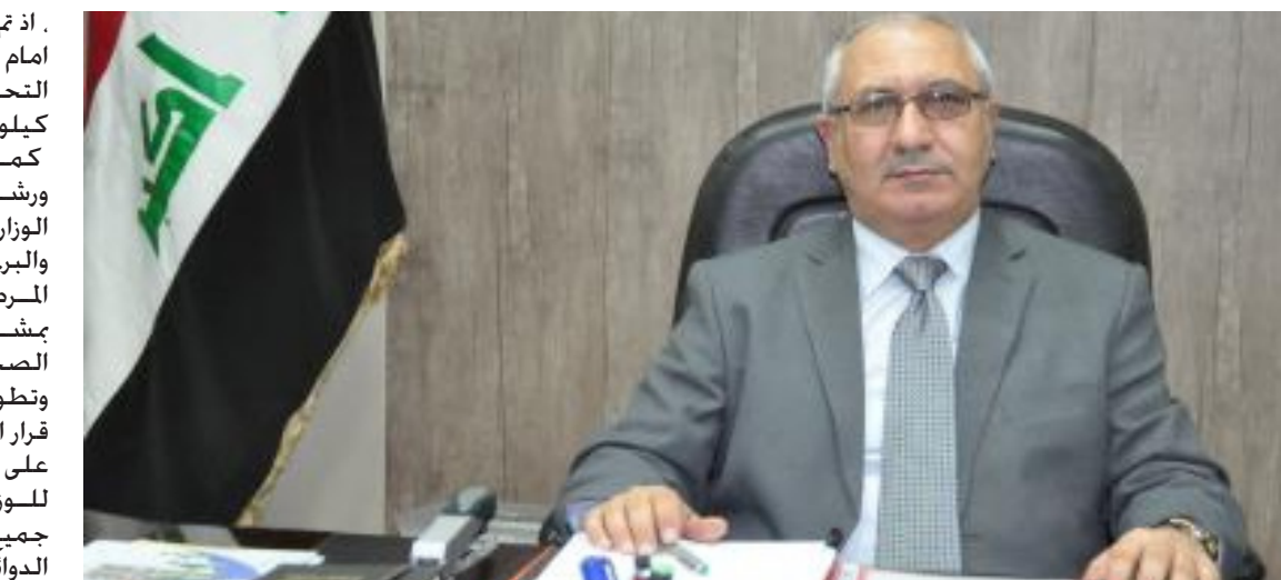
مستشار وزارة الزراعة لنشاط الثروة الحيوانية