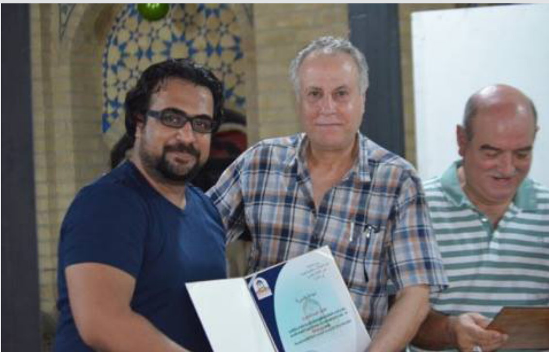
جانب من الاحتفالية