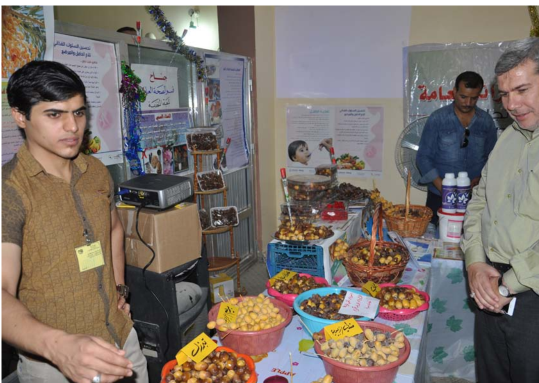
من أجواء المعرض

وأكد عطوي أن المعرض يمثل محطة إرشادية لأصحاب البساتين فضلاً عن تناول المشاكل والمعوقات التي تواجه أصحاب البساتين وبالتالي يمكن أن يتم إعداد ورقة عمل تقدم إلى مديرية الزراعة بهدف تذليل العقبات وحل المشاكل التي تواجه