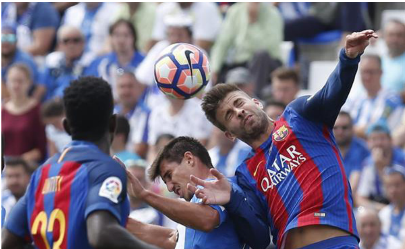
جانب من لقاء برشلونة وليجانيس

بحبونه". بينما قال مانيل أرويو نائب رئيس نادي برشلونة المسؤول عن شؤون التسويق والاتصالات: «نحن نؤمن كبرشلونة.. الدقة شيء مهم وأساسي في حضنا النووي وتعزيز المهارات الخاصة يمكننا من البقاء على رأس أكثر الأندية المنتصرة في العالم».