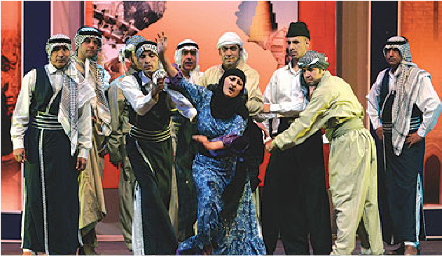
الفرقة القومية للفنون الشعبية