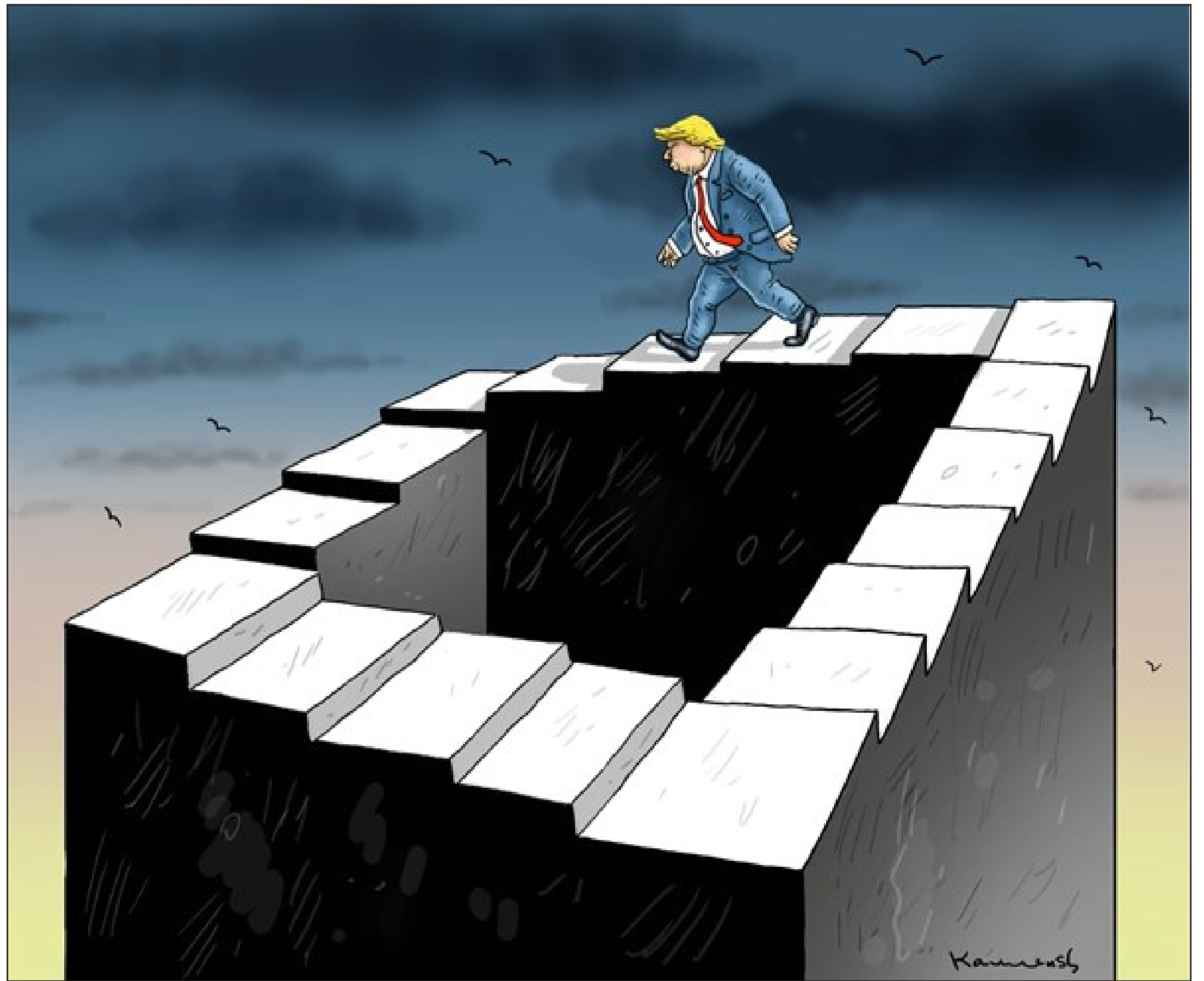
عن موقع «كارتون سياسي»