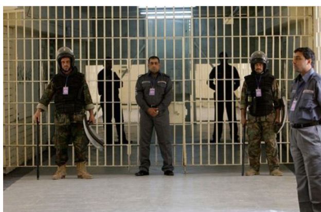
أحد السجناء في العراق

حكم عليهم باوصفهم رجال النظام السابق من المحكمة الجنائية العليا أما بقية الجرائم فجميعها مشمولة بالعفو لا بل