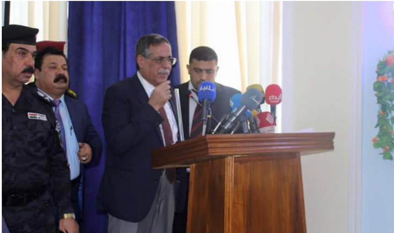
وزير الكهرباء يعقد مؤتمراً صحفياً في مدينة الرمادي