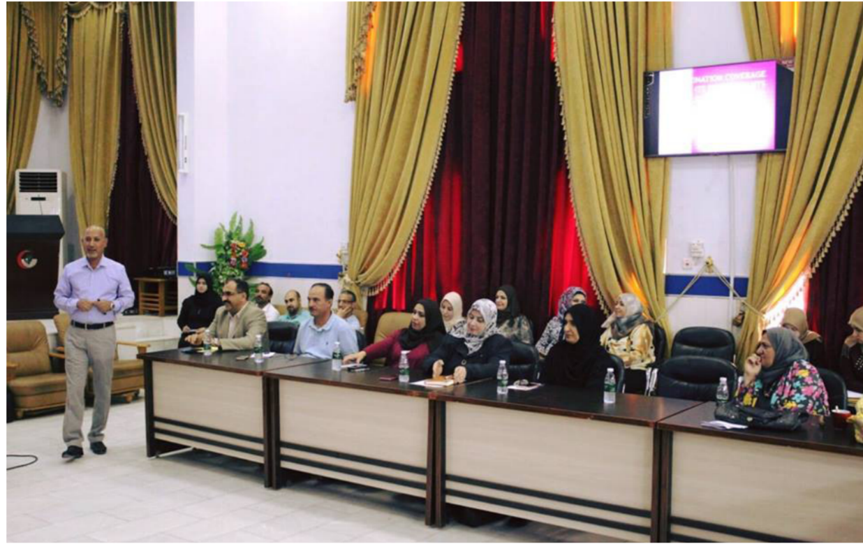
جانب من اجتماع مدير عام صحة البصرة مع مدراء القطاعات والشعب الصحية