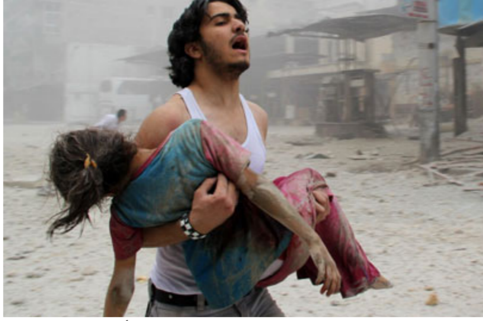
النزاعات الأخيرة دمرت البنى التحتية الأساسية في عدد من الدول

الصحة تدهورت بنحو اضافي وقال مقعدا في بيان ان «الربيع العربي تحول الى حروب ولبنان وافغانستان والعراق والصومال أيضاً. ومنذ ذلك الحين ليس فقط في سوريا وإنما في ليبيا واليمن وارتفاع بالكثر من 9% سنوياً بين عامي 2010 و 2013. وحذر الباحثون ان الظروف