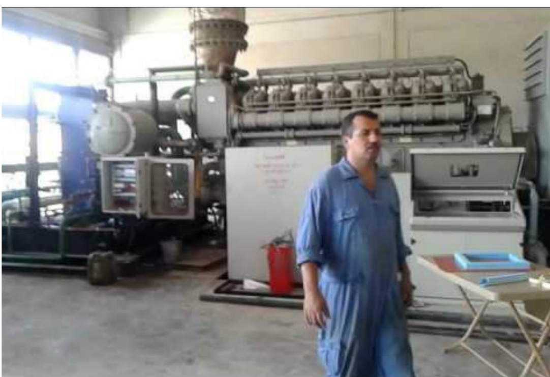
الشركة العامة للصناعات الفولاذية

وبين الشمري بأن الشركة قامت بالإشراف على تدريب طلبة كليات الهندسة في جامعات بغداد والمستنصرية والجامعة التكنولوجية والجامعة العراقية والكلية التقنية وكليات دجلة والسلام الجامعة والنسور والمأمون ومعهد اعداد المدرسين وطلبة اعدادية الصناعة. وأشار مدير المركز الى ان التدريب تضمن محاضرات في مجال الهندسة والتقنيات القاها مهندسون في الشركة تشمل دروس وقواعد تخص العمل في الورش والمصانع الى جانب اجراء تدريبات عملية داخل المصانع على يد مدربين كل حسب اختصاصه اجل رفع مستوى العاملين والولوج ومطالبات لافقا الى تدريب (23) طالبا في مجال ادارة الاعمال والمحاسبة من خلال القاء محاضرات نظرية متخصصة عن العمل الاداري المتبع في دوائر الشركة. مؤكدا على ان هناك الكثير من الطلبة منخرطون بالتدريب في جميع مصانع ودوائر