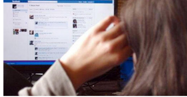
نفسيون يعملون على تقييم شخصيات المشتركين الحقيقية.

وهي على فيسبوك والتواصل مع الآخرين من خلاله وما لهذا السلوك من آثار على الأصدقاء وبيعهم الوهم بعلاقة مزورة، فإن الخبراء يؤكدون على أن الأشخاص الذين يحتفظون بشخصية وهمية على فيسبوك غير سويين عقلياً ونفسياً. وحسب دراسة أجرتها جامعة ولاية تسمانيا في أستراليا، والتي تتألف من 146 مشاركاً، منهم مستخدمون لهم حسابات حقيقية وآخرون لهم صفحات وهمية، وكان ضمن الفريق خبراء