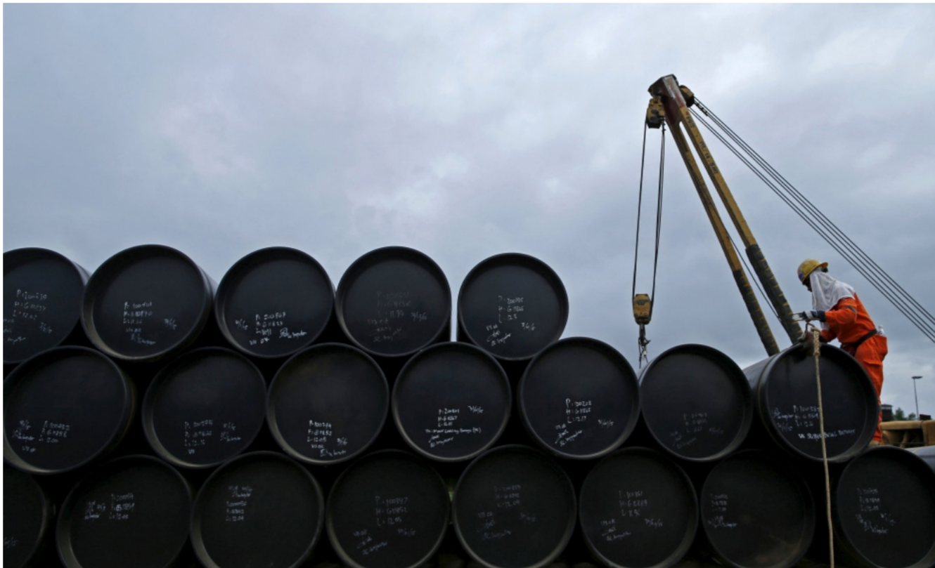
أنتجت السعودية 10.67 مليون برميل يوميا في تموز وهو أعلى مستوى في تاريخها

وفي أبريل نيسان انهارت محاولة سابقة لتجميد الإنتاج عن مستويات يناير كانون الثاني بعد استعداد للمشارك لكن الكثير من المحللين فسروا هذا بأن طهران تقول ذلك إيران إلى المبادرة، ومنذ تعيين الفالح في أبريل نيسان اتخذت السعودية لوجه أكثر لينا جاء إيران داخل أوليك. وقال الفالح دون أن يذكر تفاصيل «إذا ظهر توافق من الآن وحتى