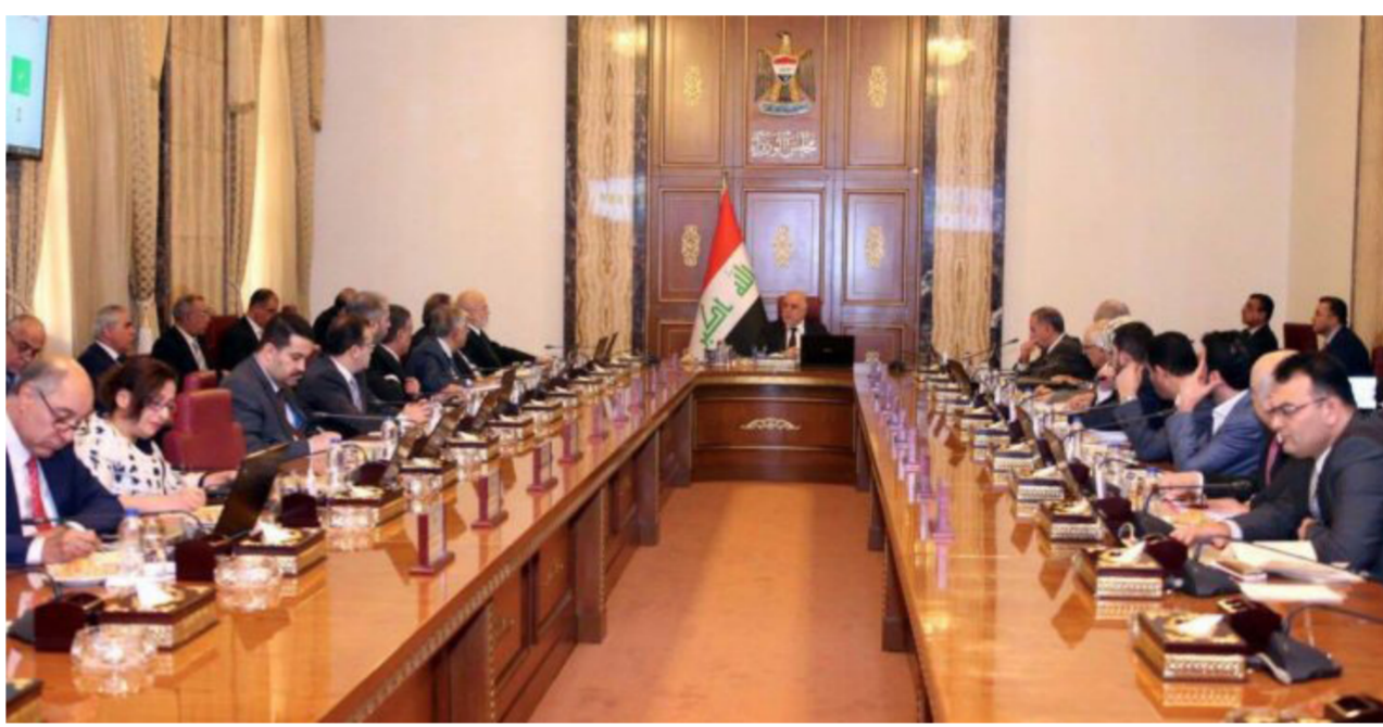
مجلس الوزراء (ارشيف)

وذهب إلى أن "ذلك يحصل بإعطاء التعيينات على الاساس النوعي". ولفت إلى أن "الخطة الموضوعية من قبل الحكومة تتلخص باستيعاب الدرجات الفنية ذات