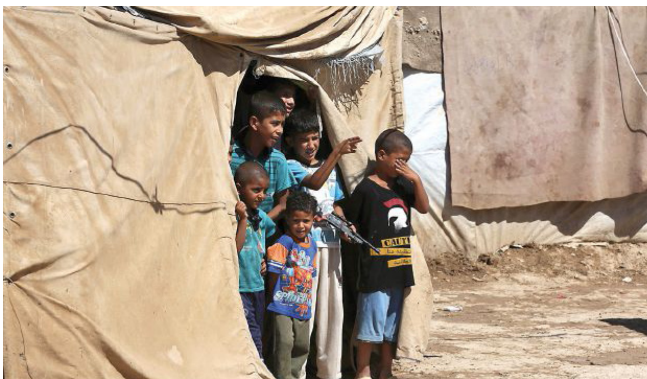
جانب من مخيم للنازحين

الصعيد الآسيوي". وعلى مستوى الدول العربية، اجاب المستشار الحكومي أن