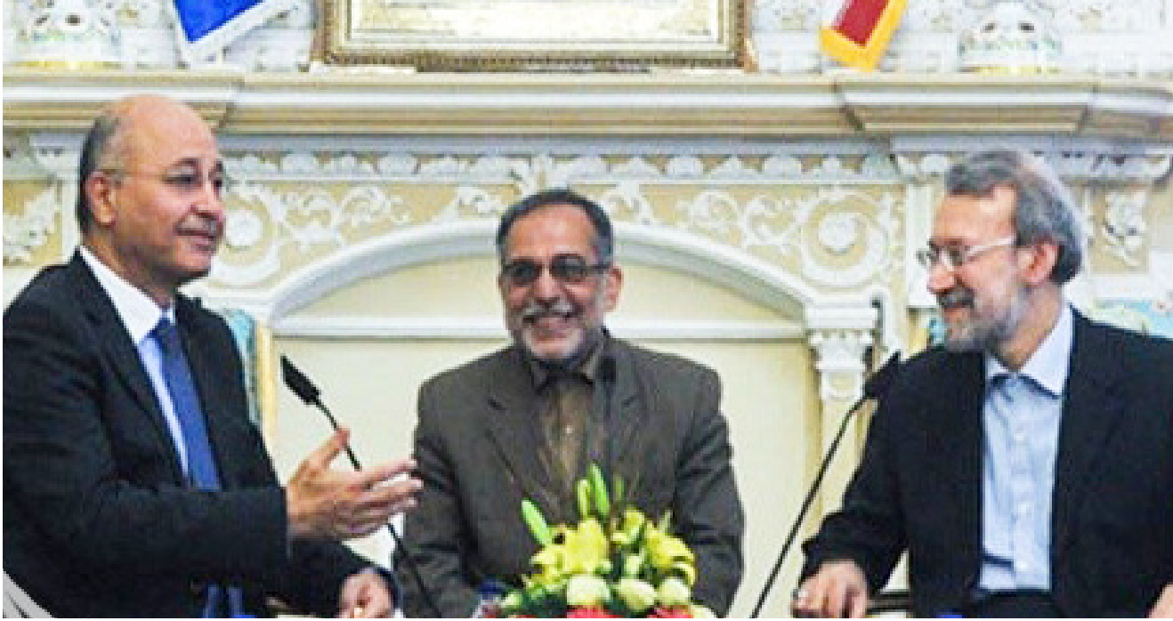
جانب من زيارة صالح إلى إيران

ضرورة ملحة للحفاظ على مصالح العراق والمنطقة والعمل المشترك للتصدي للتهديدات التي يفرضها الإرهاب والجماعات المنطرفة على المنطقة ككل. بدوره قال صالح في الوقت الذي يتجه داعش نحو الهزلة والانكسار على جميع جبهات القتال فإنه على جميع مكونات العراق فتح حوار بناء لاحواء وانهاء الأزمات والتهينة لمعالجات جذرية لمشكلات العراق على أساس التوازن واحترام حقوق المكونات والتعاون الحقيقي لافتعال الارهاب وجذوره.