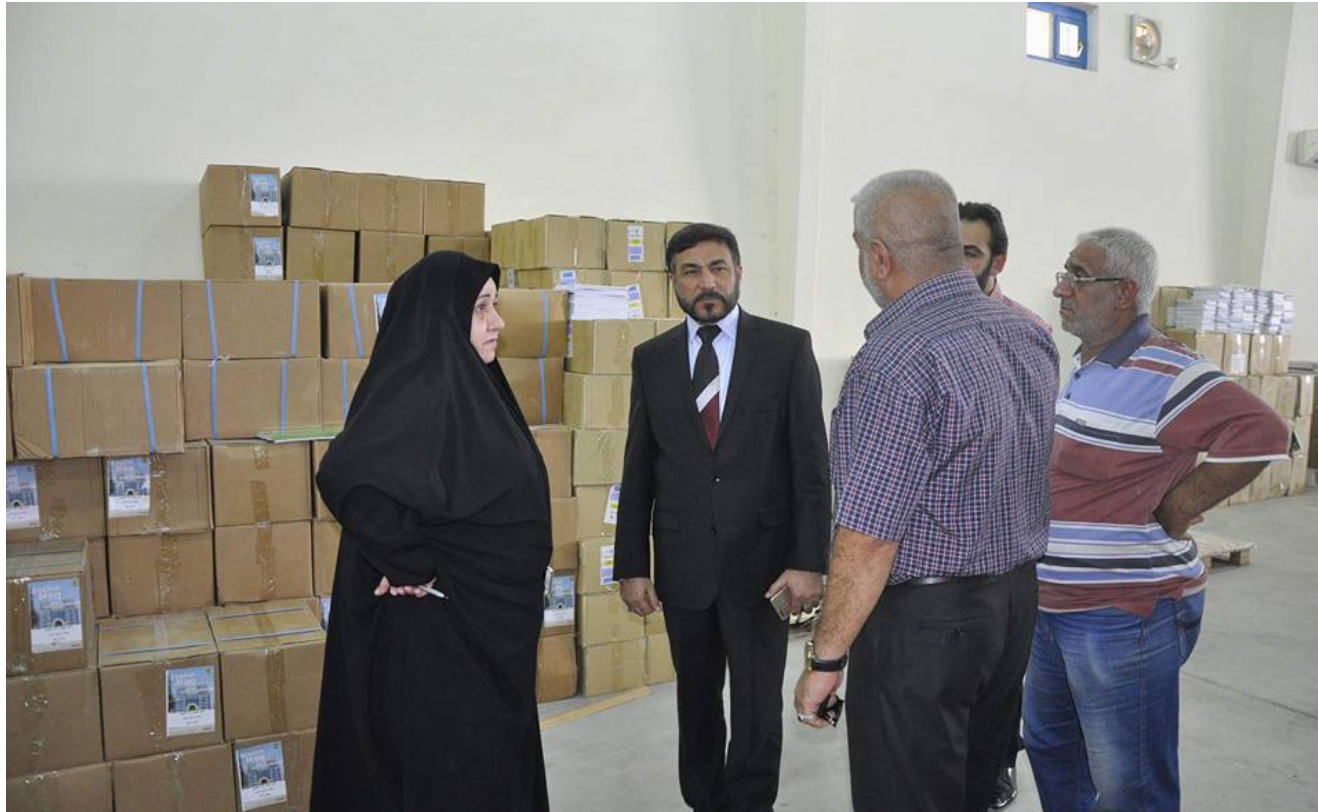
مدير عام تربية البصرة خلال إشرافه على توزيع الكتب والقرطاسية في مخازن المديرية