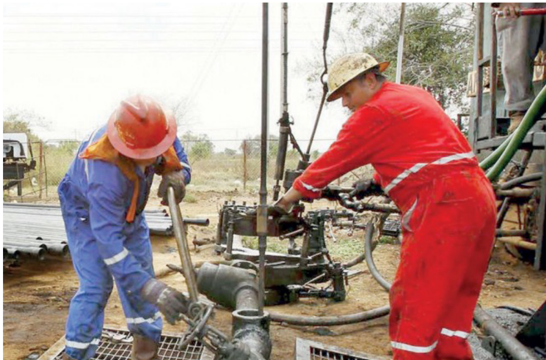
تعاني فنزويلا من أزمة اقتصادية وتعتمد بقوة على إيرادات صادرات النفط