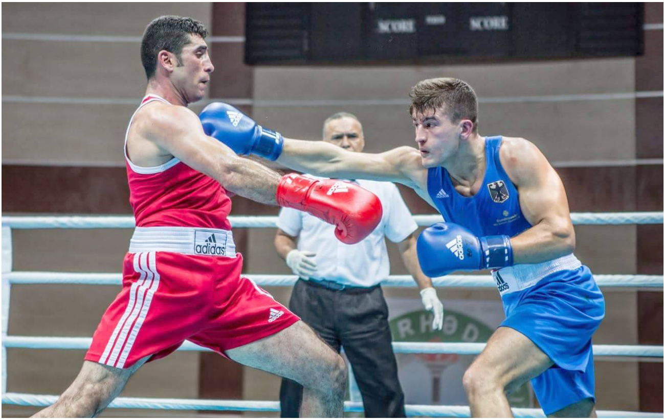
وحيد يخفق في نزالات الملاكمة

نقطة واحدة فصلت بين نجم الملاكمة العراقي وحيد عبد الرضا ومنافسه المكسيكي روبريغز مسابيل في وزن 75 كغم بفعلات الملاكمة لأولمبياد ريو دي جانيرو فقد أبعدت تلك النقطة عبد الرضا عن المنافسة برصيد 29 نقطة مقابل 28 للاعبين. فقد خاض البطل العراقي نزاله بضرارة أمام مسابيل البالغ من العمر 22 عاما لتمضي الجولة الأولى بتعادلهما بتسعة نقاط لكل منهما ثم تأتي اللحظة الفاصلة في الجولة الثانية التي نال فيها المكسيكي نقطة الترجيح بعشر نقاط مقابل تسعة لاعبنا الذي حاول ان يعود الى المنافسة في الجولة الثالثة والأخيرة غير ان تلك الجولة انتهت بالتعادل بعشر نقاط لكل طرف. وأثناء جازائر السهلاني المدير التنفيذي للجنة الأولمبية بقطاعه وجهه وشجاعة الملاكم العراقي الذي قدم عرضا كبيرا خذلته فيه نقطة واحدة أمام منافس شرس وعنيد قائلا: على مستوى الأبطال والرمحوات كنا نتمنى ان يواصل المنافسة الأولمبية لانه يستحق فعليا ان يكون حاضرا في الأدوار المتقدمة لمنافسات وزنه غير ان لحظة من الزمن عاندت مسعاه وربغياته في التمسوق على الملاكم المكسيكي القوي جدا . وأصاف السهلاني: لقد كان حضور عبد الرضا مشرفا ورائعا وخسر بعد جهد بطولي لم يستسلم فيه أبدا وغادر برأس مرفوعة منافسات وزنه التي بذل فيه كل مساعيه وقدراته لكن نقطة واحدة خذلته وذلك هو حال المنافسة الرياضية التي قد يخسر فيها أي طرف ونحن نقدر