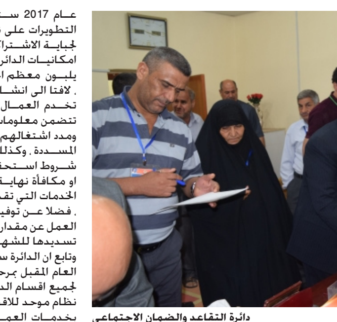
دائرة التقاعد والضمان الاجتماعي

عام 2017 ستنضم استكمال التطويرات على نتائج النظام الجديد لجباية الاشتراكات بالاعتماد على امكانيات الدائرة من الموظفين الذين يليون معظم احتياجات المراجعين . لافتا الى انشاء صفحة الكترونية تخدم العمال واصحاب العمل تتضمن معلومات العمال المضمونين ومد اشتغالهم ومقدار الاشتراكات المسددة . وكذلك توفر هذه النافذة شروط استحقاق الراتب التقاعدي او مكافأة نهاية الخدمة وغيرها من الخدمات التي تقدمها الدائرة للعمال . فضلا عن توفير معلومات لصاحب العمل عن مقدار الاشتراكات الواجب تسديدها للشهر المقبل . وتابع ان الدائرة ستباشر في منتصف العام المقبل بمرحلة الربط التكاملي لجميع اقسام الدائرة من خلال تطوير نظام موحد للاقسام كافة المهتمة بخدمات العمال ومستحقاتهم الخاص وأختلط والتعاوني.