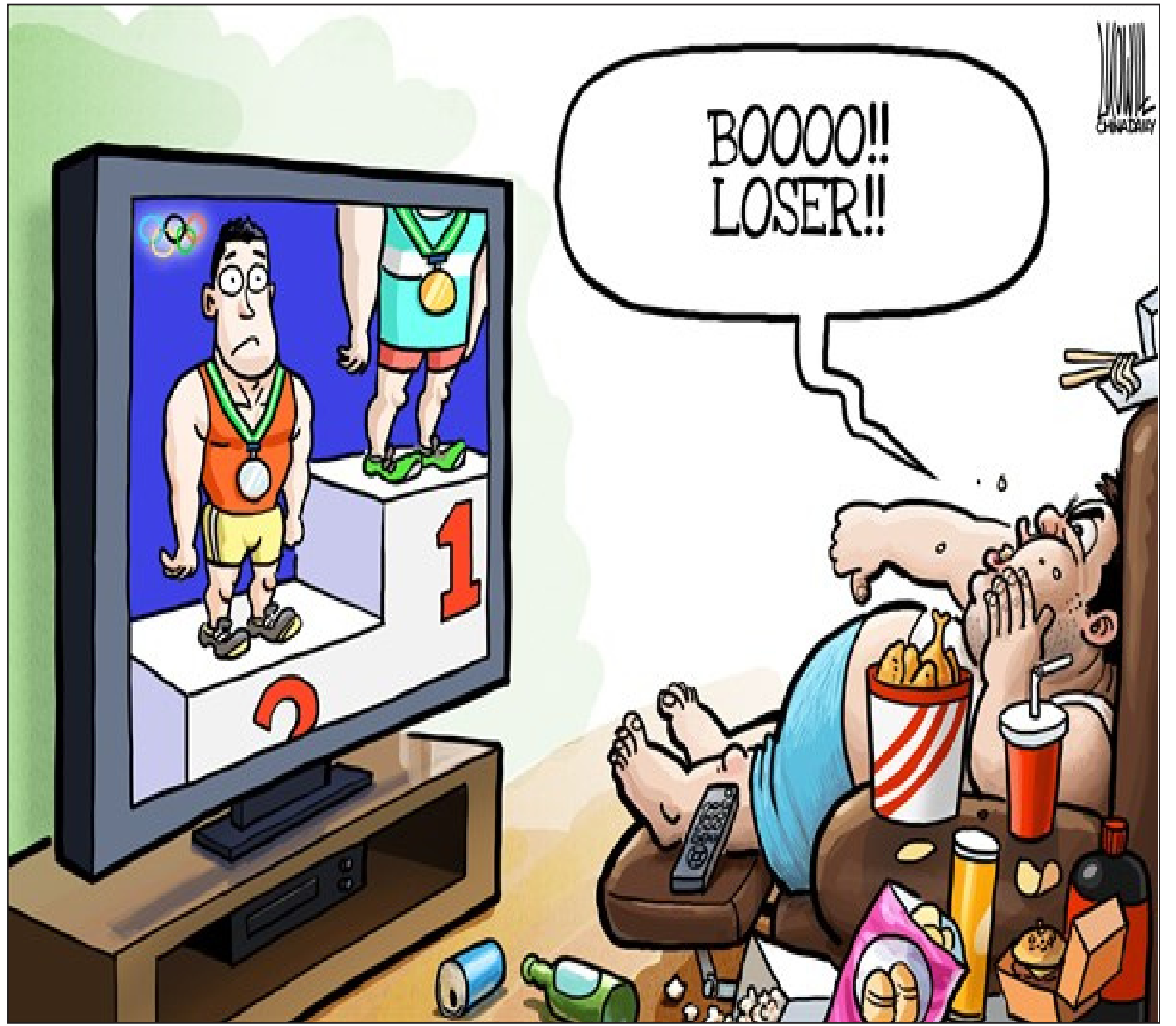
عن موقع «كارتون سياسي»