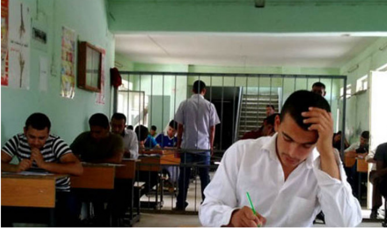
على التربية وضع التدابير اللازمة لمنع ظاهرة الغش الإلكتروني في الامتحانات

قبل مديريّات الوزارة. لافتة إلى أهمية الأخذ بنظر الاعتبار عدم المغالاة والمبالغة في رفع مقدار تلك الرسوم والأجور، مراعاة لشريحة الطلاب الذين يقومون بدفع تلك الرسوم والأجور. وطالب التقرير الوزارة بممارسة الرقابة المشددة على المراقبين في القاعات الامتحانية، واختيار العناصر الكفوءة والنزيهة لأداء العمل الرقابي، وتشديد العقوبات والتدابير الرادعة بحق المراقبين الذين ثبت قيامهم بالتعمد أو التساهل في ظاهرة الغش، واستحداث منبئات لمكتب المفتش العام في كل مديرية عامّة ورفدها بالملاكات الكفوءة. وحذر التقرير من تسلم طلبات التعيينات باليد من قبل بعض مديريّات التربية، موضحاً أن الدرجات الوظيفية التعويضية (حركة الملاك) فقط. مؤكداً أن الإعلان عن تلك الدرجات وتقديم طلبات التعيين إلى المديرية يكون عن طريق تسليم بايا الطلاب باليد من قبل جهات معينة في المديرية، لافتاً إلى أن هذه الطريقة تفتح باباً للفساد والمحسوبية. مطالباً بحصر تقديم طلبات التعيين في مقر وزارة التربية وعبر طريق البريد الإلكتروني حصراً.