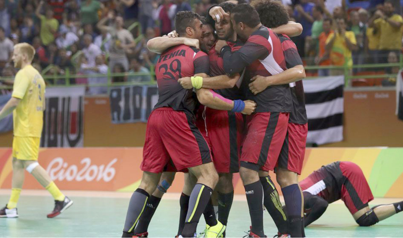
فرحة لاعبو المنتخب المصري لكرة اليد

وتمكن مورفي (21 عامًا) من قطع السباح بزمن قدره 51.97. محطماً الرقم القياسي الأولمبي السابق وتاركا الفضية للصينية جيايو تشو 52.31 والبرونزية للألماني ديفيد بلومر 52.40. وملك الأمريكي أرون بيرسون الرقم العالمي (51.94 ثانية) الذي حققه في تموز 2009 في إنديانابوليس.