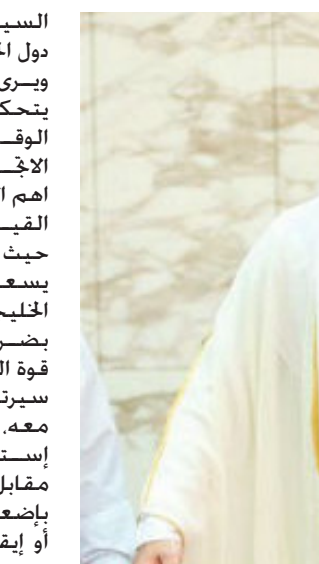
ملك السعودية وأمير قطر

السياسي الذي يمتلكه بالمقارنة مع دول الخليج الأخرى». ويرى ري دان الإجهه السلفي الذي يتحكم بأبعاد القيادة الخليجية في الوقت الحالي ليس الخالي من أهمية وفاعلية الاجهه الاخواني واللذان يعدان من اهم الاجهه اللذان يتحكمان بأبعاد القيادة الخليجية في الوقت الحالي حيث نرى ان المجتمع الخليجي برمنه يسعى الى فرض هيمنته داخل المجتمع الخليجي برغم السياسات المعلنة بصضرورة محاربه. إذ يلاحظ مقابله قوة السعودية من خلاله. فالسعودية سيرتبه مستقبل تأثيرها الاقليمي معه. فالضعف على الأتحاف بضرورة استمرار التحالف مع السلفية مقابل الدعوات داخل الولايات المتحدة بإضعاف نفوذهم داخل المملكة أو إيقاف الدعم المقدم لقادتها. ويستهدف هذا الإجهه تبعية دول الخليج غير أن نفوذها الحقيقي داخل المنطقة يتحقق من خلال استمرار خالفها مع آل سعود. الامر الذي يؤدي الى استمرار هيمنة السعودية على الوضع الخليجي والتأثير على جميع الأطراف بحكم نفوذها ومرزنتها السياسية. علاوة على النفوذ السلفي داخل الخليج الذي سيشكل ضغطاً على مؤسسات صنع القرار ويقترب هذا الاحتمال كذلك بنجاح