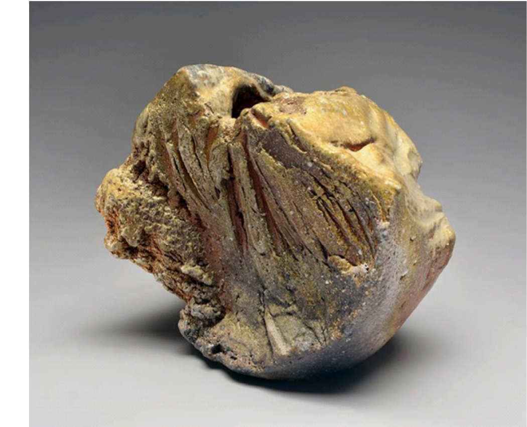
من أعماله الفنية

طاقة ديناميكية جّاه عملية الخلق من مادة الطين . ويعتبر بيتر فالكوس المولود في -1924 2002 من جماعة التعبيريين التجريديين. عمله فيه طاقة خلّاقة مثير. مشحون بطاقة من العاطفة العميقة والقوة والحركة أيضا عملة على تفكيك الأجزاء وإعادة صياغتها مرة ثانية. انه ثوري ب طريقة مذهلة تسمى « الكتل» فأعجب بيتر كالاس به حتى فارق الحياة بعد صراع مع مرض سرطان كان يمارس عمله حتى لفراته الأخيرة لم يعرف التوقف كان النحت في الطين كل شيء في حياته فالكوس الفنان التعبيري التجريدي بالنسبة له الملهم الكبير. ويقول «كلنا وقفنا على أكتاف بيتر فاكوس» عمل ثورة في السيراميك في منتصف الخمسينات