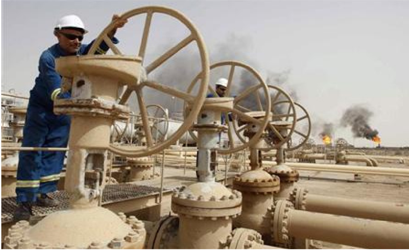
أحد الحقول النفطية في البلاد

وقال نوفاك للصحفيين «إذا أنارت دول أخرى قضية التثبيت فإننا مستعدون لمناقشة هذا الأمر. لكن موقف روسيا هو أن المتطلبات السابقة لهذا التثبيت لم تتحقق بعد أخذاً في الاعتبار أن الأسعار ما زالت عند مستويات تقترب من الطبيعية.» وأضاف نوفاك الذي تنصدر بلاده قائمة أكبر منتج الخام في العالم أن محادثات تثبيت الإنتاج قد تجري إذا هبطت الأسعار.