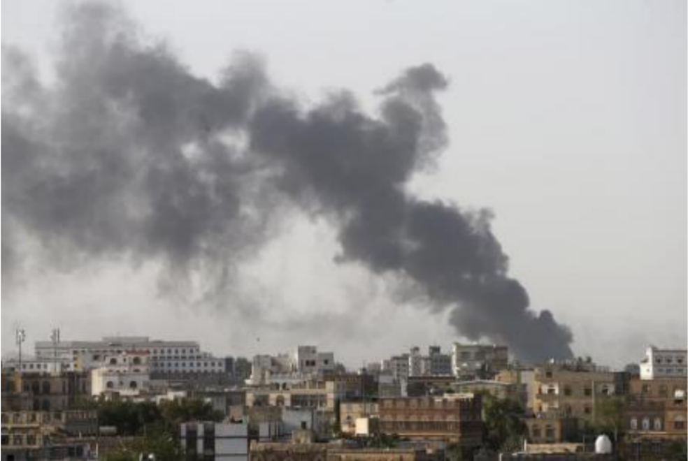
دخان يتصاعد من موقع ضربة جوية للتحالف العربي في اليمن

ولفت المستشار الخاص إلى أن السعودية لا تسمح لمنظمة الأمم المتحدة بالقيام بواجباتها جّاه الحقوق الأساسية للشعب اليمني و«يطبيعة الحال لتنزيم أميركا الصمت وتوابك السعودية بهذا الصدد».