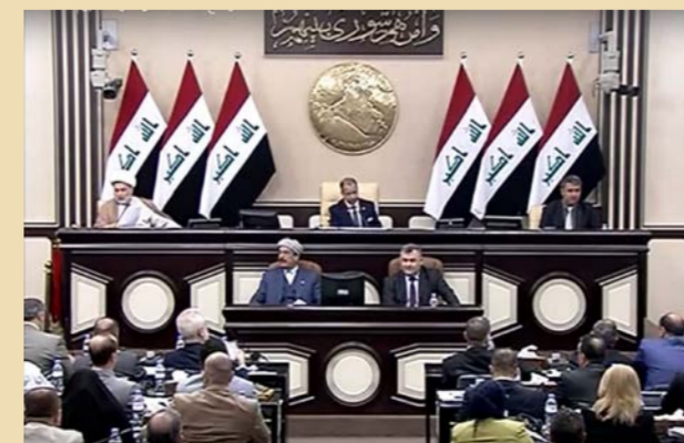
مجلس النواب صوت مؤرخاً على قانون العطل الرسمية

يوم عيد العمال العالمي، 14 تموز/ يوليو يوم الغاء النظام الملكي وإعلان الجمهورية العراقية عام 1958، و3 تشرين الأول/أكتوبر يوم العيد الوطني. وتضاف هذه العطل الرسمية إلى أيام الجمعة والسبت من كل أسبوع التي تعد أكثر من 100 يوم عطلة سنوياً، وإضافة إلى أيام العطل آنفة الذكر، فإن هناك أيام الأعياد (عيد الفطر وعيد الأضحى) وبعض المناسبات الدينية التي تخفى بها الأعياد العراقية، فبعض تلك المناسبات يكون عطلة رسمية، أو عطلة في بعض المناطق التي تشهد مراسيم المناسبات الدينية.