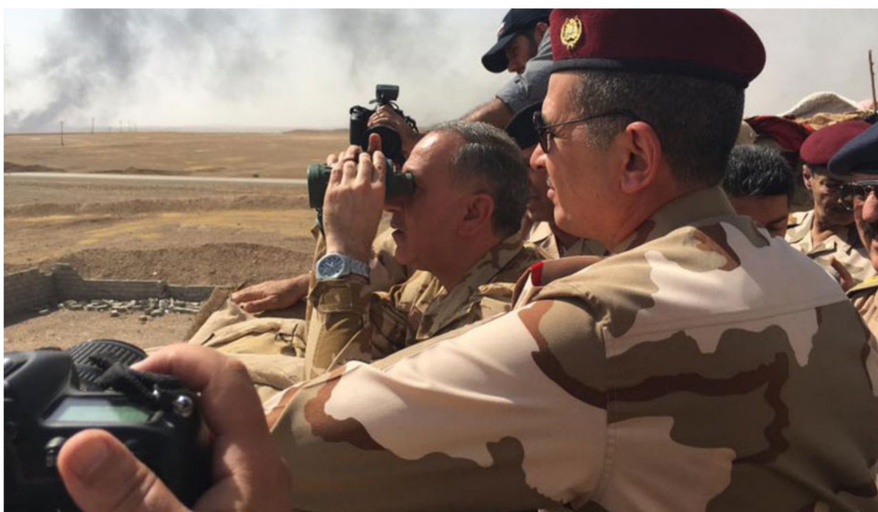
وزير الدفاع في إحدى ساحات القتال