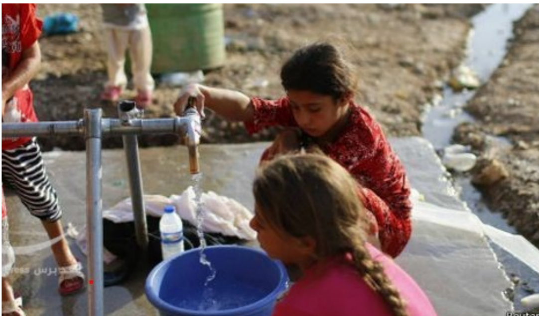
شحّة مياه الشرب

واضافت ان « قسم التنفيذ حدد مواقع الضعف في شبكة الماء في المنطقتين ونفذ رططين بإستعمال انابيب الدكتايل فرنسية الصنع