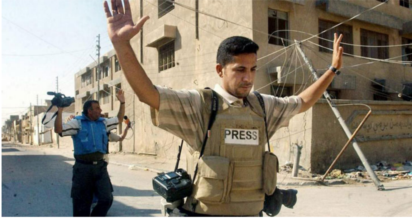
الاعتداء على الصحفيين في العراق

في عموم رئاسات محاكم الاستئناف، لكتبه طالب بـ «منح محكمة النشر والإعلام صلاحية النظر في هذه الدعاوى أيضاً، لأن الإعلام سلطة رابعة وتمثل نقطة الواصل بين المؤسسات الرسمية والمواطن». يذكر أن السلطة القضائية الاتحادية كانت قد استحدثت محكمة للنشر والإعلام في العام 2010، ضمن خطتها في إيجاد محاكم متخصصة تعتمد الجانب الفني إلى الجانب القانوني في اصدار القرارات.