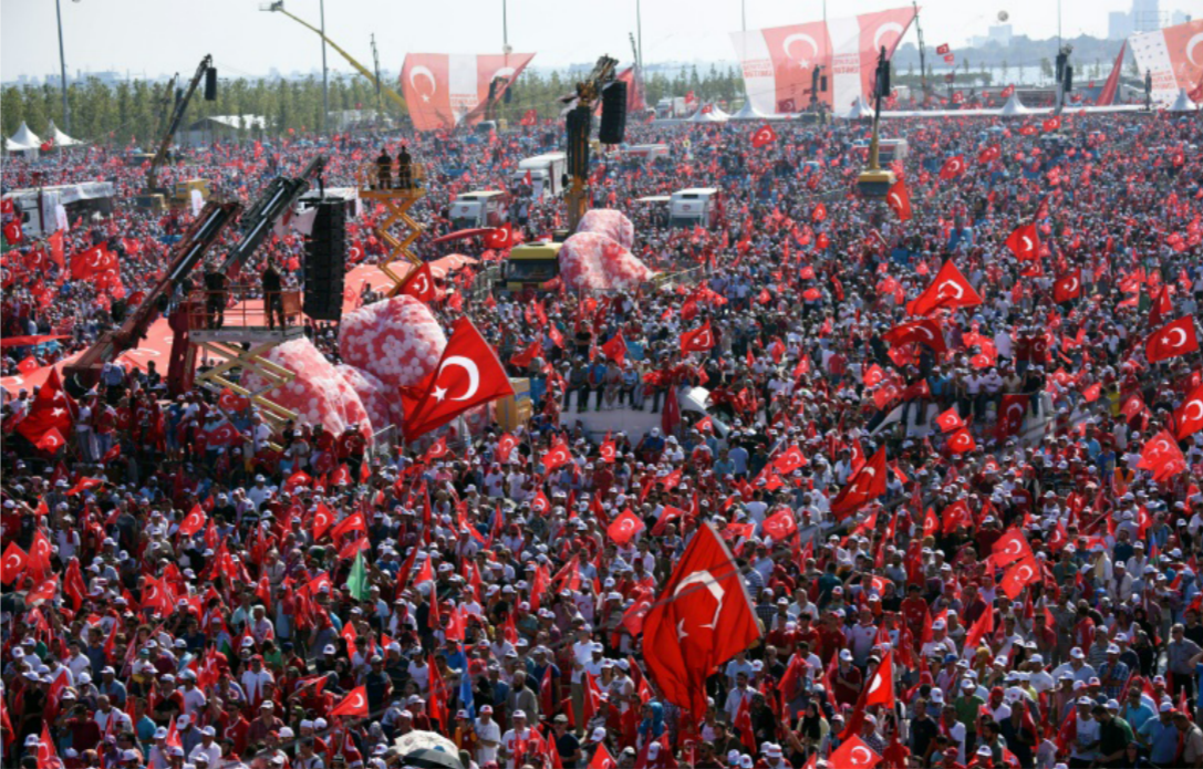
تظاهرة ضد الانقلابيين في تركيا

علمهم على قلعة حلب القديمة التي ما زالت تحت سيطرة قوات الحكومة. وقالت مصادر بالمعارضة المسلحة إن طائرات يعتقد أنها روسية كثفت ضرباتها لريف حلب الذي تسيطر عليه المعارضة كما