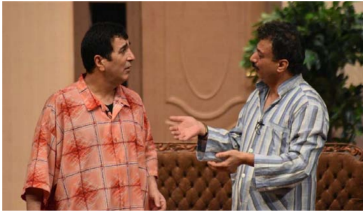
المرشدي والملاك في بوكو حلال

وختم المرشدي بالاعراب عن الأمل في أن تكون كل ظروف العراقيين الصعبة بردا وسلاما عليهم جميعا.