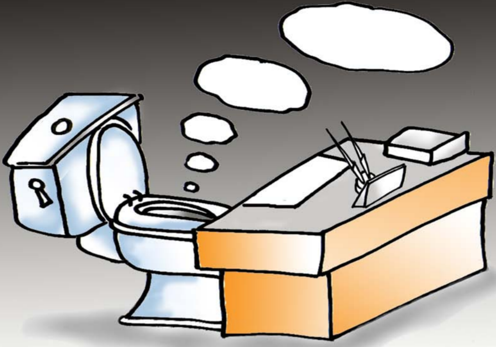
كاريكاتير - عاصم جهاد