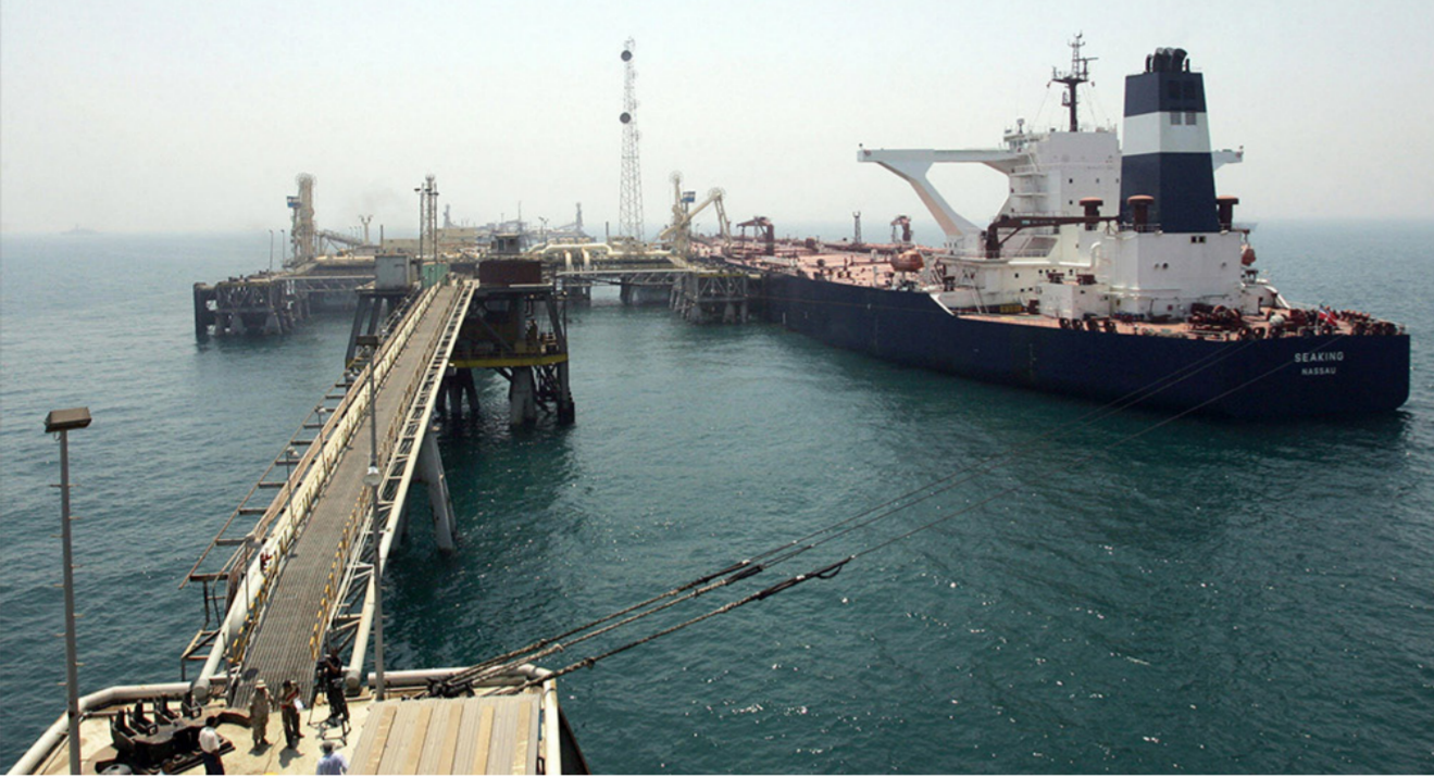
بوسع القوى العالمية أن تعمل مع الولايات المتحدة على معالجة بعض المشكلات الناجمة عن تراجع أسعار النفط

بمصادر الطاقة المتجددة قد تسبباً باشتداد مخاوف الدوائر المعنية بالتخطيط الطويل المدى لدى شركات النفط الوطنية في الشرق الأوسط، وفي الوقت الراهن، إن أبرز عامل وراء إبقاء أسعار النفط عند مستويات منخفضة هو الخزون العملي الهائل الذي يسجل أعلى مستوياته منذ خمس سنوات، ومن المتوقع أن تنخفض هذه الخزونات خلال العام المقبل، وحتى مع ارتفاع إنتاج النفط في الولايات المتحدة قد يكون من الصعب الحفاظ على عدم وصول الأسعار إلى 70-75 دولاراً للبرميل خلال العامين إلى الأربعة أعوام المقبلة إذا لم ينمّ الإنتاج خارج أميركا الشمالية.