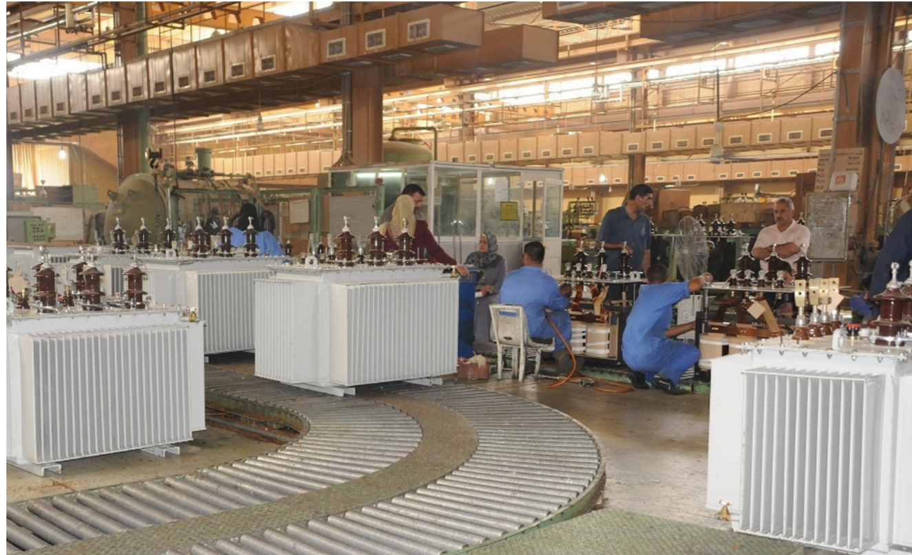
تجهيز المحولات والمقاييس الكهربائية