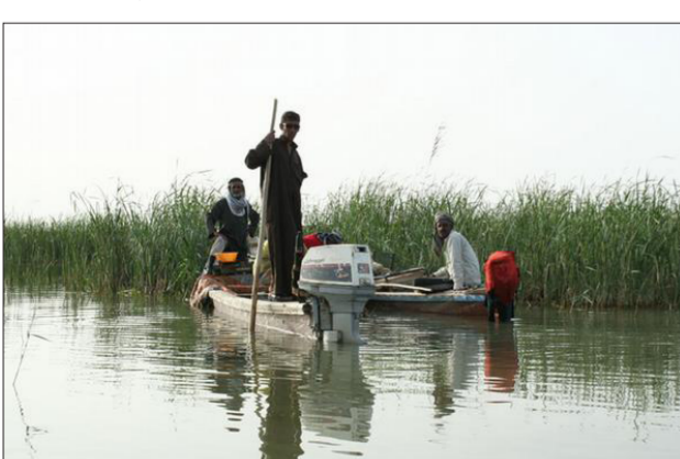
الأهور جنوب العراق