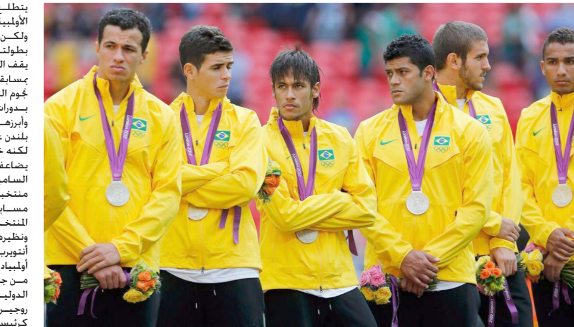
البرازيل.. تطلعت نحو ذهبية الأولمبياد

يتطلع الفريق إلى الفوز بالذهبية الأولمبية الأولى. ولكن إلى جانب صدمة الفريق في بطولتي كأس العالم 1950 و2014. لا يقف التاريخ في صف المنتخب البرازيلي بمسابقة كرة القدم الأولمبية حيث أخفق جوم الأعباء الأولمبية كانت أحدثها أبرزها في الأولمبياد الماضي عام 2012 بلندن عندما بلغ الفريق المباراة النهائية لكنه خسر أمام نظيره المكسيكي. يضاعف من وقوف التاريخ ضد طموحات الساميا في الأولمبياد أن الخط حالف ثلاثة منتخبات فقط على أرضها خلال تاريخ مسابقة كرة القدم الأولمبية حيث توج المنتخب البريطاني بالذهب في 1908 ونظيره البلجيكي في أولمبياد 1920 بمدينة أنتويرب ثم المنتخب الإسباني بالذهب في أولمبياد 1992 بمدينة برشلونة. من جانب آخر أعلنت اللجنة الأولمبية الدولية أول أمس أن الأمر كبريكة أجيلاً روجيرو. لاعبة هوكي الجليد انتخب كرئيسة للجنة الرياضيين في اللجنة الأولمبية الدولية.