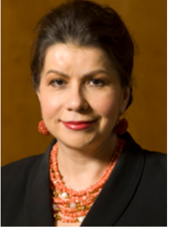
كارمن راينهارت أستاذة النظام المالي الدولي في كلية كينيدي للإدارة الحكومية في جامعة هارفارد

إيجابية). وفي ظل انخفاض معدلات التضخم اليوم أو في ظل البيئة الانكماشية التامة. قد يحتاج البنوك المركزية إلى أسعار فائدة سلبية (وهذا هو الجديد في الأمر) للتوصل إلى أسعار حقيقية سلبية. وفي منطقة اليورو واليابان. سوف يشجع أيضاً فرض ضرائب على البنوك التي تعمل احتياطات (سياسة سعر فائدة سلبية) على المزيد من الإراض المصرفي وبالتالي تخفيف النمو. في عصر يتسم بالنظر إلى شطب الدين العام (جميل الدائن جزءاً من الخسارة) على نطاق واسع بوصفه أمراً غير مقبول (يشهد على ذلك موقف الإخاد وبالنسبة من اليونان) وغالباً ما تمنع فيه الحكومات عن شطب الدين الخاص (بشهادة على ذلك امتناع إيطاليا عن خميل جاملي الديون المصرفية الثانوية جزءاً من الخسارة). تشكل العائدات الملاحقة للسياسة المستخدمة مساراً تراكمياً لتخفيض الديون. وفي غياب طفرة تضخم مفاجئة فسوف تكون هذه العملية طويلة في الأرجح.