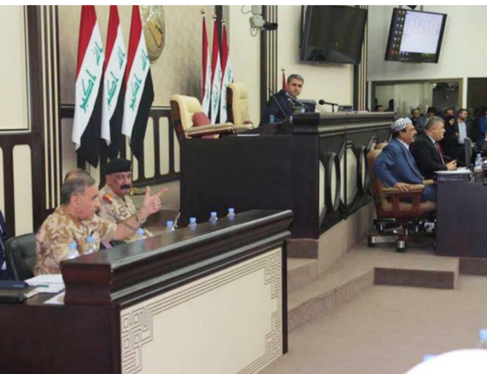
جانب من جلسة استجواب وزير الدفاع

وأورد أن "أقوال من ورد ذكرهم ستحدّد من أجل الوصول إلى الحقيقة إضافة إلى الاستماع لإفادة الوزير". لافتاً إلى أن "علماً سيكون بعيداً عن الضغوط لأجل كشف ملامسات شبهات الفساد في وزارة الدفاع". وشدّد عضو الفريق التحقيقي