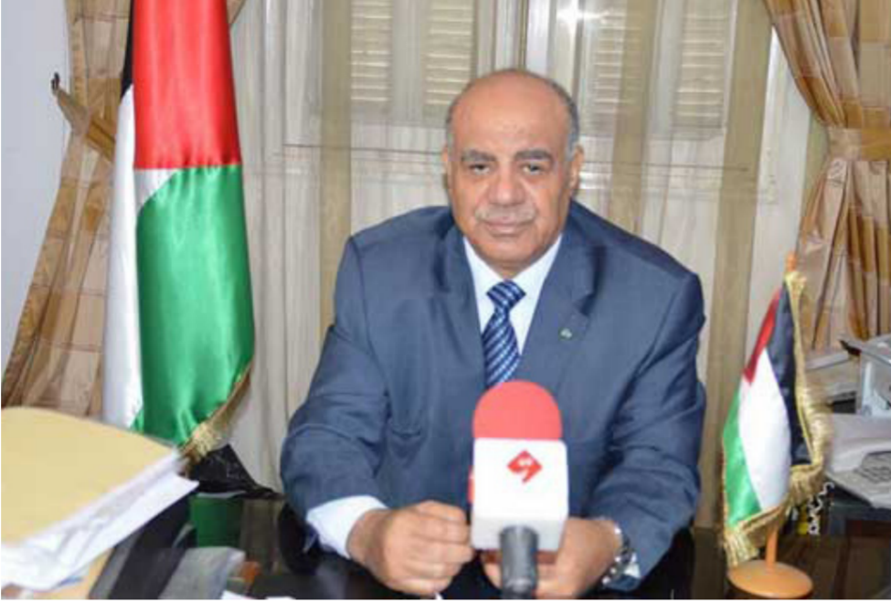
سفير فلسطين لدى فرنسا سلمان الهرفي

الإسرائيلية اليومية على أرضه ومقدساته وممتلكاته. وحذر المجلس الإسرائيلي (القوة القائمة بالاحتلال) من التماهي في استفزاز مشاعر العرب والمسلمين حول العالم، من خلال التصعيد الخطير لسياساتها وخطواتها غير القانونية التي تهدف إلى تهويد وتقسيم المسجد الأقصى المبارك زمانياً ومكانياً. وكلف الوزراء، اللجنة الوزارية العربية الصغيرة بشأن إنهاء الاحتلال بالعمل على طرح وتبني مشروعه قرار جديد في مجلس الأمن بدين الاستيطان الاستعماري الإسرائيلي في أرض دولة فلسطين المحتلة. وطالب مجلس الأمن بإصدار قرار بشأن توفير الحماية الدولية للشعب الفلسطيني وإنفاذ قراراته ذات الصلة لاسيما القرار (904) لعام 1994 والقرار (605) لعام 1987 القاضي بتطبيق اتفاقية جنيف الرابعة على الأراضي الفلسطينية وضرورة توفير الحماية الدولية للأراضي الفلسطينية بما فيها القدس. وطالبت مشاريع القرارات، بمواصلة التحرك العربي على المستوى الثنائي والمتعدد الأطراف ل طرح موضوع توفير نظام حماية دولي لأراضي دولة فلسطين المحتلة في دورة استثنائية طارئة للجمعية العامة للأمم المتحدة طبقاً لقرار الآحاد من أجل السلام.