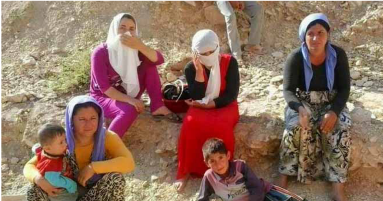
إيزيديات على جبل سنجار

أعمار ما تم تدميره على يد تنظيم داعش الإرهابي. يشار إلى أن حكومة إقليم كردستان قد أعلنت تحرير قضاء سنجار بالكامل من داعش في 13 من شهر تشرين الثاني من العام الماضي 2015. بعد دخول قوات البيشمركة إليها إضافة إلى وحدات حماية الشعب والمرأة من عدة محاور، عقب تنفيذ قوات التحالف الدولي قصفاً مكثفاً على عناصر داعش داخل المدينة التي دمرت بالكامل. وبعدها بارزاني خلال مؤتمر صحفي عقده على تخوم المدينة تحرير سنجار باليوم التاريخي معلناً العمل على تحويلها من قضاء إلى محافظة.