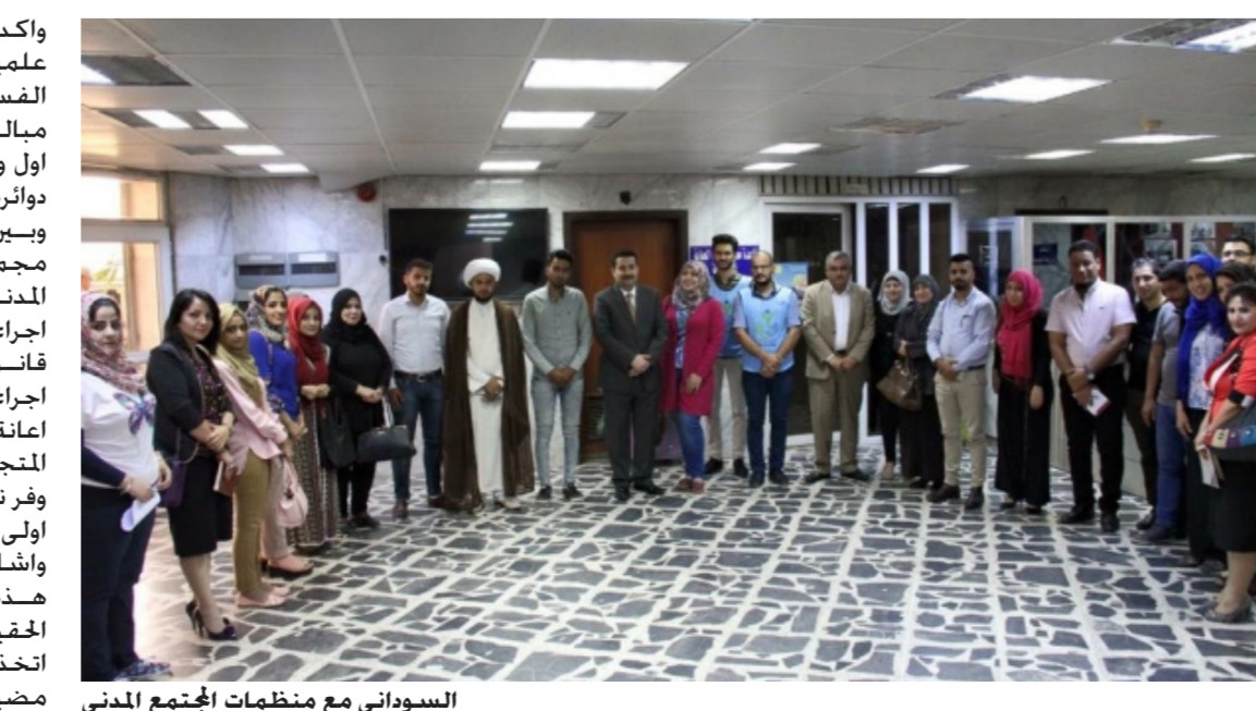
السوداني مع منظمات المجتمع المدني

واقدم الوزير ان الوزارة اتخذت اجراءات علمية ومهنية للقضاء على الفساد وكشف المتجاوزين على مبالغ الحماية الاجتماعية وانها اول وزارة بدأت الاصلاح الحقيقي في دوائرها و وحداتها كافة. وبين السوداني خلال استقباله مجموعة من منظمات المجتمع المدني الفاعلة ان الوزارة اتخذت اجراءات سبقت المباشرة بتنفيذ قانون الحماية الاجتماعية من خلال اجراء تقاطع لبيانات المستفيدين من اعانة الحماية الاجتماعية لكشف المتجاوزين والمفسدين والذي بدوره وفر نحو 120 مليار دينار كمرحلة اولى من خطوات تنفيذ القانون . وأشار الوزير الى ان الوزارة باجرائاتها هذه تعد اول من بدأ الاصلاح الحقيقي فضلاً عن الاجراءات التي اتخذتها لبقية دوائرها و وحداتها . مضيفاً ان منظمات المجتمع المدني