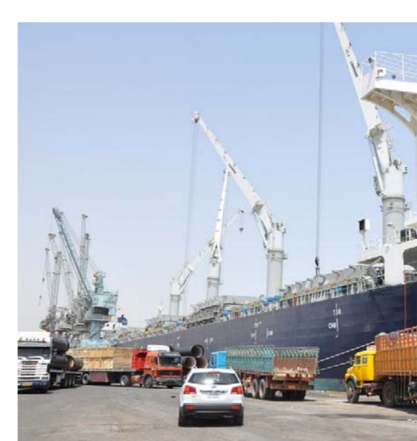
أحد الموانئ العراقية

من سلع وخدمات. وهذا ما يدل على ضعف اقتصاداته بفعل ضعف قاعدته هذا المؤشر. وأهمية هذا المؤشر واضحة في انه يدلنا على مدى اعتماد الدولة على دول العالم الخارجي في استيراد احتياجاتها السلعية. بمعنى انه يعكس السلي على لصادرات 99% من اجمالي الصادرات كمتوسط للمدة نفسها وهي اكبر من نسبة العيار (70%). كما شكلت نسبة مؤشر التركيز الجغرافي للصادرات 47.29% من اجمالي الصادرات كمتوسط للمدة نفسها وهي اكبر من نسبة العيار (40%). واخيراً شكلت نسبة مؤشر الميل المتوسط للاستيراد 27.97% من اجمالي الناتج المحلي تقريباً يذهب للعالم الخارجي لتغطية ما يتم استيراده وهذه نسبة كبيرة. وأكد المراقبون أيضاً ان « التبعية التجارية للعراق تظهر بنحو واضح عندما يتم قياسها من خلال متوسط نسبة الاستيرادات الى الناتج المحلي الاجمالي وهو ما يعرف بالميل المتوسط للاستهلاك. حيث إن قيمة هذا المؤشر تختلف من سنة لسنة أخرى. إذ بلغت أعلى نسبة له في عام 2004 عندما كانت 39%. في حين بلغت أدنى نسبة له في عام 2008 عندما بلغت 20.67%. أي إن نسبة هذا المؤشر تتراوح ما بين 39.49% وما بين 20.67%. ويمكن ارجاع هذا الانخفاض الى انخفاض اسعار