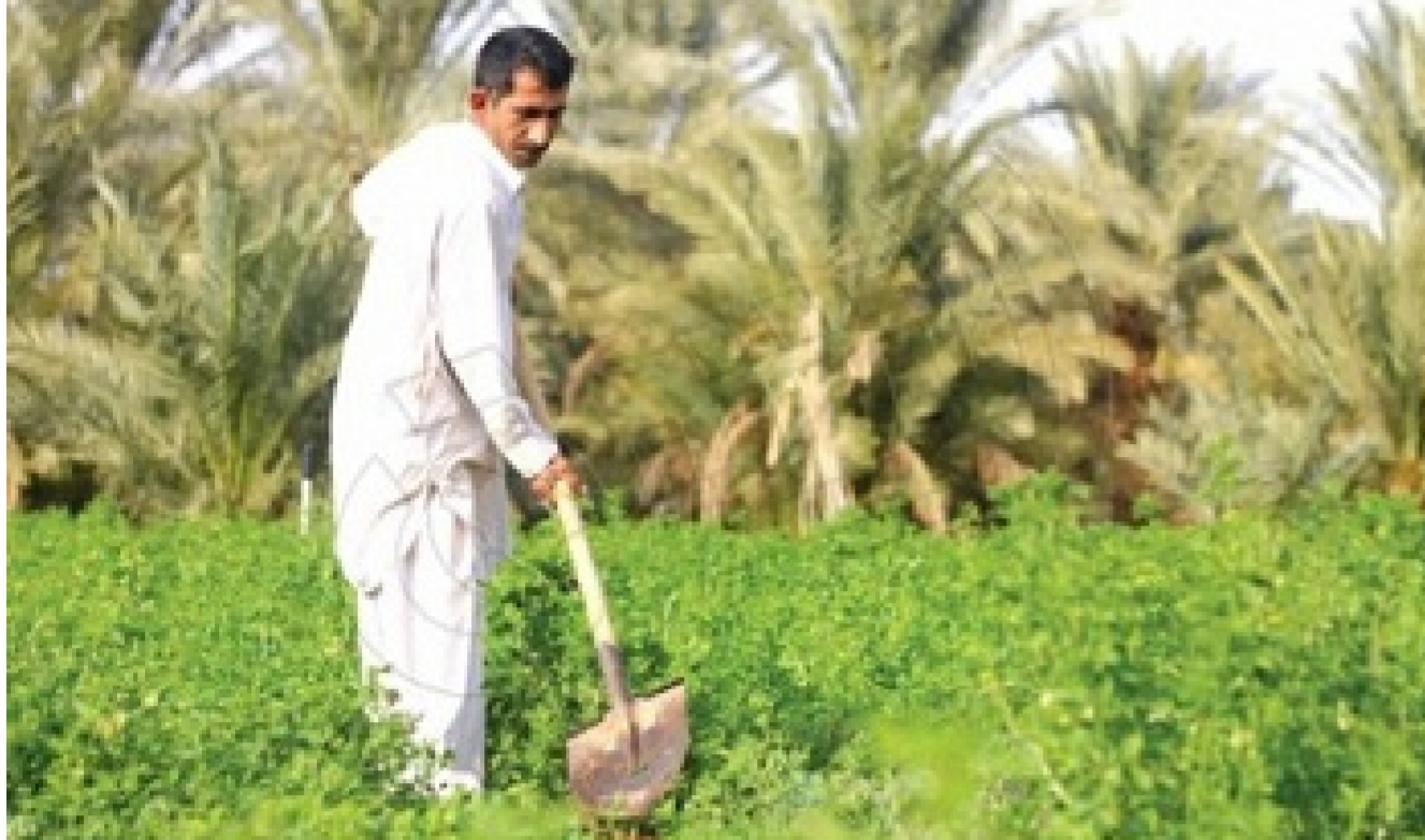
أحد الحقول الزراعية في البلاد

مرة منذ مباشرتها بتسليم الخبواب من المسوقين منذ 26 عاماً ، مبيناً ان فروع الشركة بدأت باعداد القوائم وارسالها الى الشركة لغرض ارسالها الى وزارة المالية مباشرة. مشيراً ان هذا العمل يحتاج الى تيوب محاسبي جديد يختلف عن العمل السابق للشركة ليكون الدفع يكون بالسندات الخزنية. ومن الجدير بالذكر ان هذا الاجراء العامه تجلس الوزراء لدفع تلك المستحقات للفلاحين والمزارعين عن اقيام المحاصيل الزراعية من الحنطة والشلب.