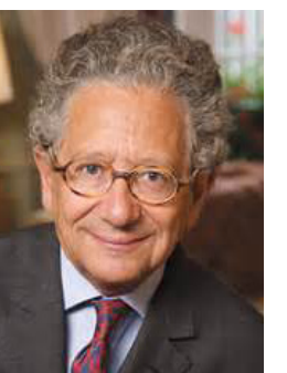
دومينيك مويسي استاذ في معهد الدراسات السياسية في باريس (العلوم السياسية)

بعد الهجمات الإرهابية التي وقعت في باريس في نوفمبر الماضي - ضمن سلسلة من الإعتداءات المنسفة بعناية قام بها مهاجمون متعددون. ما أدى إلى 130 حالة وفاة - كان هناك ألم شديد وخوف. ولكن ظهرت أيضاً روح الوحدة والصمود. على النقيض من ذلك. منذ منذ يوم الباستيل في نيس - حيث تلقى مهاجم المساعدة من خمسة رجال من الأفضل وصفهم كجرائم عن كونهم إسلاميين متطرفين. أدخلوا شاحنة مفرخة وسط الحشد. ما أسفر عن مقتل 84 شخصاً. - ينهم العيود من الأطفال - أصبح الناس يشعرون بالعجز والغضب. ونتيجة لذلك يعاني الفرنسيون الآن من حالة الإحباط والقلق. فقد تعودوا على بعض مظاهر الأمن في مدنهم. التي ظلت لدة طويلة معاقل للمعرفة والفن. وليس مواقع للإرهاب الوحشي. فهم يريدون الشعور بالأمان من جديد - مهما كلف الأمر. هذه الشاعر مفهومه تماماً. ولكنها