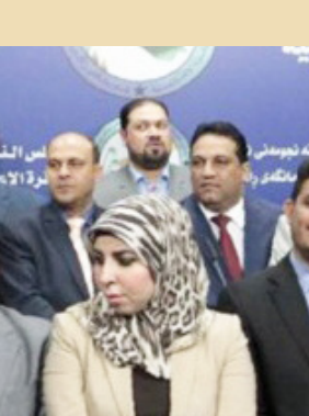
جبهة الإصلاح النيابية

الإصلاحية ختت قبة البرلمان. ووزعت نسخ منها على جميع أعضاء مجلس النواب تمهيداً