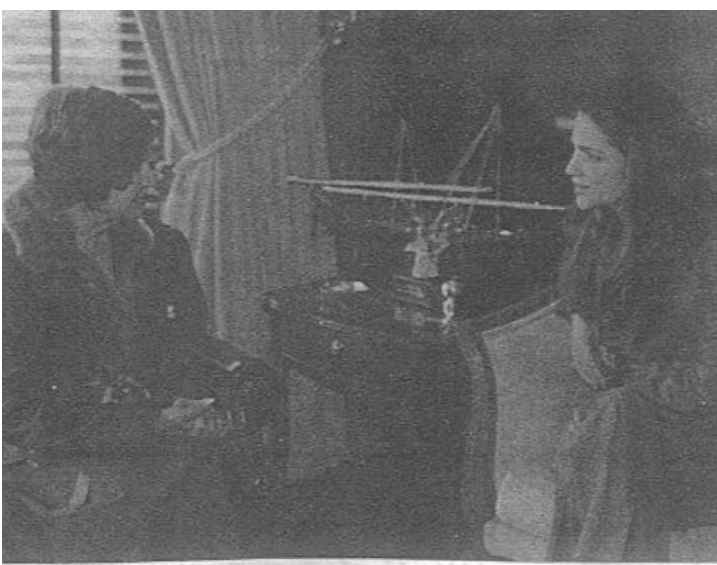
زوجتي مع جلالة الملكة رانيا العبدالله

للتفجير حزامها الناسف لإكمال ذلك الحدث الرهيب، فاستعصم عليها فتح الكيس في الحزام واضطرت الى مغادرة الفندق ثملقي القبض عليها.