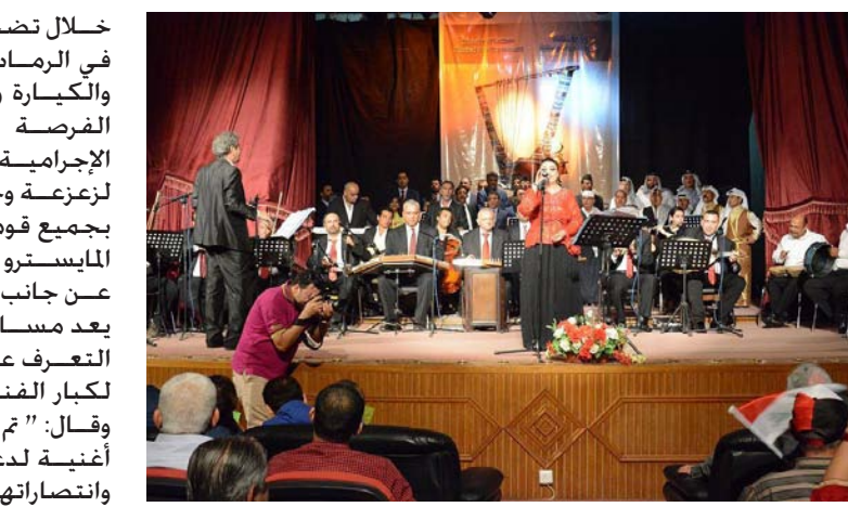
جانب من المهرجان

يذكر أن المهرجان له أهمية خاصة عند كل الفنانين سواء شعراء او موسيقيين حيث يتسابق الكل على المشاركة الفعالة لتقديم كل ما هو جديد ومؤثر بالجمهور، الذي ينتظر المهرجان كل عام للاستمتاع وسماع جديد كبار الفنانين العراقيين الذين ابتعدوا نسبياً عن الساحة بعد ان اجتاحها عواصف الطائرات عليها.