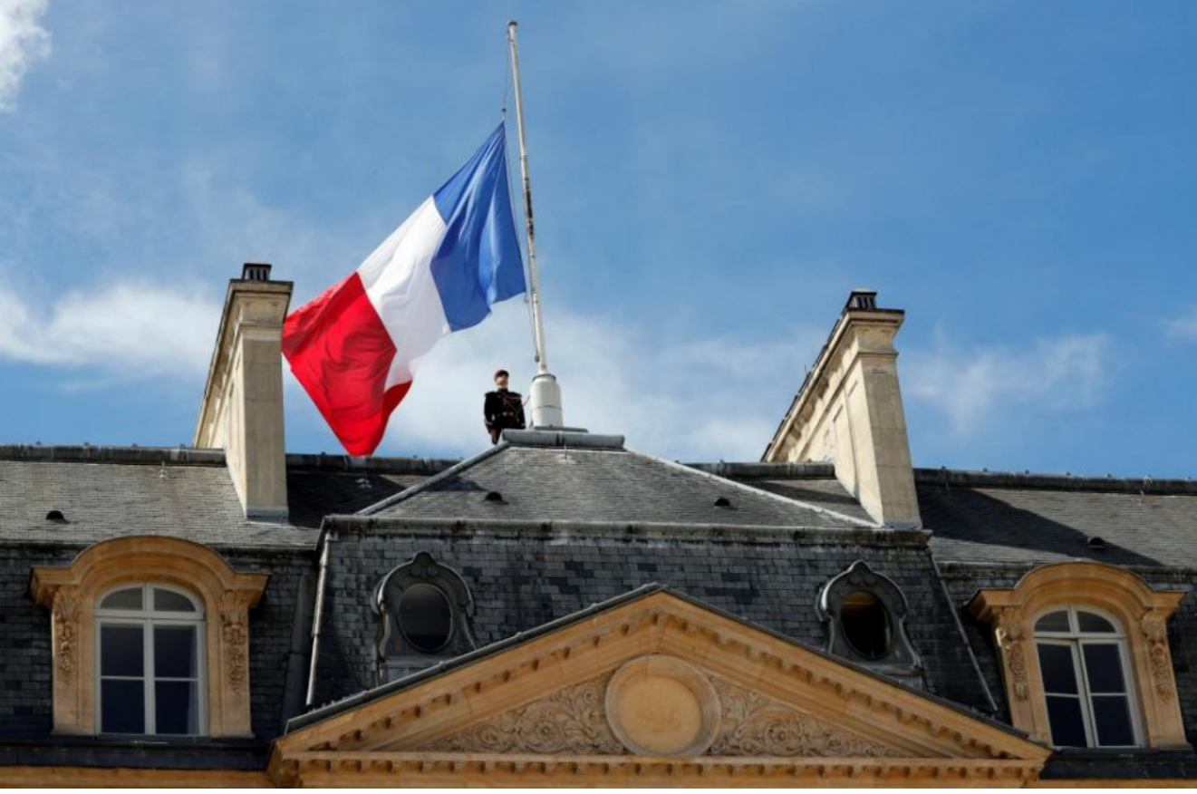
كنيسة روان في فرنسا

وربما الدرك. * ماحتاجه فرنسا الان في هذه المرحلة هو العمل الاستخباراتي في محاربة التنظيم. هذا العمل يقوم على كشف المتطرفين والانتحاريين المحتملين والخليا الفردية. اكثر من الاجراءات العسكرية. بالضربات الجوية على سبيل المثال او نشر القوات.