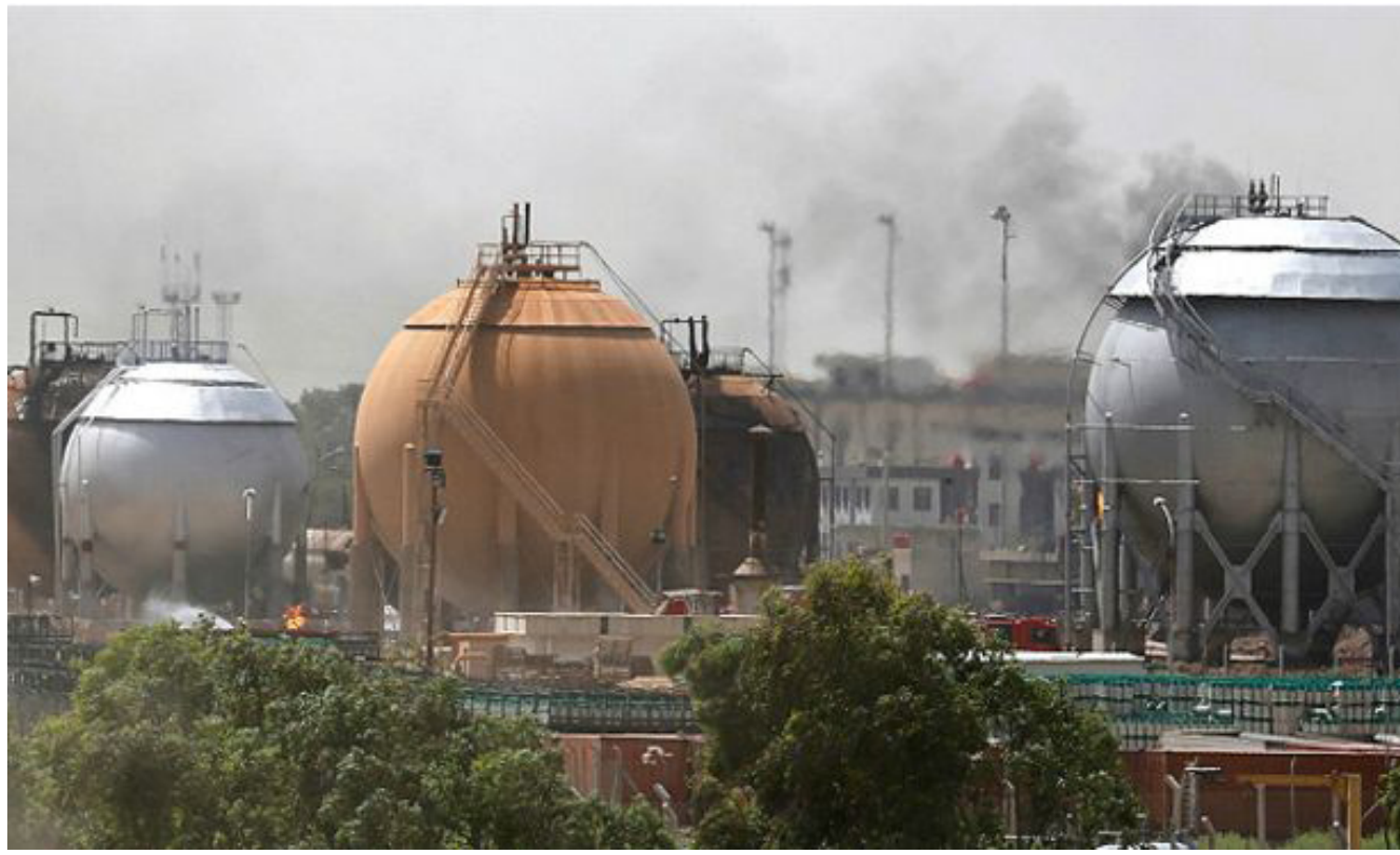
إحدى محطات الغاز في العراق