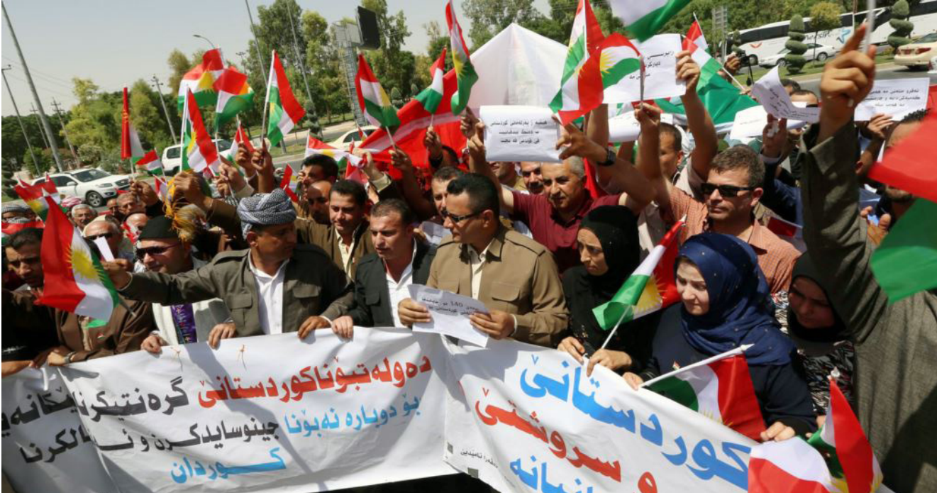
موظفون ومتقاعدون يطالبون حكومة الإقليم صرف رواتبهم

رواتب المتقاعدين ووزارة التربية. المالية أوضحت في بيان تلقت الصباح الجديد نسخة منه أنها سبتبدأ اليوم الأحد بتوزيع راتب شهر حزيران وفقاً لجدول جديد تضمن: يوم الأحد 31-7 سبتتم توزيع رواتب وزارات (الاعمال والأسكان، الثروات الطبيعية، التخطيط، المالية والاقتصاد، العمل والشؤون الاجتماعية، وعدد من الهيئات والمؤسسات المستقلة، وسبتتم يومي الاثنين والثلاثاء المقبلين توزيع رواتب وزارات (الصحة، التجارة والصناعة، الكهرباء، الأوقاف والشؤون الدينية، وزارة الثقافة والشباب).