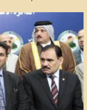
جبهة الإصلاح النيابية

ويضيف البيجي في حديث لـ"الصباح الجديد"، ان "نواب جبهة الإصلاح قرأوا وقرعهم