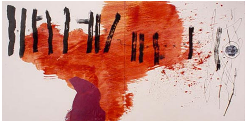
لوحة للفنان كرم رسن

ان اهتمام الجماهير في شتى أرجاء العالم بنتاجات إجه أدبي معين - كالواقعية السحرية مثلا - أو بظاهرة سياسية ما - كالإسلاموفوبيا في أوروبا والولايات المتحدة الأمريكية - يمارس تأثيرا قويا في عالمية الأدب . وتعني بذلك الدور المهم للنجاح في التعبير الفني القوي عن روح العصر .