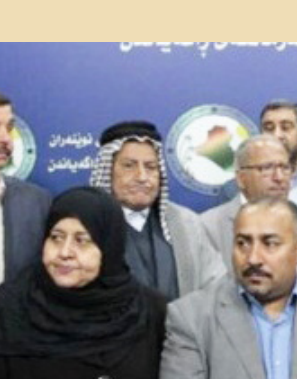
جبهة الإصلاح النيابية

الإصلاحية ختت قبة البرلمان. ووزعت نسخ منها على جميع أعضاء مجلس النواب تمهيداً