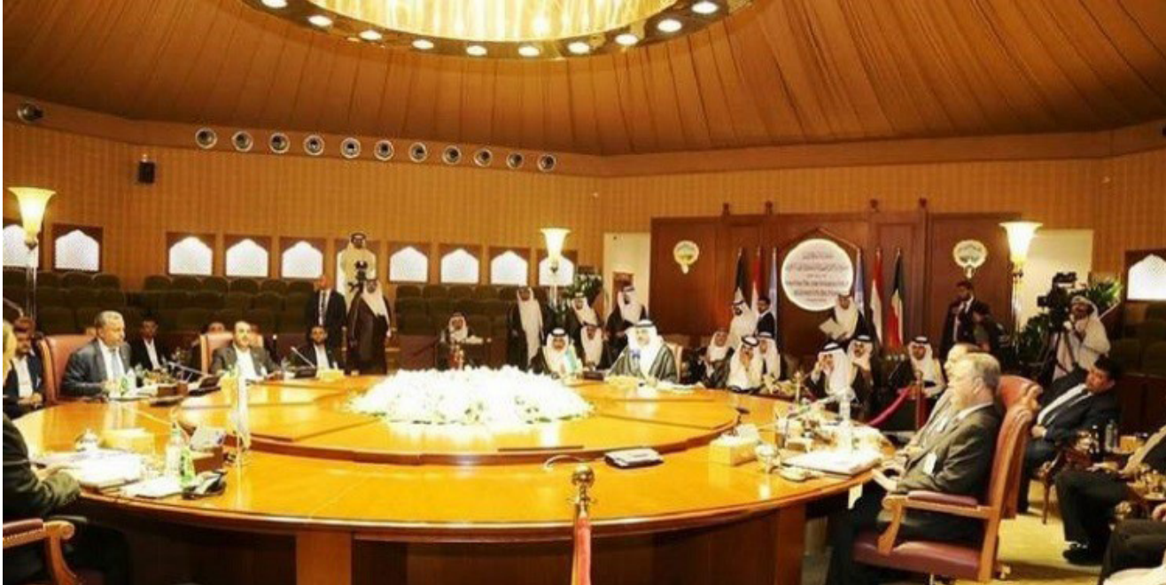
تعثر مفاوضات السلام اليمنية في الكويت

أدى إلى انهيار المفاوضات التي استضافتها الكويت لأشهر. وقالت الخارجية الأميركية في بيانها اليومي، أمس الجمعة، إن مثل هذه الأفعال «خروج عن مسار المفاوضات ولا تدفع المحادثات إلى الأمام». وأضافت الخارجية الأشهر الماضية تحت رعاية الأمم المتحدة «معتبرة إياها» الفرصة الوحيدة للاستقرار» في اليمن. ودعت واشنطن الأطراف اليمنية لإبداء حسن النية والمرونة لإحراز تقدم «سريدي بشكل مباشر إلى تحسين حياة ملايين اليمنيين». وكان الحوثيون وحزب المؤتمر الشعبي العام بزعامته الرئيس الأسبق علي عبد الله صالح، أعلنوا عن تشكيل مجلس سياسي لإدارة