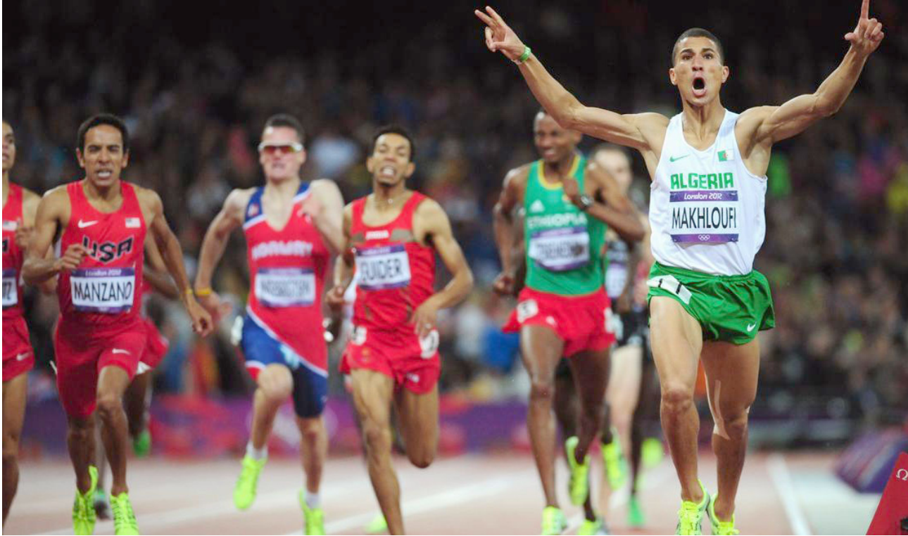
لقطة لسباقات الأولمبياد «أرشيف»

وعززت السلطات البرازيلية الاجراءات الامنية من اجل طمأنة القادمين الى البلاد منذ الاحد الماضي. إذ تم توزيع حوالي 50 الف شرطية وعسكري في أنحاء ريو من اجل حماية المنشآت الاولمبية. الاماكن السياحية ووسائل النقل الاساسية.