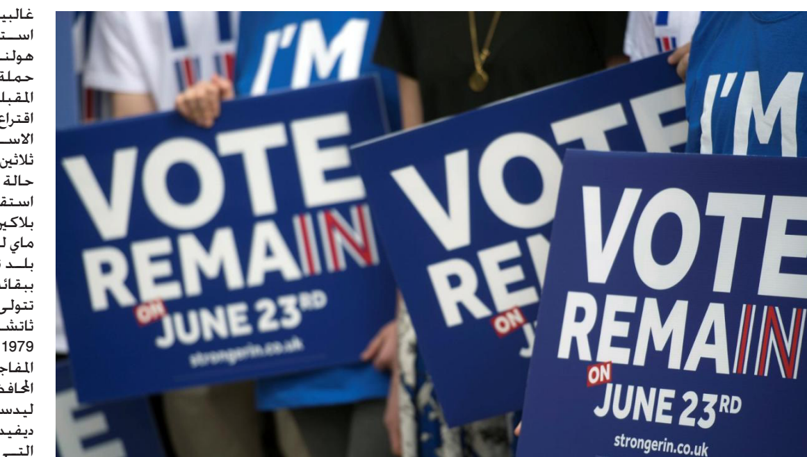
أغلب البريطانيين صوتوا على الخروج من الاتحاد الأوروبي

غالبية ساحقة، وعد فيلدرز بتنظيم استفتاء حول «نيكست» (خروج هولندا من الاتحاد) سيكون محور حملة حزبه للانتخابات التشريعية المقبلة، وقلل من اهمية عواقب اقتراع 23 حزيران بعد ان اجنيه الاسترليني الى ادنى مستوى له منذ ثلاثين عاما وشهد القطع العراقي حالة من الهلع في موازاة خذيرات من استقرار بريطانيا المالي.» بلاكين يرى لا اهمية لترشيح تيريزا ماي لرئاسة الوزراء في بريطانيا وحكم بلد تنصل من وعده للاتحاد الأوروبي ببقائه ضمن اطاره. ماي هي ثاني امرأة تتولى رئاسة الوزراء بعد مارجريت ثاتشر التي تولت الحكم في البلاد من 1979 إلى 1990، وذلك بعد الانسحاب المفاجئ لمنافستها على زعامة حزب المحافظين وزيرة الدولة لطاققة أندريا ليدسوم، وإعلان رئيس الوزراء المستقبل ديفيد كامرون تنحيه لمصلحتها. مايا التي تولت حفة داخلية صعبة وما زالت تواجه خذيات صعبة تتمثل في الاشراف على انفصال البلاد عن الاتحاد الأوروبي.» واشار ايضا في تقريره الى حجم المخاطر الاقتصادية التي ستعجز عن خروج بريطانيا من الاتحاد الأوروبي قائلا «على الرغم من افتراض البعض الاكبر من مواطني المملكة