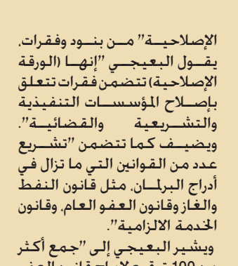
جبهة الإصلاح النيابية

الإصلاحية" من بنود وفقرات. يقول البيجي "إنها الورقة الإصلاحية) تتضمن فقرات تتعلق بإصلاح المؤسسات التنفيذية والتشريعية والقضائية". ويضيف كما تتضمن "تشريع عدد من القوانين التي ما تزال في أدرج البرلمان، مثل قانون النفط والغاز وقانون العفو العام، وقانون الخدمة الإلزامية". ويشير البيجي إلى "جمع أكثر من 100 توقيع لإدراج قانون العفو العام على جدول أعمال البرلمان". ويؤكد ان "نواب جبهة الإصلاح اعازمون على "تمرير القوانين وفتح جميع ملفات الفساد واستجواب بعض الوزراء.