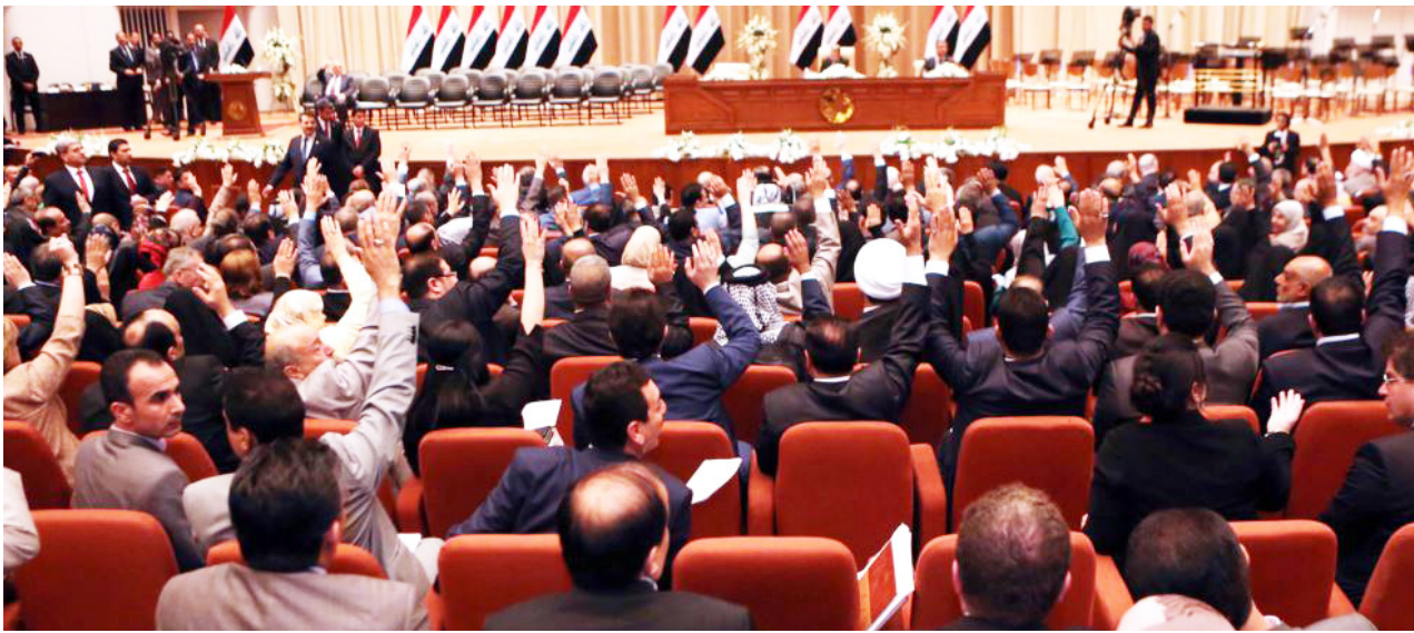
مجلس النواب "ارشيف"