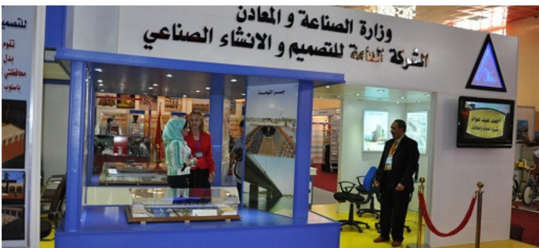
الشركة العامة للتصميم وتنفيذ المشاريع