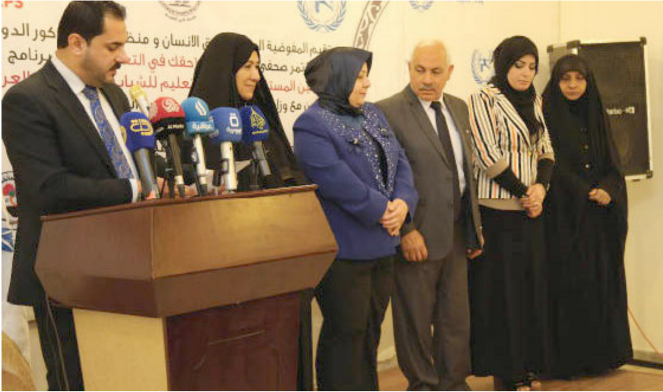
المفوضية العليا لحقوق الإنسان

مواعيد الامتحانات النهائية لغرض مساعدة الطلبة على اجتياز هذه الامتحانات. ويتضمن البرنامج كذلك توزيع مساعدات طوارئ في مجال التعليم للطلبة الذين تم اعادتهم من خلال نشاطات البرنامج للعام الدراسي 2015 - 2016 بواقع 150 طالباً في كل منطقة من مناطق عمل البرنامج لغرض تسهيل عودتهم من مقاعد الدراسة ولضمان استمرارهم بالدراسة. والقسيام بعملية تفاوض مع اولياء الامور الراضين عودة فتياتهم الى مقاعد الدراسة لغرض ائقاعهم عن طريق مفاوضات في اماكن عمل البرنامج.