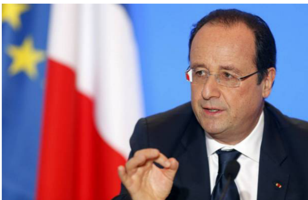
الرئيس الفرنسي فرانسوا هولاند

وأوضح وزير الدفاع الكندي هارجيت ساجان في بيان أن كندا، جنبا إلى جنب مع الولايات المتحدة وبريطانيا وألمانيا، ستكون واحدة من الدول الأربع «التي ستعزز الانتشار المتقدم خلف شمال الأطلسي في أوروبا الشرقية ووسط أوروبا». وأضاف أن «كندا ستؤسس وتفقد مجموعة تكتيكية مناوئة ومتعددة الجنسيات»، مشيراً إلى أنه سيتم تقديم مزيد من التفاصيل خلال القمة الأطلسية المقبلة في وارسو يومي 8 و9 تموز. وذكرت وسائل اعلام كندية أن