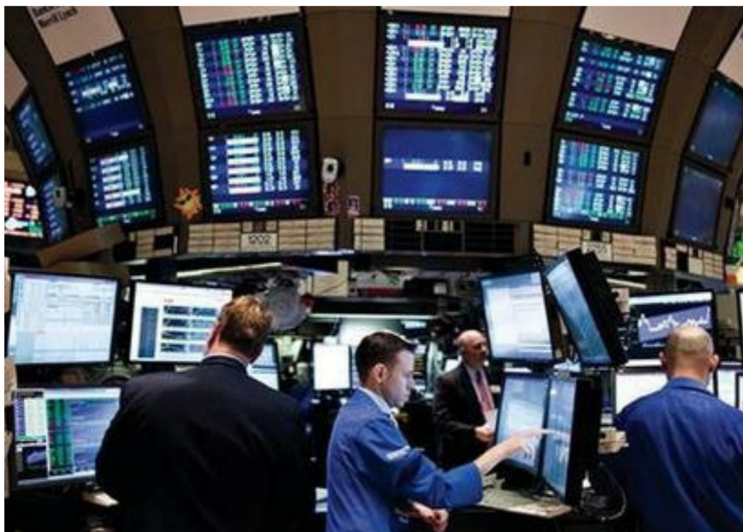
تباطأ في نمو التجارة الخارجية والاستثمارات وقطاع الصناعات التحولية

وكان من المقرر أن تعلن الحكومة هذا الصيف أين تنوي تشييد