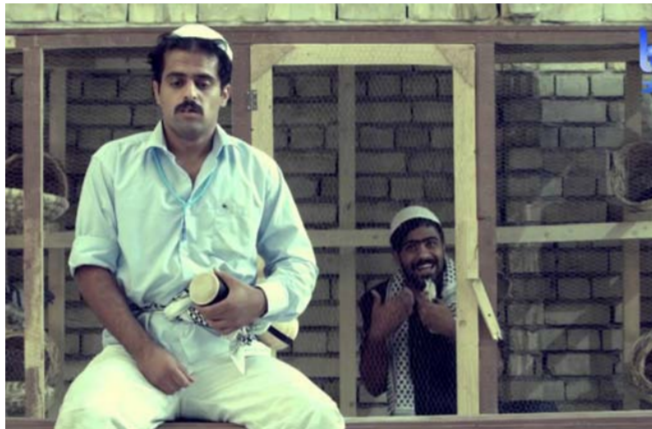
مشهد من مسلسل جرابية

قال جانبه، قال الصحافي المتخصصة بالجمال الفني، جيدر العجمي إن "الموسم الدرامي الحالي شهد انتكاسة كبيرة للدراما العراقية ولأسباب غير مقبولة وغير منطقية". مؤكداً أن "الإنتاج الدرامي اختفى هذا العام