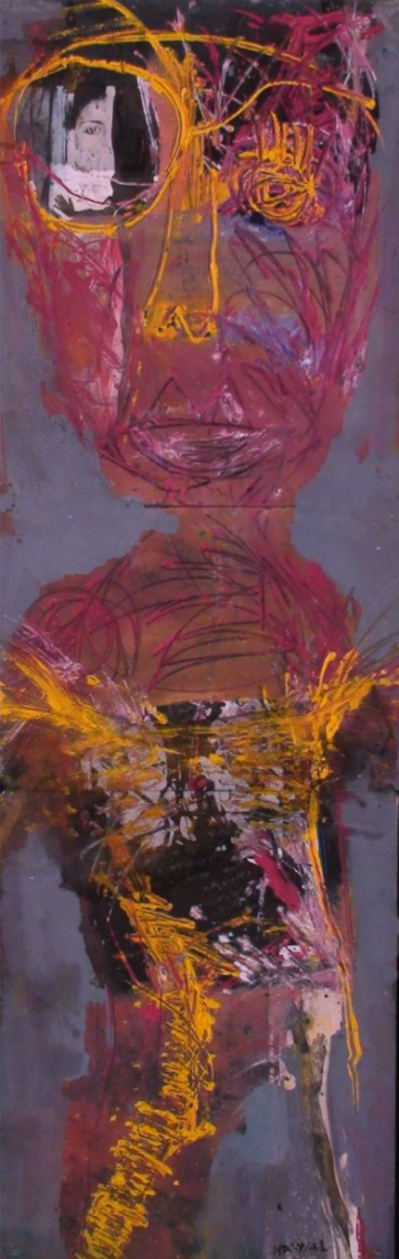
لوحة للفنانة نوال السعدون

ان الزمن هو الحكم الفصل في فرز الصالح عين الطالح. والأبداع الحقيقي يبقى حياً ومقروءاً مهما طال الزمن. ولكن لا أحد اليوم يحفظ أو يقرأ شيئاً من شعر البياتي. ولكي أكون دقيقاً أذكر أنني سمعت منذ عدة سنوات في بغداد أحد الشعراء الشباب وهو يردد ضاحكاً بيتاً واحداً من شعر البياتي ورد في مطلع قصيدته المسماة «الأميرة والفجري» وهو بيت (شعري) عجيب. هذا نصه «أدخل في عينيك- تخرجين من فمي»