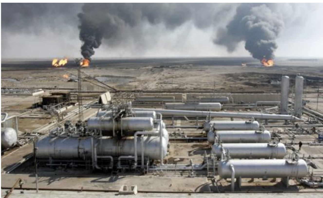
إحدى محطات الغاز العراقي