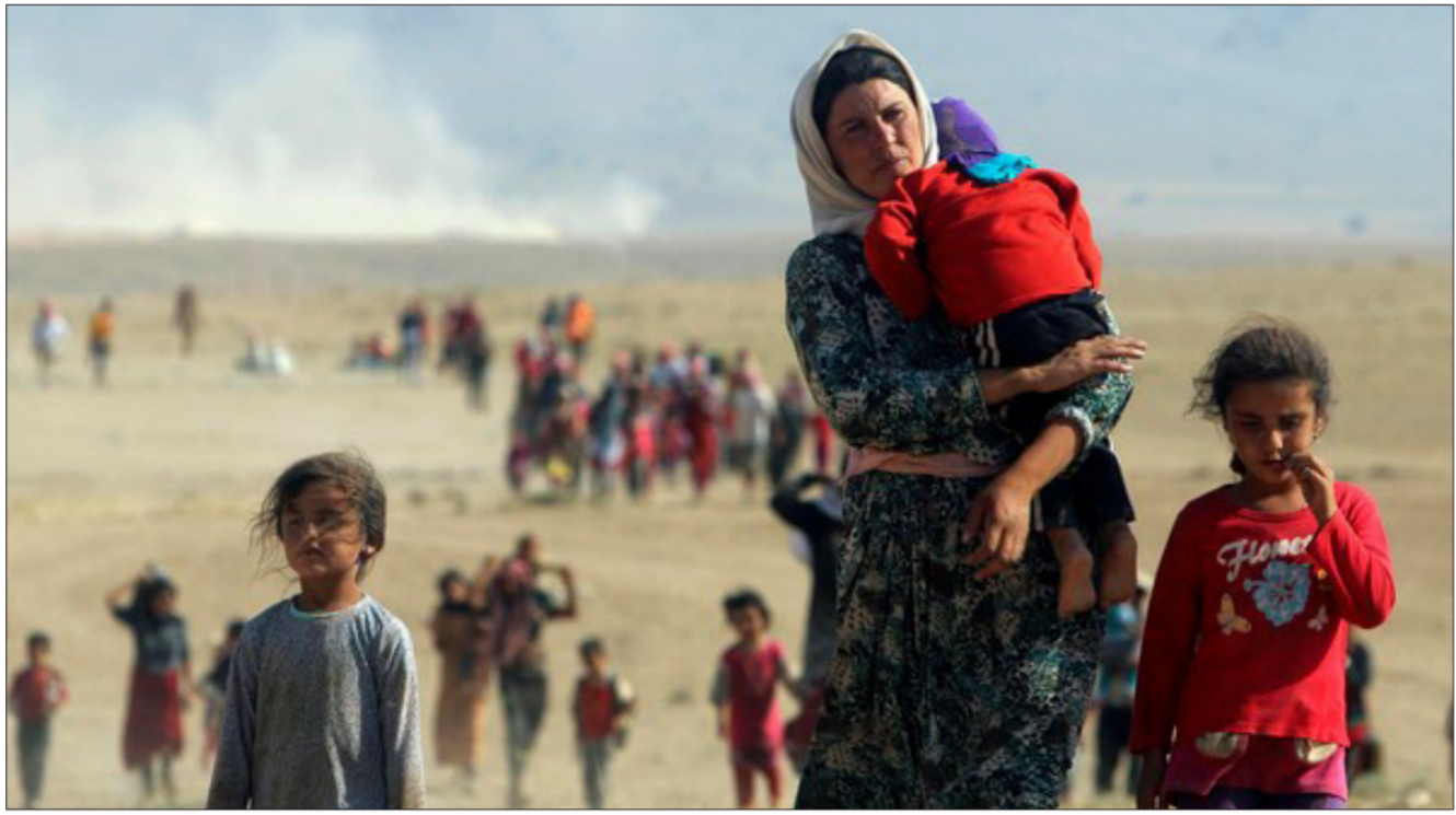
إيزيديون هاربون من داعش "ارشيف"