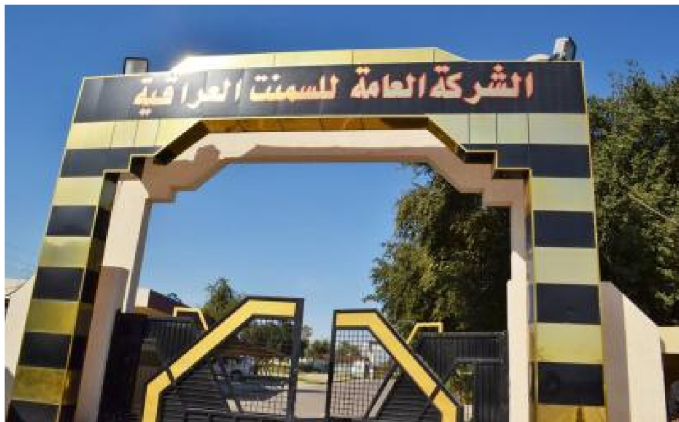
الشركة العامة للأسمنت العراقية

الجاري لياه الإطمار وشبكة التغذية الكهربائية والإنارة والهواتف ووحدة لمعالجة المياه الثقيلة وكذلك محطة لضخ مياه الإطمار . يذكر إن المرحلة الأولى كانت تشمل إنشاء بناية للإدارة بطابقين وإنشاء سياج المدينة الصناعية بطول 3 كم، والبوابه الرئيسية للمدينة والاستعلامات الخارجية وشبكات الكهرباء وإنشاء خزان الماء.