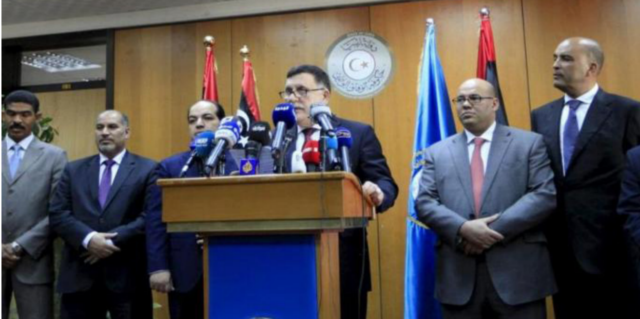
استقالة الوزراء الأربعة تهدد حكومة السراج

من مختلف الدول الغربية والعربية إلى ليبيا في الأشهر الثلاثة الأولى من عام 2016، وأشار إلى سهولة وصول المقاتلين إلى ليبيا. خاصة عبر حدودها البرية مع النيجر والسودان. خاصة بعد التضييق المفروض على المنافذ المؤدية إلى معقل داعش التقليدية في ليبيا. ولفت إلى أن ليبيا تحولت في الأشهر الأخيرة إلى أهم منطقة لجذب المقاتلين من مختلف أنحاء العالم.