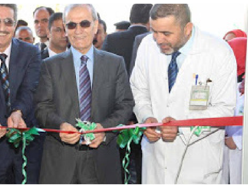
جانب من الافتتاح

العراقية منذ عام 2008 وكان مكانا صيفا ولا يتناسب مع عدد المراجعين والمرضى.