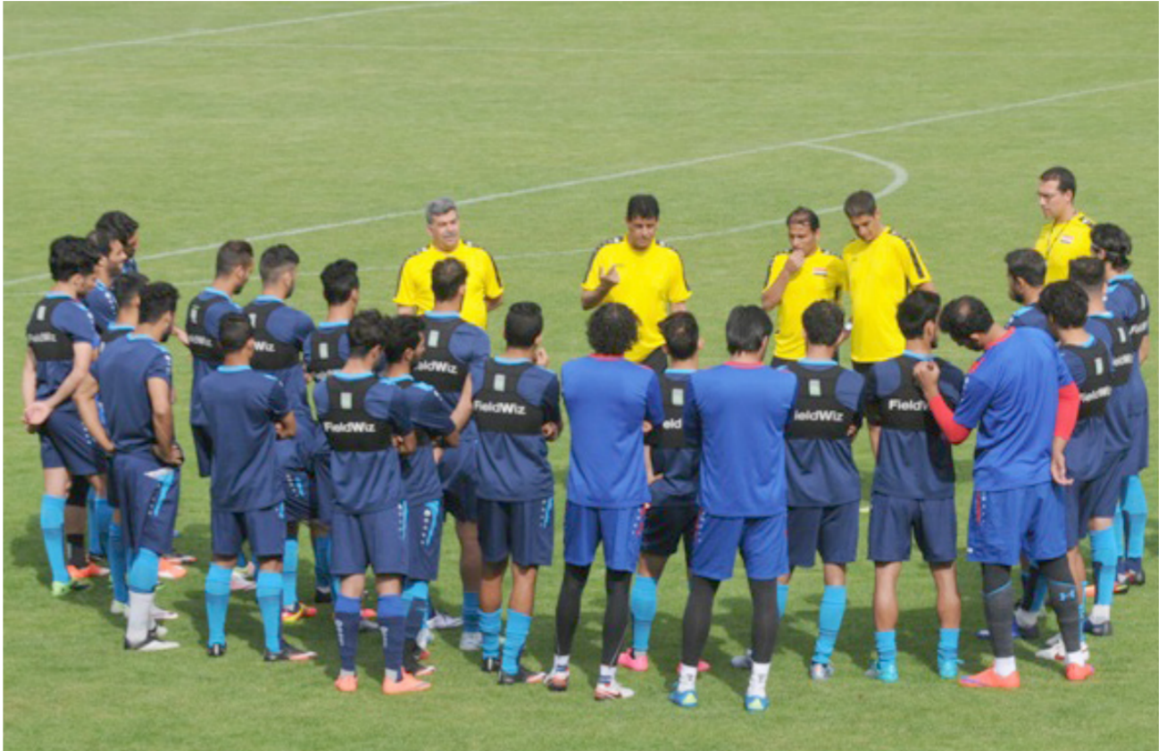
جانب من تدريبات المنتخب الأولمبي