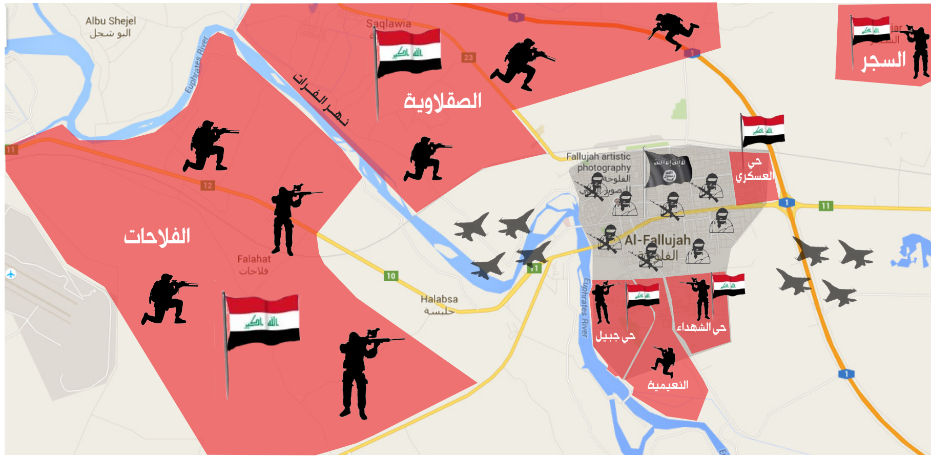
الوضع الميداني لمعركة تحرير الفلوجة "تنفيذ الصباح الجديد - 6/11"

جنوب غرب قضاء الفلوجة، وقال الجلاوي في حديثه لصحيفة "الصباح الجديد" أن "القوات الأمنية