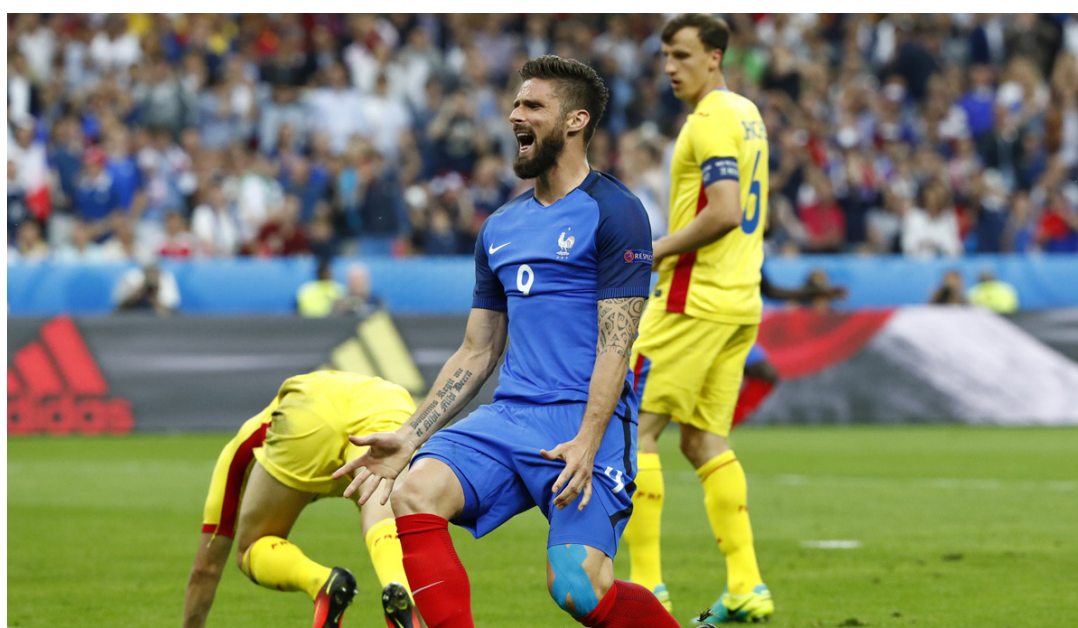
جيرو يحتفل بالهدف الأول لفرنسا

ففي يورو 2004، سقطت البرتغال أمام اليونان بنتيجة 2-1، قبل أن يسقط في المباراة النهائية أمام نفس المنتخب في كبرى مفاجآت الكرة العالمية القرن