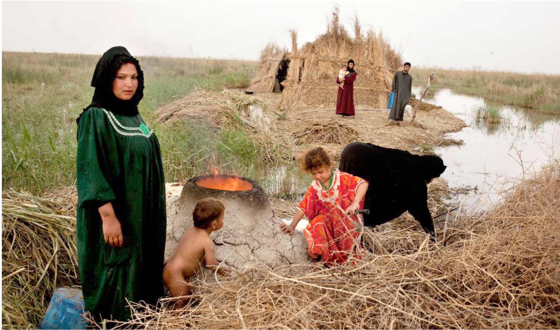
من مظاهر الحياة الاجتماعية في بيئة الأهوار