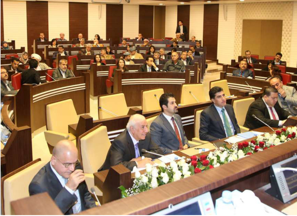
من جلسات برلمان كردستان (أرشيف)

يشار الى ان جزءاً كبيراً من تداعيات الازمة الاقتصادية الخطيرة التي يعاني منها الاقليم وتدهور علاقته مع المركز يتحمله وزير الثروات الطبيعية اشنتي هورامي. الذي أكد مراراً امام برلمان كردستان. ان بيع الاقليم لنفطه مبالغ أكثر من بغداد سيدر مبالغ أكثر من التي تمنحها الحكومة الاتحادية. مؤكداً انه سيجقق خلال فترة قياسية الاستقلال الاقتصادي والاكتفاء الذاتي للاقليم. وهو ما لم يتحقق ونسبب الى جانب ارتفاع ديون حكومة الاقليم الى 20 مليار دولار بتداعيات سلبية وتدهور اقتصادي حُمل نتائجها الكارثية المواطنين والموظفون في الاقليم.