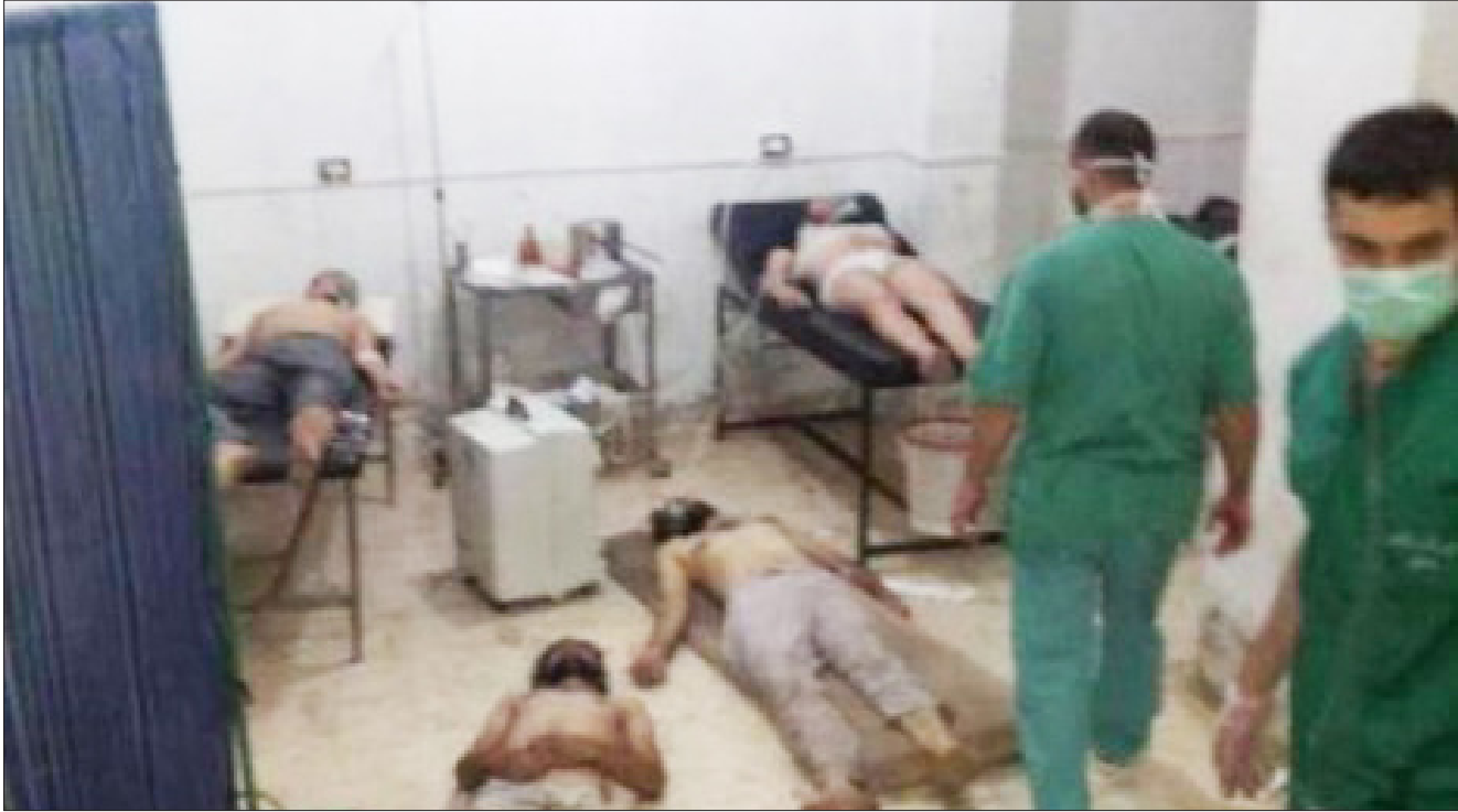
قتلى داعش في مستشفيات الموصل

"الصباح الجديد" تنشر أسماء أبرز قيادات التنظيم الذين شاركوا باجتياح محافظة نينوى من خلال معارك برية مع القوات الامنية من الجيش العراقي و الطيران الحربي للحالف الدولي الامنية من الجيش العراقي و الطيران الحربي. علما انه تم جمع هذه المعلومات من مصادر متطابقة. وادناه اسماهم والقباب ومناصب قيادات داعش الذين شاركوا باحتلال نينوى ولقوا حتفهم طوال السنتين الماضيتين: ١- الارهابي مصطفى عبد الرحمن ابوعللاء. الملقب حجي ايمان. نائب الارهابي عواد ابراهيم البديري (ابو بكر البغدادي). ٢- الارهابي ايداء بنشار السامرائي. الملقب ابو انس. والي ما يسمى ولاية الفرات. ٣- الارهابي رضوان الحمدوني. لقبه ابو جرتاس. والي ما يسمى ولاية نينوى. ٤- الارهابي يونس سالم حسين الجبوري. لقبه ابو حمزة. والي ما يسمى ولاية نينوى. ٥- الارهابي ايوب شيحان الشمري. والي ولاية الجزيرة. ٦- الارهابي ابراهيم الطويل المتيوتسي. مسؤول التسليح والحازن. ٧- الارهابي يونس كتنني العفري. مسؤول اركان ما يسمى المجلس العسكري. ٨- الارهابي ياسر عبود الجبوري. عضو ما يسمى المجلس العسكري ومستشار البغدادي. ٩- الارهابي عبد الرحيم عبدالله - الشهير باسم طه ابراهيم ياسين بكر الغلساني - والي ما يسمى ولاية كركوك. ١٠- الارهابي حسن المصري. الشهير باسم الحارث و لقبه ابو اسما. مصري الجنسية. استاذ للفيزياء ومسؤول ملف التطوير. ١١- الارهابي محمود السبعواوي. لقبه ابو مالك. مسؤول ملف التطوير الكيماوي. ١٢- الارهابي رياض احمد البدراني. منسّق بريد الولايات وعضو ما يسمى المجلس العسكري. ١٣- الارهابي حجي معتز