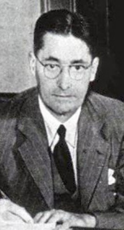
العالية الثانية. حصل فلوري على الكثير من الأوسمة لاسهاماته في العلوم الجراحية وانتخب رئيس الجمعية الملكية في عام 1958.

هو الأخ الأصغر لخمسه اشقاء ولد في مدينة اديلايد جنوب استراليا وقد تعلم هوارد في كلية القديس بطرس، حيث كان طالباً متميزاً، درس الطب من عام 1917 حتى 1921. وفي الجامعة التقى الطالبة اثيل ريد التي أصبحت زوجته وزميلته في البحوث. أكمل فلوري تعليمه في الكلية الجدلدية باكسفورد وحصل على درجة البكالوريوس والحقها بالماجستير في عام 1926. انتخب فلوري لزمالة كلية كمبريدج وبعد عام حصل على درجة الدكتوراه من نفس الجامعة. بعد فتره من اقامة في الولايات المتحدة تم تعيينه رئيساً لقسم علم الأمراض في جامعة شيفيلد عام 1931. وفي عام 1935 عاد الى جامعة اكسفورد.