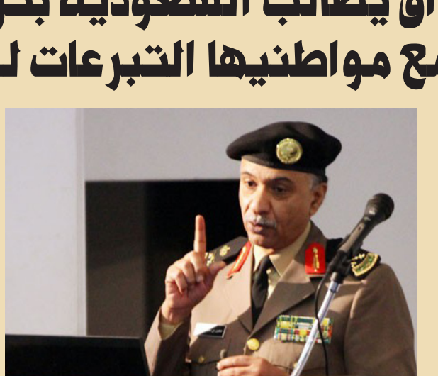
وزير الداخلية السعودية

وذكر بيان لوزارة الخارجية ورد الى "الصباح الجديد" "نتنظر توضيحاً من الحكومة السعودية لما ذكره المتحدث باسم وزارة داخلتها في تصريحاته الصحفية بخصوص وجود حملات تبرعات مالية داخل المملكة لصالح تنظيم داعش الإرهابي سببها تعاطف بعض الأشخاص معه، لما تخلفه هذه الحالة من خرق واضح لقرارات