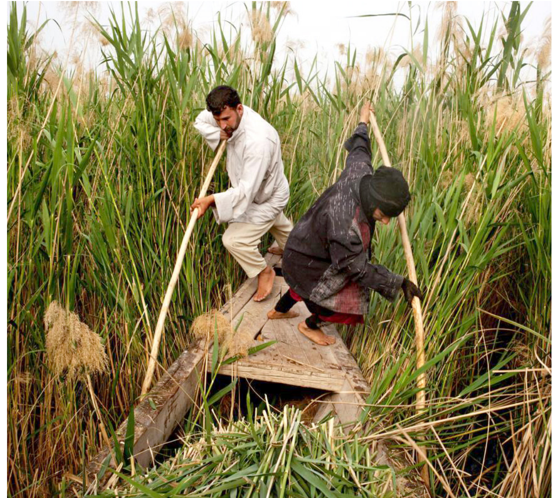
رجل وامه من سكان الأهوار يواجهان صعوبة في حريك زورقهما بسبب المياه الضحلة

الفاطم على مجموعة متكاملة من الأعراف والتقاليد والممارسات التي تعود بعضها إلى آلاف السنين. بعزل عن الحكومات المتعاقبة في البلاد التي لم تكن تتدخل إلا في نطاق محدود جداً. وعلى الرغم من هذا كله تبقى الأهوار كمحيط وبيئة اجتماعية طبيعية، هنئة للغاية، شأنها بذلك شأن آية منظومة بيئية أخرى في العالم، وللتدليل على مدى تلك الهشاشة، فإن استعمال الزورق الصغيرة المزودة بمحركات قد يبدد الحياة ما تحت الماء ويقضي على بيوض وأعشاش الأسماك الصغيرة. كما أن الانقراض الكلي، والبيئية وهجرة الطيور الموسمية وخديد الأنواع المهتدة بالانقراض منها، قد أشار إلى خطورة التغير البيئي الخطير فيما يتعلق بخطوط تلك الهجرة وعرقلتها عندما فقدت أسراب الطيور المهاجرة من أوروبا نحو المناطق الدافئة جنوب شرقي آسيا محطة استراحتها نوع من الطيور المهتدة بالاختفاء من بيئته أو الانقراض الكلي. وإذا كان العالم كله اليوم منشغلاً بثقب الأوزون وتأثيراته الخطيرة على الغلاف الجوي للأرض ودوره في التغيرات المناخية الحاصلة في السنوات الأخيرة، فإن أهمل بيئته الأهوار والتغاضي عن ما تعانيه