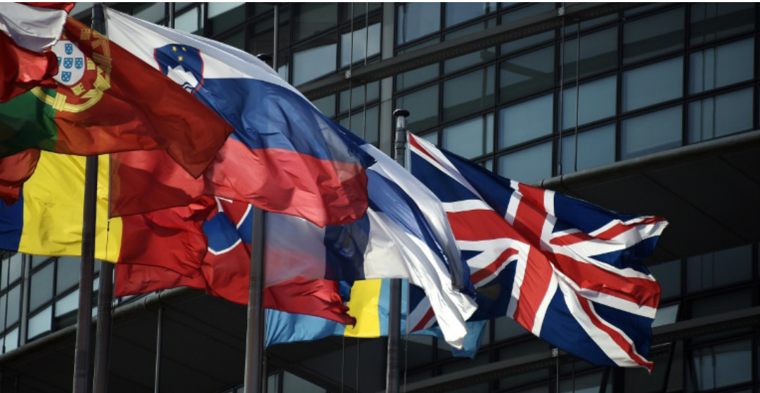
بقاء بريطانيا او خروجها غير محسوم حد الان

وأظهر مؤشر شركة المراهنات «لادبوكز» أمس الأول الجمعة إمكانية فوز المعسكر المؤيد للبقاء في الاتحاد