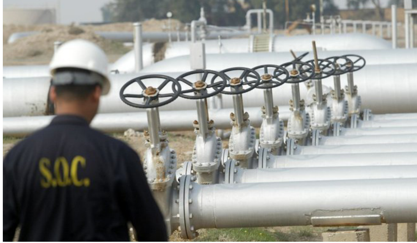
أحد الحقول النفطية في البصرة