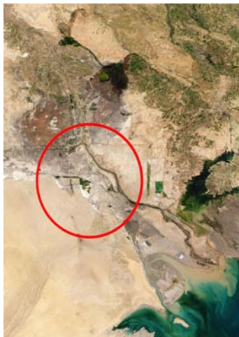
صورتان فضائيتان تظهران اختفاء الأهوار بنسبة 90% في العام 2002 (يسار) وعودة ما يقارب الـ 50% منها في العام 2009 (يمين)

المياه والحيوانات والطيور والأسماك التي تعيش معهم وتشكلهم العيش في تلك البيئة الساحرة. وإذا كانت الأسباب المحلية - الوطنية التي سبقتها في هذا التقرير غير كافية بالنسبة للأمم المتحدة ومنظماتها الدولية التابعة لها. كما أن استعمال الطابوق والمواد الطبيعية، هنئة للغاية، شأنها بذلك شأن آية منظومة بيئية أخرى في العالم، وللتدليل على مدى تلك الهشاشة، فإن استعمال الزورق الصغيرة المزودة بمحركات قد يبدد الحياة ما تحت الماء ويقضي على بيوض وأعشاش الأسماك الصغيرة. كما أن الانقراض الكلي، والبيئية وهجرة الطيور الموسمية وخديد الأنواع المهتدة بالانقراض منها، قد أشار إلى خطورة التغير البيئي الخطير فيما يتعلق بخطوط تلك الهجرة وعرقلتها عندما فقدت أسراب الطيور المهاجرة من أوروبا نحو المناطق الدافئة جنوب شرقي آسيا محطة استراحتها نوع من الطيور المهتدة بالاختفاء من بيئته أو الانقراض الكلي. وإذا كان العالم كله اليوم منشغلاً بثقب الأوزون وتأثيراته الخطيرة على الغلاف الجوي للأرض ودوره في التغيرات المناخية الحاصلة في السنوات الأخيرة، فإن أهمل بيئته الأهوار والتغاضي عن ما تعانيه