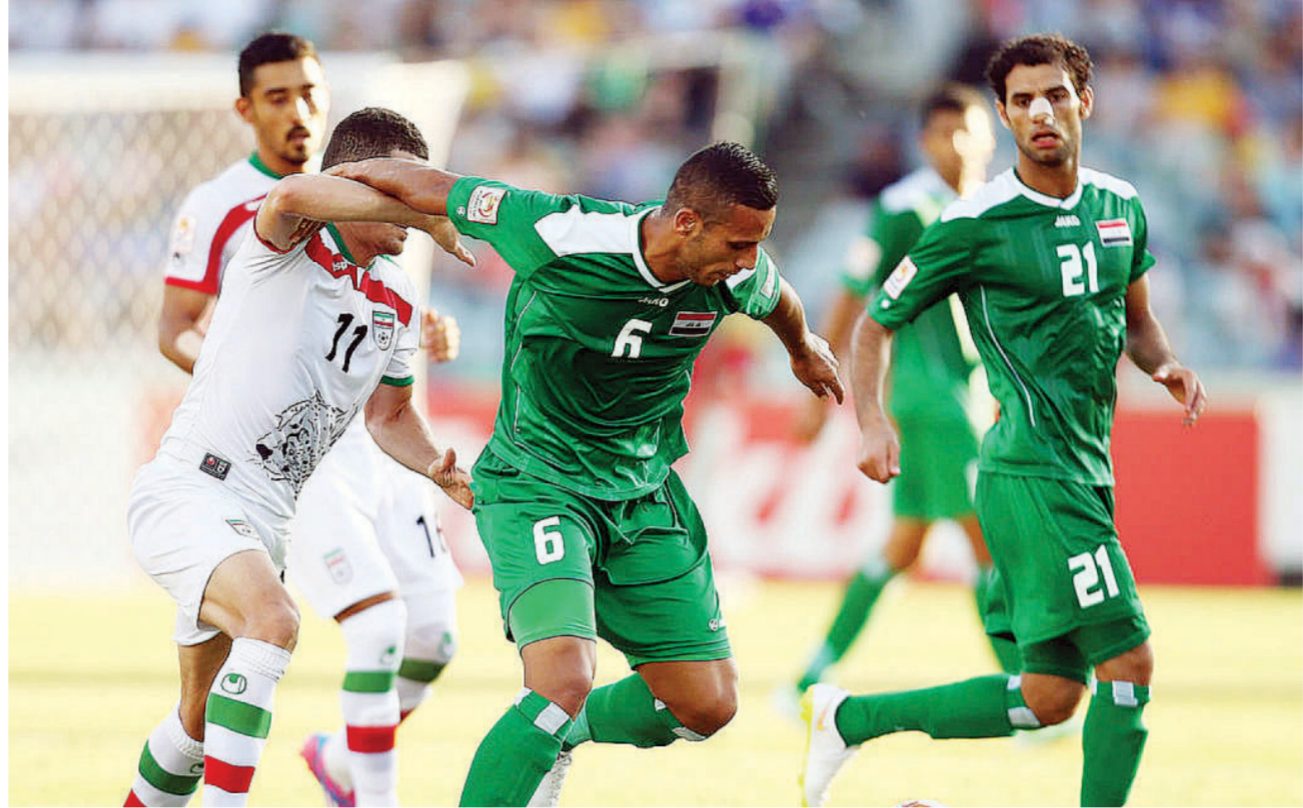
جانب من احدى مباريات المنتخب الوطني