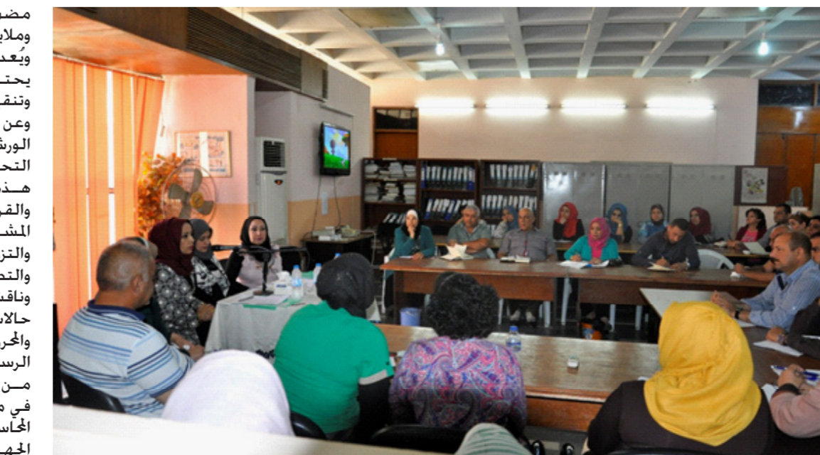
جانب من الورشة

مضمون الجُر ، وفي معناه وظروفه وملابساته تغييراً لا يدركه البصر . ويعد إكتشافه من الصعوبة بحيث يحتاج إلى ممارسة ودراية وبحث وتقريب للوصول للحقائق . وعن مراحل تنفيذ الجريمة تطرقت الورشة إلى مرحلة (التذكير و التحضير والتنفيذ) مع طرق إثبات هذه الجريمة في الإقرار والبيينة والقرائن وعن الفرق بينها وبين الحالات المشابهة في جرائم ( الغش والتقليد والتزوير والتدليس والتحرير والتصحيح وشهادة الزور) . وناقشت الورشة كذلك نماذج من حالات التزوير وهي (الفعلي والنقدي والحجرات والتزوير بالأفعال والمستندات الرسمية ) مشددة على أن الوقاية من هذه الجريمة ولمنع حدوثها تكون في مراقبة الوثائق الرسمية وأهمية المحاسبة والإحالة بضونها بما يدعم الإخادبية وشرح كيفية التعامل مع جدول إسترداد المال العام .