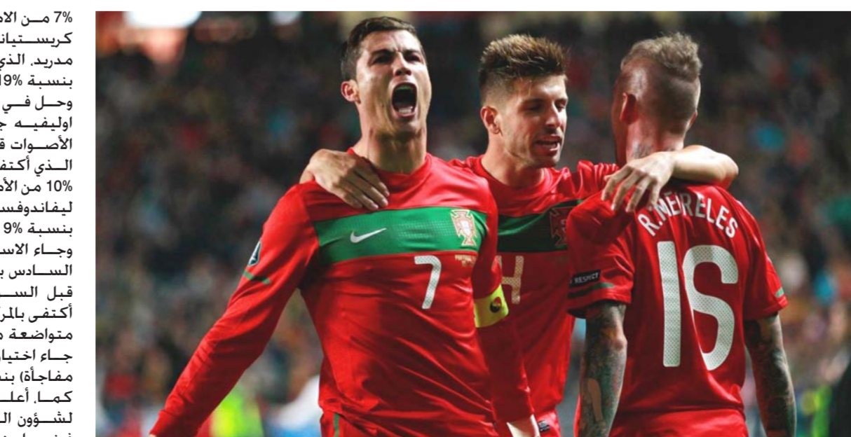
كريستيانو رونالدو.. مرشح لخطف كأس الهداف

7% من الاصوات عن صاروخ ماديرا كريستيانو رونالدو مهاجم ريال مدريد. الذي تواجد في المركز الثاني بنسبة 19%. وحل في المركز الثالث الفرنسي اوليفيه جيرو بنسبة 15% من الاصوات قبل الإنجليزي هاري كين الذي أكتفى بالمركز الرابع بنسبة 10% من الاصوات. بينما جاء البولندي ليفاندوفسكي في المركز الخامس بنسبة 9% من الاصوات. وجاء الاسباني موراتا في المركز السادس بنسبة 4% من الاصوات قيس ابراهيموفيتش الذي أكتفى بالمركز السابع والآخر بنسبة متواضعة من الاصوات (3%). فيما جاء اختيار آخر غير هؤلاء (مهاجم مفاجأة) بنسبة 14% من الاصوات. كما. أعلن وزير الدولة الفرنسي لشؤون الرياضة. تيري بريار. أن فرنسا منعت وضع شاشات عرض خارج الناطق المخصصة للمشجعين.