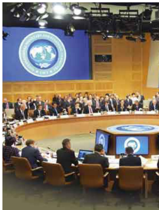
اجتماع سابق لصندوق النقد الدولي

ترجمة: سناء البديري في عدة تقارير تم نشرها في صحيفة يواس اي الاميركية اشار فيها عدد من المراقبين الى ان "هناك اسبابا جعلت العراق يلجأ الى التبرعات الخارجية وعملياً الخطف مقابل فدية ونهب البنوك". وفيما يخص "القاعدة"، أشار غلازير إلى أن التنظيم "عانى كثيراً في تمويله المالي بسبب تشديد المراقبة على أشخاص كانوا يمولونه وكذا الاضطرابات في شبكاته المالية المنتشرة في أكثر من مكان". موضحاً أن "الولايات المتحدة ما تزال ترى وجود تمويل من شبكات في دول خليجية لتنظيم القاعدة وتنظيمات إرهابية أخرى". تنمة ص3