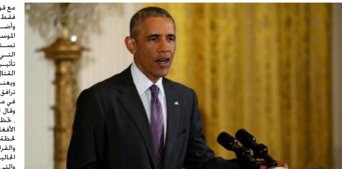
بعد أكثر من عام على بقاء القوات الدولية في أفغانستان

مع قوات العمليات الخاصة الافغانية فقط. وأضاف المسؤول أن السلطات الموسعة يقصد بها فقط أن تستخدم «في تلك الحالات الخاصة التي يمكن لتدخلهم أن يحقق تأثيرات إستراتيجية في ساحة القتال». ويعني ذلك انه يجب ألا يتوقع أن ترافق قوات أميركية الجنود الافغان في مهامهم الروتينية. وقال المسؤول «هذه المرحلة الإضافية تحظى بدعم كامل من الحكومة الأفغانية وستساعد الافغان في لحظة مهمة للبلاد». والقرار انحراف عن القواعد الأميركية الحالية للاشتباك في أفغانستان والتي تفرض قيودا على قدرة القوات الأميركية على مهاجمة المتمردين. وكان مسموحا للجيش الأميركي