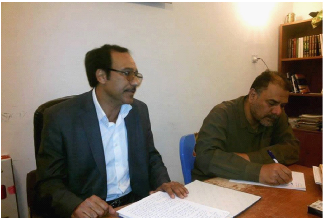
من أجواء الملتقى