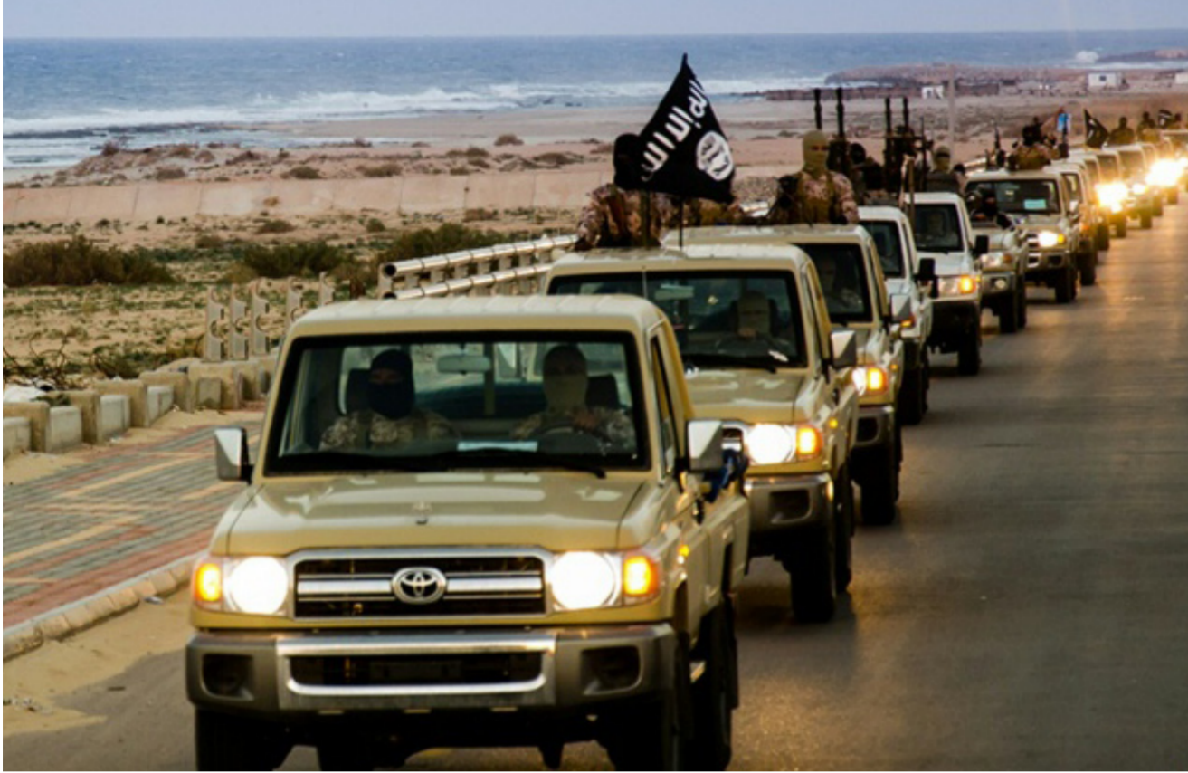
واشنطن تحذّر رعاياها في ليبيا

في الاشتباكات داخل المدينة، وكانت قوات تابعة لعملية البيان المرصوص اقترحت منطقة هراوة من الجورين الجنوبي والشرقي، بعد اشتباكات مع تنظيم «داعش». وكشف مصدر عسكري أن عناصر تنظيم داعش انسحبت شرقاً إلى ما بعد وادي الخنيوة الذي يبعد نحو 25 كم غرب هراوة، مشيراً إلى أنه جار تأمين المنطقة والسيطرة على مداخلها وتحيطها بحنا عن أي الغام أو مفخحات زرعتها التنظيم الإرهابي في المنطقة.