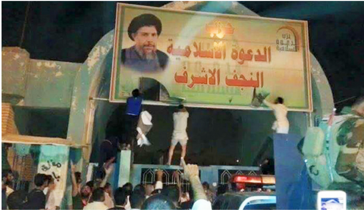
جانب من الاعتداءات على المكاتب السياسية للأحزاب

طالب "المتظاهرين الوطنيين بإعلان البراءة من هذه الأفعال المتطرفة التي تسببت بوضع ضحايا وإشاعة الرعب والقلق في صفوف المواطنين". تنمة ص3