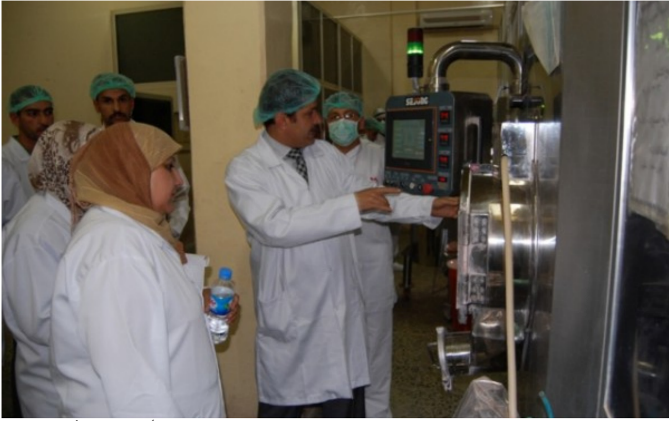
أحد مختبرات الأدوية في سامراء

إجراءات ونتائج الاختبارات لهذه المؤسسة . كما ان قرار صحيح يعتمد على مجموعة من النتائج الاختبارات الصحية والدقيقة. هذا وفي الختام سلم رئيس الجهاز المركزي للتقريب والسيطرة النوعية شهادة اعتماد الأيزو لإدارة الشركة وسط جو من التفات تالت فيه التبركات والتفاني للمساهمين في هذا الأجاز.