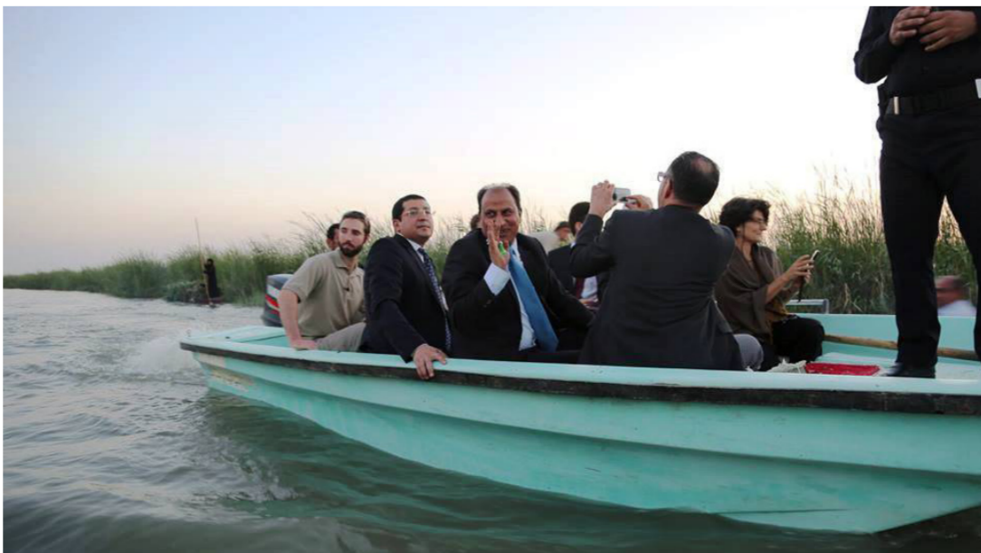
انضمام الأهوار ومواقع الآثار للآلة التراث العالمي

يذكر ان محافظ ذي قار أعلن في العام الماضي ان عملية التصويت على انضمام الأهوار للآلة التراث العالمي ستجرى في منتصف عام 2016 ضمن مؤتمر دولي يعقد في