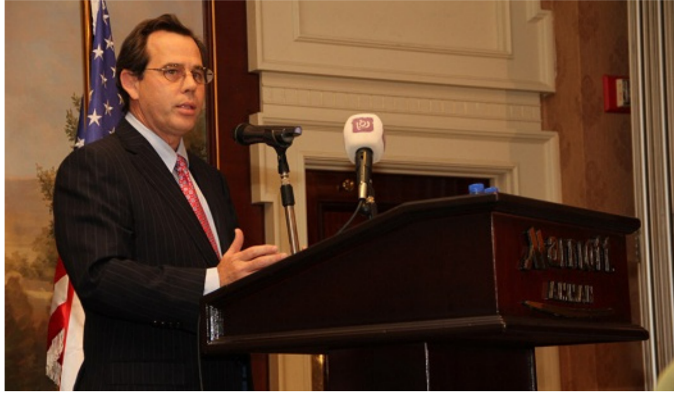
سفير الولايات المتحدة ستيفن جوتز

استكمال البنى التحتية وان تكون التصاميم مدروسة تحدياً كبيراً ما يساهم على المستثمرين البدء فوراً بتنفيذ تلك المشاريع من دون عقبات واختصاراً للوقت. . وتابع، أن «الأرض سوف لن تسلم الا بعد اصدار اجازة الاستثمار الاصلية ويجري التسليم محضر اصولي لتثبيت واقع حال الأرض والتزام المستثمر بالفعالية كما وردت في الخارطة الاستثمارية من دون تغيير» .