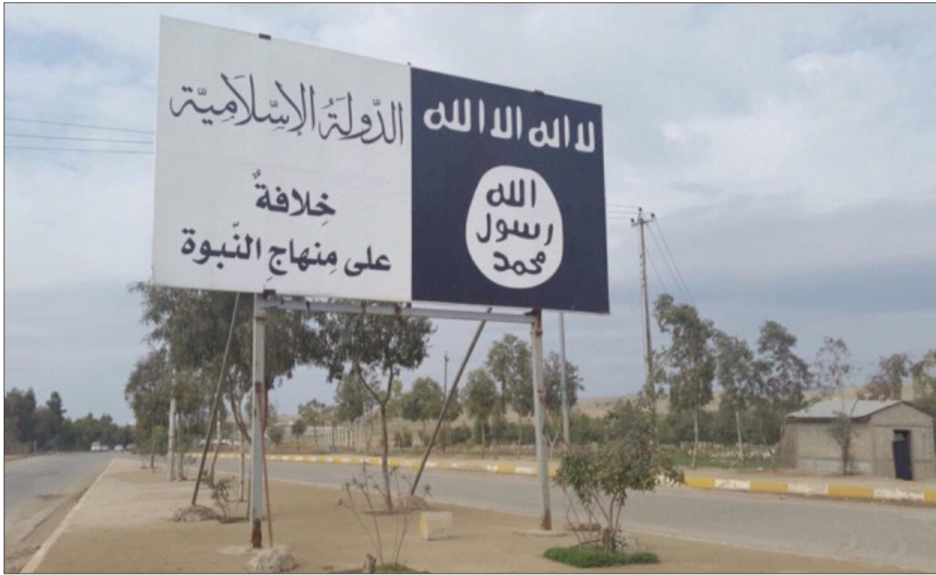
أحد شوارع مدينة الموصل

تنظيم داعش الإرهابي لجأ إلى طريقة جديدة لتجنب قصف الطيران الحربي لعناصره ومواقعه، تتمثل في مد مئات الأمتار من القماش السميك المسمى محلياً (جادر) وتغطية بعض المناطق في طريقة مستعارة تستعملها فصائل المعارضة السورية المناوئة لنظام الأسد في المدن الواقعة تحت سيطرتها