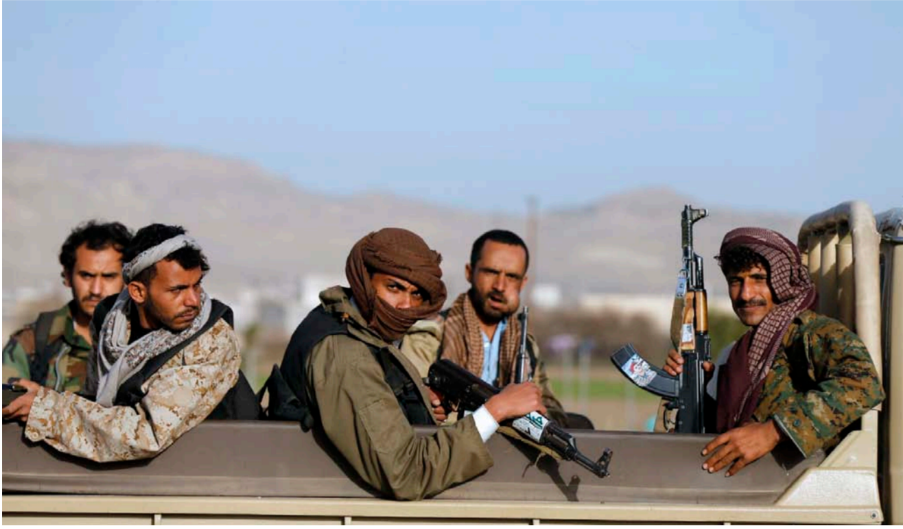
عناصر من الحوثيين في اليمن

إعادة خلط الأوراق السياسية في اليمن، حيث أعلن الحوثيون استعدادهم للتفاوض مع الحكومة اليمنية، وذلك بعد فشل المفاوضات السابقة. وقال الحوثيون إنهم على استعداد للتفاوض مع الحكومة اليمنية، وذلك بعد فشل المفاوضات السابقة. وقال الحوثيون إنهم على استعداد للتفاوض مع الحكومة اليمنية، وذلك بعد فشل المفاوضات السابقة.