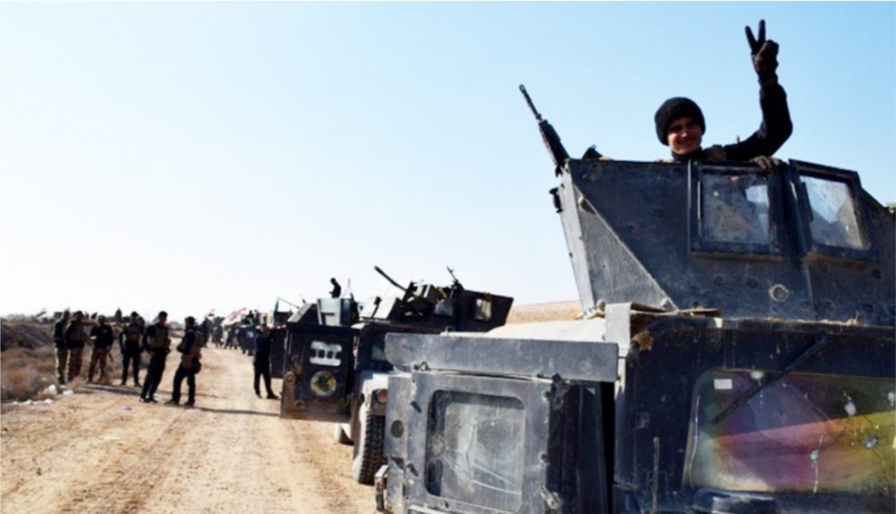
قوات مكافحة الإرهاب في الفلوجة

بالتقدم نحو مركز الفلوجة، مبيّن أن "الوصول إلى المركز عنيفة حيث أن العيوات والألقام والمفخخات والانتحاريين يعملون