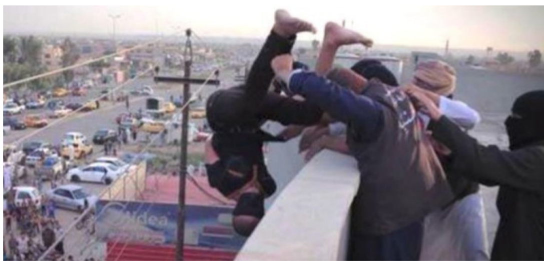
جرائم "داعش" في الفلوجة

كما أوضح المراقبون الى ان «الجلسة النهائية لإجراءات الامم المتحدة أن مفضوية الامم المتحدة حقوق الانسان قد أصدرت في وقت سابق تقريراً جاء فيه: إن تنظيم الدولة الإسلامية «قد يكون ارتكب الجرائم الثلاث الأخطر دولياً وهي جرائم الحرب والجرائم الإنسانية والإبادة» وعدد التقرير جرائم قتل وتعذيب واغتصاب وختني أطفال. ودعا المكتب مجلس الأمن الدولي الى «إحالة الأمر إلى المحكمة الجنائية الدولية لمحاكمة الجناة». علاوة على ذلك. تبنت الجمعية العامة للأمم المتحدة قراراً يوصل بإنقاذ الممتلكات الثقافية. وعدت الجمعية أن تدمير تنظيم داعش الإرهابي