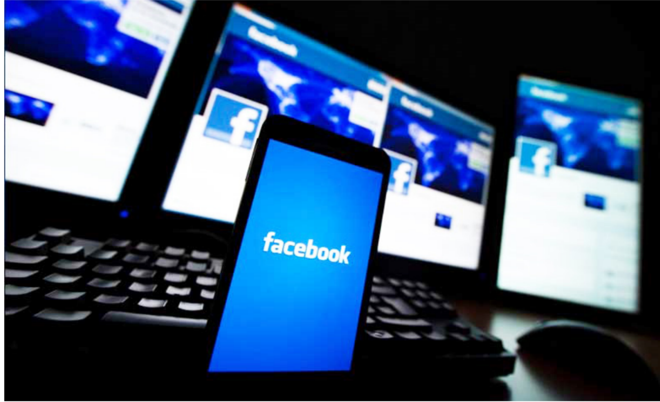
موقع الفيسبوك وصفه الخبراء بالمقهى العالمي

يعد موقع التواصل الاجتماعي «الفيسبوك»، الأشهر من بين المنصات الإلكترونية، حيث وصفه الخبراء بالمقهى العالمي، ففيه ما يقارب المليار ونصف المليار مستعمل أي أن ربع سكان العالم تقريباً يتواصلون معاً عبر هذه الشبكة الواسعة. وكما يدفعك الفضول أحياناً لتصفح حسابات بعض الغرباء، فإن غريزاً آخرين يدفعهم الفضول ذاته لتصفح حسابك. وربما إن كانت نواياهم سيئة البحث عن معلومات تمكنهم من إيذائك لذلك، ينصح خبراء الأمن الإلكتروني مستخدمي فيسبوك من حذف هذه المعلومات أو الأخطاء من حساباتهم. فتاريخ ميلادك يمكن أن يساعد المحتالين في الحصول على معلومات عن حسابك البنكي بنحو أسهل، كما يمكنهم الحصول على مزيد من تفاصيلك الشخصية. وبالنسبة لرقم هاتفك الخاص فإن السبيل الواسع من حال نشرته هو أنك ستلتقي معاكسات هاتمية، إما السنياريو الأسوأ فهو أن متصلاً سيطاردك باستمرار. أما ما يخص عدد أصدقائك على فيسبوك فيقدر علماء النفس أن عدد الأصدقاء الذين يمكنك الحفاظ على علاقتك بهم يجب ألا يزيد على 150 شخصاً. لذلك عليك حذف الباقيين.