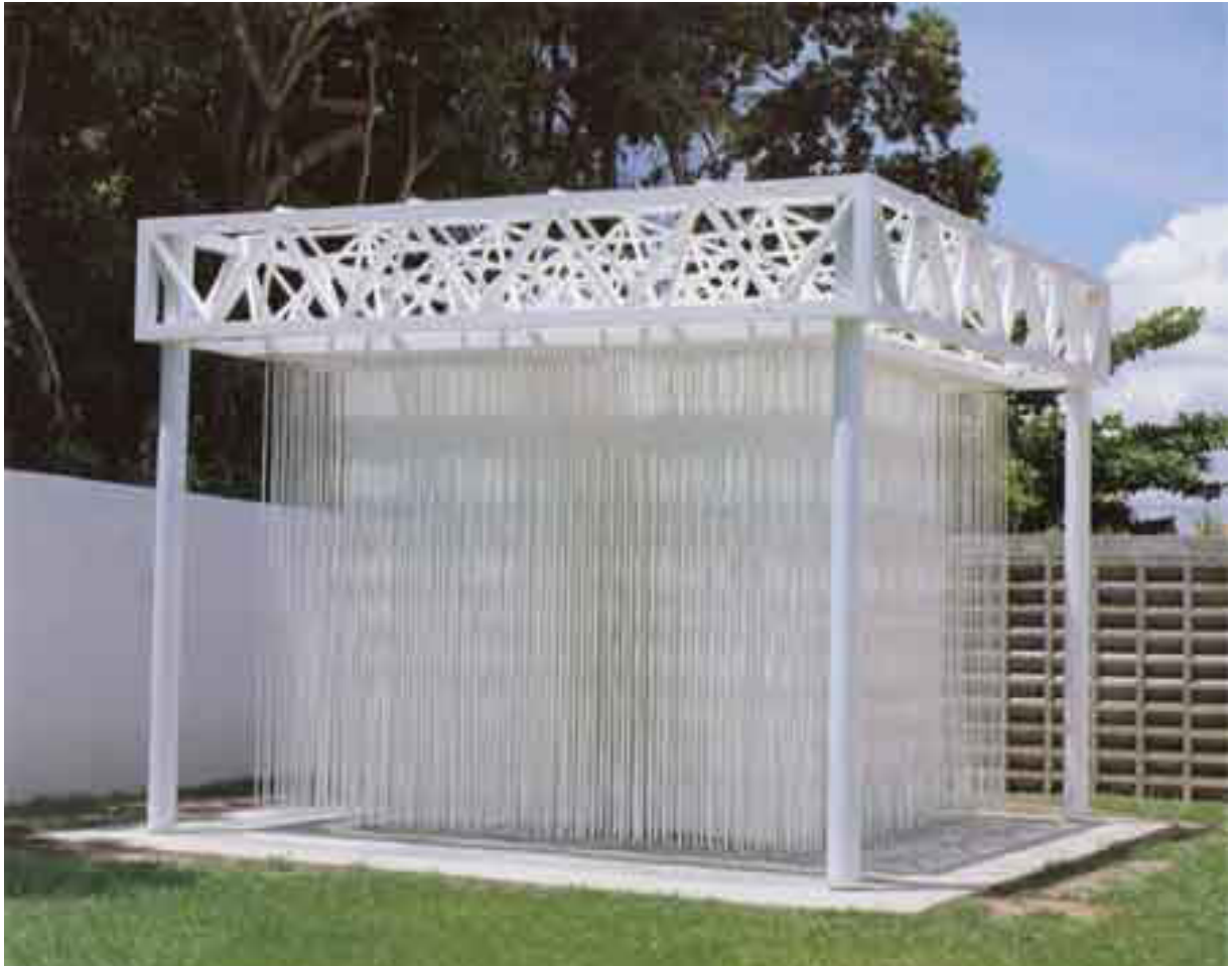
أحد أعماله الفنية

الأسلاك والقضبان المعدنية في خلفية العمل. فبدأت اللوحة تأخذ بعدا نحثيا عندما علقت الحيوط و القضبان المعدنية في الجبهة الخلفية. هذا التقسيم و يتمثل هذا العمل في سلسلة من الأعمال النحثية التي توجي بشكل الصندوق التي توضع أمامها. فتأسست أعماله من ثم على إقامة علاقة مثير و مثار بينها وبين المشاهد التي أسهمت في إثارة أحاسيس مقلقة و مريكة. لتتحول بهذا المستوى إلى نوع من الشرابا. لكن «سوتو» أراد مزيد تفعيل الحركة و ذلك باعتماده على الكهرباء التي فعلها من أجل مزيد تفعيل الحركة داخل العمل التي من شأنها أن تخلق تفاعلا مع المشاهد و كان ذلك في متحف الفن الحديث في مدينة «سويوداد بوليفسار» سنة 1973. و الذي عرض فيه جملة من أعماله السلكنية مع العديد من الأعمال التي اعتمد فيها على الطاقة الكهربائية .