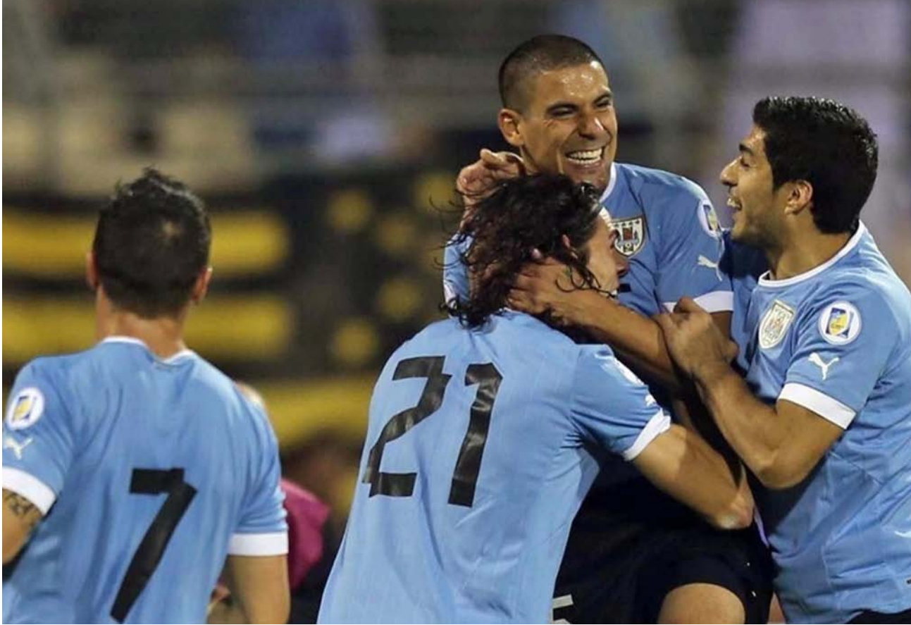
سواريز مصدر قوة الأوروغواي

وتعول فنزويلا على مجموعة من اللاعبين المحترفين في أوروبا مثل روبرتو روزاليس وخوان بابلو انيور (ملقة الأسباني) وأوسفالدو فيسكاروندو (نانت الفرنسي) وتوماس رينكون (جنوى الإيطالي) وخوسيف مارتينيس (تورينو الإيطالي) وسالومون روندون (وست بريمتش البيون الإنكليزي).