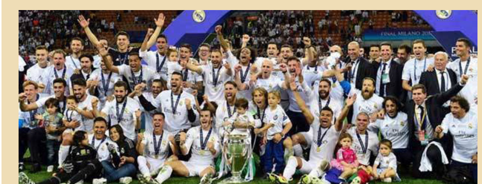
ريال مدريد يهدي فوزه الى شهداء العراق

العراق". وكان نادي ريال مدريد أهدى فوزه بلقب دوري أبطال أوروبا لعائلات