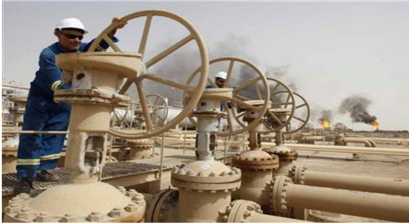
العراق يسعى لتعزيز حصته السوقية قبل أيام من اجتماع أوبك هذا الأسبوع

تعطل الإمدادات من أماكن أخرى والطلب الموسمي القوي. وذكرت ثلاثة مصادر مطلعة على الأمر أن شركة تسويق النفط (سومو) خصصت خمسة ملايين برميل إضافي في خام البصرة الخفيف خميل حزينان لشركاء في أنشطة المنبع من بينهم برونشائنا وإيني ولوك أويل. وتحصل الشركات الأجنبية على مستحقاتها بالنفط بمقتضى عقود خدمة فنية مع سومو لكن المدفوعات تأخرت بعد أن تسبب تراجع سعر النفط في الضغط على ميزانية العراق. وقال مصدر بقطاع النفط في الخليج إن النفط الإضافي تقرر «بسبب ضغوط متعاقدي الخدمة الفنية». وأضاف أن العراق ملتزم أيضاً