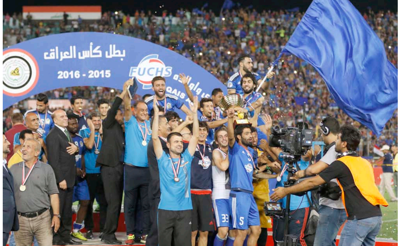
الجويون يحتفلون بلقب الكأس

وبارك وزير الشباب والرياضة لآذار ومدري ولأعبى وجماهير فريق القوة الجوية إجازهم بالحصول على لقب كأس العراق لكرة القدم في مواجهة التي مثلت عرسا كرويا اخر من عراس الرياضة العراقية تزين به ملعب الشعب الدولي عكس للعالم اجمع ان العراق محب للعبة والحضور الجماهيري والنجاح التنظيمي في المباراة هو رسالة بالغة الى فيفا بان العراق قادر