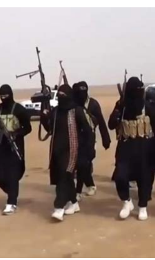
داعش أخطر الجماع الإرهابية في الشرق الأوسط

رؤوس 17 ألف شخص من الرجال والنساء والأطفال (2). وفي الحرب العالمية الأولى. قامت حركة تركيا الفتاة بذبح أكثر من مليون أرمني. بما فيهم النساء والأطفال وكبار السن. ليخلقوا امرة تركية نقية. السوفيت البلشفيك. الخمير الحمر والجيش الاحمر كلهم استعملوا الارهاب المنهجي لتطهير الانسانية من الفساد. والنشوء نفسه. استعمل داعش العنف لتحقيق هدف واحد محدد وواضح يستحيل المجازة من دون الذبح. وبهذا. فهو تعبير آخر عن