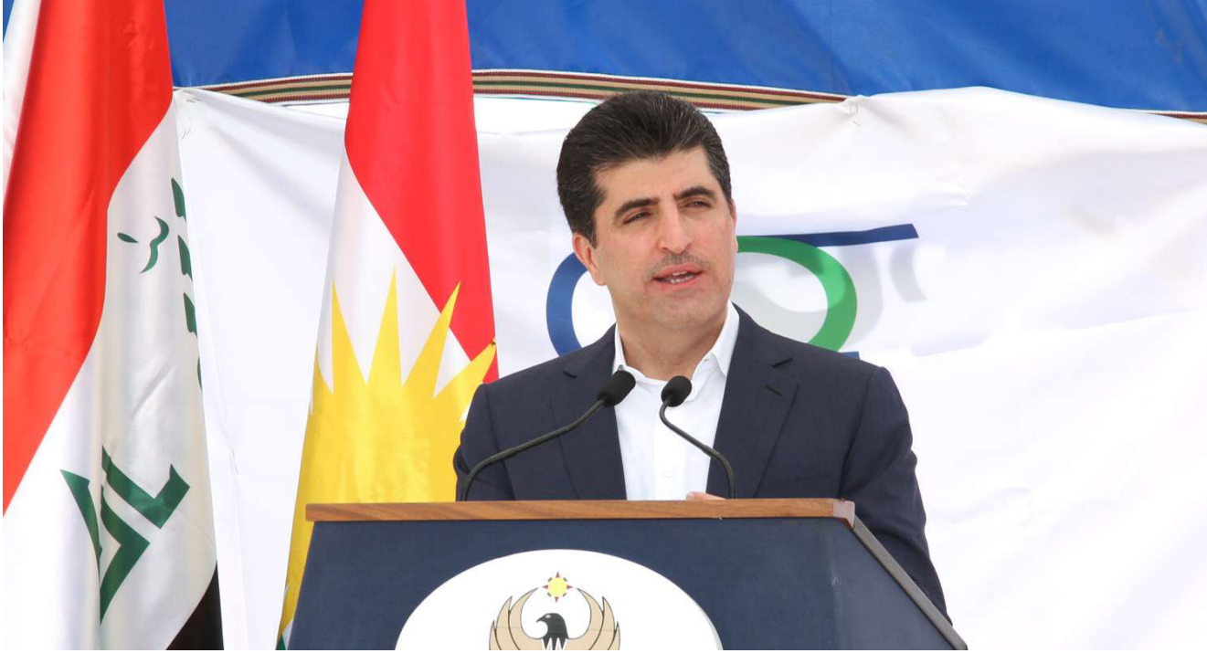
رئيس حكومة إقليم كردستان نيجرفان بارزاني

الادارية والاقتصادية للتخفيف من تداعيات الازمة الاقتصادية الخانقة التي تصف بها. بضمنها زيادة الضرائب والرسوم، وتطبيق نظام الادخار الاجباري على موظفي القطاع العام، ما خلف حالة شديدة من الاستياء والسخط الشعبي. خرج على اثره الموظفون بتظاهرات عارمة وقاطعوا الدوام الرسمي وتعطلت بموجبه اغلب مؤسسات حكومة الاقليم، التي لم تعر اهمية للاعتراضات والانتقادات الشديدة التي وجهت لها ما افقدها ثقة الموظفين والموطنين على حد سواء، الذين يعانون من تأخر مستمر وتخفيض رواتبهم الشهرية الى اكثر من النصف، وانعدام الخدمات وانخفاض شديد في مستوى دخل الفرد. تسبب بسبب الاسواق وتوقف شبه كامل في التعاملات التجارية.