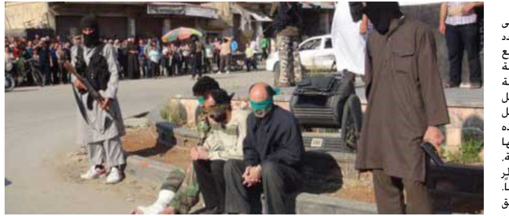
عناصر داعش تخرب الحياة المدنية

للدول العربية. داعيا الرئيس كارتز إلى التغيير في الشرق الأوسط.