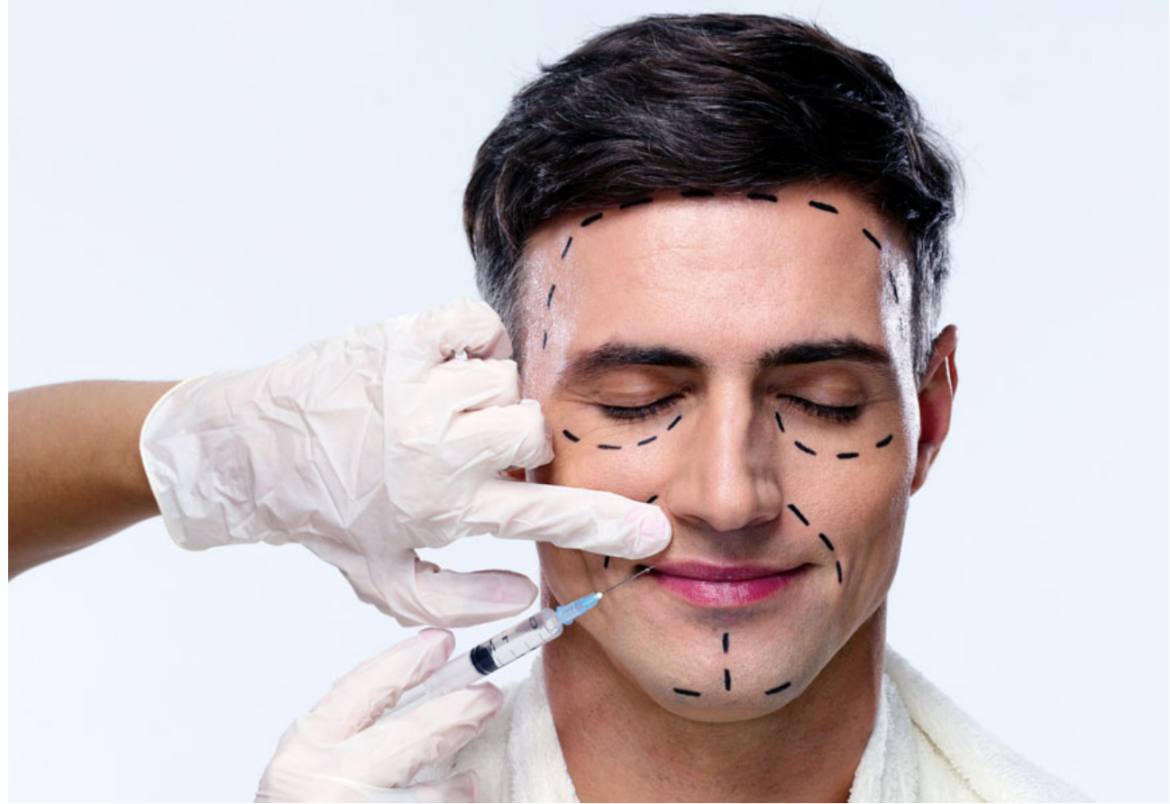
جراحات تجميل الوجه

بعد أن كان التجميل بالنسبة للرجل مقتصرًا على ارتياد صالون متخصص ليلية زفافه مرة واحدة في العمر. أصبح «الجنس الخشن» الآن ينافس النساء على ارتياد صالونات التجميل للقيام بأقنعة تنظيف الوجه وملع الشفاه وصيغة الشعر وكريمات التجاعيد. والأدهى أن الرجال خولوا إلى زياتن للعبادات المتخصصة في شيفط إلى ذلك من جراحات ارتبطت في أذهان الكثيرين بالجنس اللطيف. وقد كشفت إحصائيات حديثة أن نسبة مرتادي عيادات التجميل من الرجال ارتفعت بنسبة 35 بالمئة في السنوات الأخيرة. وهو ما يشير تساؤلاً عما إذا كانت هذه الهجمة التجميلية للرجال هدفها فعلاً تحسين المظهر أم أنه تقليد أعمى لا تمت للمجتمعات العربية بصلة. إذ لم تعد المرأة وحدها التي ترغب في تقليد المشاهير فالرجل أيضاً لديه اهتمامات أخرى. جعله يذهب إلى الصالونات بصورة مستمرة. ولم تعد تلك الصالونات مجرد رفاهية وإنما ضرورة. حيث جعل الرجل أكثر جاذبية وثقة في نفسه حسب رأيهم.