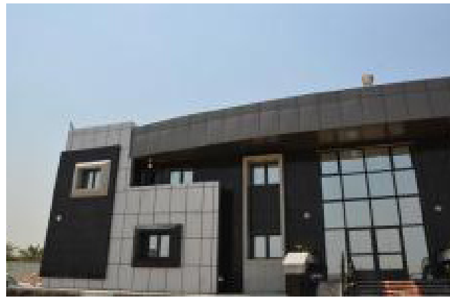
مبنى قسم الجيولوجيا

العاملة العراقية الوطنية. كما ان الشركة متخصصة بإنشاء المشاريع الإنشائية ( مشاريع صناعية، مستشفيات، مدارس، مجمعات سكنية، فنادق، مجمعات تجارية، مخازن عامة، موانئ بحرية، إنتاج وتنفيد ركائز خرسانية للأسس ) قامت بإجاز العديد من المشاريع في محافظات العراق، ولها خبرة خاصة في الأعمار وتأهيل المباني المتضررة في العراق إضافة إلى جودة التنفيذ ملاكاتها الهندسية والفنية المتميزة وبشتى الاختصاصات .