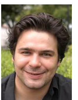
مارك ليونارد مدير المجلس الأوروبي للعلاقات الخارجية