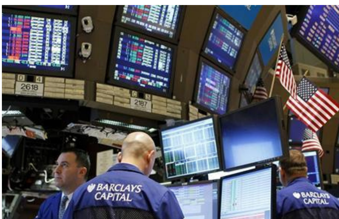
مجلس الاحتياطي الفيدرالي ينوي تشديد سياسته النقدية تدريجاً في الأشهر المقبلة

وقالت إنها تتوقع أن تواصل سوق العمل تحسنها وأن يرتفع التضخم من جديد ليبلغ المستوى الذي حدهه المجلس هدفاً وهو اثنين في المئة. وأضافت في كلمة ألقاها في جامعة هارفرد ليل أول من أمس: «قلت الشهر الماضي وأكثر أن من 26 و27 تموز لكن من دون أن يلحقه مؤتمراً صحافياً لرئيسه».