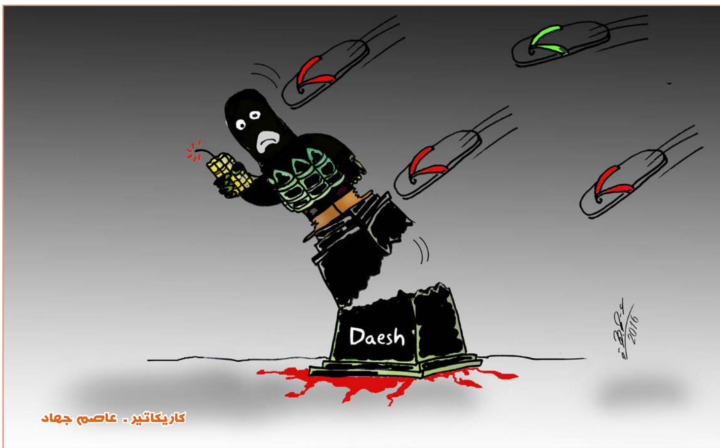
كاريكاتير - عاصم جهاد