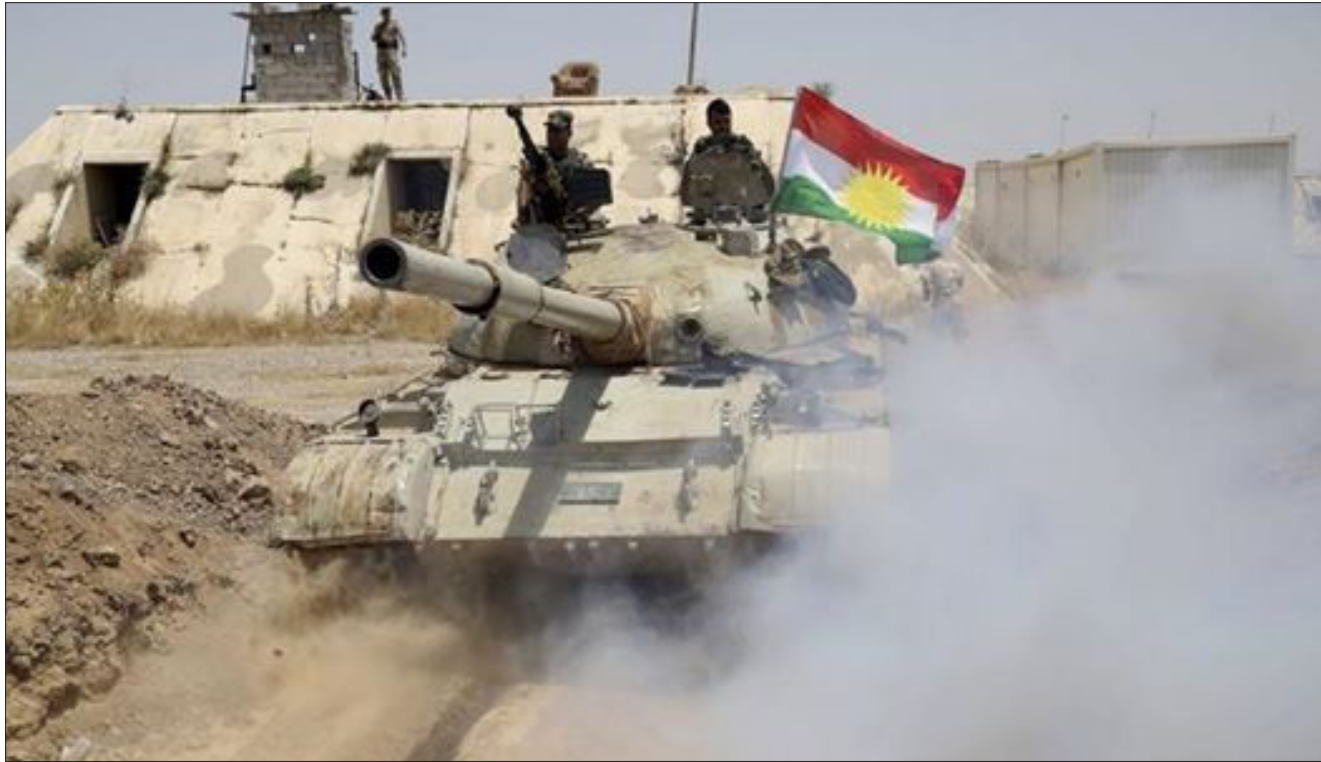
قوات البيشمركة "رشيف"