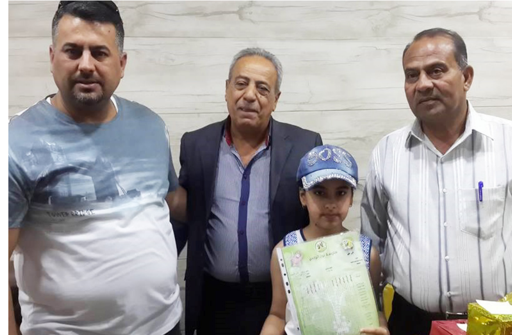
جانب من احتفالية توزيع الهدايا بين متفوقي مدارس نور الرحمن

نهتم بالموهوبين والمتميزين وننهض بالمتميزين ونصوّب خطاهم ولفتوا الى انه مع بداية كل سنة دراسية جديدة لابد ان نستضيء بقول معلم البشرية (ص) : (كلكم راع . وكلكم مسؤول عن رعيته) . فمع جُذ العام الدراسي . تتجدد مسؤوليته من هم في ميادين التربية والتعليم . فهناك الوزير . وهناك المدير . وهناك المعلم . وهناك ولي الأمر . وهناك الطالب . وإذا أدرك جميع هؤلاء أمانة المسؤولية العظيمة الملقاة على عاتقهم . فإنهم سيسعون جاهدين لتحقيق الغايات التعليمية النبيلة ونحن منذ الأيام الأولى لبدء العام الدراسي الجديد نبذل جهوداً تربوية مهمة لغرس حبّ العلم في قلوب طلابنا . ونتمنّى في تعليمهم يسير طرق وأساليب متعددة . ونعوّدهم على أن يستمعوا منا ومن وسائل الاعلام والكتب للدارسين على القراءة من الصف الرابع او الخامس والسادس