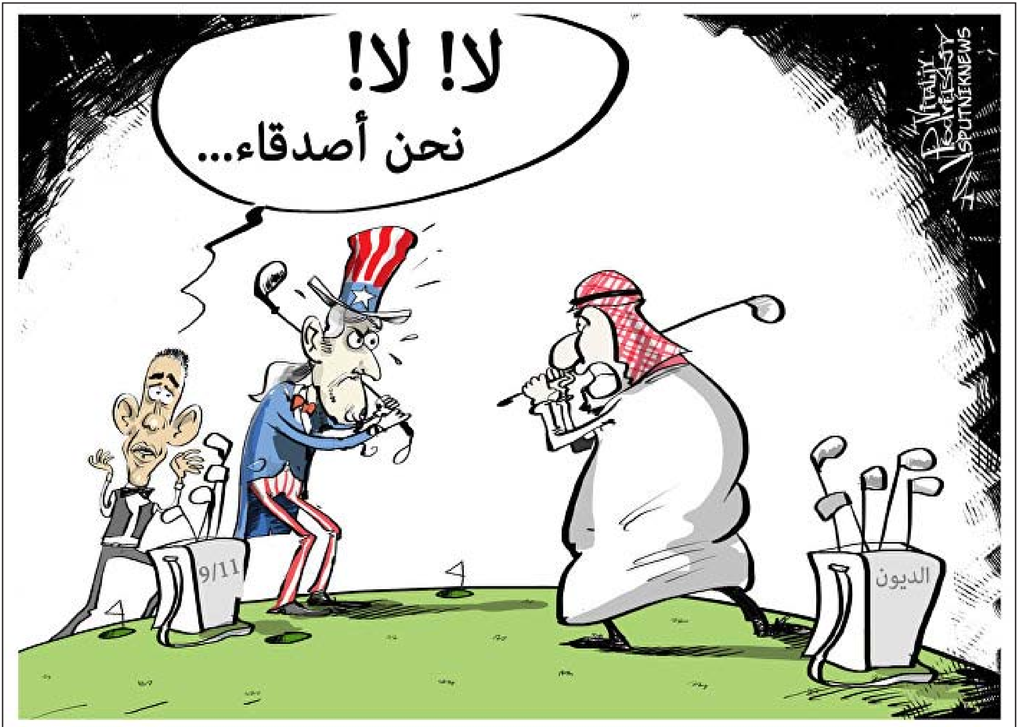
عن موقع «كارتون سياسي»