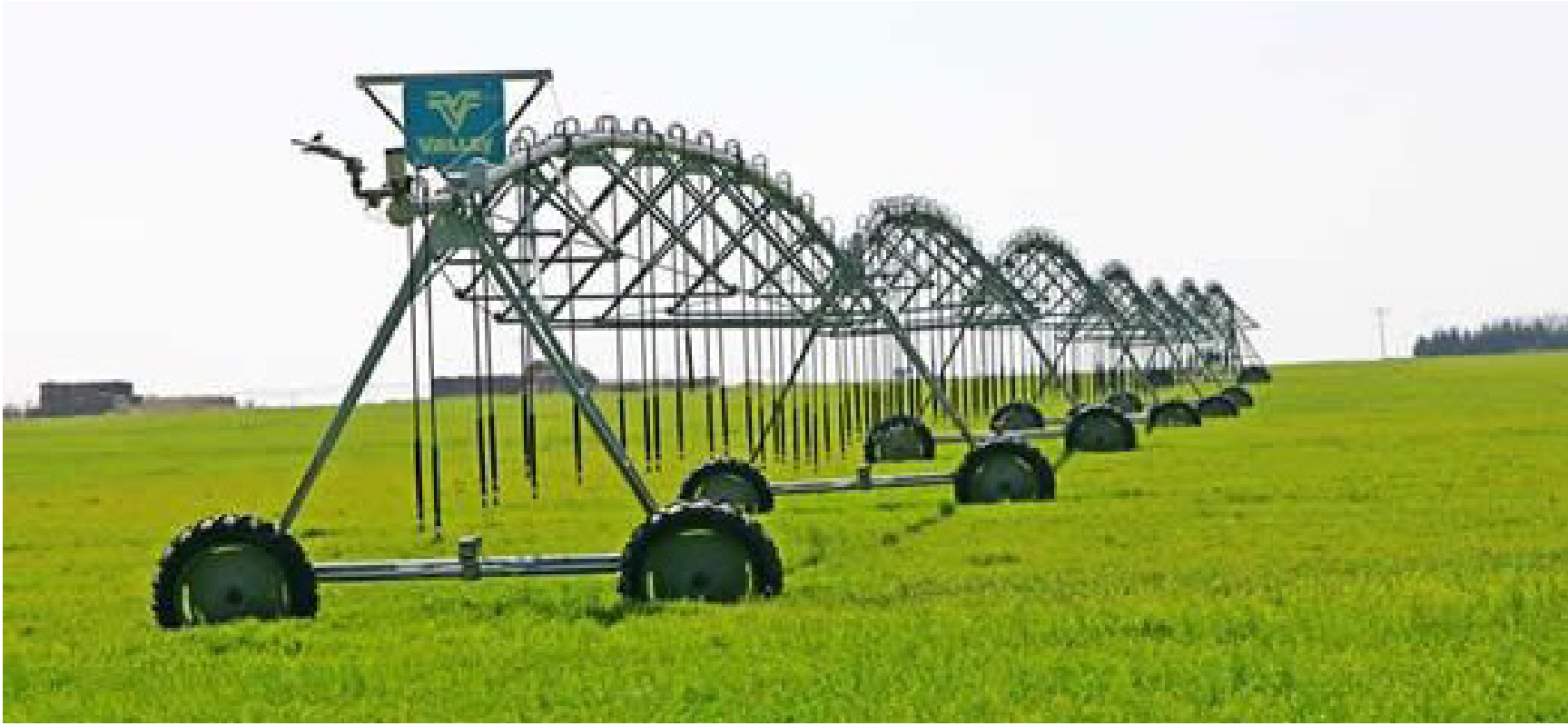
الأراضي الزراعية في صلاح الدين

نجحت وزارة الزراعة في جهودها الحثيثة لمكافحة التصحر ووقف زحف الكثبان الرملية على مراكز المدن ، فضلاً عن نجاح مساعيها لتوسيع تجربة الزراعة المحمية من أجل توفير أنواع الخضروات في غير موسمها وهو ما أدى إلى الوصول إلى الاكتفاء منها بنسبة 90 % ضمن محافظات عدة ، وكذلك تبني خطط علمية لتخزين مياه الأمطار بهدف الاستفادة منها لتنمية القطاع