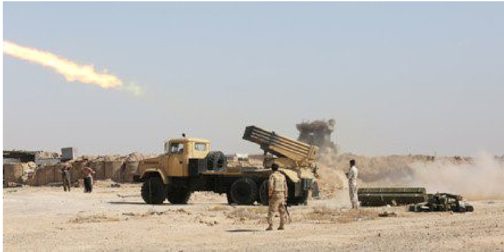
القوات الأمنية تدك أوكار داعش خلال عمليات تحرير الفلوجة

تصمد وتم تدميرها بصواريخنا الحديثة". مبينا إن "داعش" بدء عمليات اقتحام الفلوجة بعلاج مفاخاته". وأضاف المصدر في حديثه لصحيفة "الصباح الجديد" إن "مفخحات داعش لم