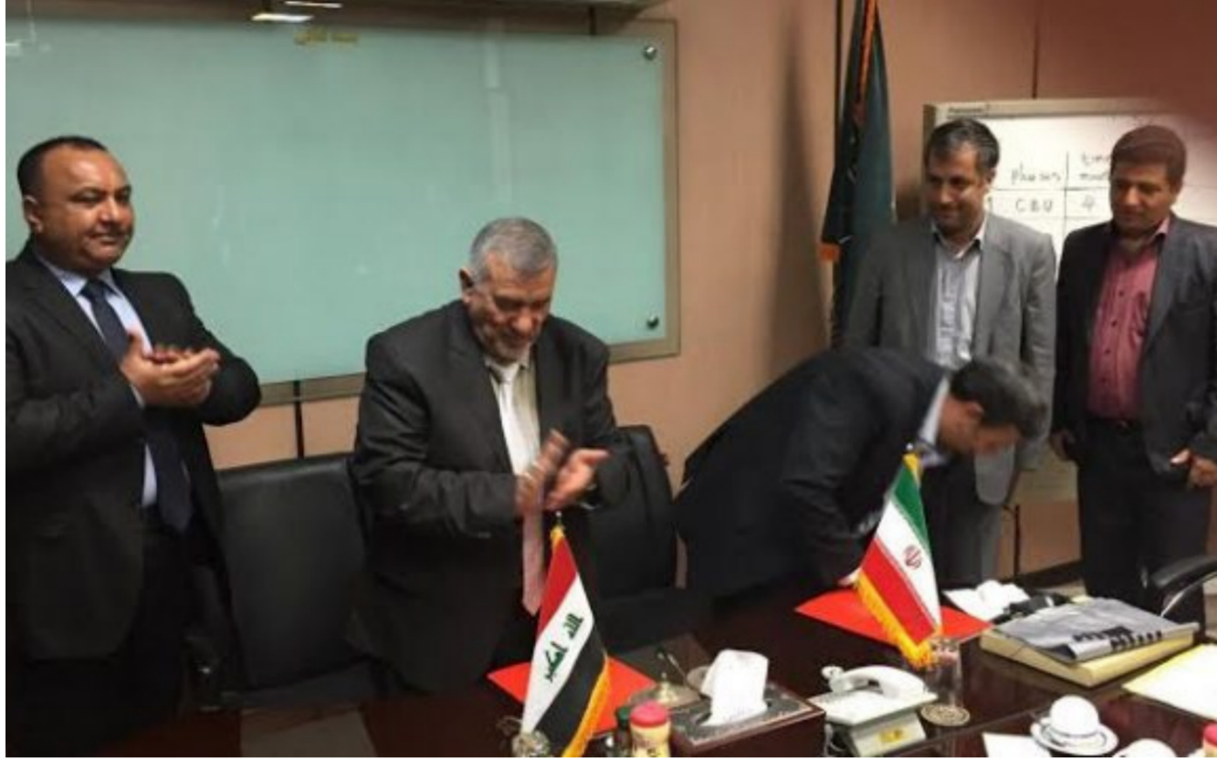
جانب من توقيع الاتفاقية

اقترص على إنشاء قريتين في كل محافظة بواقع (50) دوراً لكل قرية تضم (110) دوراً بمساحة 250 متراً مربعاً إضافة إلى إنشاء مركز للشرطة وآخر صحي وجامع، مشيراً إلى أن نسبة الأجاز فيها بلغت مراحل متقدمة، بيد أن العمل متوقف في الوقت الحاضر لاكمال ماتفى منها، عازياً ذلك إلى عدم توفر التخصيصات المالية لها.