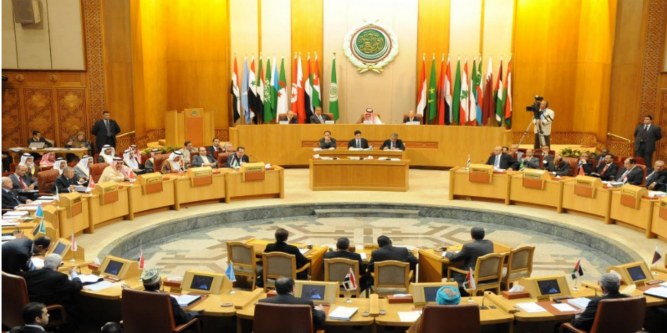
وزراء الخارجية العرب في القاهرة

قبول الحلول الانتقالية، ومشروع قبول الدولة ذات الحدود المؤقتة، ورفض الاعتراف بإسرائيل كدولة يهودية، ورفض تكريس نظام الفصل العنصري الإسرائيلي (الأبارتيد) القائم حالياً. ودعا المجتمع الدولي إلى إلزام إسرائيل، قوة الاحتلال، بقرارات الشرعية الدولية، وميثاق الأمم المتحدة، وعدم انتهاك القوانين الدولية، ورفع حصارها الظالم عن قطاع غزة، وتنفيذ التزاماتها بموجب الاتفاقيات الدولية والغنائية، وفي هذا الإطار، فإن مجلس الجامعة يحدد دعم قرارات المجلس المركزي لمنظمة التحرير الفلسطينية الداعية إلى إعادة النظر في كل العلاقات السياسية والاقتصادية والأمنية الفلسطينية مع إسرائيل.