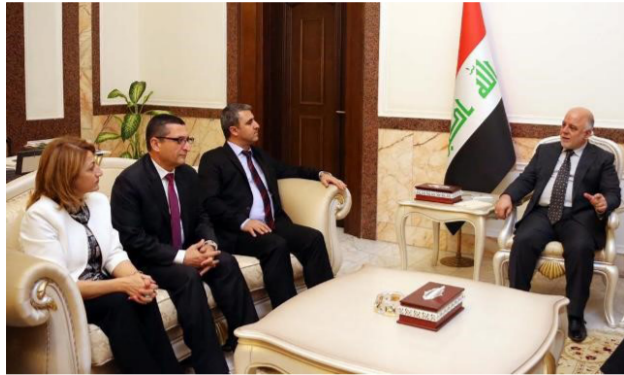
العبادي يستقبل وفد الكتل الكردستانية

بغداد - الصباح الجديد: بحث رئيس الوزراء حيدر العبادي ورؤساء الكتل الكردستانية في مجلس النواب، الوضع السياسي والاقتصادي فضلا عن "الانتصارات" المحققة في مدينة الفلوجة، فيما أبدى رؤساء الكتل دعمهم للمشروع الإصلاحي للعبادي. وقال المكتب الإعلامي للعبادي في بيان ورد إلى "الصباح الجديد" إن الأخير "استقبل رؤساء الكتل الكردستانية في مجلس النواب العراقي، وتم في اللقاء بحث الوضع السياسي والانتصارات المحققة على عصابات داعش في قاطع الفلوجة وبقيّة القواطع والتحديات التي تواجه البلد ولا سيما في المجال المالي والاقتصادي ودعم الإصلاحات الحكومية". وأضاف البيان، أنه "تم التأكيد على