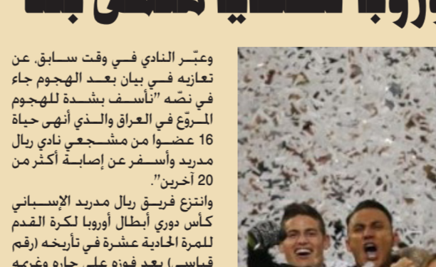
ريال مدريد يحتفل بتوجيهه بلقب بطل أوروبا

ريال مدريد يحتفل بتوجيهه بلقب بطل أوروبا وتابع "كل حي لمن يقف مع ريال مدريد برغم الأوضاع الصعبة". وشهد قضاء بلد، في (12 أيار 2016)، مقتل ثمانية أشخاص وإصابة 20 آخرين إثر قيام مسلحين بهاجمة مقهى شعبي في القضاء فيما الإسباني.