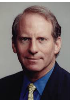
ريتشارد هاس مدير التخطيط السياسي السابق في وزارة الخارجية الاميركية (2001-2003)

يصادف هذا الشهر مرور مائة عام على إبرام اتفاقية سايكس-بيكو. الاتفاق البريطاني الفرنسي السري الذي أطلق سلسلة من التعديلات دامت عشر سنوات لحدود الشرق الأوسط بعد سقوط الإمبراطورية العثمانية. وكانت أغلب التعليلات التي تناولت هذه المناسبة سلبية. فأشارت إلى أن الاتفاق يتحمل قدراً كبيراً من اللوم عن ارتفاع وتيرة الصراعات في المنطقة ودوامها. بيد أن هذا التفسير يكاد يحاكي الكاريكاتير. إذ كان هدف مارك سايكس وفرانسوا جورج بيكو وضع خطة من شأنها تمكين بريطانيا العظمى وفرنسا من تجنب المنافسة المدمرة في الشرق الأوسط. وقد لجأ إلى حد كبير فقد لجأ تصميمهما في منع المنطقة من التمزق بين القوتين الأوروبيتين. وظل باقياً لمدة قرن من الزمن. من المؤكد أن العديد من الخطوط الحدودية التي رسمتها اتفاقية سايكس-بيكو عكست صفقات عُمِدَت في أوروبا وليس الحقائق الديموغرافية أو التاريخية المحلية. ولكن هذا لا يجعل الشرق الأوسط فريداً من نوعه: ذلك أن أغلب الحدود في شتى أنحاء العالم لا تدين بارتها لتصميم مدروس أو اختيار شعبي بقدر ما تدين خليط من العنف والطموح والجغرافيا والمصادفة. الحقيقة غير السارة هنا هي أن الشرق الأوسط أصبح على ما هو عليه الآن لأن أداء شعوبه وقادته في صياغته كان بالغ السوء. فلما كنا عُد سايكس وبيكو مسؤولين عن افتتار المنطقة إلى التسامح والحرية السياسية. أو التعليم الهزيل. أو المعاملة الظالمة للفتيات والنساء. والواقع أن أجزاء أخرى من العالم (بما في ذلك تلك التي لا تملك احتياطات هائلة من النفط والغاز) خرجت من الحقبة الاستعمارية في حال أفضل كثيراً. تستحق العوامل المسؤولة عن سجل الفشل في الشرق الأوسط — التاريخ والثقافة