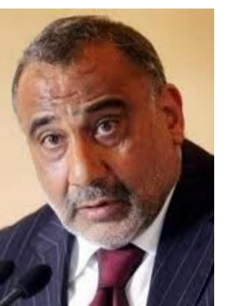
عادل عبد المهدي وزير النفط

انتظار قرار المحكمة الاتحادية ما زلنا نركض جميعاً بحثاً عن حلول لانعقاد جلسات مجلس النواب.. ولاستكمال التشكيل الوزاري.. ولوضع البلاد على طريق الإصلاح.. ولانهاء المحاصصة.. وتنشيف منابع الفساد.. والانتقال من الدولة الربعية الى دولة الجبايات والخدمة العامة.. ونطرح جميعاً شعارات ونطالب الآخرين بسلووكيات ومواقف لم يبرهن معظمنا انه مستعد للالتزام بها. كل ذلك وسط معركة شرسة نخوضها جميعاً ضد الارهاب و«داعش».. وبالاحص في الفلوجة في هذا الوقت بالذات. لا اتكلم هنا عن الشخصيات ولا عن القوى السياسية والاحزاب فقط. بل يشمل الكلام المكونات او مثليهم.. والشعب او مثليه. اتكلم ولا استثنى لا انفسنا ولا غيرنا. اقول.. انه لم يظهر في الافق حلول جديده في الاصلاح.. لا من هم في مواقع المسؤولية الرسمية. لا في العاصمة ولا في الحكومات المحلية.. ولا من هم خارجها سواء المعارضين او المنظرين او المعتصمين او الاغلبية الغاضبة الصامتة الخائنة في امرها وامرنا. وهنا لا نقدر للمواقف بل للسياسات.. ولا للكلمة بل للخطاب.. ولا لقوة بذاتها بل لمجمل حراك القوى.. ولا للفكرة المطروحة بل للفكر صانع القرارات. سواء اتى من تكتونقراط او مستقلمين او حزبين.. فهناك الكثير من المواقف الجديده والقوى الخلصة والافكار المسؤولة التي تعطلها