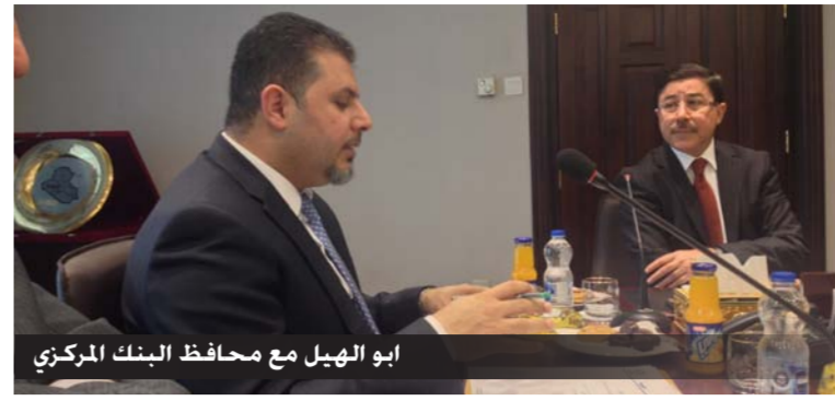
ابو الهيل مع محافظ البنك المركزي