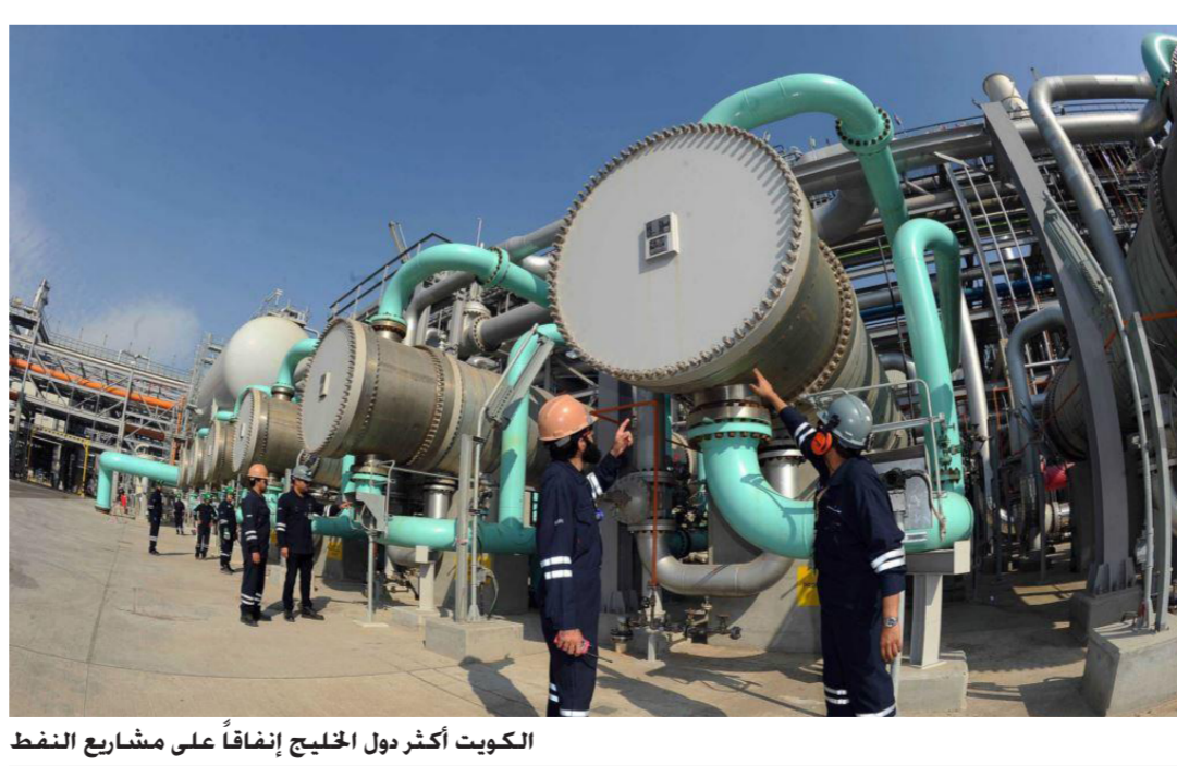
الكويت أكثر دول الخليج إنفاقاً على مشاريع النفط