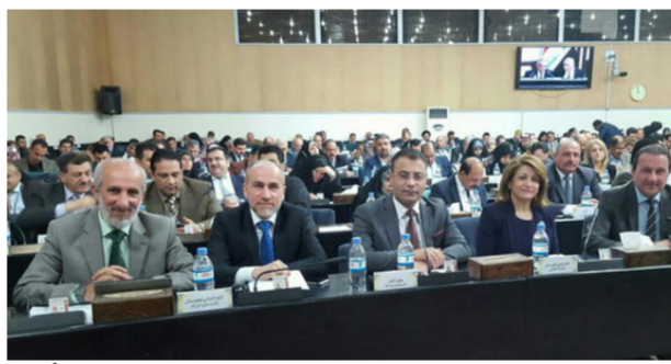
مجلس النواب أمس

للحفاظ على أرواح الناس. وقال العبادي بأننا "نبذل كل الجهود لتحرير باقي المناطق في العراق والعمليات العسكرية مستمرة وهناك انسحاب المستنكرة كامل بين القوات الامنية والحشد الشعبي وكافة الفصائل المقاتلة". وأعلن رئيس الوزراء حيدر العبادي، عن موعد بدء المرحلة الثالثة من عمليات تحرير الفلوجة، فيما دعا الكتل السياسية إلى