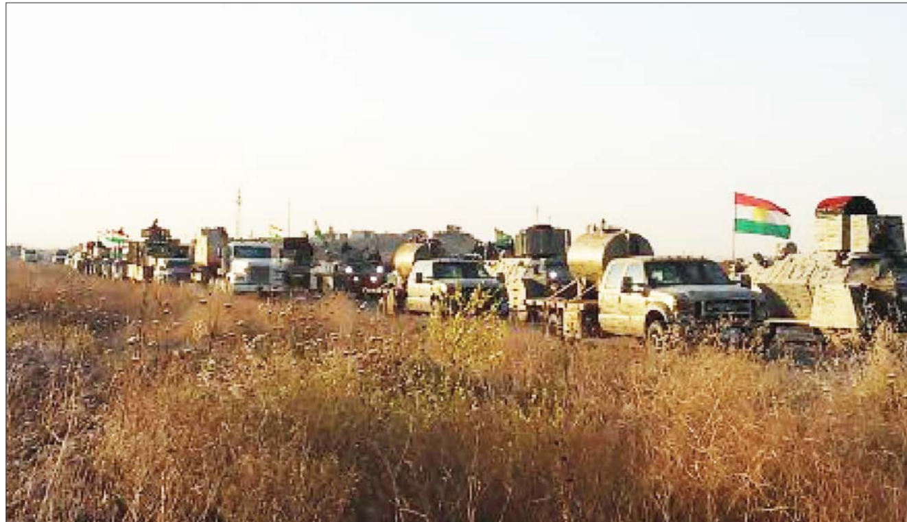
قوات البيشمركة في سهل نينوى