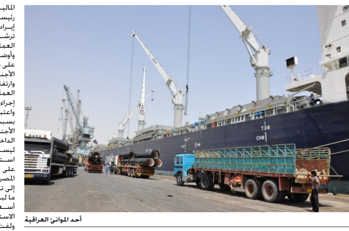
أحد الموانئ العراقية

المالية لأنها ضرورية لتحقيق هدفين رئيسيين: الأول تمويلي من خلال تحقيق إيرادات للخزينة. والثاني يتمثل في ترشيح الاستهلاك وتقليص تدفق العملة الصعبة إلى الخارج. وأوضح أن الاقتصاد العراقي يعتمد على موارد النفط لتوفير العملة الأجنبية. لكن انخفاض أسعاره وارتفاع كلفة الإنتاج قللا من دخول العملة الأجنبية. ما يستوجب إجراءات اتخذها الدولة. واعتبر أن السوق العراقية مستباحة بسبب سوء صناعة بعض البضائع الأجنبية. وبالتالي فإن هذه المنتجات الداخلة لا تخلق دورات دخل لأنها ليست منتجات رأسمالية. بل استهلاكية. ما يؤدي إلى الضغط على احتياط العملة الأجنبية في المصرف المركزي الذي أدت سياسته إلى تكوين احتياط كبير من العملة، ما لبث أن بدأ ينخفض بسبب هبوط أسعار النفط والإقبال الهائل على الاستهلاك. ولفت إلى أن تطبيق العمل بالتعرفة