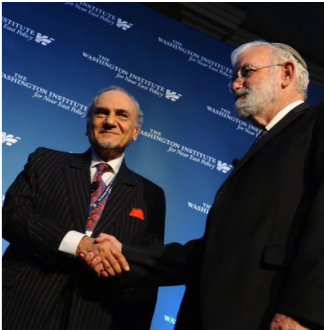
الأمير تركي الفيصل واللواء عميدرو

ومن جهته، أدان «موقع خالف قوي المقاومة الفلسطينية» هذا اللقاء، حيث أصدر - على موقعه - بياناً اعتبر فيه اللقاء بمثابة تطبيع بين السعودية والكيان الصهيوني، وأنه يمثل استمراراً للسلسلة من اللقاءات السرية التي تمت في السابق، بين المسؤولين الإسرائيليين والسعوديين، كما أشار البيان أيضاً،