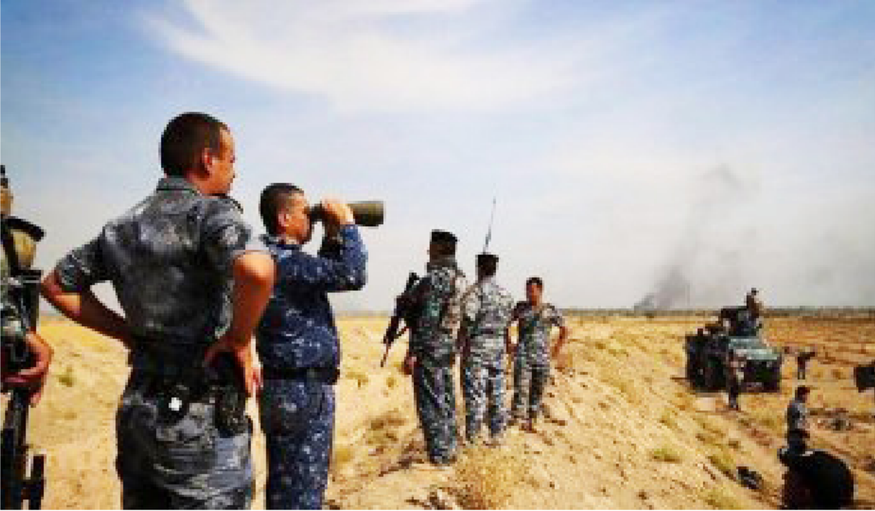
شرطة الأنبار تشارك التشكيلات الأمنية والعسكرية في عملية تحرير الفلوجة

عملية تطهير معمل الحرايات شرق الفلوجة من العصابات النافسة".