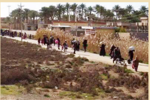
عائلات فارة من المعارك في الفلوجة

ويقول كاتب الموضوع باتريك كويبرن، إن "التنظيم نشر فرق الموت في شوارع الفلوجة