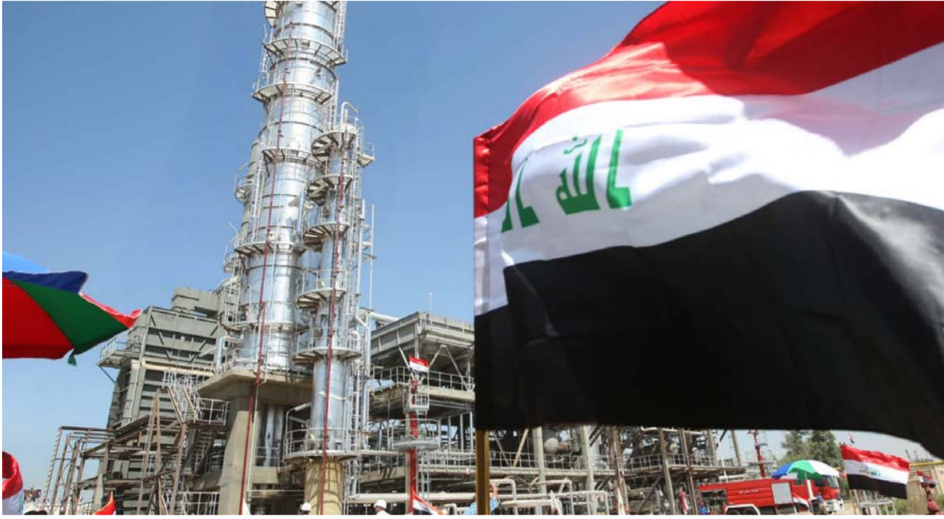
أحدى المحطات النفطية في العراق

على استخدام الأموال في التطوير وتعزيز وضعها كقوة مهيمنة في أسواق النفط. وعلى مستوى الأسعار، تراجعت أسعار النفط لليوم الخامس على التوالي أمس الثلاثاء بفعل زيادة إنتاج كبار المصدرين وقوة الدولار. وانخفضت عقود خام القياس العالمي مزيج برنت 45 سنتاً إلى 47.90 دولار للبرميل بعد أن أغلقت على انخفاض 37 سنتاً في الجلسة السابقة.