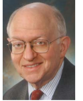
مارتن فيلدشتاين أستاذ الاقتصاد في جامعة هارفارد.