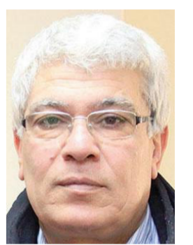
حسن خضر تنشر بالاتفاق مع صحيفة الأيام الفلسطينية

رأيت صدام حسين عن قرب . في بغداد . مرّة أولى وأخيرة . بعد عام على هزيمته في «أم العمارك» . كان العراق جريحاً . ولكن الرجل الذي دخل القاعة . في ذلك اليوم البعيد . وفي مشيته عرج خفيف . تكلم وتصرف كمن جسّد فيه التاريخ . ونطق بلسانه . في تلك اللحظة . لا أدري لماذا . ولا كيف . خرجت من تلايف الدماغ كلمة (Grotesque) . صامتة وخرساء . لتضرب جدرانه كجوان مدعور في قفص . وكان الخوف في حينها . أن تفشل ملامح الوجه في خيّد ما يعتمل في الدماغ . أو أن تكون لدى أحد الجالدين القدرة على قراءة الأفكار . وفي كلنا الخالئين ما يودي بصاحبها إلى التهلكة . استعبد خربة شخصية على هامش صدور رواية «الفتنة» (منشورات الجمل 2016) للأكاديمي العراقي كنعان مكّيّة . لأن فيها ما قد يسهم في خربس القراءة من النفوذ السلبى للتحيزات السياسية . وربما ما يسهم في الارتقاء . قليلاً . بفكرة السياسة نفسها . وهذا ما يجد مبرره في