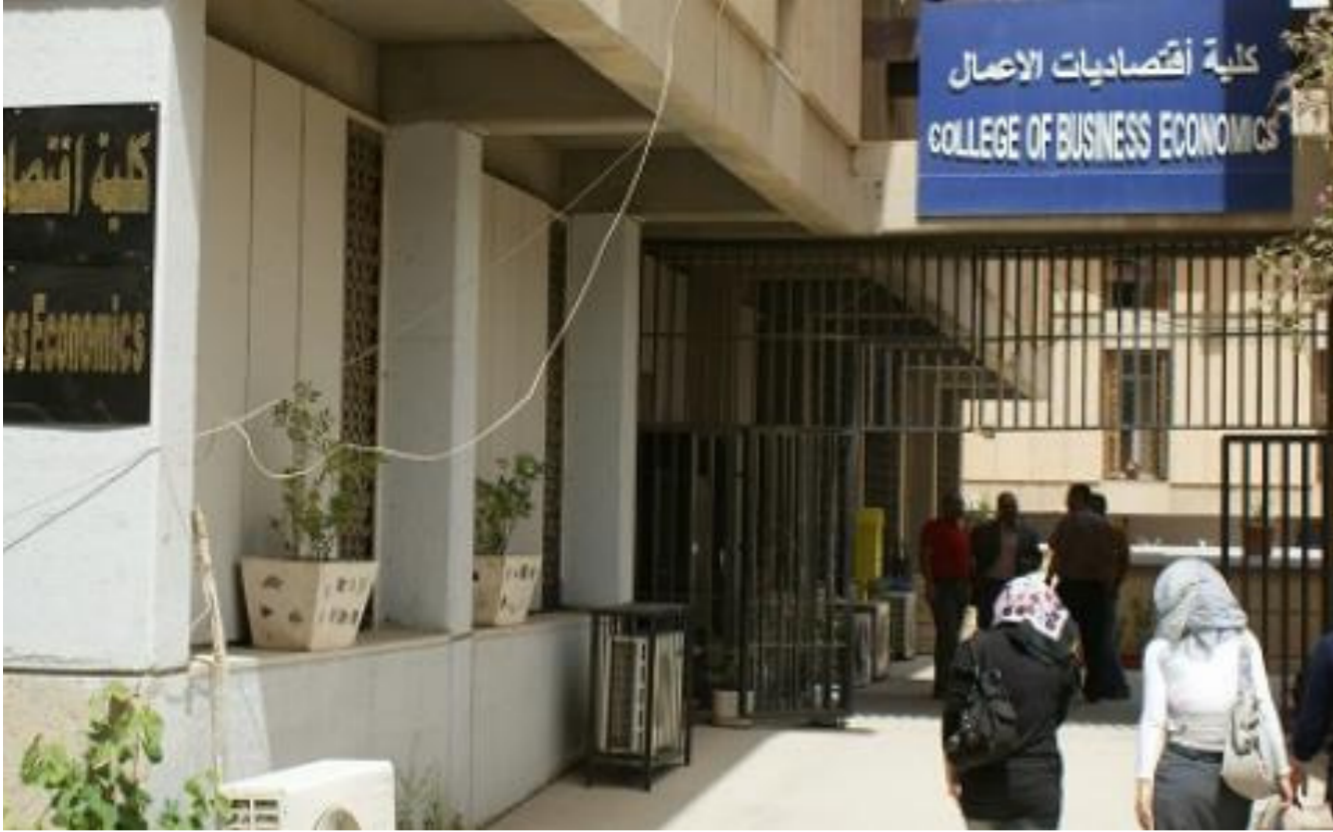
كلية اقتصاديات الأعمال

ورصد وتسجيل الإبلاغ عن إصابات العمل . ومشروع مراقبة ورصد عمالة الأطفال في العراق . ومشروع دعم التدريب المهني وتحسين فرص العمل . ودعم مشاريع تأهيل وإصلاح الأحداث في الأقسام الإصلاحية . وأشار معمر إلى ان الوزارة استكملت الجوانب المتعلقة بعملها ضمن الخطة الاستراتيجية الوطنية للتخفيف من الفقر حيث تمت مناقشة أهمية هذه المشاريع مع البنك الاسلامي وعلى مدى يومين من الاجتماعات مع بقية قطاعات الدولة كـ(الكهرباء والبلديات والصحة والتعليم والتربية والهجرة والمهجرين).