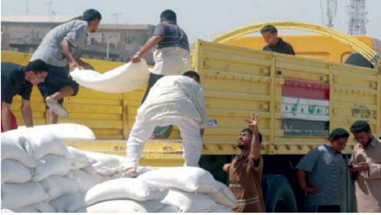
معمل انتاج الطحين

الموصول والضوابط والتعليمات الواردة والمعتمدة للموسم التسويقي الحالي ووضع الخطط المطلوبة لأنتاج الموسم التسويقي الحالي. وقال مدير الفرع لقد تم تقديم مقترح لفتح منفذ تسويقي اخر لقضاء دافوق كون بعد ان كان يتم تسلم محاصيل المنطقة الى سايلو الطوز في العام الماضي وتخفيف الزخم على سايلو كركوك كون الساييلو المنفذ الوحيد الحالي للتسليم في المحافظة.