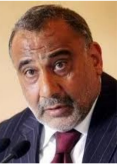
عادل عبد المهدي

لا يمكن انكار ازمت البلاد. والصعوبات الجمة للمواطنين لنقص الخدمات والفساد والروتين. وما ادخلنا انفسنا فيه من مأزق سياسي يهدد امن البلاد وكامل النظام السياسي. والاضلاع الامنية و«داعش». والعمليات الاجرامية وتقطيع اوصال البلاد. والشحة المالية وتراجع اسعار النفط وتوقف الكثير من المشاريع والاعمال والفقر والبطالة. فهذه امور سلبية لا يكفي الكلام عنها او تبريرها. بل يجب معالجتها. واول خطوة للقيام بذلك هي تقييم مجمل الاوضاع وليس الصعبة تقود لخارج صحيحة. وهناك تياران يختلفان في الرؤية