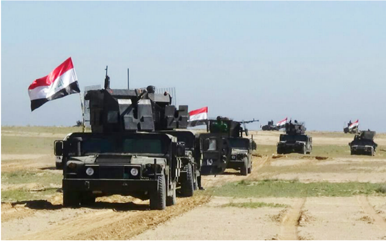
القوات الأمنية في هيت

ويقول القائد العسكري إن "قضاء هيت يعدّ من المناطق الصعبة جغرافياً، إذ إن الأراضي الرخوة تحيط به من جميع الاتجاهات، والمياه الجوفية قريبة على سطح الأرض". هذه التضاريس الجغرافية الصعبة حددت حركة الآليات بكل أنواعها - مدولبة أم مسرفة - وعانيناً كثيراً من هذا الأمر". يقول الأسدى. تفصيلات موسعة 5ص