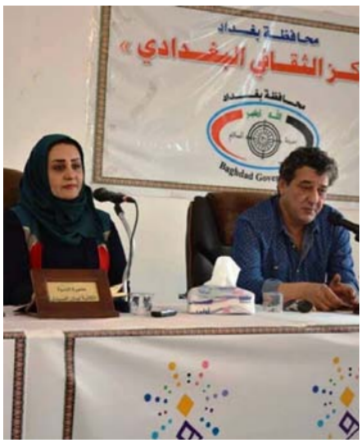
جانب من الندوة

بصل الى 1500 صفحة بنمط واحد وهو عمل يوصف بالصعب. على حدّ قوله. وقال المالكي أننا من خلال الدراما نستطيع أن نعالج العديد من القضايا على الصعيد الاجتماعي والسياسي ونتمكن من إيصال العديد من الرسائل إلى المتلقي.