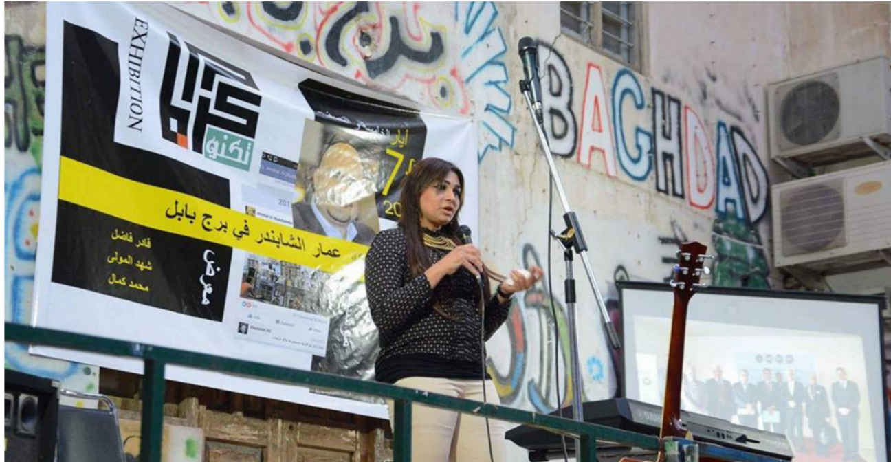
جانب من الاستذكار

من خارج البلاد مع أطفالها، عن حياتها زوجها المرحوم عمار لمدة ستة عشر عاماً عاشت معه مسيرة حياة مليئة بالنشاطات وخدمة الصحافة والانسانية. مؤكدة ان عمار روحه ذهبي الى السماء لكنه بقي مع اهله وأصدقائه وتلاميذه