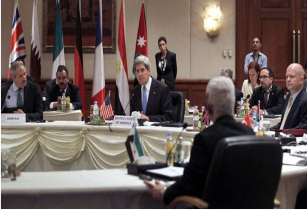
اجتماع دولي وعربي في باريس

عن إصابات. في حين سقطت أمس الأول عدة قذائف أطلقتها فصائل المعارضة على أماكن في ضاحية الأسد في منطقة الحمداينة الخاضعة لسيطرة قوات النظام. ودارت بعد منتصف ليل أمس اشتباكات بين القوات الحكومية والمسلحين المواليين لها من جهة. من جهة أخرى في محيط حيي بستان القصر والمشاركة في حلب. وسط أنباء عن خسائر بشرية في صفوف الطرفين. واستهدفت فصائل المعارضة مكرزات لتنظيم «داعش» في قرية كفرغان في ريف حلب الشمالي وأنباء عن انفجار مستودع ذخيرة لتنظيم. وسقطت قذائف على مناطق سيطرة التنظيم في ريف حلب الشمالي يعتقد أنها ناجمة عن قصف للقوات التركية على المنطقة. فيما استنكرت جانيس لي كورت كامب. مساعدة السيناتور الأميركي ريتشارد بلاك. خلال زيارتها محافظة اللاذقية السورية ما يتعرض له البلد من إرهاب. طالبة من واشنطن وقف دعم للمسلحين. وأعربت جانيس لي كورت كامب عن أسفها «لدعم حكومة بلادها للحرب في سورية وللتكفيرين الذين يستهدفون الشعب السوري». معربة عن «أملها بأن يعي الشعب الأميركي حقيقة ما يتعرض له سورية من إرهاب».