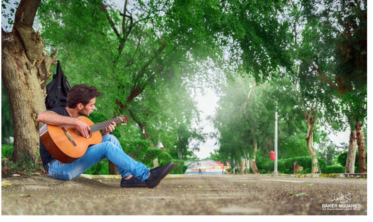
عازف جيتار في مئزته الزوراء..