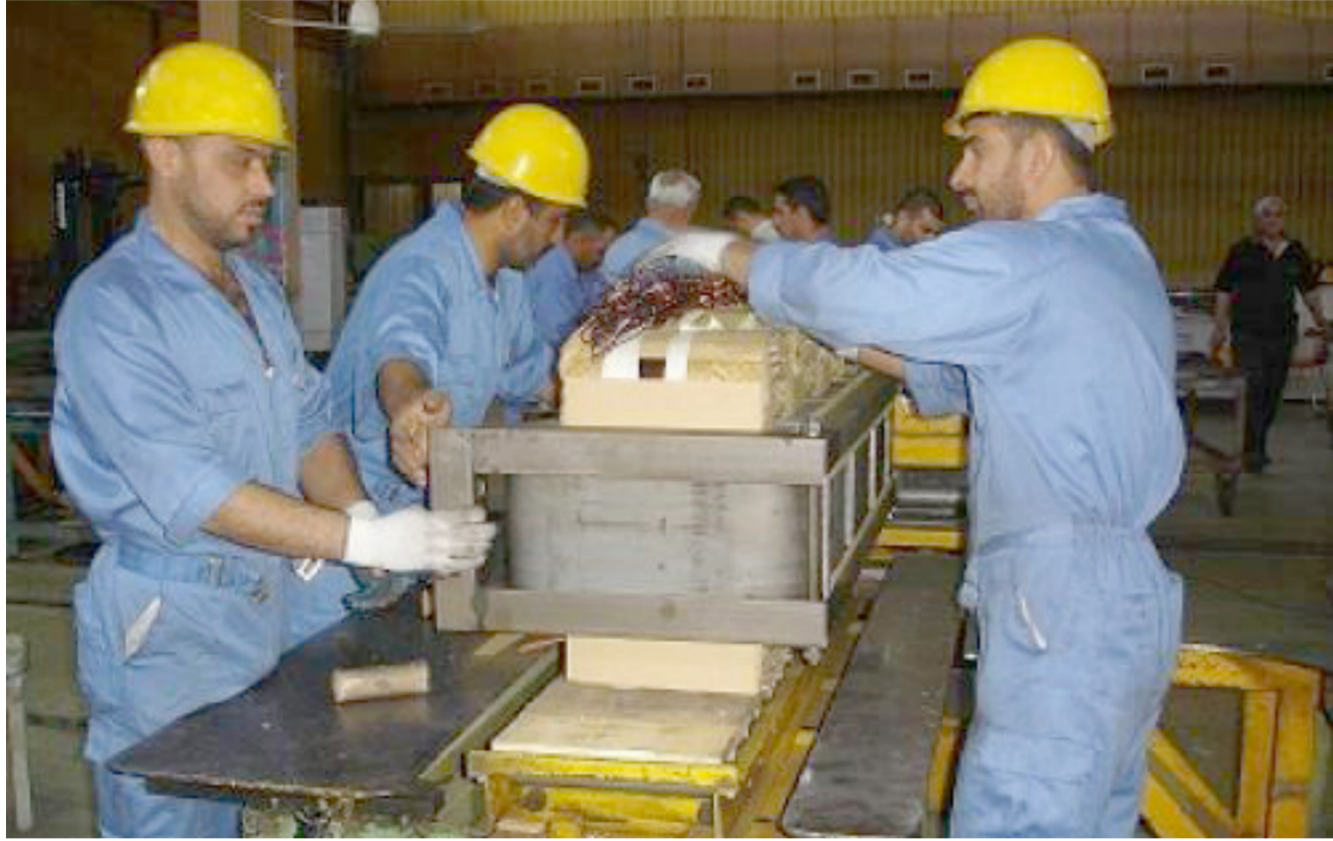
جهاز محولات قدرة بنظام الدفع الآجل