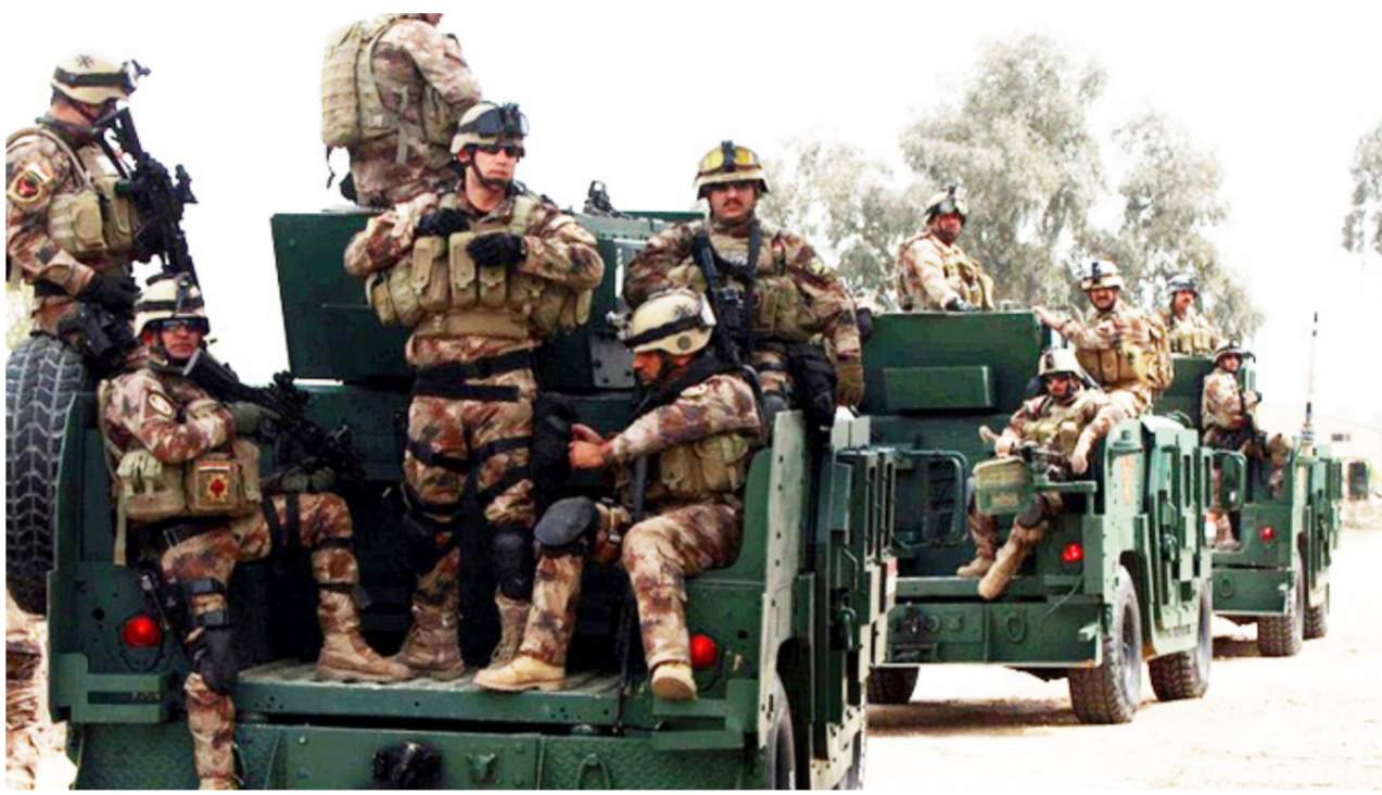
القوات الأمنية في الأنبار

بغداد - العبدي: حذر رئيس الوزراء حيدر العبادي من "استغلال" التظاهرات جر العنصر إلى "الفوضى والسلب والنهب" الذي تعرض له مجلس النواب وأعضائه "مؤشرا خطيرا" على عدم احترام مؤسسات الدولة الدستورية، فيما هدد بمعاقبة كل من تسول له نفسه "التعدي" على حقوق المواطنين وأمنهم.