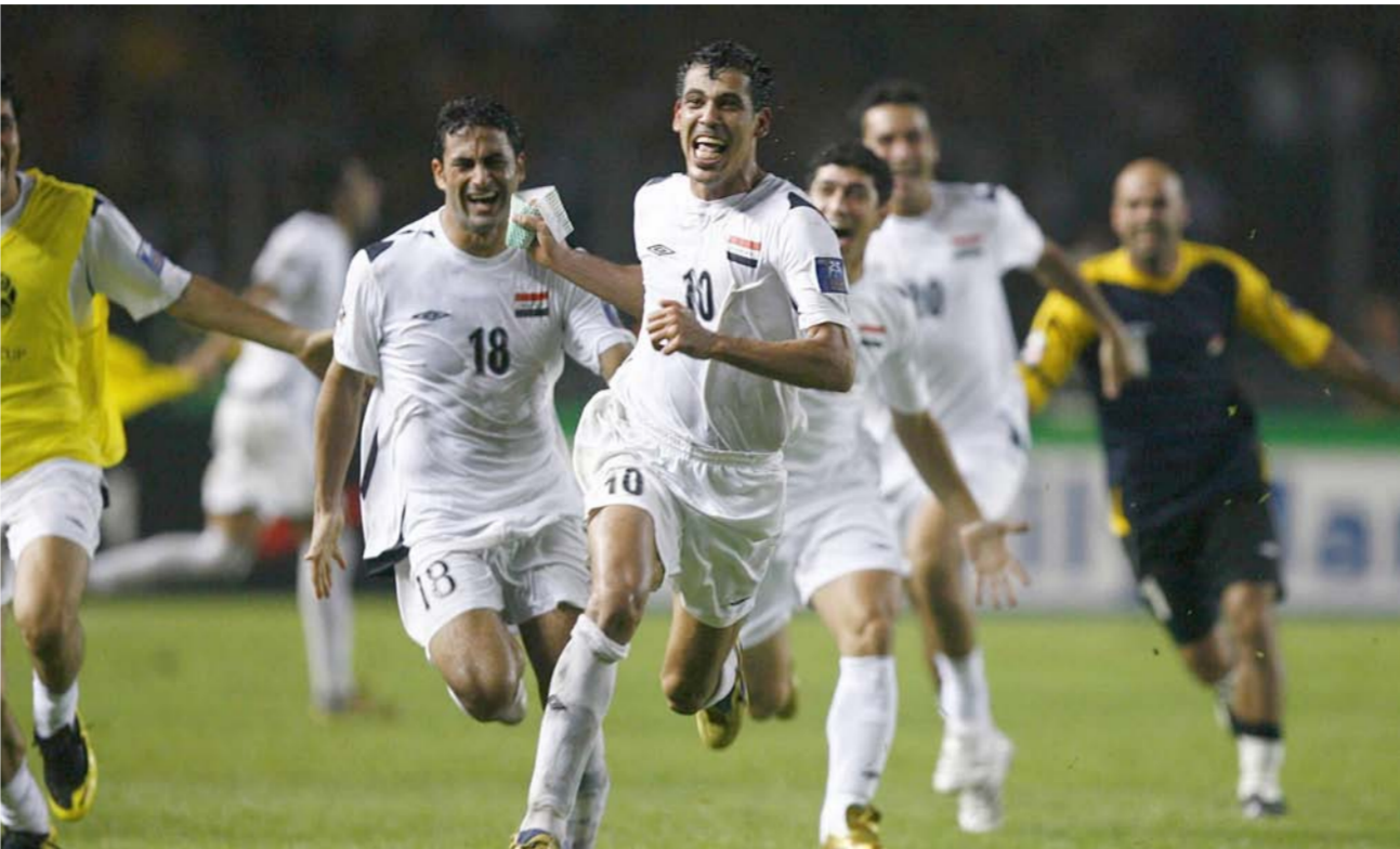
يونس محمود بعد قيادته الوطني للفوز بكأس آسيا

اللجان المختصة التي اخذت على عاتقها تنفيذ الاعمال الموكلة لها حتى موعد الافتتاح الذي سيحضره شخصيات حكومية ودينية واللجنة الاولمبية والبارالمبية واتحاد كرة القدم واتحادات رياضية ومسؤولين من منظمات المجتمع المدني فضلا عن رياضيين ونجوم سابقين وشخصيات اخرى والاعلام الرياضي. كما تم تهيئة نحو 15 الف علم