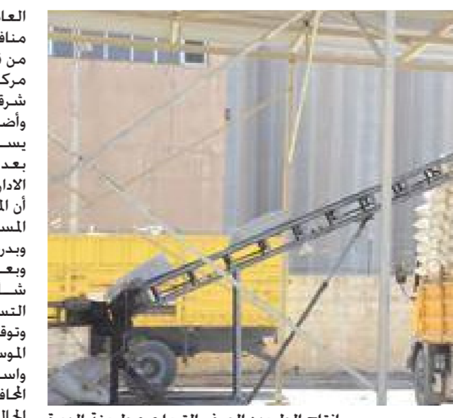
إنتاج الطحين الصفّر التجاري بمطحنة الدورة

العامة لتجارة الحبوب قامت بتوسيع منافذ تسلم كميات القمح المسوقة من قبل الفلاحين حيث تم افتتاح مركز جديد في منطقة السوادة شرقي الكوت. وأضاف الوادي ان المركز الجديد يستوعب كميات كبيرة من الحبوب بعد ان تم تهيئته جيداً وتأمين الملاكات الإدارية والفنية الكافية. موضحاً أن المركز الجديد يتسلم الكميات المسوقة من فلاحين قضائي الكوت وبدرة اضافة الى ناحية شيخ سعد وبعض المناطق القريبة الذي من شأنه أن يخفف الزخم على المراكز التسويقية الأخرى. وتوقع الوادي أن يصل الإنتاج في هذا الموسم الى نحو مليون طن لتحتل واسط المركز الأول على صعيد المحافظات كافة. مؤكداً أن الموسم الحالي يبشر بالخير على الرغم من انه ما يزال في بداياته. على صعيد متصل اكدت الشركة العامة لتجارة الحبوب عن استمرار المراكز التسويقية في محافظتي