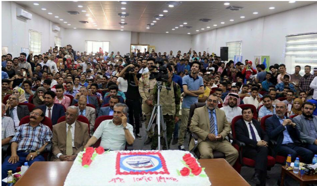
جانب من احتفالية جامعة العراق في البصرة بالذكرى 11 لتأسيسها