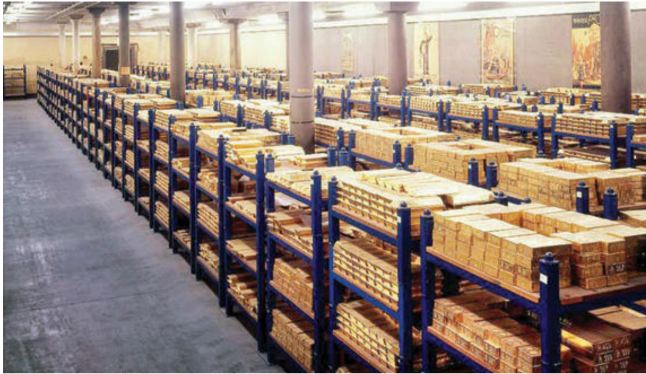
80 طناً احتياط العراق من الذهب

وأشار الصندوق إلى أن «العراق يواصل تحقيق التقدم في ظل البرنامج الذي يراقبه خبراء الصندوق»، مبيّناً أن «العراق يحقق ثلاثة من الأهداف الإرشادية الخمسة المطلوب تحقيقها بنهاية العام الماضي، ومنها خفض مستوى تنفيذ الانفاق على الأجور والتقاعد والسلع والخدمات والتحويلات».