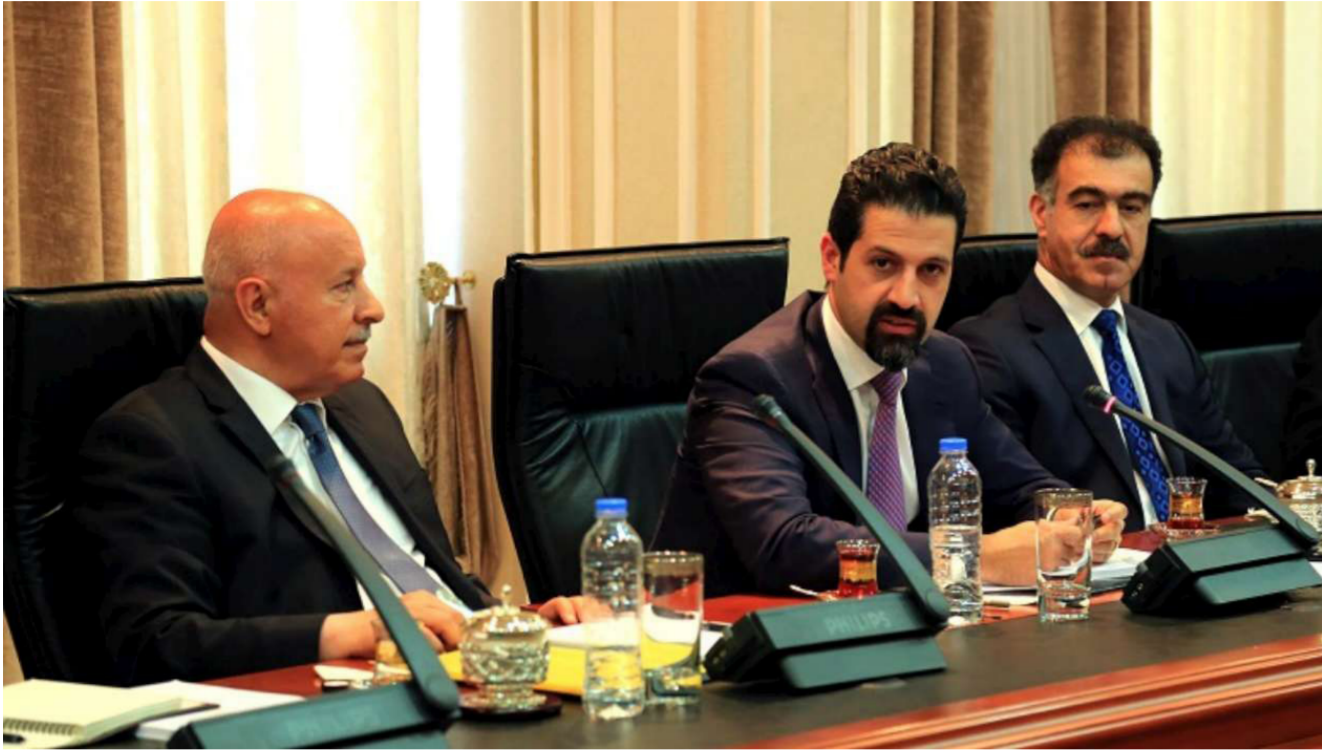
نائب رئيس حكومة اقليم كردستان قباد طالباني في المؤتمر صحفي

الإدارة الأميركية أكثر من مرة بهدف الخروج منها. وجاءت مطالبات اربيل للحصول على دعم مالي من واشنطن عن طريق إرسال وفود إلى أميركا إلا أن جميعها عادت بخفي حنين في حين تقول المصادر إن أميركا شددت على مساعدتها إقليم كردستان عن طريق بغداد فقط. وكان آخر مرة أرسل فيها الإقليم وفداً إلى أميركا في شهر نيسان (ابريل) وكان ثالث وفد يزور واشنطن هذا العام. وتقول المصادر إنه بعد العديد من الاجتماعات عاد الوفد إلى الإقليم بخفي حنين. وأفاد تقرير لموقع المونيتور حول زيارة وفد الإقليم الذي يرأسه قباد طالباني نائب رئيس الحكومة أن الوفد لم يحصل هذه المرة أيضاً على دعم مالي أميركي مباشر لآربيل.