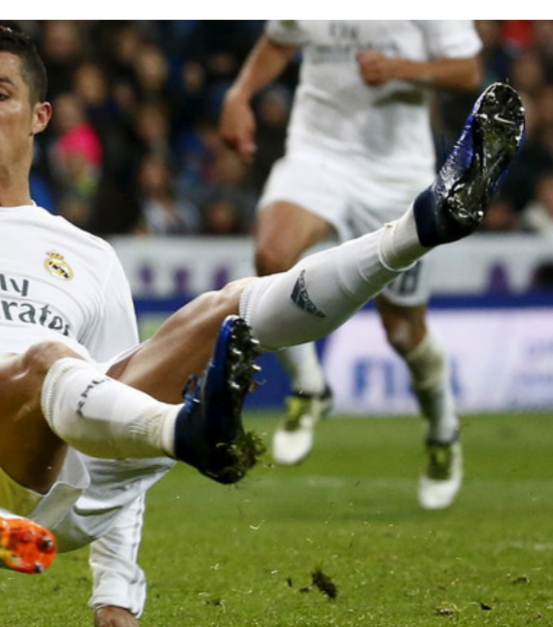
رونالدو يتعرض إلى الإصابة

الليجا. إذ يتصدر برشلونة البطولة برصيد 79 نقطة، نفس رصيد أتلتيكو مدريد الوصيف. في حين يحل الريال ثالثا خلفهما بفارق نقطة وحيدة، وذلك قبل أربع جولات على ختام المسابقة. من جانبها، ذكرت تقارير إخبارية أمس أن الآلام العضلية التي تشعر