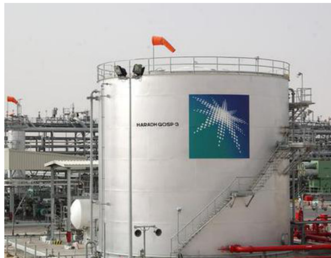
إحدى محطات إنتاج النفط في الكويت

إلى ذلك، سجلت عائدات النفط المورد الرئيسي للجزائر، انخفاضاً بنحو 40 % في الربع الأول من هذا العام، مقارنة بالفترة ذاتها من سنة 2015، وفق ما أعلنت الجمارك الجزائرية. وبلغت الصادرات 5,914 مليار دولار خلال الأشهر الثلاثة الأولى من العام الجاري مقابل 9,8 مليار دولار خلال الفترة ذاتها من 2015، بتراجع قدره 39,65 %. وفقاً لبيانات المركز الوطني لإحصاءات الجمارك، عزت الجمارك هذا التراجع إلى الانخفاض المستمر في أسعار النفط منذ يوليو 2014، مشيرة إلى أن المحروقات تستحوذ على الحصة الكبرى من مبيعات الجزائر إلى الخارج بنسبة 93,19 % من إجمالي الصادرات. وأدى انخفاض عائدات النفط إلى زيادة في العجز التجاري الذي بلغ 5,6 مليار دولار (4,9 مليار يورو) في الربع الأول، مقابل 3,4 مليار دولار في الربع الأول من عام 2015 (ثلاثة مليارات يورو). وعزت الصين موقعها بصفتها أكبر موني الجزائر بالسلك (18,3) % من نسبة السوق، بعدما انتزعت