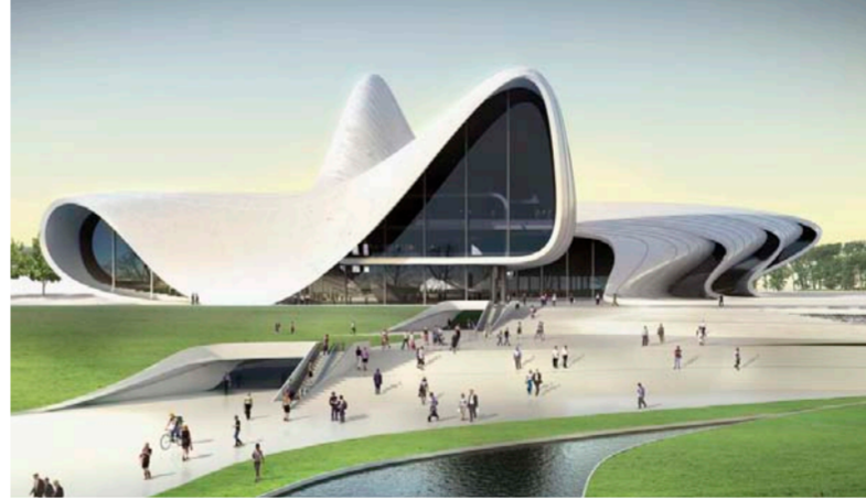
مبنى حيدر ابييف في أذربيجان

«تفسرد (أعمال زها حديد) مزيج من طاقة هائلة ورهافة لا يبلغ قاعها». وهي تعرّف معالجتها حركة المكان. فتقول: «شعرت بفقر الرسم العماري التقليدي. وقبده التثقل على العمارة. فأريت ابتكار وسائل تصور جديدة» ورسومها المئات والمترقة ثم أجمتعه من جديد. واللونة على قاع أسود. تنسبها الى الفن المفهومي. فهي تتحدن على غضب وترق الخييل انتقال هؤلآ من اللوحات المعلقة على جدران المتاحف الى عمارة مثلثة الأبعاد. لكن زها حديد تولت النقل وأجزته. ورم كولهاس. أسنانها. سبقها الى الاستفزاز. والى الشبخة على مسرح العمارة العالي. والاضطلاح بصوغ مذهب محيط في الفن. واكتشاف موابه لا تقصر عن مضاهاته. دعاها الى المشراكة في عمل مكتب «المتروليببيتان أركيتيكتشر (OMA)». وهذه وكالة أنشأها مع إيليا زينغاليس. في 1975. بروتردام. واستقلت زها حديد عن مرشدتها المعرض للزكازن والاعتراض. وتشبه معلمة التعرض للزكازن والاعتراض. وتشبه معلمة الفن المعماري. صورة جسم مثلبة. على ما كان يفعله في ناطحات السحاب بين الحريين. يعلوها رأس يشبه بعض أنصار آسيا الصغرى. ووجه حاد العيارة تقبح عينها شرراً أو تفيضان عطقا ومرحا وحنانا تذكر بأسود الخلية. فهي تشبه الشخصيات الفيلينية السينمائية. ويصومل في وكالة زها حديد للعمارة 400 مساعدا. ويصف بعضهم. على الاخص من