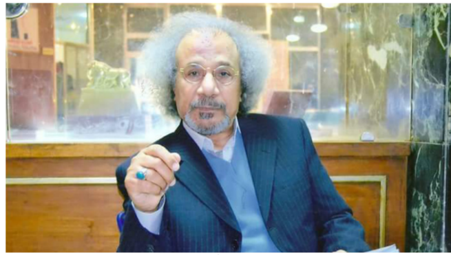
المخرج والفنان المسرحي عزيز خيون

والممثل، يمكن يدخل كاتب النص ضلعاً رابعاً في خمل مسؤلية هذا الإخفاق". وقال إن الأهم في تجربة المونودراما ليس توافر الموازنة اللازمة للإنتاج، بل «توافر الرصيد الإبداعي البشري، الممثل الذي يخاطر بدخول هاته التجربة»، مضيفاً أن هذا الممثل «يجب أن يكون ذا جذب خاص، وسحر أخاذ، ويبقى محتفظاً بكرسيه حتى نهاية العرض". ووصف الممثل بأنه يجب أن يكون «لماً مفكراً، لافتاً، بهيماً، ذا طلة مؤثرة، وصوت معافى وغني وجسد مرن ومعبر وحيداً لو توافر الممثل الشامل الذي يتمكن من فنون الغناء والرقص ومهارة لاعبي السيرك اضافة إلى تمثيله المميز".