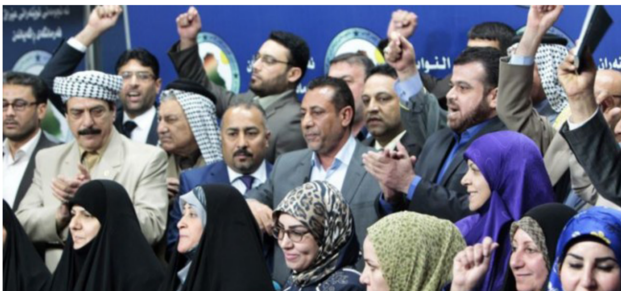
النواب المعتصمون داخل قبة البرلمان

على وفق مراحل الأولى من خلال تغيير هيئة رئاسة البرلمان. ومن ثم المضي في عملية استجواب رئيس مجلس الوزراء حيدر العبادي بطلب مقدم من 50 عضواً تهيئاً