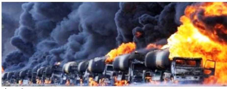
رتل من صهاريح النفط المدمرة التابعة لداعش

نقّدت اليوم. غارة جوية على رتل تابع لتنظيم داعش كان يقوم بنقل نحو 20 صهريجاً محملاً بالنفط الخام من حقول القيارة (45 كم جنوبي نينوى). ما أسفر عن تدمير الرتل بالكامل ومقتل نحو ثمانية من عناصر التنظيم وإصابة ثمانية آخرين". وأضاف المصدر. أن "شدة القصف واقترابه من أحد الأبار تسبب عنه حريق كبير غطى سماء المنطقة".