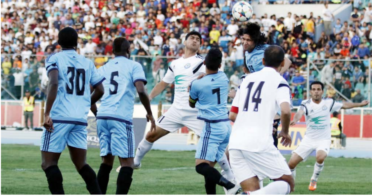
من منافسات النخبة (ارشيف)

كما جرى اليوم السبت في الساعة الرابعة والنصف من عصر اليوم السبت مباراة القمة الجماهيرية بين فريقَي الزوراء والجوية بحساب الجولة الرابعة لدوري النخبة بكرة القدم. في حين يتواجه في الساعة الرابعة في عصر يوم غد الأحد النطق وامنأة بغداد ويلتقي في ملعب جفجف النخلة في المدينة الرياضية بحفاظة البصرة فريقَي الميناء والشرطة. من جانبه، أكد مدير لجنة المسابقات في الاتحاد العراقي لكرة القدم شهاب أسعد ان الجولة الخامسة للنخبة ستنتقل يوم الخميس الموافق 5 آيار من أجل فسخ اجمال للمنتقى لكرة العراقية نطق الوسط والجوية لمباراتهم في كأس الآحاد الآسيوي.