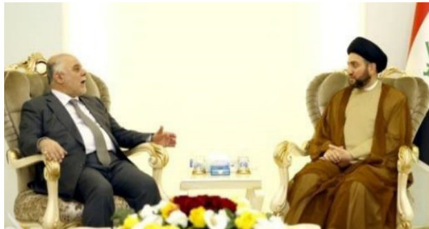
جانب من لقاء العبادي والحكيم

بغداد - الصباح الجديد: بحث رئيس الوزراء حيدر العبادي. مع رئيس المجلس الأعلى الإسلامي عمار الحكيم. عملية الإصلاح والتغيير الوزاري المرتقب. في حين أشار الحكيم إلى أهمية أن تتحلى الكتل السياسية بتفافية "التنازل والالتقاء في المنتصف" خدمة للعراق.