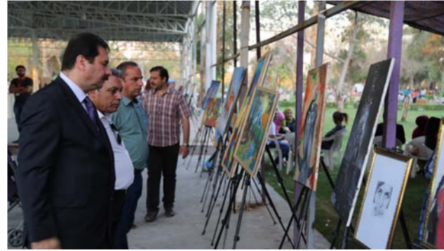
من أجواء المهرجان

والإبدعات الفنية التي يصنعونها. معتبرا عن سروره لما وثقته أعمال الشباب الفنية من أفكار متطورة صيغت بطرق حديثة لنقل صور البطولة والتضحيات لقواتنا الأمنية الباسلة ومقاتلي الحشد الشعبي الأبطال وهم يرثون كبد الأعداء ويحزرون أرضنا من دنسهم. وثمن المخرج الشاب علي فاضل دور وزارة الشباب والرياضة في التجديد وفسح المجال للشباب في التعبير عن مكنوناتهم الإبداعية متى ما أتحت الفرصة لذلك. وعبرت