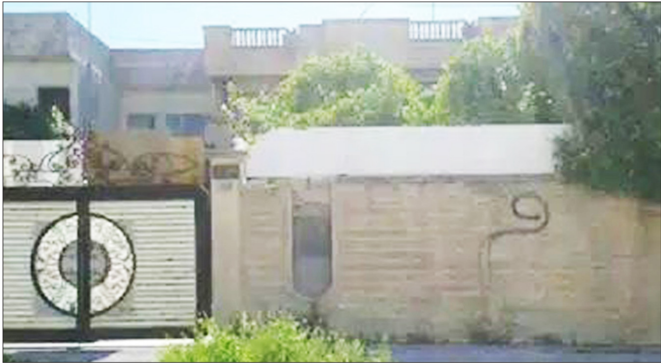
ظاهرة كتابة حرف (م) على المباني والجدران والمنازل في مدينة الموصل

محال المختصة ببيع المواد الانشائية والزراعية، علما ان حراس السوق من التابعين للتنظيم الارهابي، ولا يمكن اماكن لم تخصص لبناء مساجد لان الاول بني عوض السوق. برغم ان مساجد اخرى قريبة من المكان والثاني يجري بناؤه في منطقة مخصصة لتوسيع المستشفيات نظرا لضيقها وعدم وجود ارض فارغة سوى هذه الارض".