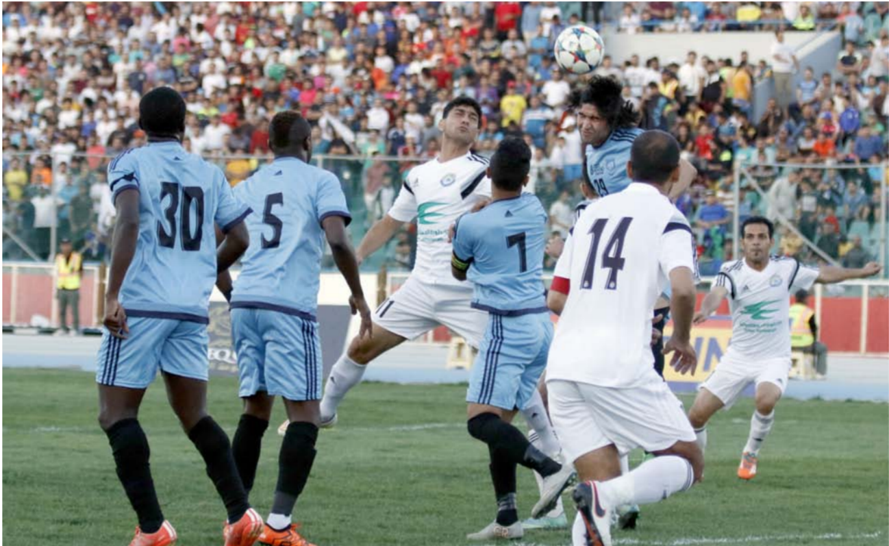
الإثارة متواصلة في دوري النخبة