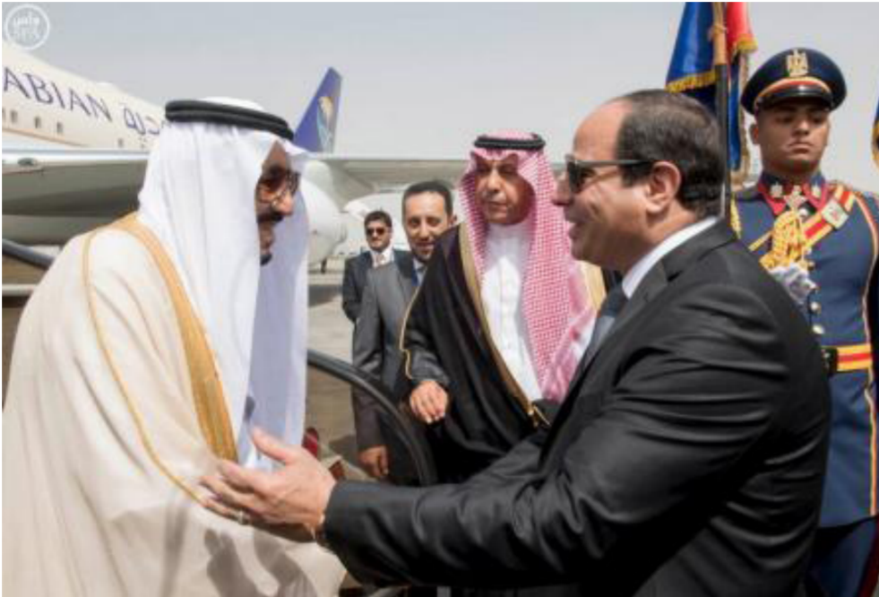
الملك سليمان في مصر لدعم حكومة السيسي

جمعت الملك سلمان بالربيع السيسي أمس الأول الخميس على «حرصهما على أن تشكل هذه الزيارة نقلة نوعية في العلاقات الأخوية والتاريخية التي تجمع بين البلدين الشقيقين وأن تدعم أواصر التعاون الثنائي في جميع المجالات». وعقد الزعيمان جلسة مباحثات موسعة أمس الجمعة بحضور وفدي البلدين ويعقبها مراسم توقيع عدد من الاتفاقيات بين البلدين. وقال السفير علاء يوسف المتحدث باسم الرئاسة في بيان آخر صدر الأربعاء الماضي إنه إلى جانب القضايا الإقليمية والدولية محل الاهتمام المشترك «ستتناثر موضوعات التعاون الاقتصادي بين البلدين بجانب كبير من المباحثات». وأعدقت السعودية ودول الخليج المساعدات على مصر منذ عام 2013 لكن يقول مراقبون إنها تسعرت بالإحباط على نحو متزايد بسبب عجز حكومة السيسي عن معالجة الفساد وضعف الاقتصاد وتقلص الدور المصري على الصعيد الإقليمي.