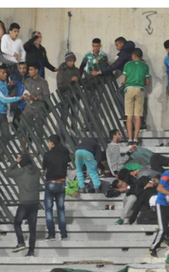
أعمال شغب في الملاعب المغربية

بين مجموعتي الألتراس لفريق الرجاء البيضاوي بسبب رغبة كل مجموعة منهما في تقدم نفسه على أنه الأفضل. لتتحول المنافسة إلى خلاف أسفر عن قتلين وعدد من المصابين واعتقال عشرات المشجعين. ومباشرة بعد هذه الأحداث قامت ولاية جهة الدار البيضاء-سطات المغربية.