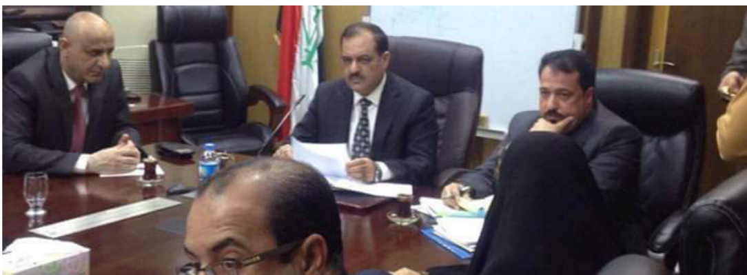
لجنة النزاهة النيابية

بتزويد اللجنة بالأوراق التحقيقية الخاصة بهذه الشركة . كما ان لجنة النزاهة خاطبت وزارة النفط في منتصف تموز من العام الماضي للاستفسار عن سبب إحالة المشاريع الى هذه الشركة الفاسدة على الرغم من وجود مستحقات مالية بذمتها لم يتم تسديدها الى الحكومة السابقة . مشيرة الى أن وزير النفط الحالي قام بأيقاف التعاقد مع هذه الشركة ومازال الملف مفتوحاً للتحقيق معها من اجل الوصول الى الحقيقة . وتوجه عدد من اعضاء اللجنتين