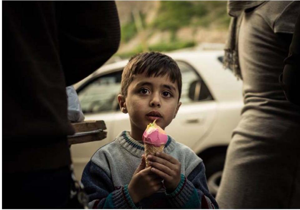
القانون العراقي لا يجيز التبني

نص يحدد مفهوم التبني بشكله المعروف. مثلما هو الحال في قوانين الدول الأخرى وبالأخص الأوروبية. وسبب ذلك، وكما يقول الخامي طاروق مهدي لأن القانون المدني العراقي جاء معظم أحكامه من التشريعات الإسلامية. ومن الذنب الخفي واعتماده على مجلة الأحكام العدلية العثمانية ومرشد الحيران لقدرى باشا. والقوانين الأوروبية التي تعّد التبني والولد غير الطبيعي مسألة اعتبارية نصت عليها تلك القوانين.