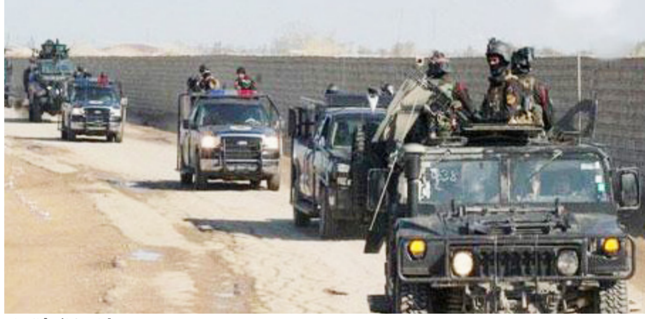
قوات مكافحة الإرهاب لصقورنا البواسل" وعلى الرغم من عدم إعلان عدد العائلات التي تم إخراجها من قضاء هيت، إلا ان قناة العراقية- شبة الرسمية- أعلنت ان قوات جهاز مكافحة الإرهاب تمكنت من إخلاء

بعد خوضها معارك "حذرة" لكثرة المدنيين قوّات جهاز مكافحة الإرهاب تصل إلى قلب قضاء هيت بغداد - مشرق ريسان: وصلت قوات جهاز مكافحة الإرهاب إلى "قلب" قضاء هيت غربى الأنبار بعد خوضها معارك "حذرة" لكثرة المدنيين وطبيعة أرض المدينة الرخوة. وتقول الأنباء الواردة من قضاء هيت، إن القوات المسلحة المشتركة وصلت إلى مركز المدينة ورفعت العلم العراقي فوق بناياتها. وبحسب بيان خلية الإعلام الحربي التابعة لقيادة العمليات المشتركة، ورد لـ "الصباح الجديد" فان "أبطال قوات جهاز مكافحة الإرهاب واللواء 73 الفرقة 16 استطاعوا من الوصول إلى مركز المدينة". ويؤكد البيان ان "إبناءكم يواصلون المعارك المشرفة والعمليات مستمرة ضد الآن حين إكمال خرب كامل مناطق هيت الحبيبة والمناطق المجاورة". واستطاعت قوات جهاز مكافحة الإرهاب إخلاء العائلات من المناطق المحررة باتجاه قطعتنا وتسهيل نقلهم إلى مناطق كبيسة.