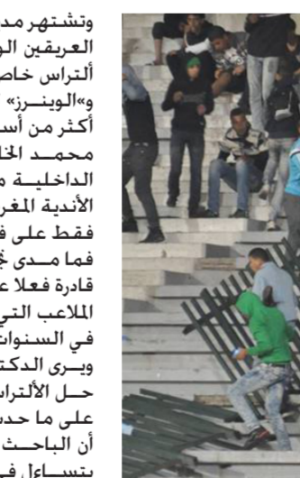
أعمال شغب في الملاعب المغربية

وتشتهر مدينة الدار البيضاء بفرقيها العريقين الوداد والرجاء. ولكل منهما أنتراس خاص به. «الغرين بوير» للرجاء و«الوينرز» للوداد. والآن وبعد مرور أسبوعين على أحداث ملعب محمد الخامس المؤلمة عممت وزارة الداخلية منع الألتراس على جميع الأندية المغربية ولم يعد الأمر يقتصر فقط على فرقي الوداد والرجاء. فما مدى جاعة هذه الخطوة؟ وهل هي قادرة فعلاً على الحد من ظاهرة شغب الملاعب التي زادت في الملاعب المغربية في السنوات الأخيرة؟ ويرى الدكتور منصف البازغي أن قرار حل الألتراس جاء كرد فعل طبيعى على ما حدث في السبت الأسود. بيد أن الباحث في السياسة الرياضية يتساءل في حوار مع DWعربية حول كيفية إيقاف أنشطة روابط الألتراس. كيفية غياب إطار قانوني ينظم نشاط الألتراس لا يمكننا الحديث حسب البازغي. عن حل الألتراس: لأن الحل لا يسري إلا على إطار قانوني. ومادام معظم روابط الألتراس في المغرب غير منظمة في إطار جمعيات. فإن المصطلح الصحيح هنا هو المنع وليس الحل. وفي ظل غياب قاعدة بيانات تتضمن أسماء الأشخاص المنتمين