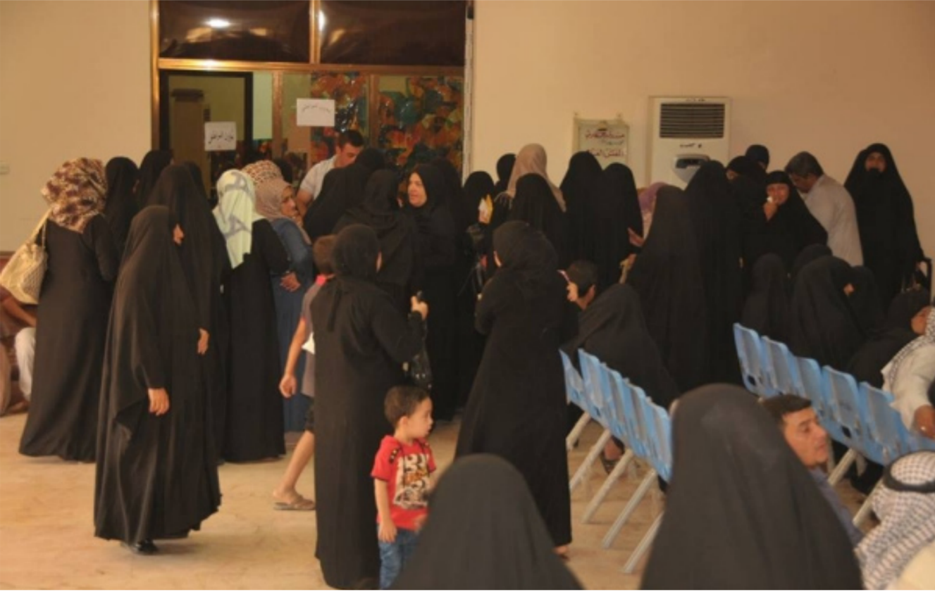
المشمولون في إعانة الحماية الاجتماعية

خلال تقديم المساعدات العينية المطلوبة لأسر النازحين وكذلك تنظيم دورات تدريبية في المجالات التي تتلامح مع احتياجاتهم . مشيراً إلى أن المحور الثالث . يتضمن التعاون مع المنظمات الدولية والمحلية لدعم النازحين وتقديم المساعدات لهم في شتى المجالات ومنها التعاون مع منظمة الهجرة الدولية (IOM) . ومنظمة الأغذية الأولية ومنظمة ريج (RECH) ومنظمة انقاذ الطفل العالمية .