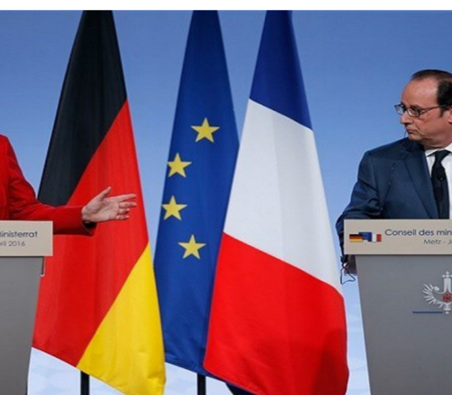
تحذير من ازدياد اللجوء في أوروبا

وألقى ديمتريس أفرايموبولوس وهو المفوض المسؤول عن قواعد اللجوء للإخاد الأوروبي باللوم على الدول الأعضاء بسبب الإفتقار إلى الإرادة السياسية مع تجاهل الحكومات الوطنية مجدداً دعواته السابقة لتسريع إعادة التوطن. ورفض تيمرمانس الإقتراحات التي تقول بأن إضافة آلية العدالة التصحيحية لإتفاقية دبلن تنفتر إلى الطموح. قائلاً بأنهم يضعون في الاعتبار هذين الخيارين في ظل حاجة أوروبا إلى نظام لجوء أكثر مركزية. وأثار إصلاح سياسة اللجوء في الإخاد الأوروبي الجدل مرة أخرى بشأن الإستفتاءات على خروج المملكة المتحدة من الإخاد الأوروبي. مع إدعاء المؤيدين للخروج بأن قواعد دبلن لا تتناسب مع بريطانيا. وتختار بريطانيا ما إذا كانت سوف تشارك في سياسة اللجوء بالإخاد الأوروبي. فيما إستقرت الحكومات المتعاقبة على نظام دبلن لأنه يتيح لهم ترحيل طالبي اللجوء إلى أول بلد وصلوا إليه. وكشف المسؤولون في «داونينغ ستريت» الثلاثاء الماضي عن أن ضغوطاً كبيرة مورست من الحكومة أحوالت دون وقف العمل بقواعد إتفاقية دبلن. إلا أن مجلس