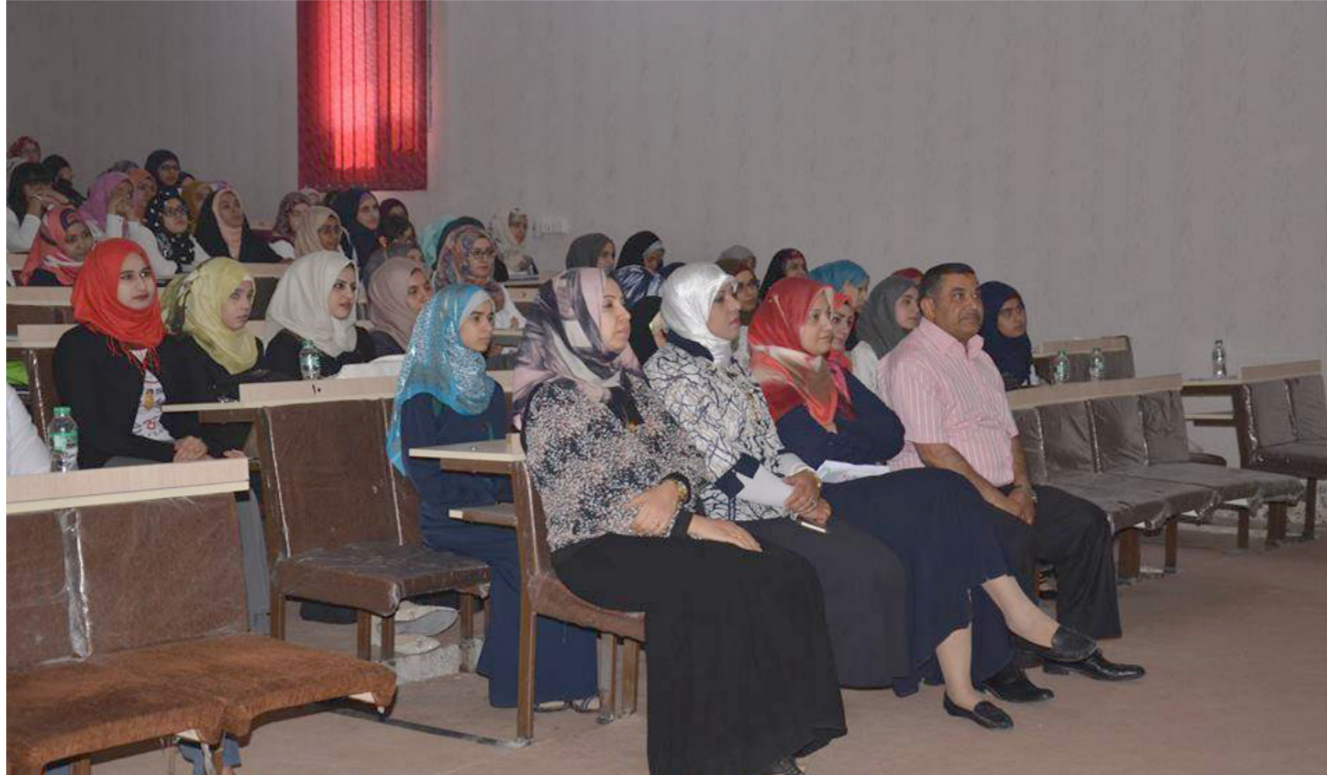
جانب من محاضرة تفاعلية في كلية طب جامعة البصرة