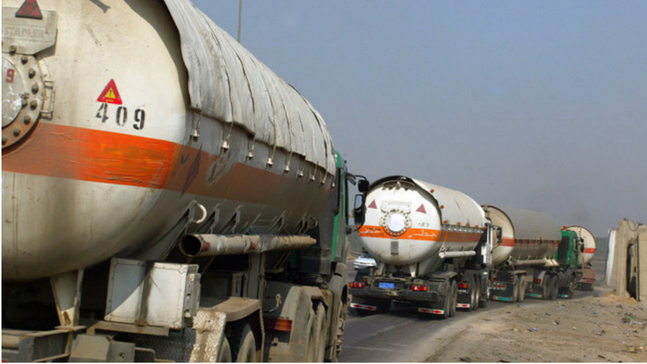
ناقلات للنفط العراقي

تقليص فائض الإنتاج الذي لا يقل عن مليون برميل من الخام يوميا إذ إن حجم الإنتاج الحالي يبلغ بالفعل مستويات غير مسبوقه أو اقتراب من تحقيق رقم قياسي في معظم الحالات. وقال بنك جولدمان ساكس إنه «لا يميل إلى الاعتقاد باستخدام تثبيت إنتاج أوبك عند تخفيضه» بل إنه يتوقع ارتفاع إنتاج أوبك بواقع 600 ألف برميل يوميا هذا العام و500 ألف برميل يوميا في 2017.