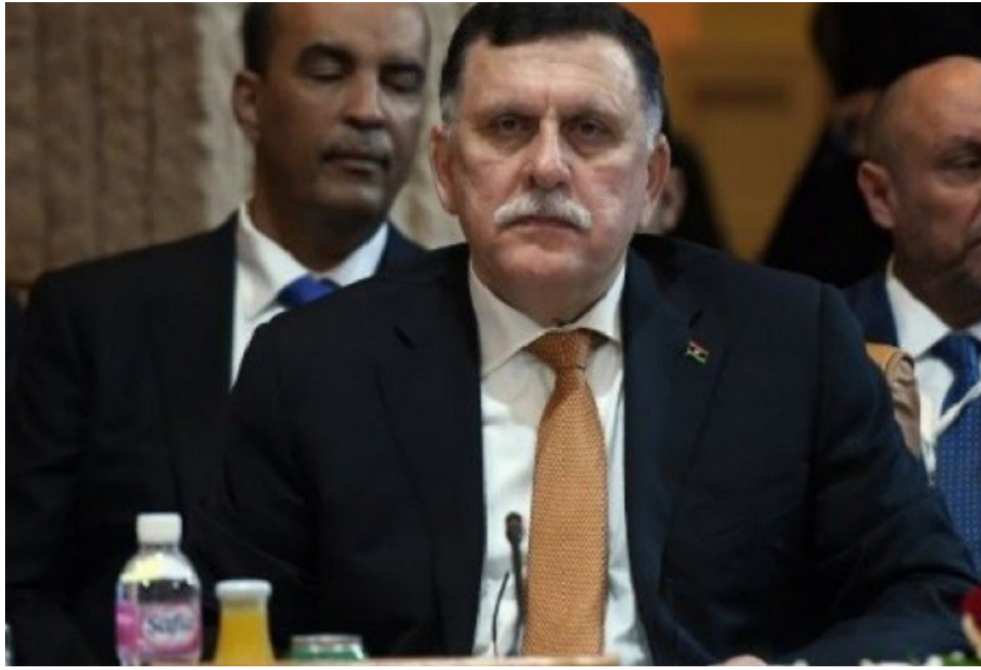
رئيس حكومة الوفاق الوطني فايز السراج

سنحدد ما نعتبره نحن المطالب الأساسية والضرورية، وسنضعها أمام الحكومة. وإذا التزم المجلس الرئاسي بالبدء بشكل فوري في حلحلة هذه المطالب، فيكون انعكاس ذلك إيجابياً. وسبق أن قدم الطوارق للمسؤولين السياسيين في ليبيا عدة مطالب تلخصت في الاهتمام بتنمية مجتمعاتهم، والحفاظ على هويتهم الثقافية في الدستور، والاعتراف بلغتهم (الطارقية) كأحدى اللغات الرسمية في ليبيا إلى جانب اللغة العربية. فيما أفاد أحد المواطنين أن عناصر تنظيم «داعش» المتكرزين في بوابة «الحمصين» غرب مدينة سرت، يشنون حملة مكثفة لتفتيش الهواتف المحمولة للمارة من الناس. وأوضح الشاهد أن عناصر التنظيم يقومون بأخذ الهواتف النقاله من المارة ويقومون باسترجاع الصور والملفات الخدوفة من الهاتف عن طريق مبرمجين معهم. وذكر المصدر أن التنظيم يزيد من تضيق الخناق على أهالي المدينة، بعد الغارات الجوية التي تستهدف مقار وجمعيات الليبيين، «الإرهابية» في ضواحي المدينة، وحذر المصدر جميع المارة من أن هناك بصورة أخذ الخطه والخدر مطالباً بإهمم بإتلاف بطاقة الذاكرة الخارجية للهاتف حتى لا يتمكن عناصر التنظيم من الكشف عن محتوى الهاتف.