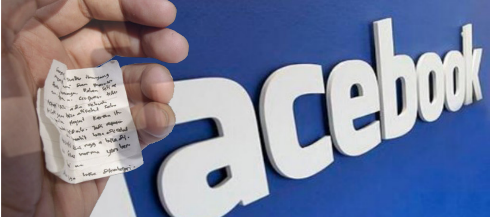
الفيس بوك أفضل وسيلة لتعلم الغش سرّاً

بإدخالها إلى قاعة الامتحان. لذلك ركزت العديد من الصور على شرح طريقة الغش كفتح الساعة من الجهة السفلى وحشوها بقصاصات ورقية تحتوي على دروس مكتوبة بخط صغير جداً. كما أوضحت صور أخرى بطريقة مفصلة كيفية استعمال غطاء الآلة الحاسبة لتخزين أوراق الغش. ومن بين أكثر الطرق التي لقيت عدداً كبيراً من التعليقات والإعجاب، هي كيفية استعمال اللعب الإلكترونية للعصائر عن طريق تقطيع جهة من زواياها الأربعة لتسهيل استخراج القصاصات الورقية.