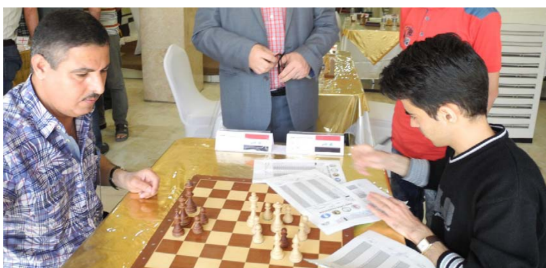
من منافسات البطولة الدولية بالشطرنج