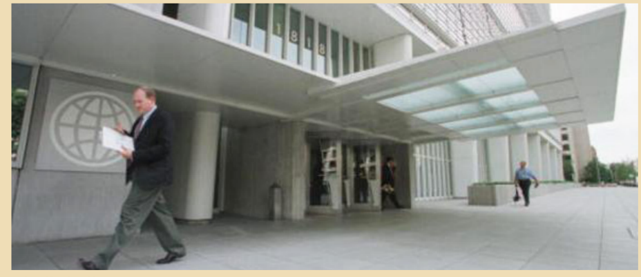
مبنى البنك الدولي

بغداد - الصباح الجديد: أفادت صحيفة الفاياننشال تايمز في عددها الصادر أمس الاثنين. بأن العراق يسعى لسد الفجوة الاقتصادية. وفيما لفتت إلى أن البنك الدولي الذي يخشى من انهيار واحد من أقوى اقتصادات الشرق الأوسط. تعهد بتقديم 1.2 مليار دولار للعراق. أوضحت أن ذلك أقل بكثير من التسعة أو العشرة مليارات دولار التي تسعى الحكومة العراقية للحصول عليها من المستثمرين الأجانب. ونشرت صحيفة الفاياننشال تقريراً كتبه لإريك سلومون من بغداد بعنوان "العراق يسعى لسد الفجوة الاقتصادية". وتقول إنه على ضفاف نهر الفرات على