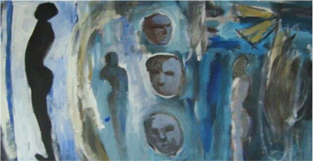
من أعمال الفنان محمد القاسمي

يضاف إلى ذلك جُربة انقرذ بها وهي جُربة «الرسم المفتوح»، وتدخل في خلق نوع من الحركة، وتقريب الفن من المتلقي، وهي أول جُربة من نوعها على مستوى المغرب وربما العالم العربي، كان يهدف من ورائها إلى توفير فرصة للجمهور لتطلع من خلال ذلك على الأشياء الذاتية والخاصة جدا للمبدع.