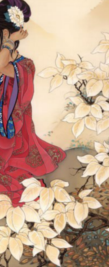
من الفن الياباني

تتاول الفنانون اليابانيون الموضوعات المستمدة من العوالم الخارجية وخاصة المناظر الطبيعية التي ابداعوا في نقل اجوائها الساخرة بدقة وعذوبة كبيرة، اضافة الى رسم للعوالم المتغيرة، وعالم المرأة، والمسرح الذي كان مزدهرا في تلك الحقب التاريخية واللوحات المعروضة التي غلب عليها الطابع التزييني التي هي تكرر لما نلخه هؤلاء الفنانون على الستائر والمراوح والاقنعة والاسلحة والابواب والاواني السيرامكية، الا ان المشاهد لها يستنتج بعمق الحس الجمالي والرهافة الشائقة، اذ تعكس تلك الطبيعة الجغرافية التي عاش وسطها الفنان، فأغنت شاعريته وقدمت له القدرة المتفوقة على استيعاب وتذوق كل ما يتدفق منها، كما جعلت منه ينلک الاجاهات ايجابية للواقع. ويتميز الفن الياباني بصورة عامة بالطابع القصصي السريدي والمحمي، ذلك لأن رؤبة الفنان للأشياء التي يحيطه، هي مزيج لرؤيته التخيلية المتداخلة لاكتشاف اسرار ومعاني وخفيا الطبيعية التي كان يرسمها ببهجة وامعان كبير في التزيين حيث يعكس ذلك الحاجات الترفه في تلك اللوحات التي عادة ما تتميز بأناقة الوانها وحسن انتظام بانائها.