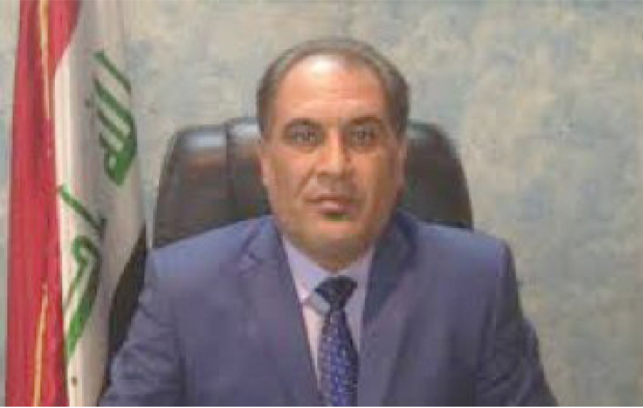
نقيب المعلمين العراقيين