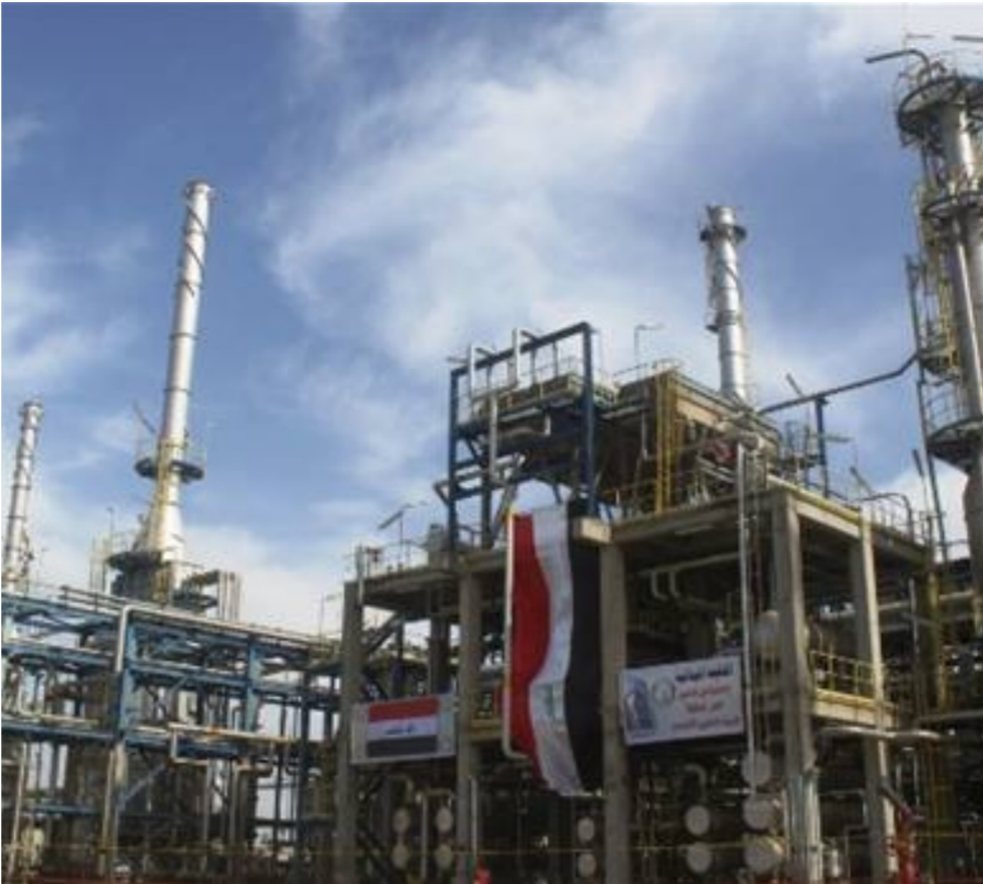
مصافي النفط العراقية

تكرير جيكبنة، طاقة كل واحدة منها (70) ألف برميل يومياً، والثاني مصفى الشمال بطاقة (150) ألف برميل يومياً. تم تنفيذ من قبل شركة يابانية. وإن التدمير الذي لحق بمصفي بيجي جبراً، جدهم، نتيجة احتلال داعش له وخروجه منه لأكثر من مرة، وحواله إلى ساحة حرب وقتال. تم طرد داعش منه في أيلول 2015.