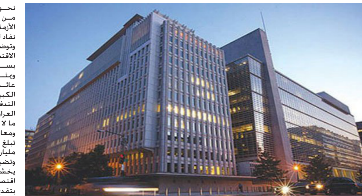
البنك الدولي يخشى من انهيار واحد من أقوى اقتصادات الشرق الأوسط