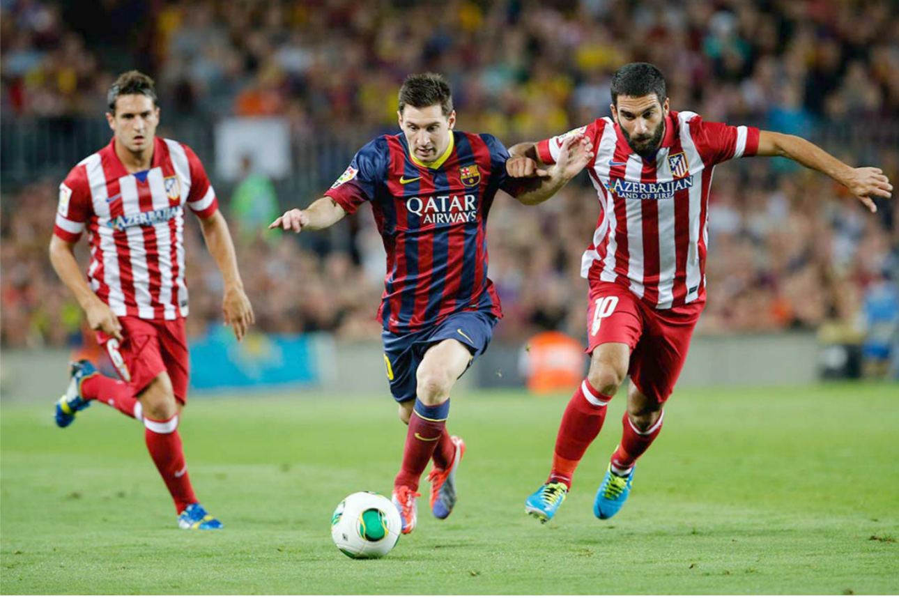
مباراة سابقة لبرشلونة وأتلتيكو مدريد

ويأمل بطل الدوري الفرنسي هذا الموسم، في استغلال حسمه للقب قبل عدة أسابيع من انتهاء البطولة من أجل بلوغ الدور نصف النهائي، ولا سيما بعد حظه العثر الذي منعه من تخطي هذا الدور في آخر ثلاث مواسم أمام برشلونة، مرتين عامي 2013 و 2014، وتشيلسي في عام 2015. في المقابل يأمل السيتيزنس في مواصلة صناعتة التاريخ بعدما توقفت مغامرته القارية في آخر موسمين عند الدور ثمن النهائي أمام العملاق الكاتالوني.