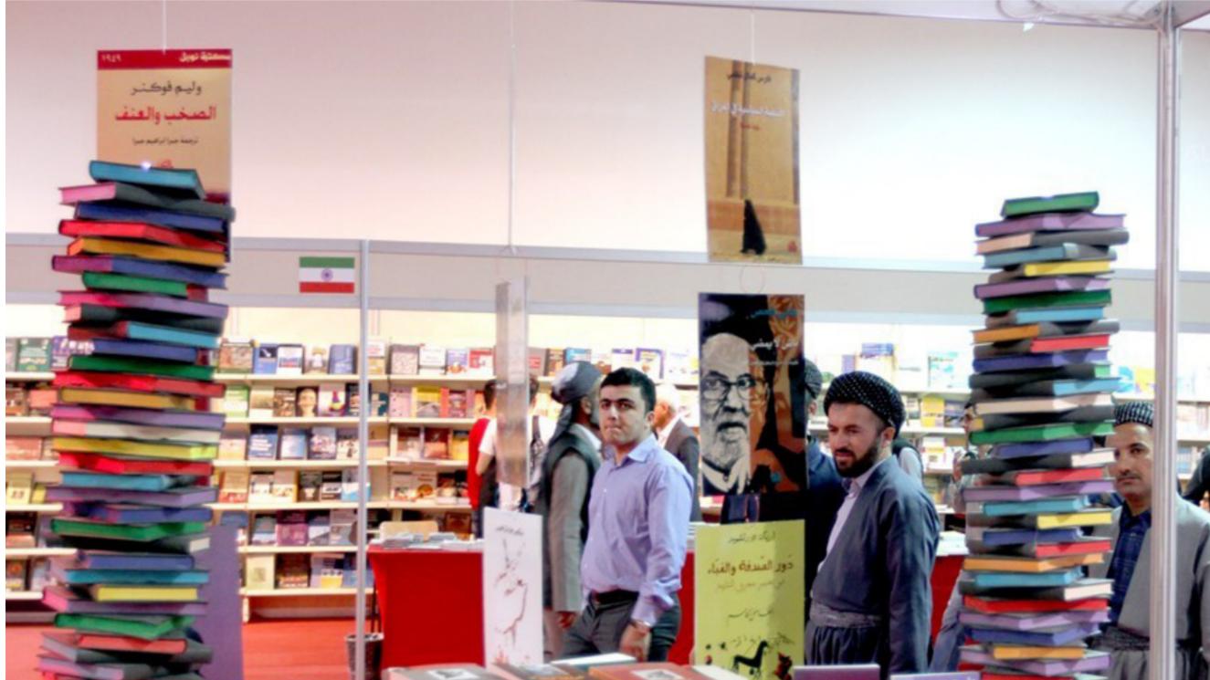
من أجواء المعرض

مربع يؤجره مبلغ مئة دولار، وهو مبلغ كبير لا يتناسب مع كميات واعداد الكتب المباعة. مصدر مطلع رفض الكشف عن اسمه أكد أن مؤسسة المدى جني سنويًا مبلغ مليون و600 ألف دولار من معرضها الذي تقيمه سنويًا للكتاب. من تأجير أرض المعرض إلى باعة الكتب إضافة إلى تأجير أقسام المعرض الأخرى من مطاعم ومقاهٍ والخدمات الأخرى التي تقدم داخله.