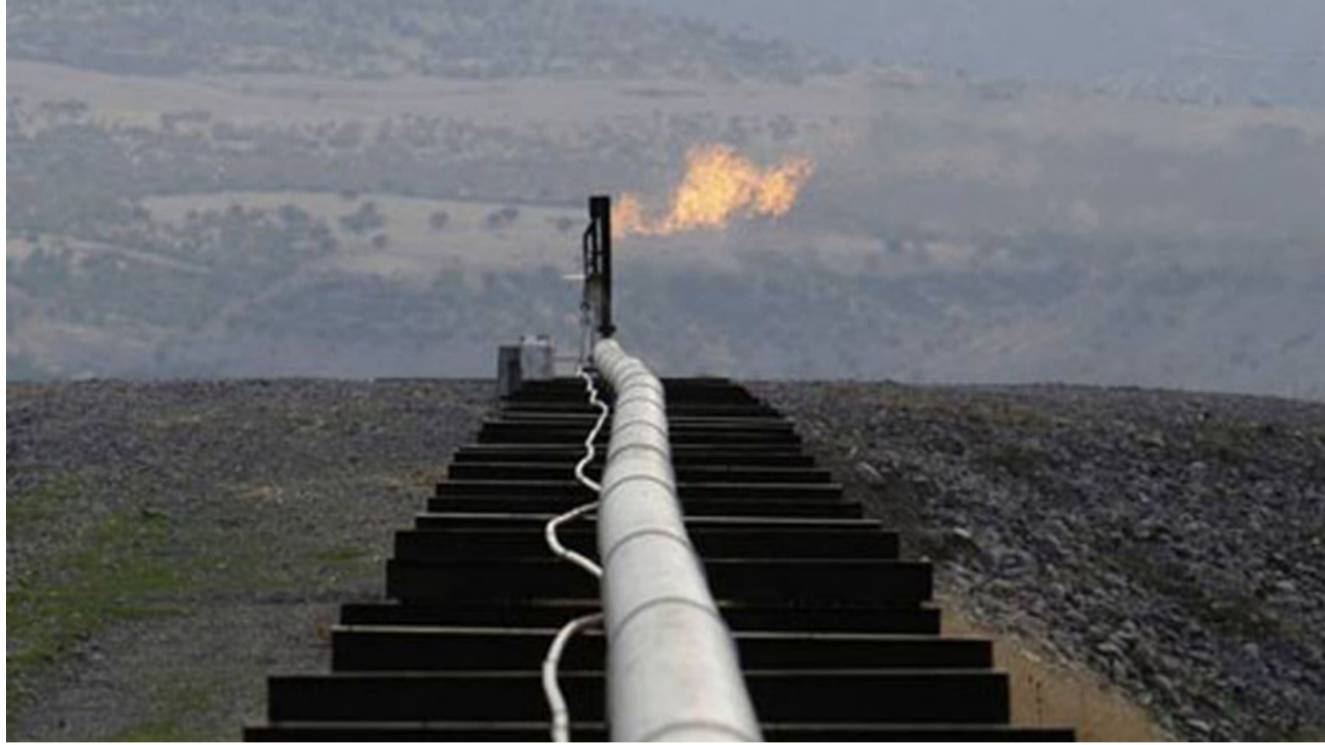
أحد أنابيب تصدير النفط في الإقليم

داخل أوبك وخارجها مثل المملكة العربية السعودية وروسيا خطوة إيجابية». ويشأن احتمالية حضور اجتماع الدوحة قال زنگنه إنه سيحضر الاجتماع بالتأكيد «إذا كان لديه وقت» بحسب مهر. وتقدر مصادر ثانوية من أوبك حجم إنتاج إيران حالياً بنحو 2.93 مليون برميل يوميا. وتسعى طهران إلى استعادة حصتها السوقية وبخاصة في أوروبا حيث أدت العقوبات إلى تراجع صادراتها من مستوى الذروة الذي بلغ 2.5 مليون برميل يوميا قبل 2011 إلى مليون برميل يوميا فقط في السنوات الأخيرة.