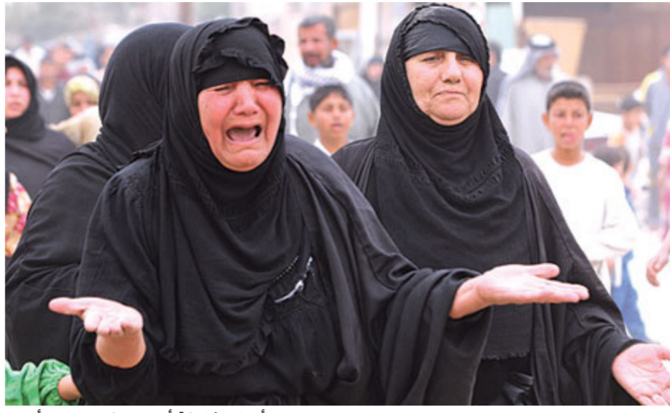
أحزان الخليفة أجمع سكبت على رأسها

ظلام ايامي. جنة الله في الارض. امي كل عام وانت بعافيتك كل عام وروحك عامرة بالسعادة كل عام والابتسامة لا تفارق وجهك. امثال الله عمرك تفانيت نعمة الأم التي ولدت وربت وسهرت.