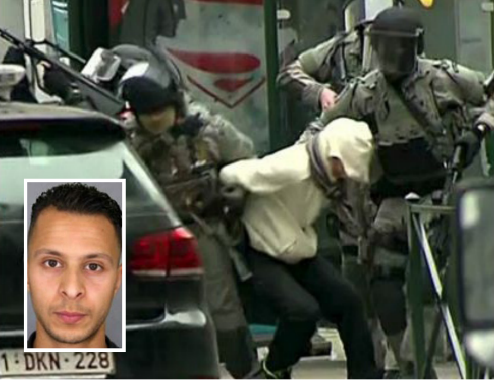
اعتقال المتهم صلاح عبد السلام

ثلاثة احزمة "مصنوعة يدويًا" وعلى بصمات صلاح عبد السلام. المعلومة المهمة التي وصلت عليها الاستخبارات البلجيكية والفرنسية هو اعتراضهم مكاملة صادرة من صلاح عبد السلام يوم 16 مارس 2016 الى صديقه «امين شكري» يحمل جوازاً سورياً يطلب منه تأمين سكن له بعد فراره من شقة في ذات الحي «مولينبيك» والتي لا تبعد الا عشرات الامتار.