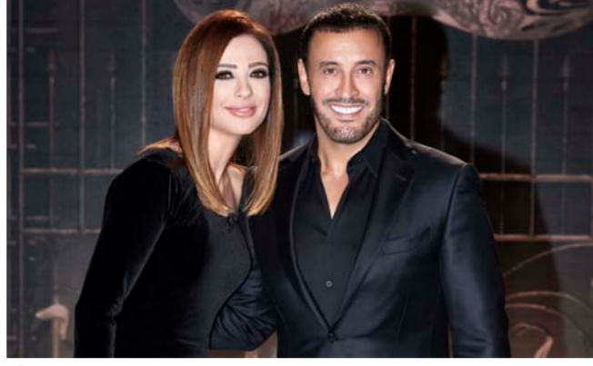
الساهر في "المتاهة"

تصفها وفاء بالجريئة. وتطلب منه أن يلقيها. فهل يلبي طلبها أم يتجنب النقد الذي قد يتعرض له بسببها؟ وفي موازاة ذلك. يتحدث عن الخجل المبالغ به الذي زرعه أهله في أبنائهم. فأثر عليهم سلباً. فهل نجح اليوم في التغلب عن خجله والتبريد عليه أم أنه ما زال يبرز خت وطأته؟ كما يروي ما حصل عندما تعرف إلى أول فتاة في حياته. ويجيب عن سؤال عنوانه المرأة والعذاب. فينصح الشباب المنصرف عن الزواج. إلى الارتباط سريعاً لأن "الزواج ليس صعباً. بل الوحدة هي القاتلة".