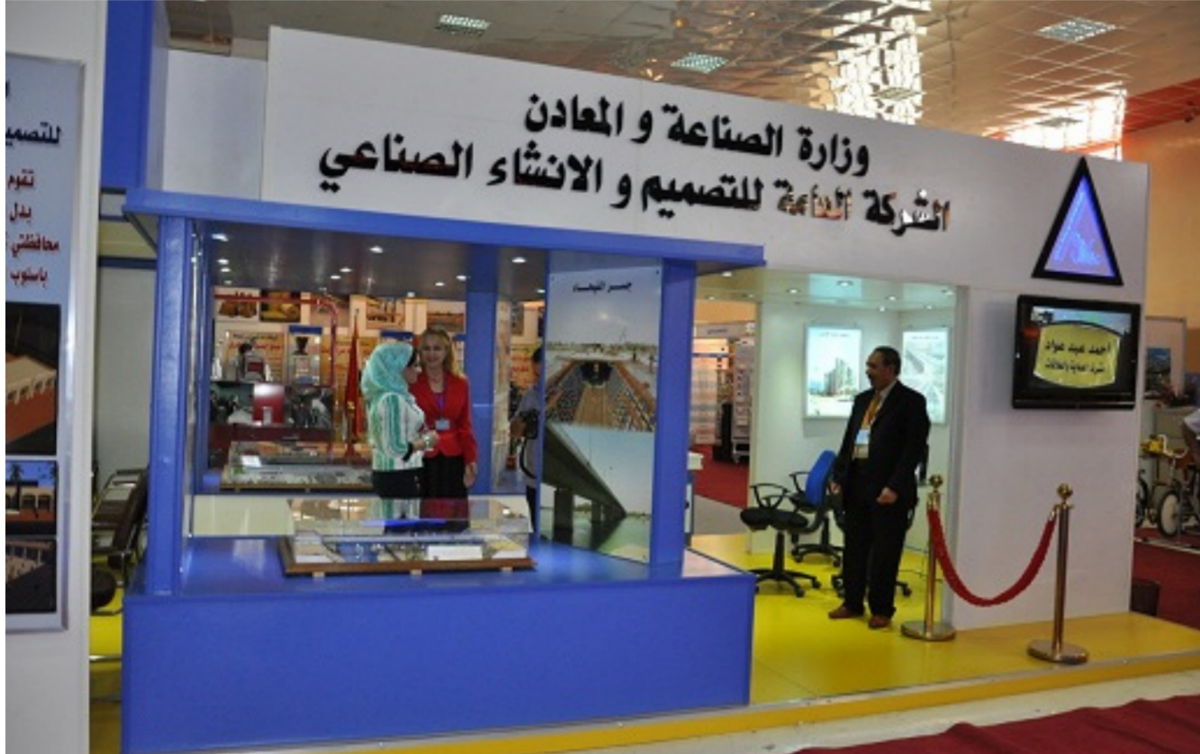
الشركة العامة للتصميم وتنفيذ المشاريع

خُذ فيها العفوقات خلال فترة اقصاها اسبوع لتشخيص العفوقات التي قد خُذت. ووجه الوزير باليول والاستعانة بالقطاع الخاص والعام لترويج المنتج الوطني من خلال الدعاية والاعلان، مؤكداً على تسويق جميع منتجات الشركات الراكدة وخويلها الى كاش، مشيراً الى اعتماد مندوبي للتسويق عبر شركاتكم ووضع خطة عمل للتسويق في الشركات.