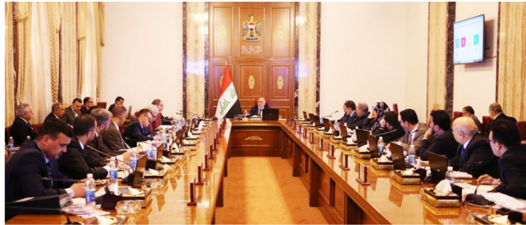
من أجواء الجلسة الأخيرة لمجلس الوزراء

استعداد وزراء لترك مناصبهم "لا تقتضيه المصلحة العليا" "الأرهاب".