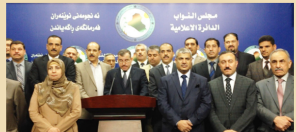
مؤتمر صحفي لاتحاد القوى "ارشيف"

وتابع الكربولي أن "الاتحاد ابلغ العبادي بأنه لن يقدم وزرائه من دون معرفة أسماء الذين سيتم اقالمتهم، وأسباب ابعادهم من مناصبهم لكي نفتح الشارع بإجراءات الحكومة". وأشار إلى أن "عملية الاستبدال يجب أن تخضع إلى آليات علمية فيجب أن نعرف أن المشمول قد يكون وزير الدفاع لكي نرشح ضابطاً في الجيش وهذا بالنسبة لبقية وزارات اتحاد القوى الخمسة. فمن غير الصحيح أن نقف أمام هذه الضبابية".