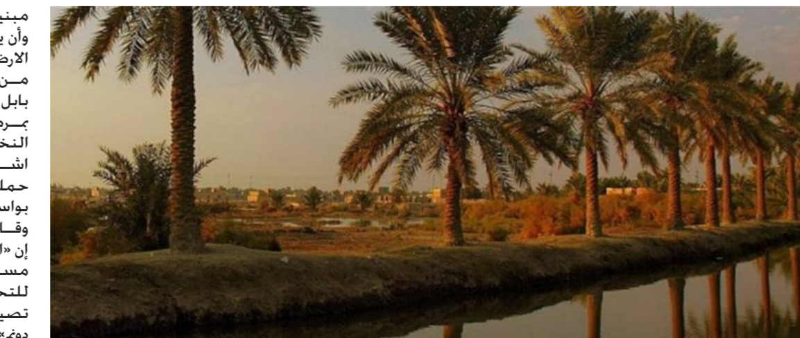
أحد بساتين بابل