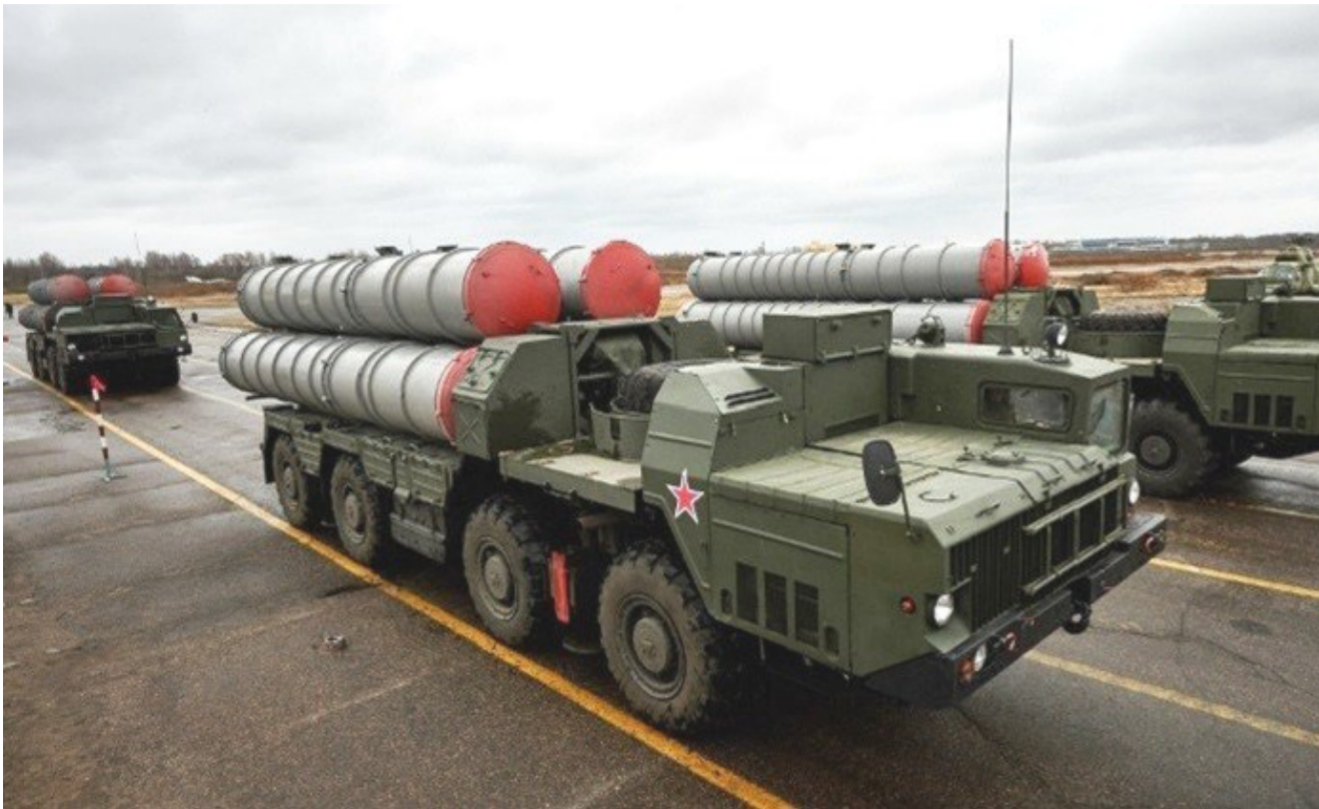
معدّات روسية في سوريا

إجراء بانتخابات رئاسية جديدة تشرف عليها الأمم المتحدة خلال 18 شهراً. وأوضح الكرملين في بيان له أن بوتين والأسد اتفقا على نجاح العمليات التي نفذتها القوات الجوية الروسية في سورية. بما سمح لهم باستعادة الوضع بعد محاربة التطرف في المنطقة. وإحراق الضرر بالبنية التحتية للمسلحين.