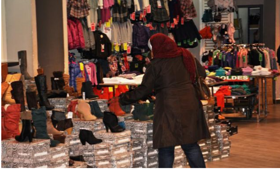
تباينت الآراء بين مصدق ومكذب