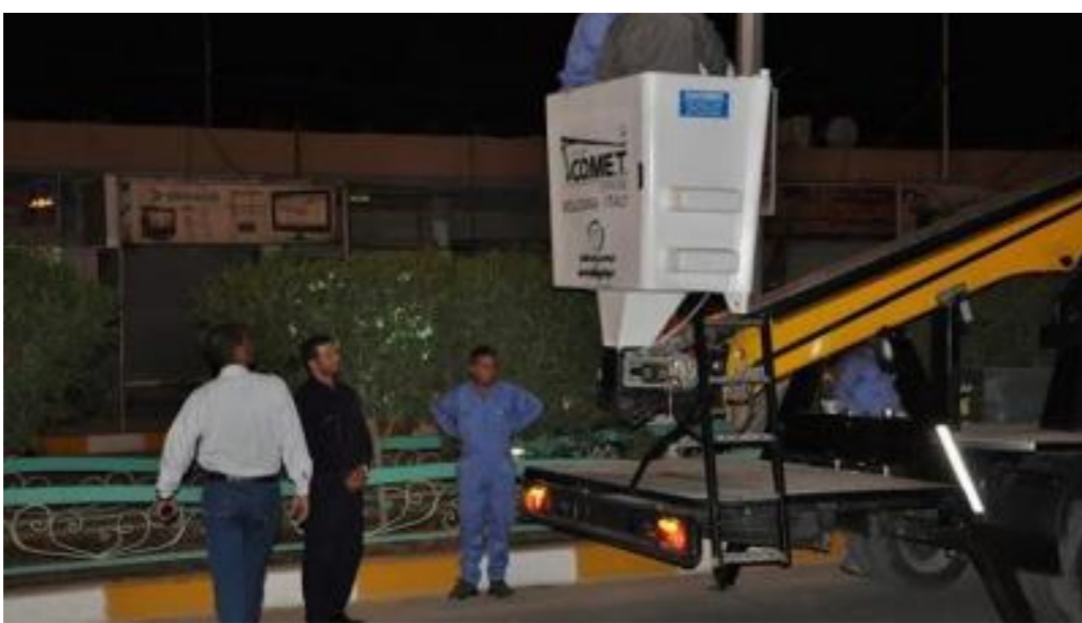
تنفيذ مشروعوي الإنارة الديكورية في عدد من شوارع بغداد