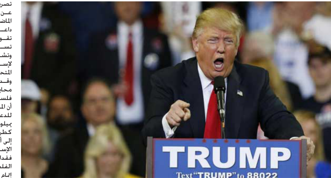
المرشح الجمهوري للرئاسة الأمريكية دونالد ترامب

ويتبين من هذه التصريحات أن ترامب لا يمكن التنبؤ بسياسته. ففي الوقت الذي كان فيه مرشحا الرئاسة السابقين لا يدعمون دوماً السياسات التي تتوافق مع رؤية إسرائيل. ولكن غالبيتهم كان يمتلك جدول أعمال مفهوم. فالرئيس