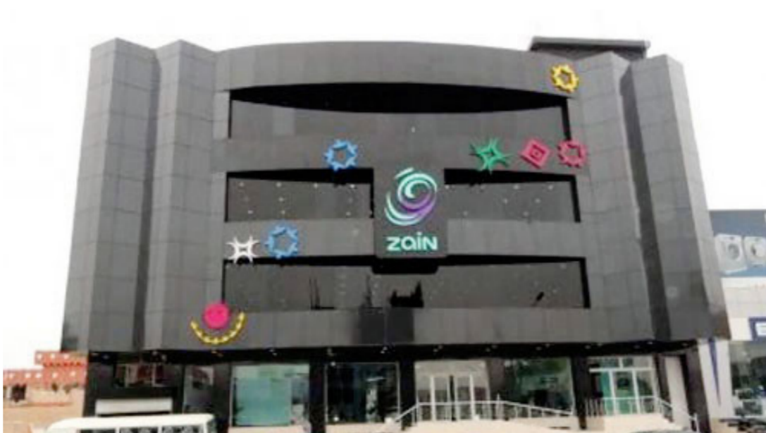
برنامج «هسة البية» يعتمد على أساليب مبتكرة لتفعيل العلاقة مع الشباب العراقي

«هسة البية» يعتمد على أساليب مبتكرة لتفعيل العلاقة مع الشباب العراقي . حيث صاحب اطلاق البرنامج منصة على الفيسبوك لكل من يمتلك الطموح لتحقيقه في جميع المجالات والتي ستكون فرصة للشركة لتفعيل الشراكة مع الشباب العراقي الطامح من خلال خفيهم وتمكينهم من الأدوات المطلوبة لتحقيق الاهداف وهو