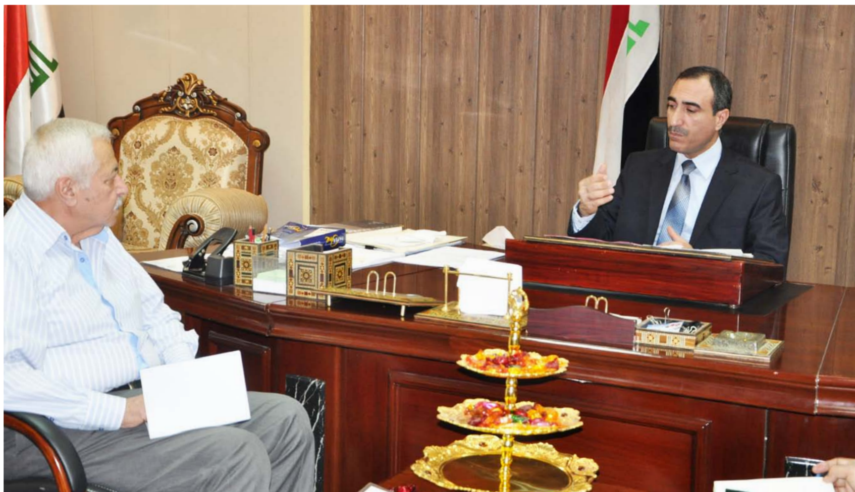
مفتش «الثقافة» مع المحاور

الرأي العام يطلب منا فتح هذه الملفات لوجود مواطن فساد وتبتهات وسلبات رافقت هذا المشروع ، ليست الغاية فتح هذا الملف ولكن الغاية الوصول الى نتائج نتيجة الأدلة المتوفرة لتورط البعض في الفساد ولذلك فتحنا ملفات منها ملف الاوبرا وهذا ملف شائك جداً المكتب يحقق به حالياً ونأمل في مدة قريبة جداً ان تعلن النتائج على الملأ