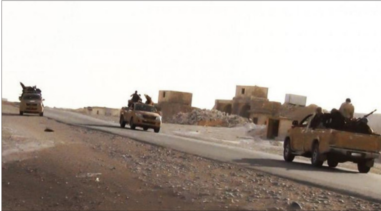
عناصر داعش جنوبي الموصل

وتضاعفت شكوكه بعد استهداف مواقعه وجمعائه وخزكانه بنحو اكبر من السابق. بضمناها ضرب رتل له من 6 عجلات قرب القيارة. واستهداف مضافاته واعشاش ومواقفه التي حرص على تويهها بنحو كبير". على صعيد آخر استمرت الغارات الجوية العنيفة التي يشنها الطيران الحربي للحلف الدولي والقوة الجوية العراقية بضرب مواقع التنظيم في مناطق نفوذه بمحافظة نينوى. فقد تم شن غارة جوية على معمل الثلج في منطقة الرجيلي بالجانب