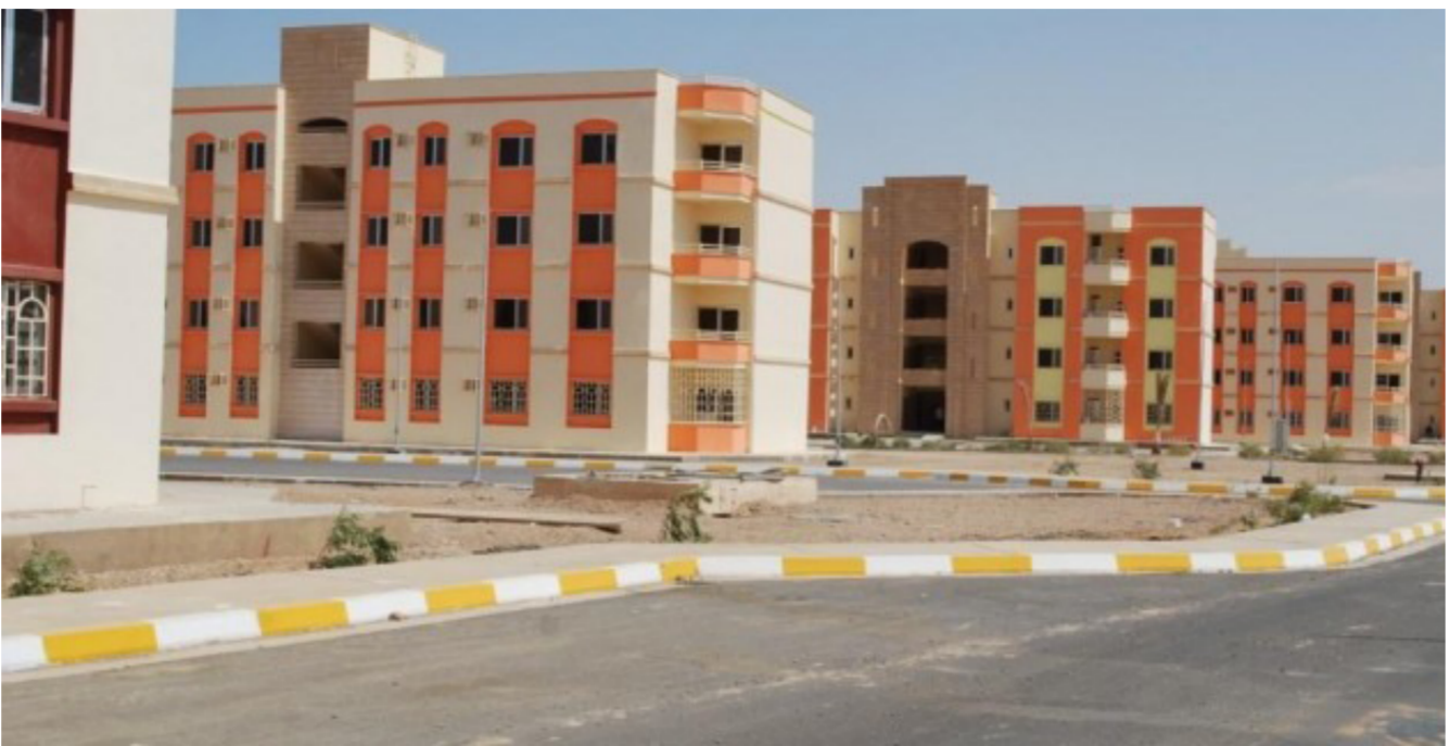
أحد المجمعات السكنية في العراق

ولفتت مراد الى ان قوائم الفقير . المشمولة بالأكشاك التجارية في محافظة القادسية اكتملت