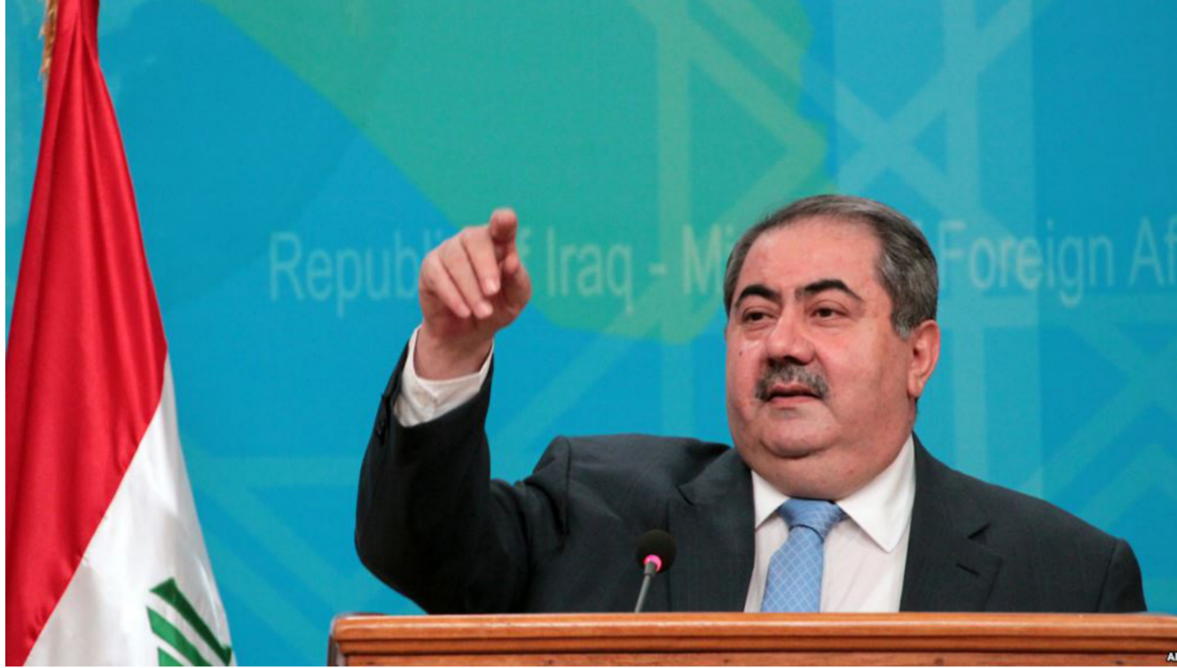
وزير المالية هوشيار زيباري

التي ستذهب للمصفاة الهندية تضم 290 ألف برميل من حصة برتامينا في امتياز بحقل غرب القرنة و700 ألف برميل تشتره من حقول عراقية أخرى. وطاقة تكرير برتامينا المحلية نحو مليون برميل يوميا وتلي ثلثي الاستهلاك اليومي في اندونيسيا.