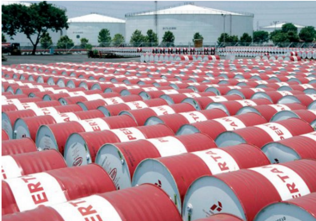
سيتراجع الإنتاج الأميركي بمقدار 530 ألف برميل يومياً في 2016

بغداد - الصباح الجديد: أعلنت اللجنة الإعلامية لرئيس الوزراء حيدر العبادي أن الأخير ترأس اجتماعاً للجنة الطاقة الوزارية، فيما أشار إلى إحالة مشروع أنبوب غاز وجهاز نصب اذرع خميل ميناء البصرة. وقال المكتب في بيان صحفي، إن «رئيس مجلس الوزراء حيدر العبادي ترأس اجتماعاً للجنة الطاقة الوزارية بشأن تحسين تجهيز الطاقة الكهربائية للمواطنين». وأضاف المكتب، أنه «جرى خلال الاجتماع مناقشة تنفيذ القرارات