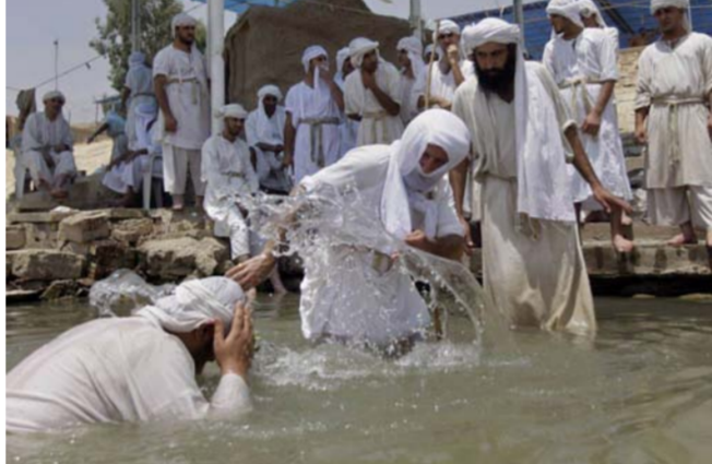
من طقوس إحياء عيد الخليفة

أيام مقدسة ومضيئة تمثل من منظور مندائي فجر الحياة المكتمل والخلق العظيم الأول. في العقيدة المندائية كاليوم