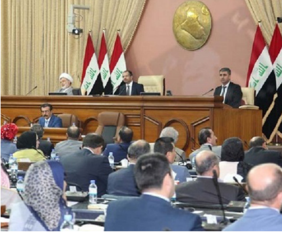
جلسة سابقة لمجلس النواب العراقي

وشدد على أن المنضمين لهذا التجمع «سيقفون وقفة واحدة تعبر حدود الدين والطائفة والقومية والأيديولوجيات، ليكونوا عراقيين يمثلون العراق وهم على قدر المسؤولية إن شاء الله». وأعلن النائب عبد الكريم عبطان عن ائتلاف الوطني الذي يقوده أباد علاوي، في بيان تلاه عن تشكيل كتلة نيابية جديدة وصفها بأنها «كتلة للطائفية لا لتشال العراق من واقع الحالي».