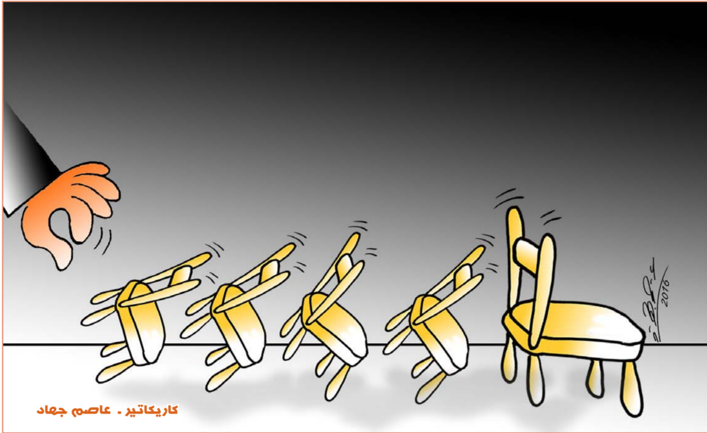
كاريكاتير - عاصم جهاد

أعلن أسطورة كرة القدم البرازيلية بيليه أنه سيباع في مزاد ميدالياته وكوؤسه وحتى التاج الذي حصل عليه بعدما سجل هدفه الألف. ويشمل المزاد نحو ألفي قطعة. بينها الميداليات الذهبية التي حصل عليها بفضوه مع منتخب بلاده في مونديال 1958 و1962 و1970. والحذاء الذي ارتداه خلال تصوير فيلم "الهروب إلى النصر". وقال خوسيه فورتوس المستشار الشخصي لبيليه إن الأموال التي سيتم جمعها من المزاد سيتم تخصيصها في المستقبل لمساعدة ذوي الالام السابق البالغ من العمر 75 عاماً. وأشارت دار "جوليز" للمزادات إلى أن جانباً صغيراً من إيرادات المزاد سيتم تخصيصها لمستشفى "بيكينو برينسيبي" للأطفال في مدينة كورتينا البرازيلية. وأوضح بيليه. في بيان. "قررت السماح للجماهير وهواة الجمع امتلاك جانب من تاريخي. أتمنى أن يكتسبوا هذه القطع ويروا قصتي لأطفالهم والأجيال القادمة". وتبرز من بين القطع المعروضة للبيع في المزاد الكأس الذي كان الاتحاد الدولي لكرة القدم (فيفا) يسلمه لأبطال المونديال حتى العام 1970. والذي تتراوح قيمته المتوقعة بين 400 و600 ألف دولار. وفقاً لتقديرات الدار.