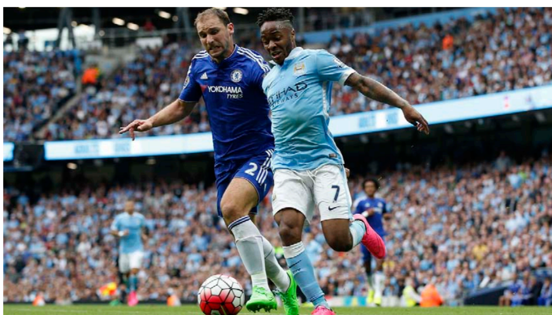
جانب من منافسات كأس الاتحاد الإنجليزي

يونايتد أمام مضيفه ليفربول صفر 2/ مساءً أمس الأول في ذهاب دور الثمانية بعد أن تأهل إليه بصعوبة، إذ كان قد تعادل على