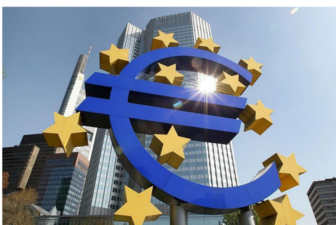
مبنى البنك المركزي الأوروبي

وترد هذه التحذيرات قبل شهر من مهلة تنتهي في 15 نيسان المقبل لأعضاء الأخاد الأوروبي، لتقديم خططهم الطويلة الأجل للموازنة إلى مقر المفوضية الأوروبية في بروكسيل. وستقرر المفوضية في أيار المقبل، إذا كانت إيطاليا والدول الأخرى التي أرسلت لها تحذيرات اتخذت إجراءات