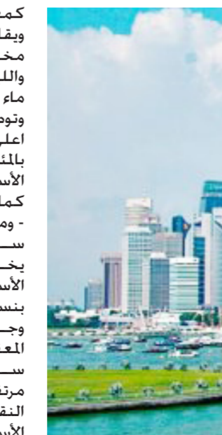
جانب من مدينة سنغافورة

كمبيار. ويقارن البحث بين 160 سلعة وخدمة مختلفة بما في ذلك تكلفة الطعام واللباس والماء والخدمات المنزلية من ماء وكهرباء. وتوصل البحث إلى أن سنغافورة اعلى تكلفة من نيويورك بنسبة 11 بالمئة بما يخص أسعار المواد الغذائية الأساسية. كما توصل البحث إلى أن سنغافورة - ومعها العاصمة الكورية الجنوبية سول - هي الأعلى في العالم فيما يخص أسعار الملابس. حيث تزيد الأسعار فيها عن الأسعار في نيويورك بنسبة 50 بالمئة. وجاء في البحث «الأهم أن النظام المعقد للاحتياجات المعمول به في سنغافورة يجعل أسعار السيارات مرتفعة جداً. والنتيجة أن أسعار النقل فيها يبلغ ثلاثة أضعاف الأسعار في نيويورك.» وقالت وحدة المعلومات بالإيكونوميست إنه «من النادر جداً» أن يبقى ترتيب المدن على حاله في تقريرين سنويين متتاليين. خصوصاً إذا أخذنا بنظر الاعتبار انخفاض أسعار النفط وانخفاض معدلات