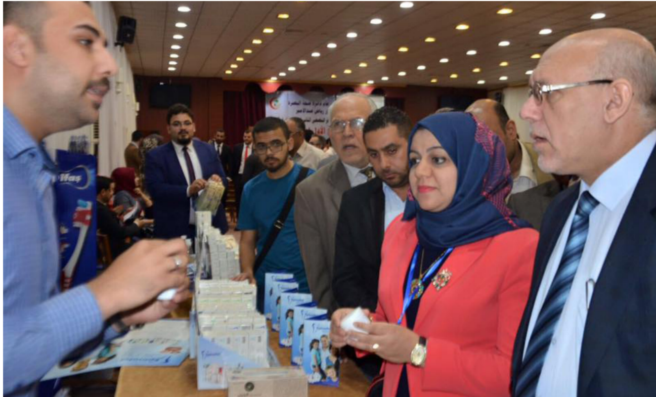
جانب من احتفالية صحة البصرة في يومها العلمي الأول لطب الأسنان