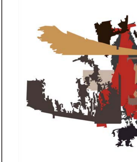
من أعمال الفنان الراحل احمد الربيعي

أين الرجيل ؟؟ فكل الدروب خديعة الا الوطن ضافت بكم ؟ تبيست اغصانكم ؟ جفت على ثمر الوجود سماءكم ؟ تلعثمت خطواتكم ؟ ردوا فهي البلاد قد اجبت اسماءكم وترلت عند المواجه صوتكم و بكم قضت ان لا تمت و بدماءكم تمردت حتى استسحت فجميعكم قد خانها بلا خجل و باج بكارة طهرها وغدا هناك عند البعيد عند ..... البعيد ستقولون بأنكم لم تخذلوا وانكم لم تجرحوا وانكم قد جرحكم وهن الغباء و رحلتوا