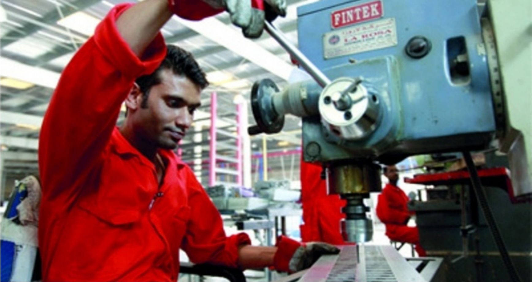
المشاريع الصغيرة والمتوسطة تحقق التنمية المستدامة