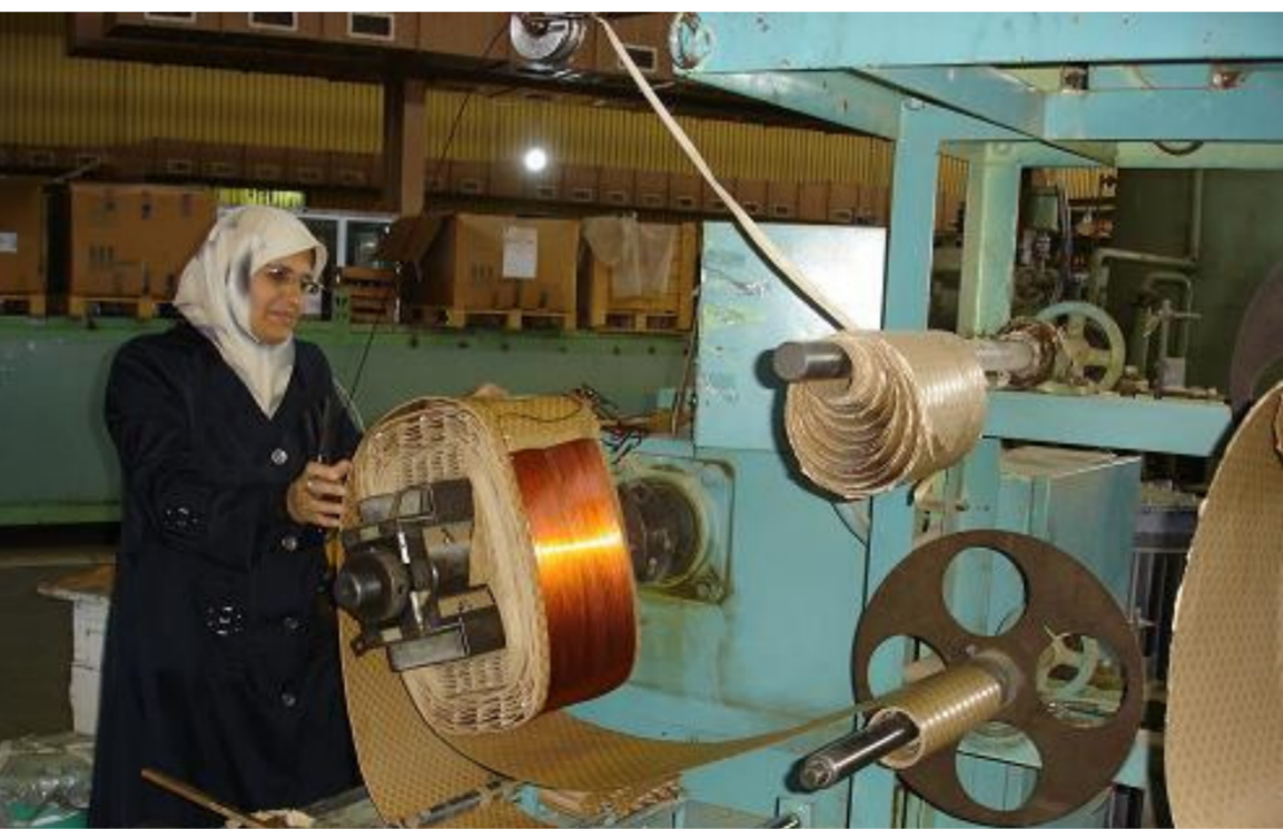
الشركة العامة للصناعات الكهربائية

وقال المدير العام للشركة انه وعلى الرغم من معالجة الشركة لجمع نقاط الانتاق والصعود بطاقتها الانتاجية إلى الذروة اضافة إلى سعيها لتطوير منتجاتها وتخفيض الأسعار وتسديد فترات ضمان وصيانة مجانية إلا ان المخاوف ما زالت قائمة من تدني مؤشراتنا المالية بشكل كبير بسبب صعوبة الحصول على عقود عمل ما يتطلب تقديم الدعم والاسناد لهذه الشركة الصناعية ذات الامكانيات الهندسية العالية والتي قامت بتجهيز وزارة الكهرباء بما يقارب 6278 محولة من شتى الانواع والسعات و221798 الفاً و798 مقياسا كهربائيا من شتى