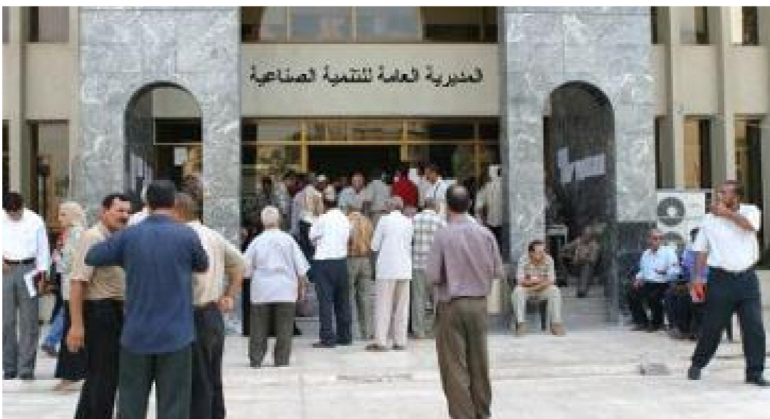
المديرية العامة للتنمية الصناعية

اعلنت المديرية العامة للتنمية الصناعية التابعة الى وزارة الصناعة والمعادن عن اهدافها لبناء استراتيجية صناعية متقدمة في العراق والابتعاد عن الاساليب التقليدية واتباع اساليب جديدة على ان يكون سعيدا ان الاهداف والتطلعات التي تطمح اليها المديرية هي تقديم افضل الخدمات للمصنعين والمستثمرين العراقيين وتشجيع الاستثمار في القطاع الصناعي من خلال رعايتهم ودعم المشاريع الصغيرة والمتوسطة ودعم الشباب خريجي الكليات والعاقلين عن العمل بتأسيس المشاريع الصناعية والسعي الى تنفيذ قانون حماية المنتجات العراقية للقضاء على المنتج المستورد.