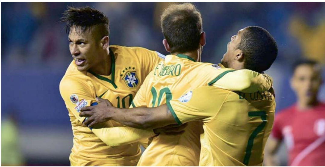
المنتخب البرازيلي يستعد لتصفيات المونديال

المؤهلة للمونديال إذ سيضيف «السيلبستي» يوم 25 آذار الجاري وختل البرازيل المركز الثالث برصيد 7