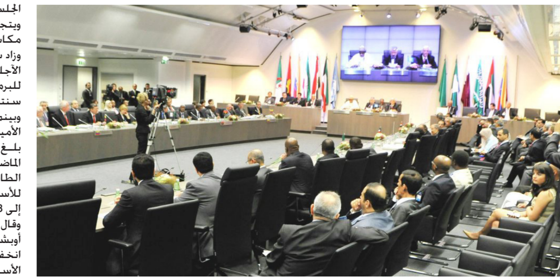
اجتماع سابق لـ (أوبك)

بالتعاون مع دول أخرى على خفض الإنتاج الأميركي في 2014. وارتفع سعر خام القياس العالمي مزيج