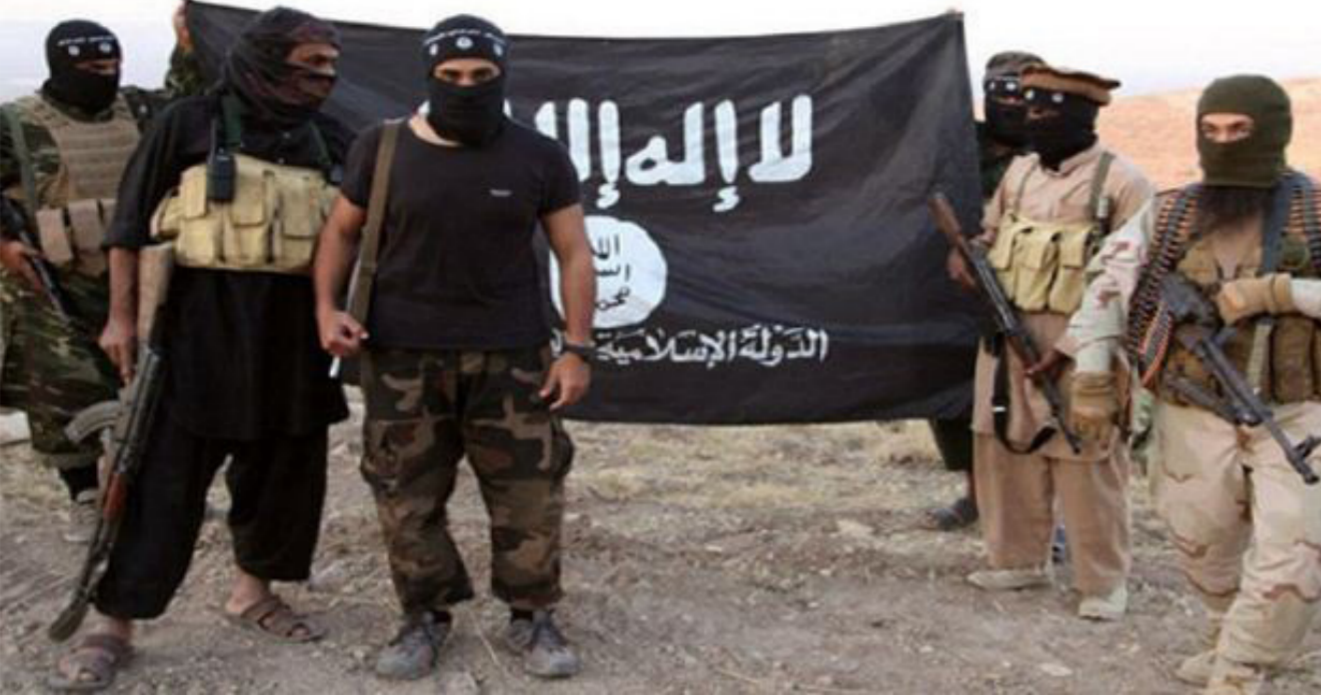
داعش استعملت الاسلوب نفسه في سامراء وابو غريب

الوزارية ستقيم الوضع النهائي للسايلو والأضرار التي لحقت عن الفعل الإرهابي الغادر وتعد تقريراً كاملاً بهدف إصلاحه أو اتخاذ الإجراء المناسب الذي يعيد تأهيله مجدداً . وشهد قضاء أبو غريب إجراءات أمنية مشددة بعد تعرض نقطة عسكرية إلى هجوم إجرامي ما أسفر عن استشهاد جنديين اثنين وإصابة خمسة آخرين . فيما نفت قيادة عمليات بغداد . وجود نزوح للعائلات في منطقة أبو غريب غربي العاصمة.