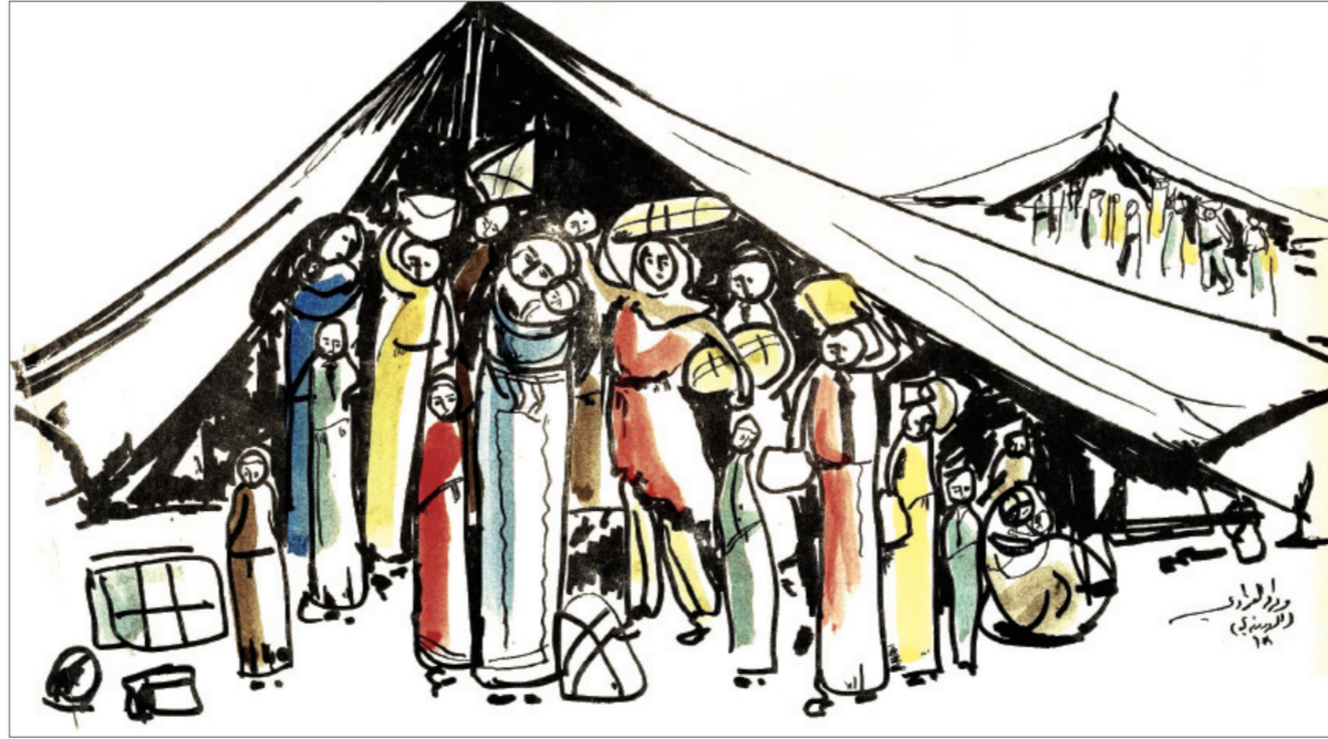
لوحة تمثل اللاجئين