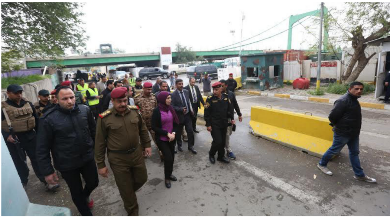
جانب من افتتاح الشارع

فيما قال احد المارة الى ان «شارع ابو نوس الذي يقع على الضفة الشرقية من جهة الرصافة من نهر دجلة ويمتد بين جسر الجمهورية في منطقة الباب الشرقي والجسر المعلق في منطقة الكرادة الشرقية. والذي تقف على جوانبه اضافة الى المقاهي فهناك قاعات للعرض الفني والمطاعم». وعاش هذا الشارع عصره الذهبي خلال السبعينات والثمانينات من القرن الماضي حتى توقفت الحياة فيه خلال الحروب والحصار وما حدث من عمليات عسكرية خلال العام 2003.