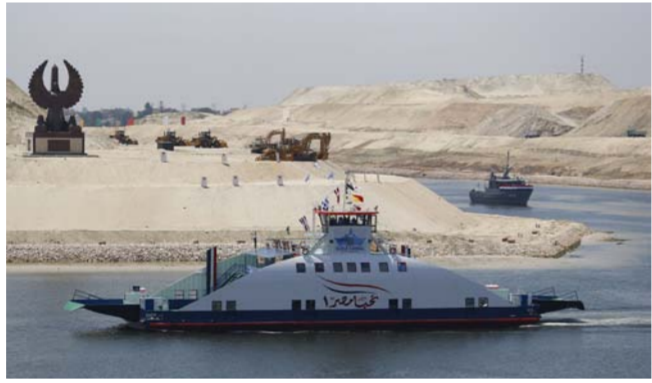
قناة السويس الجديدة

بأن المجلس لن يأخذ تصاريح من أي وزارة. وأضاف، في حديث نقلته «الحياة» الدولية الإلكترونية، أن هناك ستة موانئ في المنطقة ومناطق اقتصادية يجري نقل أصولها إلى هيئة قناة السويس، إلى جانب تكوين فريق عمل محترف. بموازة مجلس إدارة يضم خبرات علمية وعملية تساهم في تنفيذ المخطط في شكل سليم.