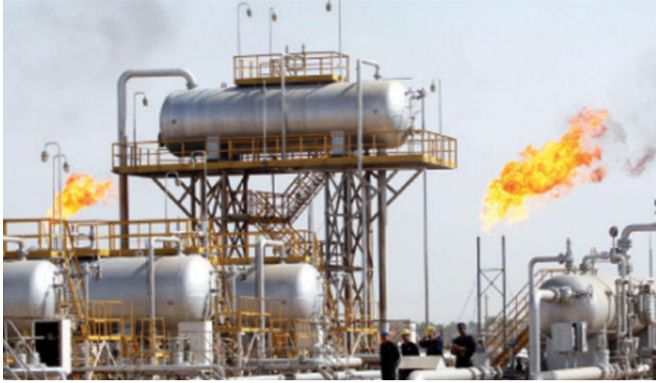
أحد الحقول النفطية في البصرة

وأعلن وزير النفط في 30 كانون الثاني 2016 أن تقارير الوزارة تشير إلى أن نسبته 55% يتم استثمارها حاليا، مؤكداً أن «الوزارة تسعى إلى خلال هذا العام والعام المقبل إلى إيقاف حرق هذا الغاز كلياً والاستفادة منه محلياً وتصدير الباقي».