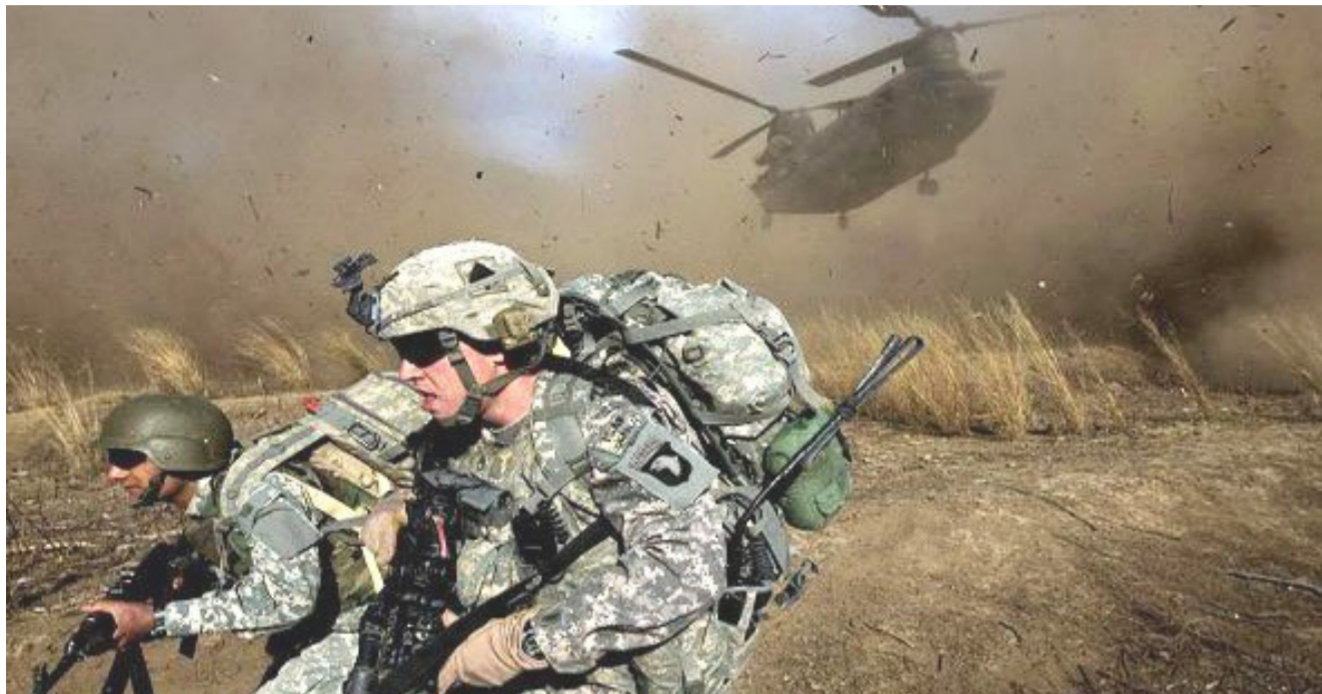
القوات الخاصة الأميركية في افريقيا

ذلك الحين من السيطرة على عدة أماكن كانت في السابق تحت سيطرة مجلس الشورى. ونجحت في طرد داعش من عدد من الأحياء الرئيسية التي كانت تحت سيطرته في السابق. ولتفت الدايري إلى إضادة الرئيس الأميركي بباراك أوباما رئيس الولايات المتحدة الأميركية والتي حيا فيها فرحة الشعب في بنغازي بالانتصارات الأخيرة على داعش وعلى المنظمات الإرهابية الأخرى. معربا عن شكره لهذه التحية وهذا الدعم من قبل رئيس دولة الولايات المتحدة الأميركية.