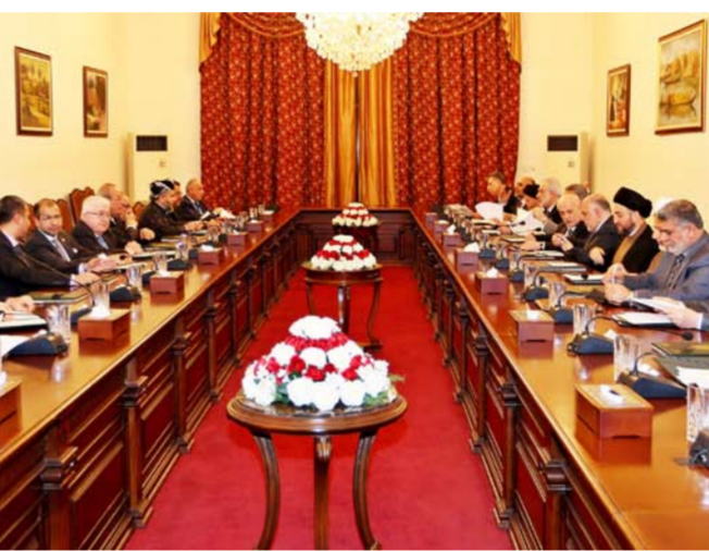
من اجتماع السلطات الثلاث مع قادة الكتل السياسية

بغداد - وعد الشمري: ينوي رئيس الوزراء حيدر العبادي الاعتماد على لجانه في اختيار الطاقم الحكومي الجديد من دون اللجوء إلى ترشيحات الكتل السياسية، لكنه سيتفق مع زعمائها قبل عرض الأسماء على الدعوة الإسلامية على هذه الآلية، فيما أبدى خالف القوى العراقية استعدادها للتخلي عن مناصبه مقابل إنجاز المصالحة الوطنية واستكمال جميع الإصلاحات. ويقول المتحدث باسم الحكومة سعد الحديثي في حديث مع "الصباح الجديد"، إن "رئيس الوزراء حيدر العبادي سيتعامل بطريقة تختلف عما كانت عليه في السابق بخصوص تقديم طاقمها الوزاري الجديد". وتابع الحديثي أن "الكتل السياسية لن تقدم مرشحاتها كما هو حال الحكومات التي تلت عام 2003، إنما العبادي سيتولى هذه العملية من خلال اللجان المشكلة في مجلس الوزراء". وأشار إلى أن "الاختيار سيكون