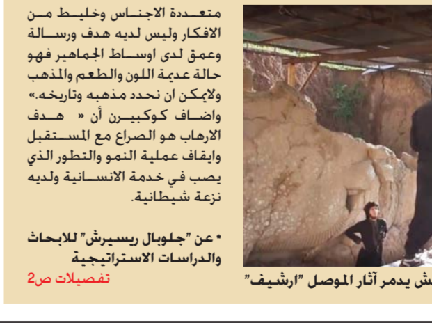
داعش يدمر آثار الموصل "ارثيف"

ترجمة: سناء البديري* أشار الكاتب باتريك كوكبير في دراسة عميقة أعدتها لدراسة هذا التنظيم الخطير الذي انتشر كالآخطبوط في الشرق الأوسط حيث قال "لم تكن يوماً وعلى مر التاريخ أي منظمة إرهابية تملك من القوة والشجاعة استطاعت أن تسيطر على موطنه قدم واحفظت به من خلال هجماتها واسلوبها في عملية القتال والمراوغة لسبب بسيط إن الإرهاب لا يملك الصفة الشرعية كون الجماعات النضوية تحت لوائه