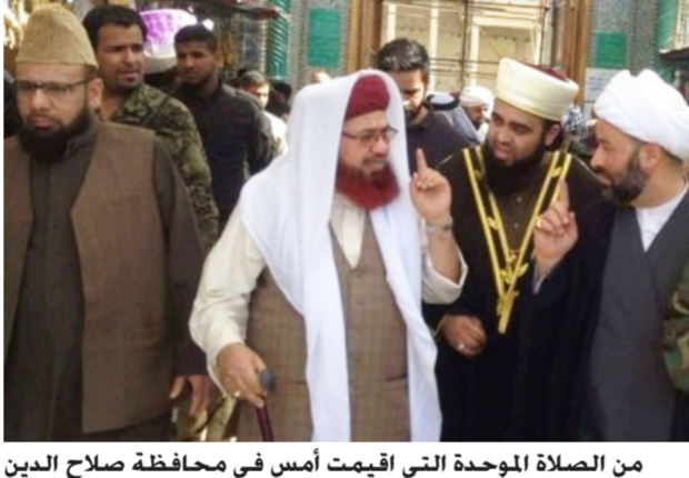
من الصلاة الموحدة التي أقيمت أمس في محافظة صلاح الدين

بغداد - الصباح الجديد: حضرت وزارة الخارجية الأميركية، جميع الدول الأوروبية من انها معرضة لهجمات المنظمات الإرهابية العالمية، مؤكدة أن هذه الهجمات "قريبة"، فيما حثت الأميركيين على التحلي بـ"أكبر درجات اليقظة". وقالت الخارجية في مذكرة جديدة حول "التحذير العالمي" من الإرهاب، إن "المعلومات الحالية تدعو إلى الاعتقاد بأن داعش وبوكو حرام ومجموعات إرهابية أخرى تواصل التخطيط لاعتمادات إرهابية في العديد من المناطق". مبينة أن "جميع الدول الأوروبية معرضة لهجمات المنظمات الإرهابية العالمية".