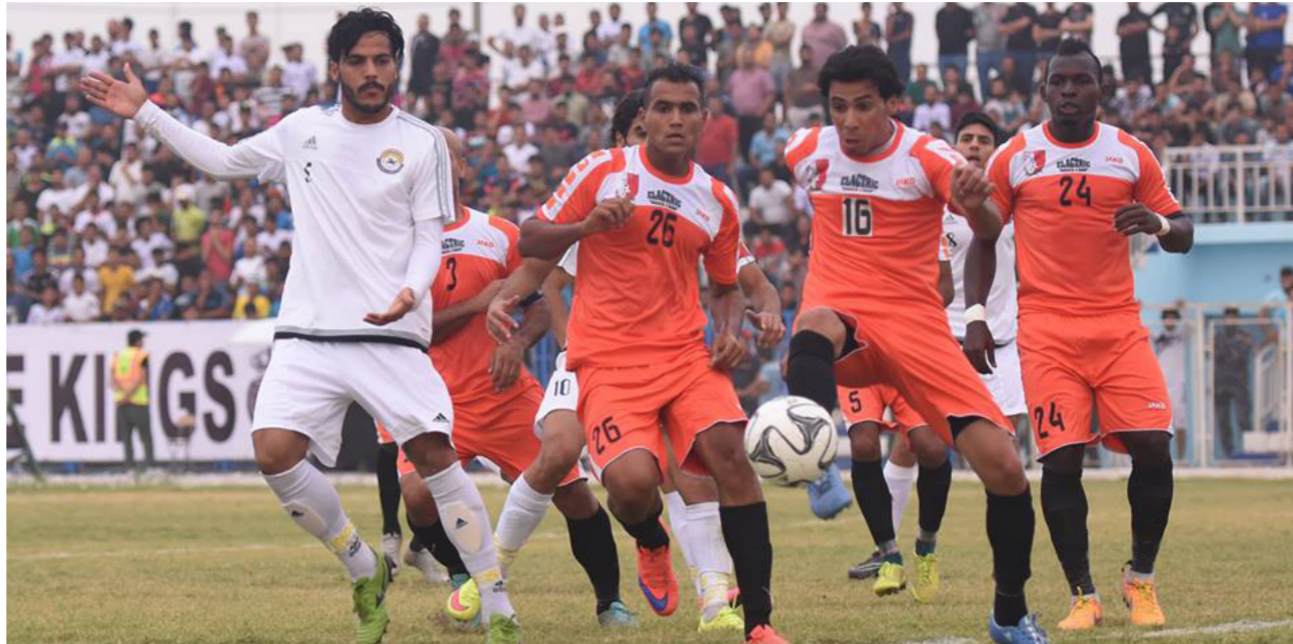
جانب من منافسات الدوري الممتاز