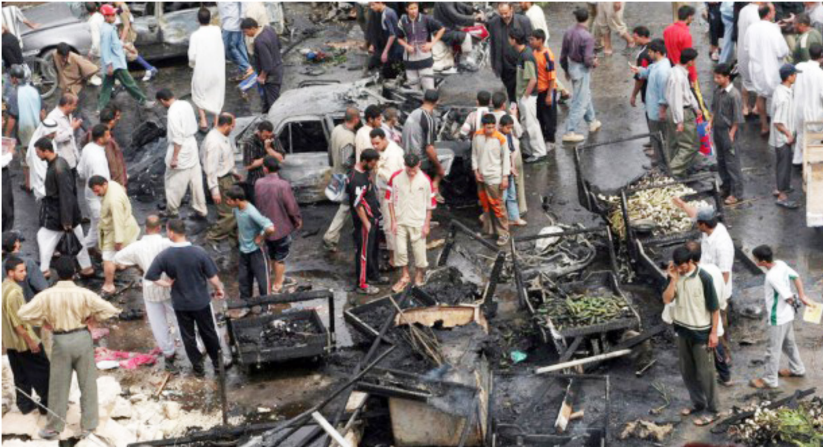
أحد التفجيرات في العراق بعد عام 2003

ترميم بيت الحيوان العراقي كيف يمكننا الخروج من هذا الطوفان اللاعقلاني الخبير للالتباس (العنف والوحشية والقتل والتمثيل بالجثث؟) وماهي الوسائل لإعادة تكوين انسانية الانسان العراقي؟ وكيف تستطيع إعادة بناء وتشكيل هذه الكتل الخيالية المفترضة كما نتج عن الخرافات عبر التقليد السياسي ونظام صارم من قواعد وآليات التكفير والمقدس والقدس والظرد ومقولات وبنائات فكرية واشكالهايات، ما جعل الاصولية العراقية تشكل احد ادوات الاستيهاام في بناء الهوية داخل التكوينات المجتمعية لتأسيس سلطة سياسية وحديدات الذات واحتكار المجال التبولووجي والانظمة