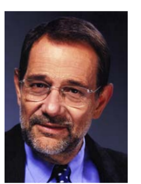
خافيير سولانا الممثل السامي للاتحاد الأوروبي للسياسة الخارجية و الأمن

بعد خمس سنوات من بداية ما يسمى بالربيع العربي . تبدد الأمل الذي ميز تلك الثورات في البداية إلى حد كبير . في كثير من الحالات . تطورت الثورات إلى نزاعات داخلية وحشية وطويلة . مع عدم وجود حل في الأفق . وسقط كل هذا الصراع . لم يول المجتمع الدولي اهتماما يذكر لدول مثل الجزائر . حيث تم خلق الروح الثورية في مهدها . لكن سيعود مصير الجزائر مرة أخرى على رادار العالم - وقريبا جدا . في يوم 7 فبراير . وافق البرلمان الجزائري على مجموعة جديدة من الإصلاحات الدستورية . من بينها عدم السماح بتولي منصب الرئاسة لأكثر من فترتين والاعتراف ببعض الحريات الأساسية . (الرئيس عبد العزيز بوتفليقة هو آخر زعيم على قيد الحياة منذ فترة حرب الجزائر ضد فرنسا من أجل الاستقلال . ويوجد في السلطة منذ 1999) . وتهدف هذه الخطوات التي بدأت منذ عام 2011 إلى تعزيز المسار الديمقراطي في الجزائر . لكنها تعرضت لانتقادات