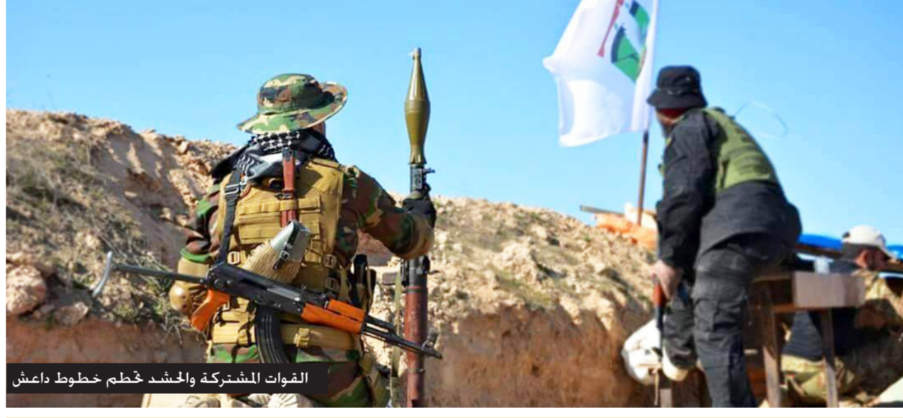
القوات المشتركة والحشد يحطم خطوط داعش

"الصباح الجديد" تكشف تفاصيل عملية "أمن الجزيرة" تقدم سريع للقوات المشتركة والحشد الشعبي يحطم الخطوط الدفاعية لـ "داعش"