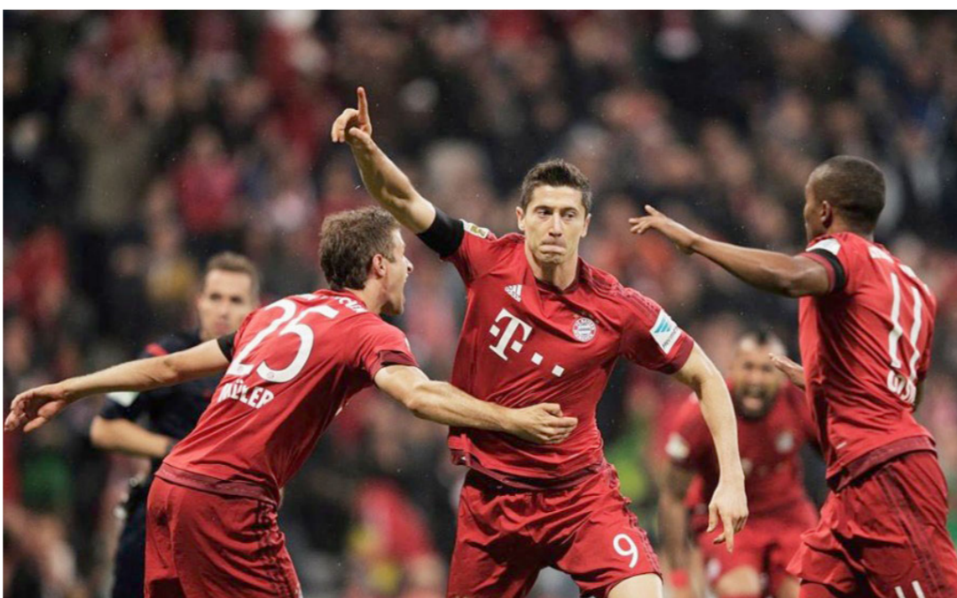
ليفاندوفسكي في مباراة سابقة

هدفاً بعد 23 جولة منذ «اليومر» جيرد مولر موسم 74 - 75. لكن البولندي رغم ذلك رفض مقارنته بأسطورة النادي البافاري. قائلاً أن «مولر لاعب عظيم واسم كبير جدا». للمباراة السادسة على التوالي. يستمر ماينز بعدم الخسارة على أرضية ملعبه «كوفاس أرينا». ما يقربه أكثر فأكثر من مقاعد دوري الأبطال حيث بات يتبعد بفارق الأهداف فقط عن مونشنجلادباخ صاحب المركز الرابع. ومن غير الواضح حتى الآن متى سيتوقف عداد الأهداف بالنسبة للبيروفي كلاوديو بيتزارو الذي وصل إلى هدفه الثالث والثمانين بعد المئة. بعد تسجيله هدف التعادل أمام دارمشتات. ما يعني أنه بات يحتل المرتبة الرابعة على لائحة الهدافين التاريخيين للبوندسليجا. إضافة إلى مواصلة تعزيز رقمه القياسي كأفضل هداف أجنبي في تاريخ