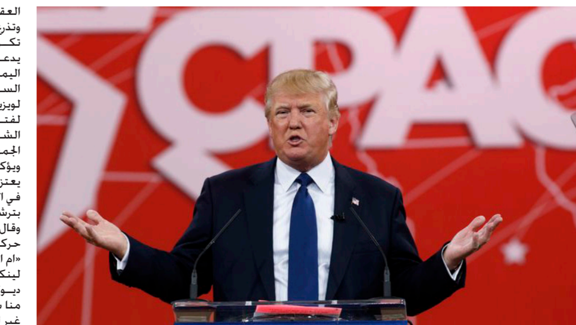
المرشح الجمهوري دونالد ترامب

العقارات. وتذرع لاحقا بسماحة قال انها لم تكن تعمل جيدا لينكر ان يكون يدعم ديفيد ديوك احد وجوه اليمين المتطرف الأميركي والقيادي السابق في المنظمة العنصرية في لويزيانا. غير ان الالتباس الذي ايقاه لفترة قصيرة حول موقفه من هذا الشخص أثار موجة استنكار بين الجمهوريين. ويؤكد بعض المحافظين علنا انهم لا يعتبرمون التصويت لدونالد ترامب في الانتخابات الرئاسية في حال فاز بترشيح الحزب. وقال السناتور الشاب بن ساس من حركة حزب الشاي متحدئا لشبكة (ام اس ان بي سي) «انه حزب ابراهام لينكولن. وإذا أصبح حزب ديفيد ديوك ودونالد برامب. فان العديدين غير سيخرجون منه.» غير ان الملياردير الذي يقول انه انفق من امواله الخاصة 25 مليون دولار حتى الان على حملته الانتخابية.