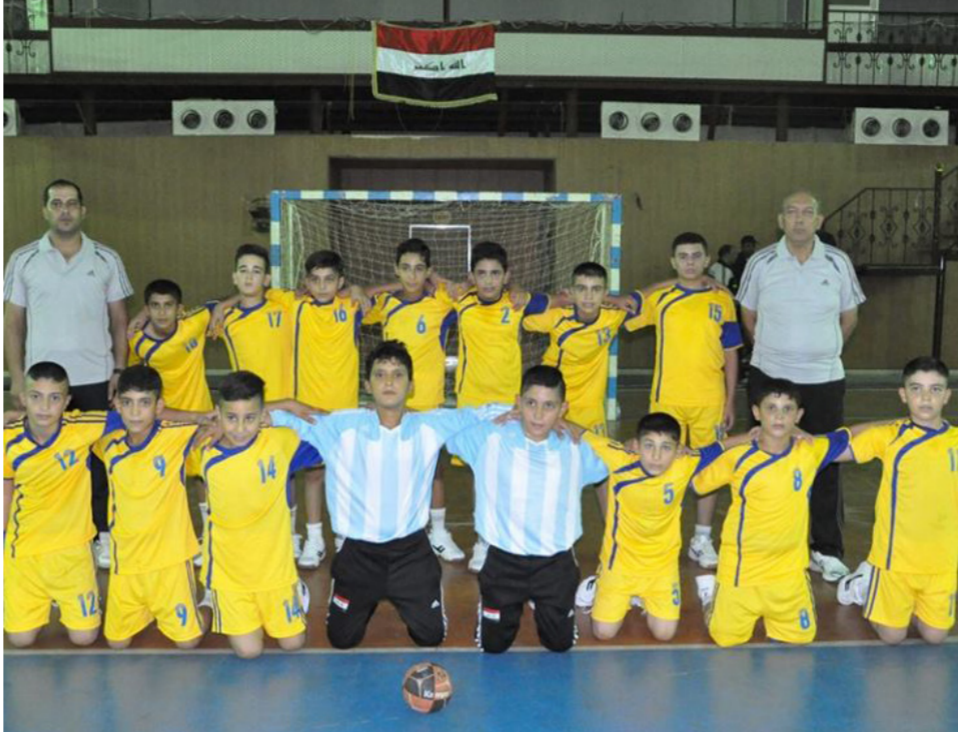
مواهب كرة اليد

وقال محمود: نال اللاعبون فرصة كبيرة في تقديم الاداء الفني الافضل بعد الفرصة التي منحها لهم المدربون العاملون في تدريب الأندية الأربعة. حيث حازوا على الاعجاب وكانوا جديرين بالمشاركة في الدوري وظهروا بمقدرة فنية عالية بفضل التدريب والالتزام بالوحدات التدريبية التي انتظموا فيها في المركز الوطني. الى جانب مشاركتهم في اكثر من بطولة