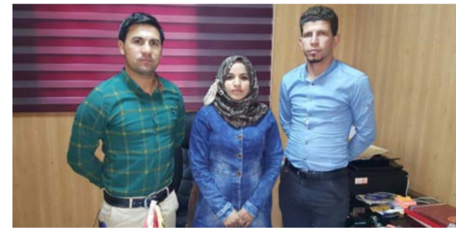
اعضاء الوحدة الحسابية