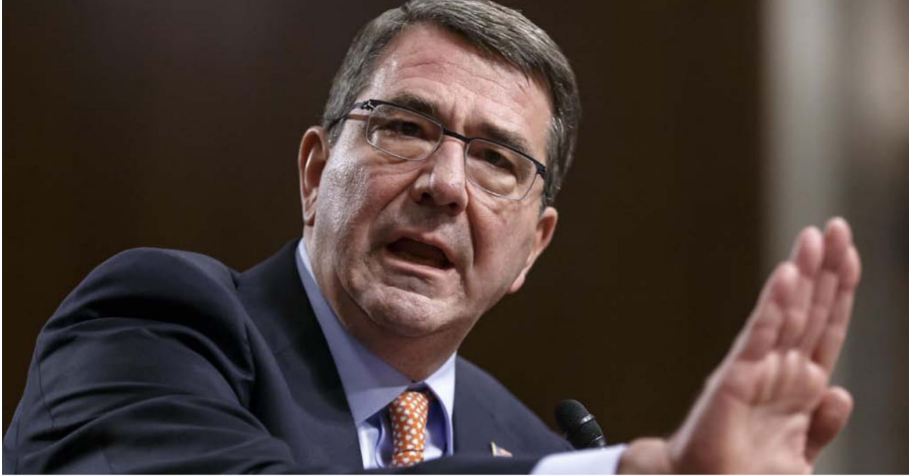
وزير الدفاع الأميركي أشنتون كارتر

وجودها في ليبيا وسيسيطر مقاتلون موالون للدولة الإسلامية على مدينة سرت الساحلية. ويقول مسؤولون غربيون إنهم يبحثون عن ضوابط جوية وعمليات للقوات الخاصة في ليبيا ضد التنظيم الذي يسعى لإقامة دولة خلافة إسلامية وسيسيطر بالفعل على أجزاء كبيرة من سوريا والعراق. وأوضح فالون أن بريطانيا لا تعترم حاليا نشر قوات برية في ليبيا للقيام بدور قتالي. وقال «قبل القيام بأي عمل عسكري في ليبيا سنسعى للحصول على دعوة من الحكومة الليبية الجديدة».