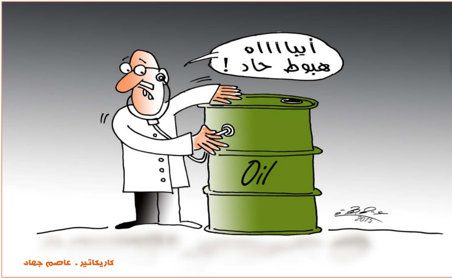
كاريكاتير - عاصم جهاد

أوردت مجلة "سنينون رانغيبز" الألمانية أنه يمكن مواجهة متاعب السيقان وتورم الكاحل من خلال ممارسة الأنشطة الحركية وليس الركون إلى الراحة. بخلاف الاعتقاد الشائع. وأوضحت المجلة المعنية بصحة كبار السن أنه يمكن تخفيف هذه المتاعب الناجمة عن ضعف الأوعية الدموية من خلال ممارسة رياضة ركوب الدراجات الهوائية لمدة نصف ساعة يومياً أو ممارسة تمارين تقوية الأوعية. مثل الوقوف على أطراف الأصابع أو تثبيت كرة بواسطة الكاحلين أو محاكاة قيادة الدراجة الهوائية أثناء الاستلقاء.