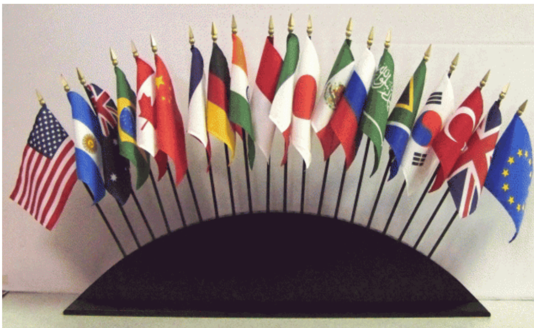
دول مجموعة العشرين ينظرون الى ما هو أبعد من أسعار الفائدة المتدنية

وأشار إلى أن «حكومة الإقليم لها قناعة تامة بأن جميع المشاكل يجب أن تحل عبر الحوار خصوصاً أن المركز والأقليم يواجهون أزمة مالية»، مؤكداً «ضرورة تأمين حصة إقليم كردستان من القروض التي منحها المجتمع الدولي للعراق». من جهته، أشاد سيموني بمستوى العلاقات الجيدة والتنسيق والتعاون بين الأخاد الأوروبي وإقليم كردستان». مشيراً إلى أنه يأخذ «أوضاع كردستان الذي تواجه تهديداً بسبب الأزمة الاقتصادية بنظر الاعتبار»، وفقاً لبيان.