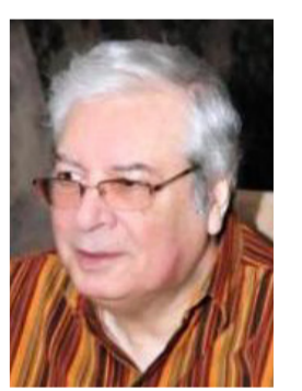
فيصل الياسري اعلامي ومخرج عراقي

مع بدايات البث التلفزيوني في المنطقة العربية قبل سنتين سنة (الانطلاقة من بغداد ) لم يهتم المؤلفون العرب بان يكتبوا نصوصا درامية (تغليلية) للتلفزيون تهتم بالصورة والبناء المرئي للحكاية ولم تكن للكتابة الدرامية للتلفزيون قواعد واصول يجب مراعاتها . وانما اكتفى المؤلفون بنقل اساليب الكتابة للاداعة او المسرح . بعد قطيعها الى مواقف تدور في ديكورات محصورة داخل استوديوهات التلفزيون . لقد حتمت طبيعة الكاميرا التلفزيونية الضخمة التقيد بوحدتي المكان والزمان فقد كانت الكاميرا محدودة الحركة داخل الاستوديو . مريوطة باسلاك وكبيلات متصلة بمازج الصورة في حجرة المراقبة . وباجهزة التسجيل في حجرة الفيديو . من خلال مداخل