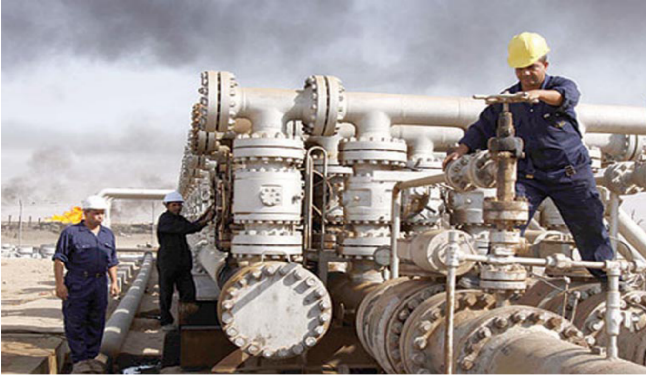
الصادرات تعود للحقول النفطية الوسطى والجنوبية

معظم صادرات البلد تنطلق منها". وواصل الموقع، أن «الأضرار تتركز الآن على حقول مجنون في البصرة، الذي يعتبر من أغنى حقول النفط مختلفاً من النفط والغاز، وزاد أنه يقدر بحدود 38 مليار برميل. فضلاً عن احتواء الحقل على 13 مستودعاً مصدري النفط الكبار، السعودية وروسيا وفنزويلا وقطر بنجميد إنتاجهم لسفوف كانون الثاني 2016، لدعم أسعار النفط في السوق العالمية، ليس من المتوقع أن يرى النور حيث يتطلب موافقة دول أخرى لاسيما إيران التي لم تكن متلهفة عليه، وكذلك العراق الذي أبدى ترددا للمشاركة فيه».