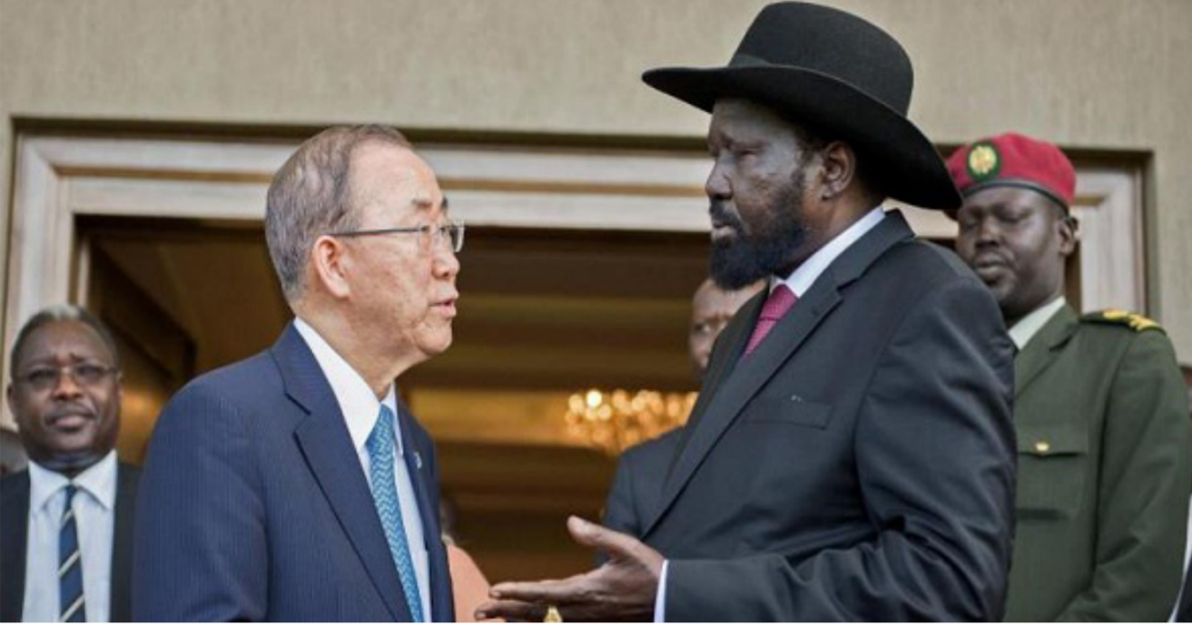
بان كي مون مع سيلفاكير

قال إن التهديد «يجب أن يوجه إلى الذي يضعون العراقيل أمام عملية التنفيذ. فالتشكك ليس مستبعد لتشكيل حكومة انتقالية «الليلة» إذا ما قدمت حركة مشار أسماء مرشحها للمنصب الوزارية. أما الناطق باسم المتمردين جيمس فديت داك فاكد أنهم مستعدون «للوفاء بتعهداتهم». وأن تصريحات كيير بقصد لانها مارسست ضغوطا على الطرفين منهما جوبا بانتهاك اتفاق السلام.