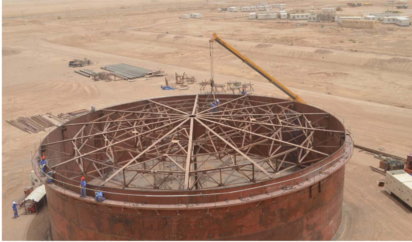
مستودع العمارة النفطية

أن المصفاة هي علامة فارقة في اقتصاد العراق من خلال توفير المشتقات عالية الجودة. مؤكداً أن المشروع سيجذب رؤوس الأموال للمحافظة وسيقلص استيراد المشتقات من الخارج. وكشفت شركة مصفاة ميسان الدولية عن أن المشروع واجه صعوبات «متعمدة» قبل أن يصل إلى مرحلة التنفيذ. فيما أشارت إلى أن المشروع سيلبي ثلاثة متطلبات رئيسة للاقتصاد العراقي.