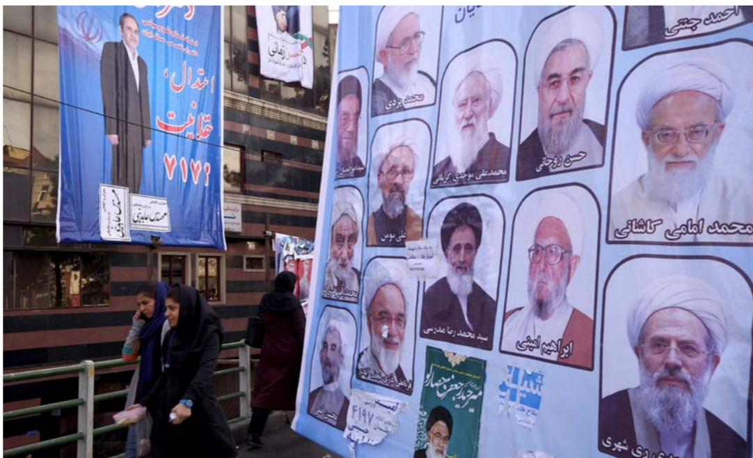
حملات انتخابية في إيران

ويخوض المرشحون السباق على جمع مقاعد البرلمان وعددها 290 مقعداً ومقاعد مجلس الخبراء وعددها 88 مقعداً وهو الهيئة التي تختار الزعيم