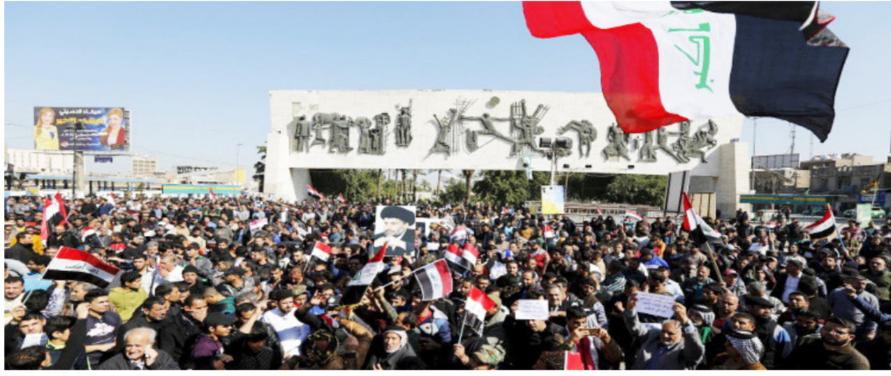
جانب من تظاهرة ساحة التحرير

بغداد - الصباح الجديد: أكد زعيم التيار الصدري السيد مقتدى الصدر أمس الجمعة، أن الحكومة العراقية "تركزت شعبها" يصارع الموت والخوف والجوع، وشدد على أن أي مسؤول بالحكومة لا يسمع صوت المتظاهرين لا بد أن "ينتهي". مهتديا بدخول المنطقة الخضراء المحصنة في بغداد لاستعادة حقوق المظلومين من الفاسدين في حين حذر من صرخة المظلوم كونها "ستنتصر". وقال الصدر في كلمة ألقاها في ساحة التحرير وسط المتظاهرين، وتابعها "الصباح الجديد"، "أنا بينكم وأعلن بكل صراحة وشجاعة أن الحكومة قد تركت شعبها يصارع الموت والخوف والجوع والاحتلال حتى أوصلته إلى أزمتها