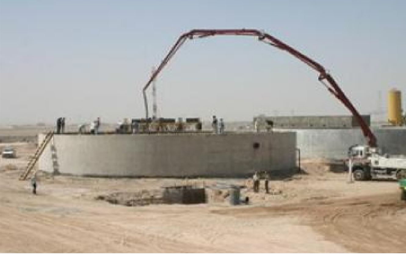
توفير حماية وقائية استباقية للخطوط والمكائن الإنتاجية

مستوى سطح الارض ليكون ارتفاع الخزان الكلي 9 امتار ويعد 338 ركيزة . وذكر ان الشركة العامة للتصميم وتنفيذ المشاريع وبالتعاون مع شركة الفارس العامة قامت بأشياء اكبر محطة لتصفية المياه في المدينة الرياضية في البصرة وكذلك مد أنبوب المياه الناقل من مأخذ ماء العيباس الى المدينة الرياضية عبوراً لشط البصرة بواسطة الحفر النفقي الذي يستعمل لأول مرة في العراق.