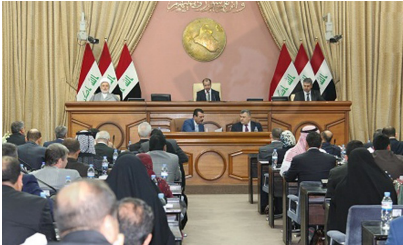
إحدى جلسات مجلس النواب العراقي

ومصادرة أموال اركان النظام السابق. وكان مجلس الوزراء قرر جلسته التي عقدت في العاشر من شباط الماضي. ابلغ مجلس النواب باعتماده، مشروع قانون معالجة حجز ومصادرة اموال اركان النظام السابق. على وفق القرارين 76 و88 الصادرين من مجلس الحكم الذي اقتره الحكومة السابقة وارسل الى مجلس النواب.