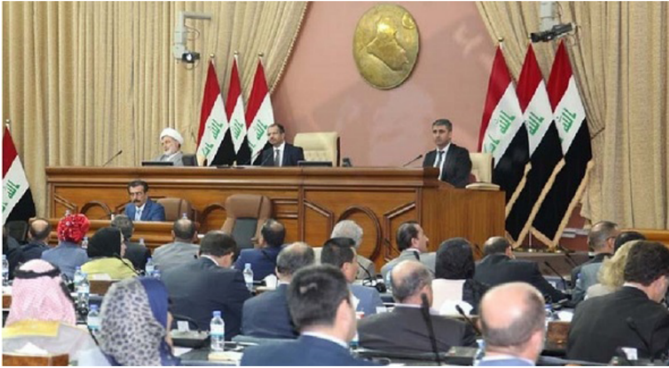
جلسة سابقة لمجلس النواب

العربية ومجلس الأمن كذلك حساب أموال العراقيين منهم بالخارج بعد 2003 وقبلها. وكانت كتلة حزب الدعوة تنظيم الداخل النيابية أبدت. الثلاثاء 9 شباط 2016، اعترضها على تشكيل لجان عراقية لاسترداد الأموال المهربة للخارج. عازية ذلك لارتباط بعض أعضاء اللجان بجهات سياسية متورطة بالتهريب. وأعلن رئيس مجلس النواب سليم