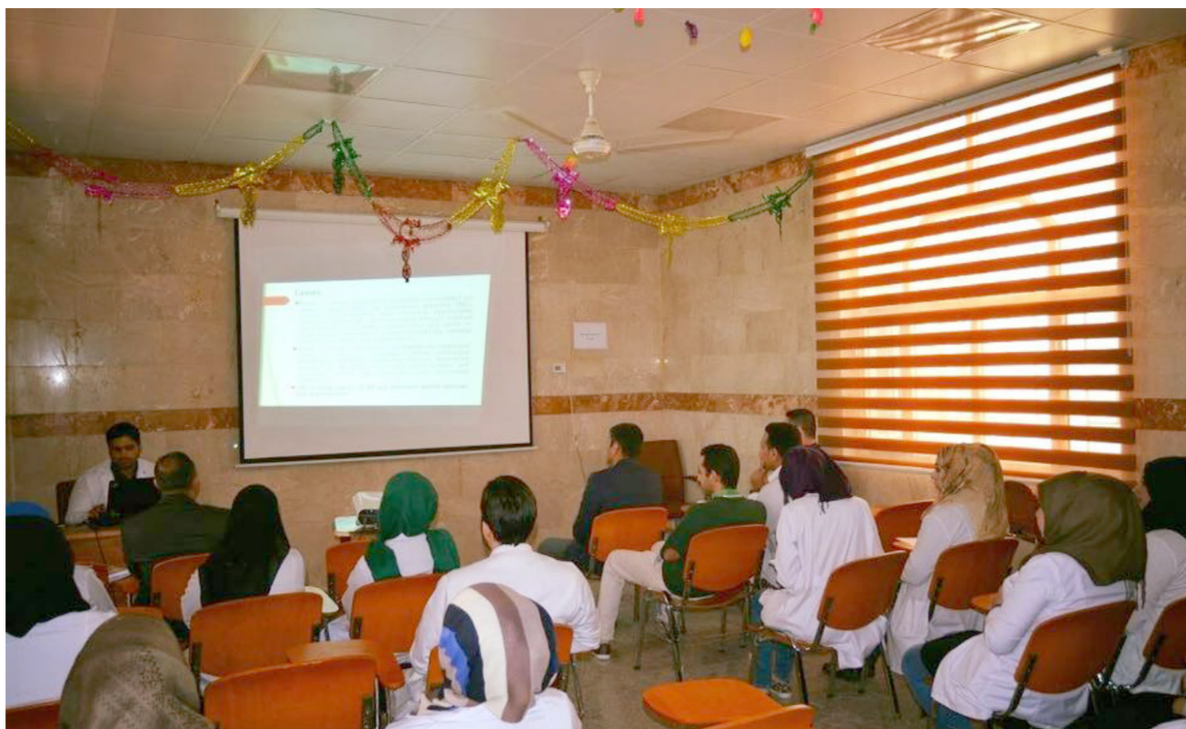
جانب من ندوة مناقشة أحدث أدوية علاج الصدمة القلبية وعجز القلب في البصرة