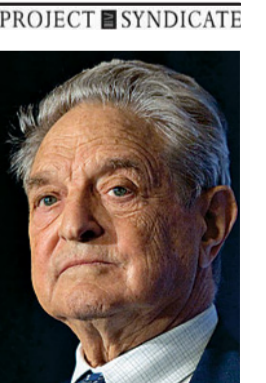
جورج سوروس رئيس مؤسسة المتجمع المفتوح

في مؤتمر الماتحين للاجئين السوريين الذي انعقد في لندن في الرابع من فبراير/شباط. حقق تقدم كبير. ولكن يظل هناك احتياج إلى القيام بقدر أكبر كثيراً من العمل. فما يزال تقدير المجتمع الدولي للمطلوب لدعم اللاجئين أقل كثيراً ما ينبغي. سواء داخل حدود الاتحاد الأوروبي أو خارجه. والواقع أن التعامل مع أزمة اللاجئين مع توظيف قدرة الإقراض الممتازة التي يتمتع بها الاتحاد الأوروبي. والتي هي غير مستغلة إلى حد كبير. في إستعمالات أفضل. يتطلب خذلاً جوهرياً.