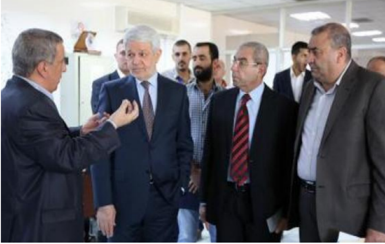
الزبيدي في مطار بغداد الدولي

عن المراحل التي وصل إليها نظام الحكومة الالكترونية في الوزارة والتي حصلت على المرتبة الأولى من بين الوزارات العراقية وبشهادة الأمانة العامة لمجلس الوزراء وعممت التجربة على الوزارات كافة . ووجه الوزير بضرورة التعاون مع الشركتين في الاتصالات والصناعة من أجل الخروج بنتائج تساهم في تطوير أداء سلطة الطيران المدني ومطار بغداد الدولي .