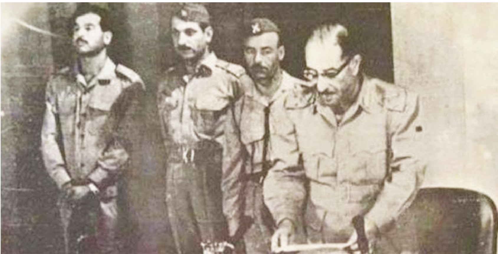
البكر يلقي خطاب انقلاب 1968

فلماذا تمتنع عن مقابلة صدام حسين. وكررت امتناعي عن ذلك في العراق. مع وجود معلومات لدى القيادة السوفيتية بما يشي بإمكانية إزاحة صدام حسين عن مكانه في فرصة قريبة. وكان مثل ليصبح صدام بعد فترة الرأس الأول في سلطة الدولة العراقية. ونحن طلب مني الرئيس البكر مقابلة عضو اللجنة المركزية للحزب الشيوعي العراقي في بهو الفندق والذي جاء إلى الفندق في الساعات