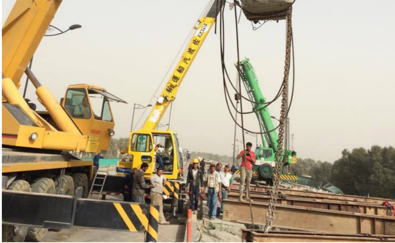
مشروع إعادة تأهيل جسر المثنى

يعد جسر المثنى من الجسور المهمة والرئيسية في بغداد إذ يربط جهتي الكرخ والرافضة وكذلك المحافظات الجنوبية بالمحافظات الشمالية