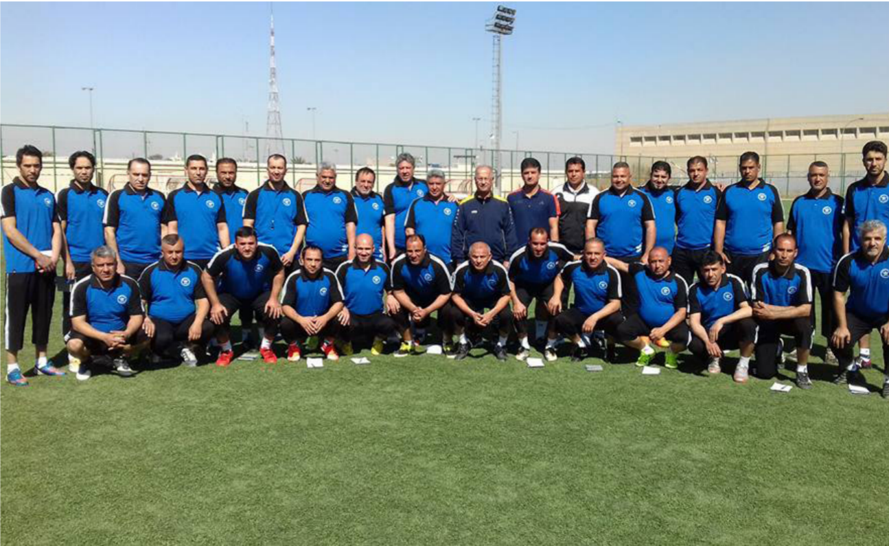
المشاركون في الدورة التدريبية فئة C

الاولى للحد من ظاهرة الاعتداءات على اللاعبين . مستغنياً بنامي ظاهرة الشعب في الملاعب حتى باتت ملاعبنا للأسف الشديد عرضة لانتهاك الروح الرياضية بشكل سافر من قبل أشخاص لانهمهم سمعة الوطن ولايراضته.