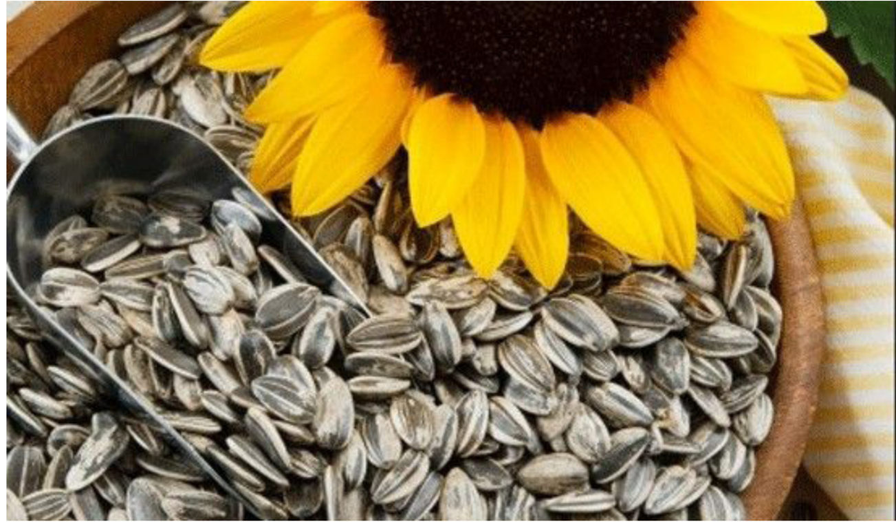
بذور زهرة دوار الشمس

لتنبيض البشرة من دون إحداث تلف. كما يعمل الفيتامين E على حماية البشرة في أثناء التعرض للأشعة فوق البنفسجية. وقد أكدت العديد من الدراسات أن استعمال الفيتامين E على الجلد يساعد على منع تلف الجلد نتيجة التعرض للأشعة فوق البنفسجية.