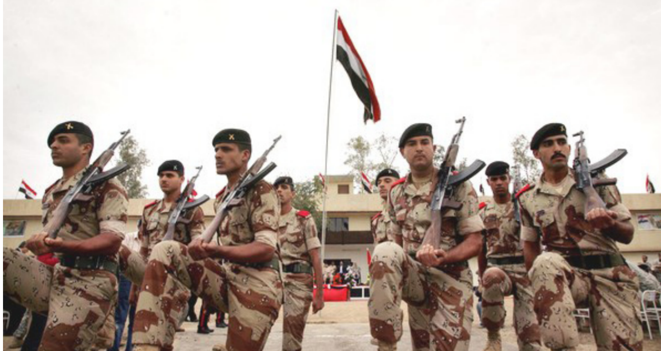
تدريبات الجيش العراقي

العراقي أي التجنيد والخدمة الالزامية مع فتح مراكز تدريب لتأهيل الشمولين من الشباب. ويأتي اعلان وزارة الدفاع لإمكانية اعادة الخدمة الالزامية نتيجة استمرار الخلاف السياسي على مشروع قانون الحرس الوطني حيث شكلت الرئاسات الثلاث في الشهر الماضي لجنة لتصير القوانين المهمة المختلف عليها بينها الحرس الوطني. وأكدت لجنة الامن والدفاع النيابية في وقت سابق. أن مشروع قانون الخدمة الالزامية سيكون بديلاً عن قانون الحرس الوطني. فيما اشارت سيدة شمول الفئات العمرية بالفقانون.