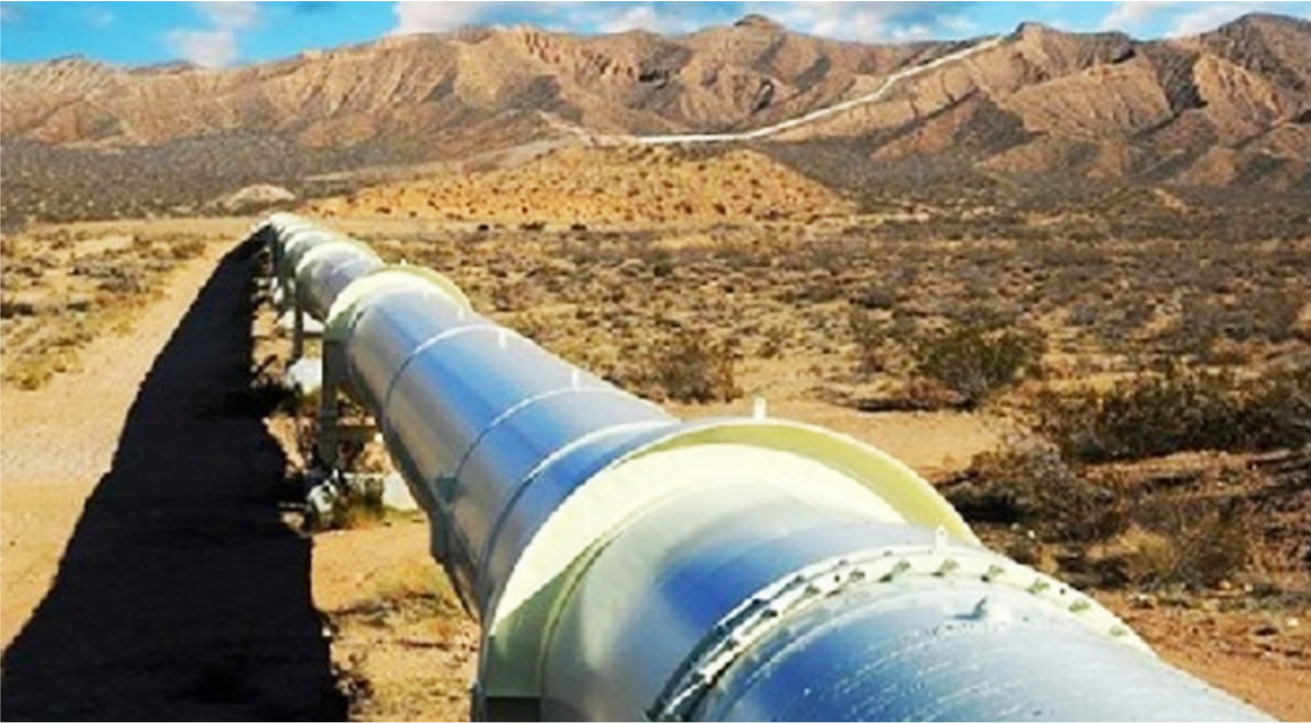
خط نقل الغاز الطبيعي بين الإقليم وتركيا