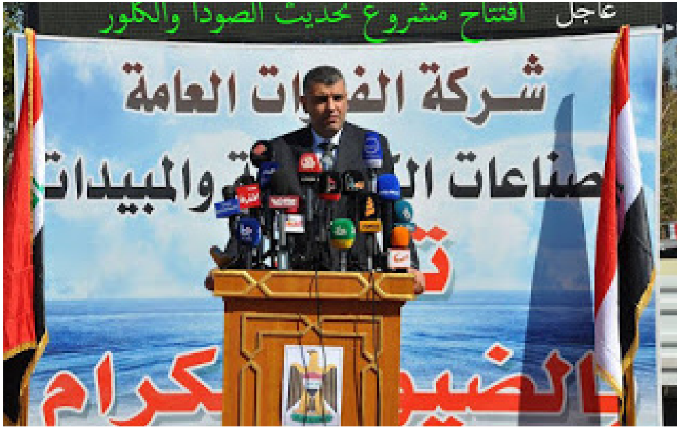
جانب من الافتتاح

حاجة امانة بغداد ووزارة الاعمار والاسكان والبلديات ومتطلبات مصافي النفط ومحطات الطاقة الكهربائية . وطالب المدير العام الحكومة واصحاب القرار بضرورة تقديم الدعم الكافي للمنتجات الوطنية وتشجيع الصناعة العراقية لتأخذ دورها في تعزيز اقتصاد البلد في ظل الأزمة المالية التي يمر بها . مؤكدا على ان الشركة على الاستعداد لتلبية حاجة القطاعين العام والخاص من هذه المنتجات بغية النهوض بواقع الصناعة العراقية والاستغناء عن المستورد والحفاظ على العملة الصعبة .