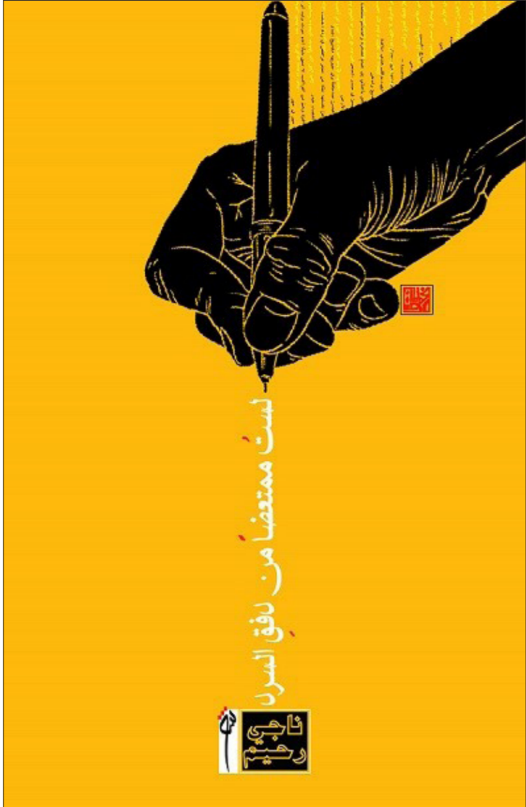
غلاف المجموعة الشعرية

في نصوصه أيضاً ينطلق الشاعر من نقطتين متداخلتين: نقطة الاحتيال على الذات للوصول للمعنى ونقطة الاحتيال على المعنى لبلوغ الذات.. لنقرأ ما يقوله في هذه العبارات: (لا أكف عن نبش هذي العين/عين العالم القدرة) (أنت صفة العالم فيك/أنت العالم أيضاً) ولا شك حين ينتهي القارئ من قراءة هذه المجموعة الشعرية سيكتشف قدرة كاتبها على بعضرة المعاني والعبث بالدلالات بوعي جمالي فني عال حتى إذا تيقنت القراءة من نفسها من بلوغ حيرتها مبلغ الشك في كل الأشياء المتصلة بالنصوص ولغتها وأسلوبها.