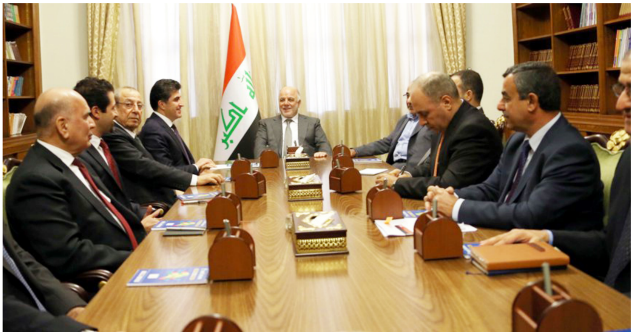
جانب من اجتماع سابق بين حكومة الإقليم والحكومة الاتحادية

إلى العناوين العريضة المتعلقة بالازمة الاقتصادية ومواجهة تنظيم داعش الإرهابي". وتابع دة زيي أن "الإقليم سيعم بمأكينة العودة الى هذا الاتفاق من خلال وسائل الاعلام في تصريح لرئيس الوزراء حيدر العبادي، ولم نلمس أي شيء جدي". وأشار إلى "قدرة إقليم كردستان على تسليم 550 ألف برميل إلى بغداد مقابل حصولنا على حصتنا من الموازنة البالغة 17%". وكشف دة زيي أنه "بموجب التقارير الرسمية فان بغداد سلمتنا خلال السنتين الماضيتين نحو 3 مليارات دولار فقط، فيما تبقى بذمتها أكثر من 20 مليار دولار". وألح المتحدث باسم حكومة الإقليم إلى إمكانية فتح صفحة جديدة من العلاقات بالدعوة إلى "عقد اجتماعات دورية يمكن من خلالها تسوية الموضوع والعودة إلى الاتفاق".