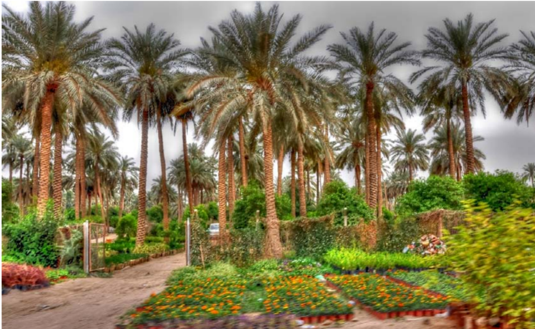
أحد بساتين النخيل في العراق