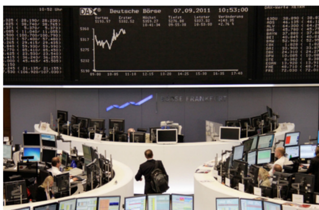
سوق الأسهم الروسية

صادقة دعونا إليها مع صندوق النقد الدولي». وفي كانون الأول، أعلنت موسكو نيتها ملاحقة أوكرانيا قضائياً في قضية هذا القرض البالغ ثلاثة بلايين دولار، والذي منحه للنظام الأوكراني السابق الموالي لها في 2013، قبل بضعة أسابيع من إطاحة الرئيس السابق فيكتور يانوكوفيتش. وأعلنت أوكرانيا في 18 كانون الأول، رفضها تسديد هذا القرض الذي لا تعدّه ديناً سيادياً (من دولة إلى أخرى)، بل ديناً تجارياً تم عبر عملية في الأسواق المالية، كذلك، تطالب في الأسواق المالية، 20 في المئة من هذا الدين على غرار ما قام به دائنو القطاع الخاص، لكن روسيا ترفض ذلك مقترحة تمديد فترة التسديد ثلاثة أعوام.