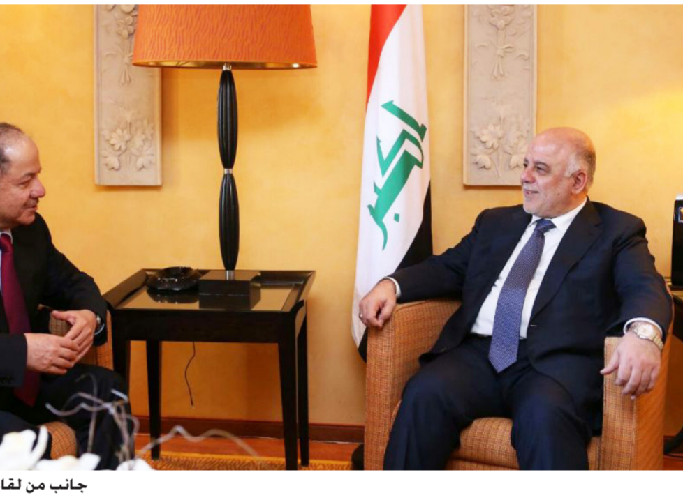
جانب من لقاء العبادي مع بارزاني في ميونخ

الأقليم بتسليم نفطها كاملاً للحكومة الاتحادية. بلاغ حكومة الإقليم انتقد وبشدة تصريحات رئيس الوزراء حيدر العبادي، معرباً عن استياء حكومة الإقليم من طرح المشكلات والخلافات في لقاء تلفزيوني. كان الإجدد طرحه في اللقاءات الثنائية، أو خلال زيارة وفد حكومة الإقليم الأخير إلى بغداد. عاداً مقترحات رئيس وزراء حيدر العبادي لا تتعدى كونها مزايمة سياسية، معلناً قبول حكومة الإقليم وتحدي اقتراح العبادي لتأمين رواتب جميع موظفي إقليم كردستان مقابل تسليم جميع إنتاج نفط إقليم كردستان. حكومة الإقليم طالبت بالمقابل الحكومة الاتحادية بتأمين نحو (890 مليار دينار) لتأمين رواتب موظفي الأقليم البالغ عددهم (مليون وأربعمئة الف) موظف. تمّت ص 3