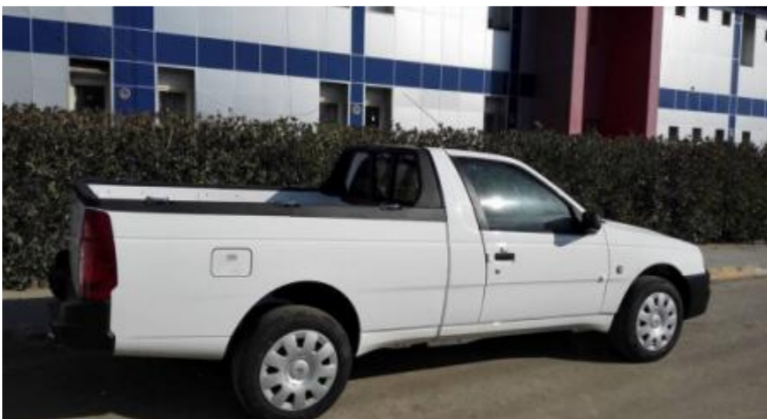
سيارات بيجو بيك اب