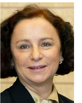
أنا بالاسيو وزيرة خارجية اسبانيا السابقة و نائبة الرئيس السابق للبيك الدولي