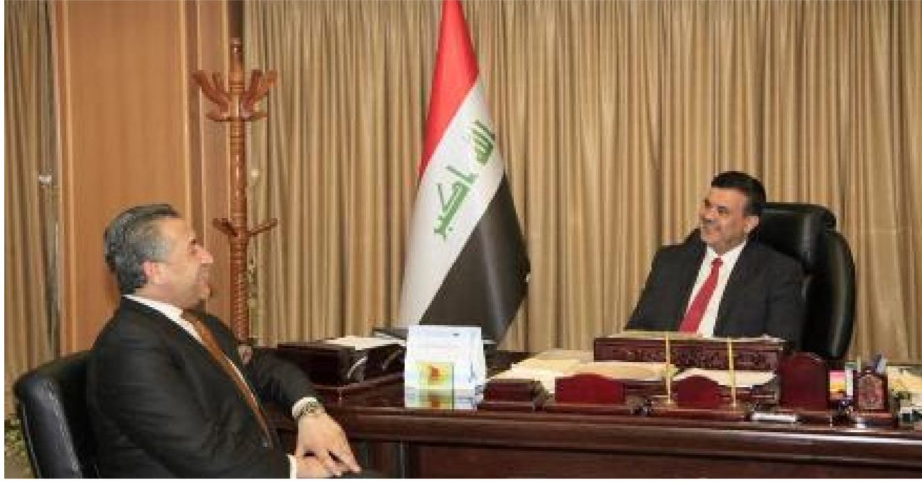
الشمري يشدد على ضرورة حماية نهري دجلة والفرات من التلوث

تحتاج وزارة الموارد المائية الى الدعم من خلال إقرار قوانين تساهم بتطوير الواقع الإروائي في البلاد