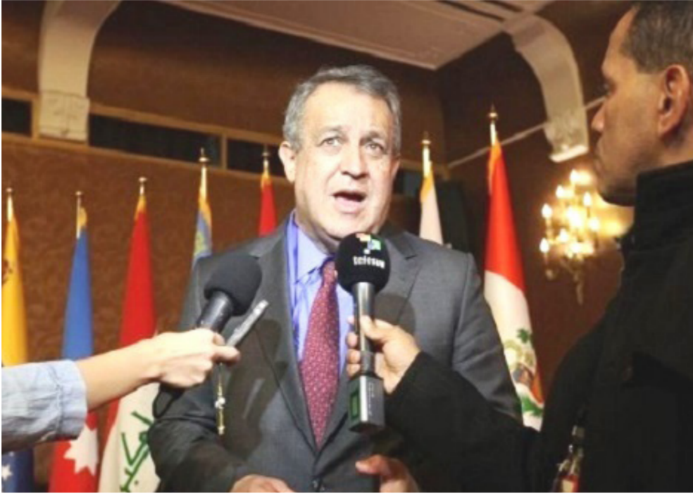
وزير النفط الفنزويلي في لقاء مع الصحفيين/الدوحة

بدورها، أعلنت وزارة الطاقة الروسية في بيان أن الاتفاق الذي توصل إليه