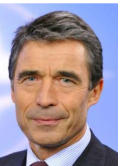
أندرس فوغ راسموسن • رئيس وزراء الدنمارك السابق و الأمين العام لحلف شمال الأطلسي.

يسلط الضوء على الاعتراف المتزايد الذي يدل على احتمال الحاجة إلى قدرات عسكرية قوية لدعم أمن أوروبا وسيادته. في الوقت نفسه. قد تم انخفاض إنتاج النفط المحلي لأكثر من 50% خلال العقد الماضي. إذا لم يتم القيام بتغيير مساره. ويزيد من إنتاجه للطاقة البديلة. بما في ذلك الوقود الحيوي. وهو خيار أهمله نحو 95% من احتياجاته للنفط سناتني من مصادر أجنبية بحلول عام 2030. وفقاً لوكالة الطاقة الدولية. وهذه نقطة ضعف الاتحاد الأوروبي في الحالة الراهنة. لأن ذلك يعني الاعتماد على واردات من أنظمة استبدادية غير مستقرة. ففي عام 2014. أنفقت الدول الأعضاء للإتحاد الأوروبي مبلغاً مدهلاً أي ما يعادل 271 بليون يورو على النفط الخام الأجنبي - أكثر من مجموع الناجح المحلي الإجمالي لبلغاريا والمجر وسلوفاكيا وسلوفينيا. وتم إرسال ما يقرب من نصف هذه الأموال إلى روسيا والشرق الأوسط وشمال أفريقيا. وبذلك. فالإتحاد الأوروبي يتعرض لانقطاع الإمدادات الحكومية ويسهم أيضاً في دعم الحكومات الاستبدادية وتقوية الأنظمة المعادية. بما يحد من قدرة الإتحاد على توفير رد فعال واستجابات منسقة للتهديدات والاستفزازات. وخير مثال على ذلك نضال الإتحاد الأوروبي لوضع استراتيجيات سياسية واقتصادية متماسكة لمواجهة التحديات التي يفرضها العدوان الروسي في أوكرانيا والحجيم في الشرق الأوسط. قرار المملكة المتحدة مؤخراً بشأن زيادة الإنفاق على الدفاع