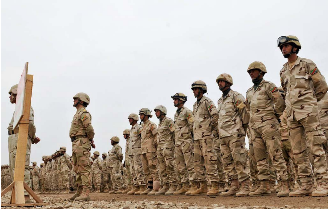
اجتماع نيابي بضرورة اقرار قانون الخدمة الإلزامية

مجلس النواب بأن يحل مشروع الخدمة الإلزامية بدلاً عن الحرس الوطني الذي جاء ضمن وثيقة الاتفاق السياسي التي تشكلت بموجبها حكومة حيدر العبادي. وكان نظام الخدمة الإلزامية متبعاً بالعراق قبل 2003، إلا أنه الغي بعد سقوط نظام صدام وحل الجيش بأمر الحاكم المدني بول بربر، حيث يتبع العراق حالياً نظام الخدمة التطوعية.