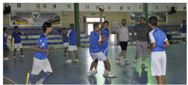
مباراة سابقة للطائرة

المرحلة الرابعة في صدارة الترتيب برصيد 53 نقطة يليه فريق الشرطة الخمسة من الدوري الممتاز «4».. وقال رئيس اللجنة الفنية سواي حسين ان الثالث من شهر آذار المقبل سيكون موعدا لاطلاق المرحلة ما قبل الاخيرة التي ستقام في مدينة البصرة اذ سيشهد اليوم الاول اقامة ثلاث مباريات. الاولى في الساعة الواحدة وغاز الجنوب في الساعة الواحدة بعد الظهر تليها مباراة القوة الجوية والشرطة في الثالثة بعد الظهر ثم يلتقي فريق البحري والبشمركة في الساعة الخامسة عصرا. واذف ان منافسات الدور الثاني من المرحلة الرابعة ستطلق في اليوم التالي. اذ يلتقي فريقا الصناعة والقوة الجوية في وقت واحد بعد الظهر ثم يواجه فريق البشمركة منافسه غاز الجنوب في الثالثة بعد الظهر