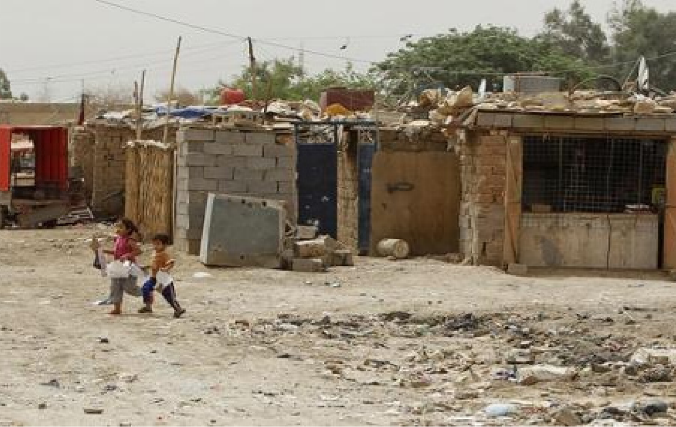
التجاوزات على اراضي الدولة

من جانب اخر اعلنت الوزارة عن تجهيز العائلات النازحة في مخيمات منطقة بزيب في محافظة الانبار بالمواد الغذائية لخصه شهر كانون الثاني الماضي. ووضح مدير عام دائرة التخطيط التابعة في الوزارة حسين فرحان كريم التجارة بأنه تنفيذاً لتوجيهات وزير التجارة المهندس محمد شياع السوداني بايصال المواد الغذائية للعائلات النازحة حيث تم اإصال عدد من الشاحنات