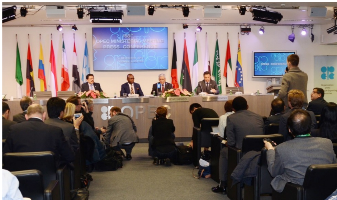
جانب من احد اجتماعات أوبك

ويرجعون أن تتعرض الأسعار بعدئذ إلى تقلبات قوية قد تجعل سعر البرميل يلامس 20 دولاراً ما يعود بالذكرة إلى عام 2002 عندما اتفق المنتجون على قطع الوتيرة الإنتاجية بصورة استثنائية. أما في الربعين الثالث والرابع من العام، فيتوقع الخبراء السويسريون أن يرسو معدل سعر «برنت» على 56 دولاراً في البرميل. وسعر الخام الأميركي الخفيف على 52 دولاراً. وتستعد الشركات السويسرية العاملة أو المستثمرة في قطاع النفط والغاز، لمواجهة أحداث الربعين الأول والثاني من العام بصورة تعكس معها مستقبلاً رادياً لصناعة النفط. حول العالم،