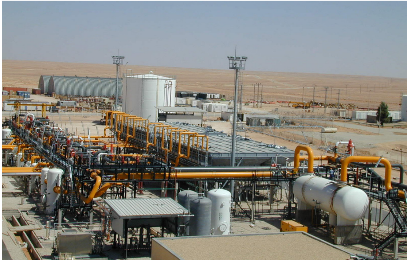
أحد الحقول النفطية

الكهربائية للبلاد. يشار إلى أن العقد الثاني لتصدير الغاز الإيراني للعراق بهدف تأمين وقود محطة الرميطة بالبصرة. وقع بحضور وزير النفط بجن زكنة في الـ 7 من شباط الجاري. مع وزارة الطاقة ويمتد لـ 6 سنوات.