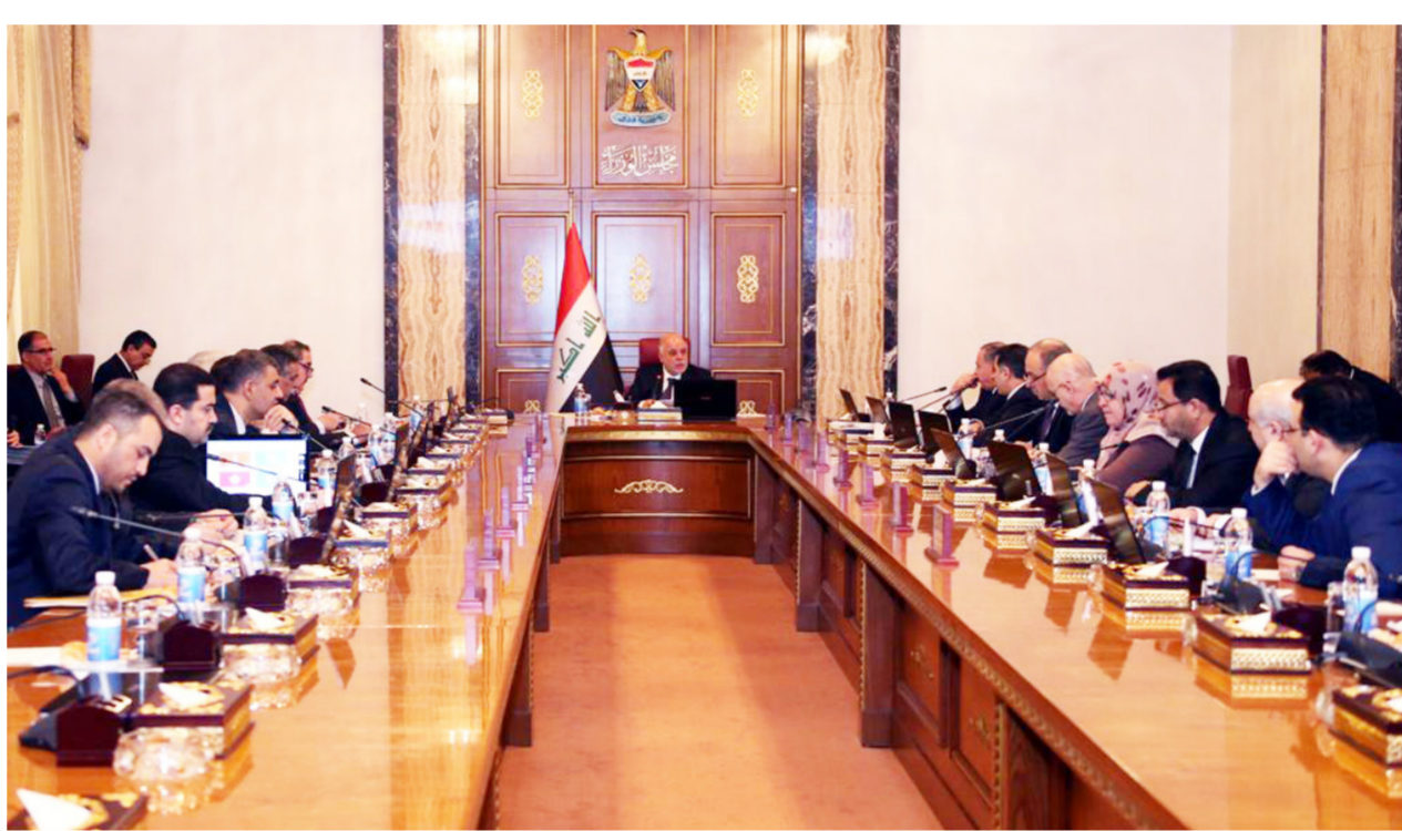
من جلسات مجلس الوزراء الاعتيادية "ارشيف"

عن حلول جذرية لازمة... مبدياً من مرشح على أن يتولى العبادي اختيار الاصلح من بينهم".