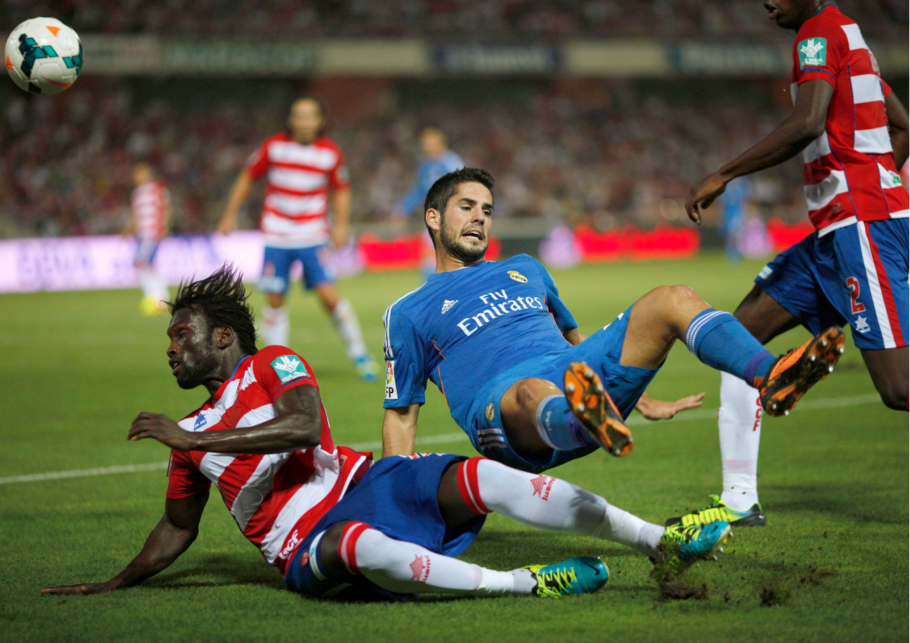
لحظة من إحدى مباريات إيبار في الدوري الإسباني

وسيقاتل ميرانديس الوحيد من بين فرق دوري الدرجة الثانية الذي يتنافس في هذا الدور، من أجل تكرار الجاز 2011-2012، حينما تأهل إلى نصف النهائي.