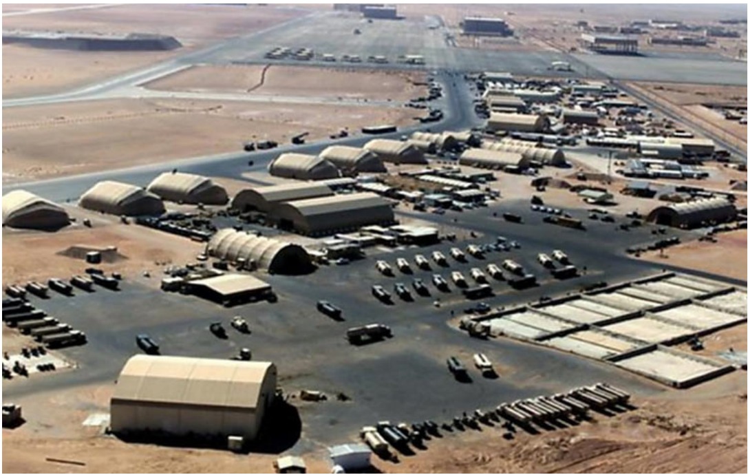
القاعدة التركية الجديدة

بالمقابل، يفترض تكثيف الوجود التركي في الخليج تعرضاً أكبر للمخاطر خصوصاً في ظل التوتر السعودي-الإيراني المتصاعد والذي تتحاز فيه تركيا إلى الرياض، على سبيل المثال، ستكون القوات المتمركزة في القاعدة الجديدة في قطر سهلة المثال لנاجية قدرات الصواريخ الكبيرة التي تتمتع بها إيران، حتى الآن، حافظت أنقرة وطهران على روابطها العسكرية وتمكنا من إدارة خلافاتها السياسية بالرغم من كونهما خصمين في العراق وشنهما حرباً بالإنابة في سوريا، إلا أن