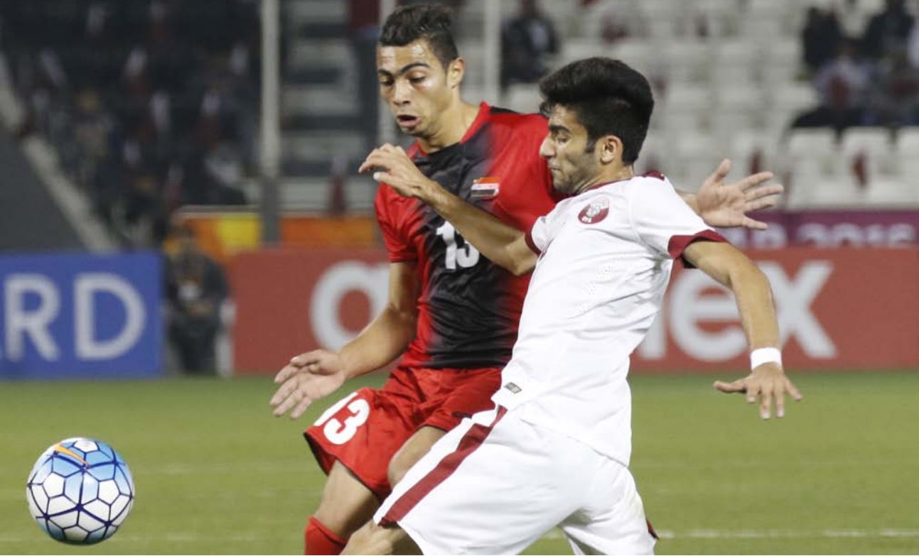
جانب من منافسات البطولة

* موفدا الاتحاد العراقي للصحافة الرياضية