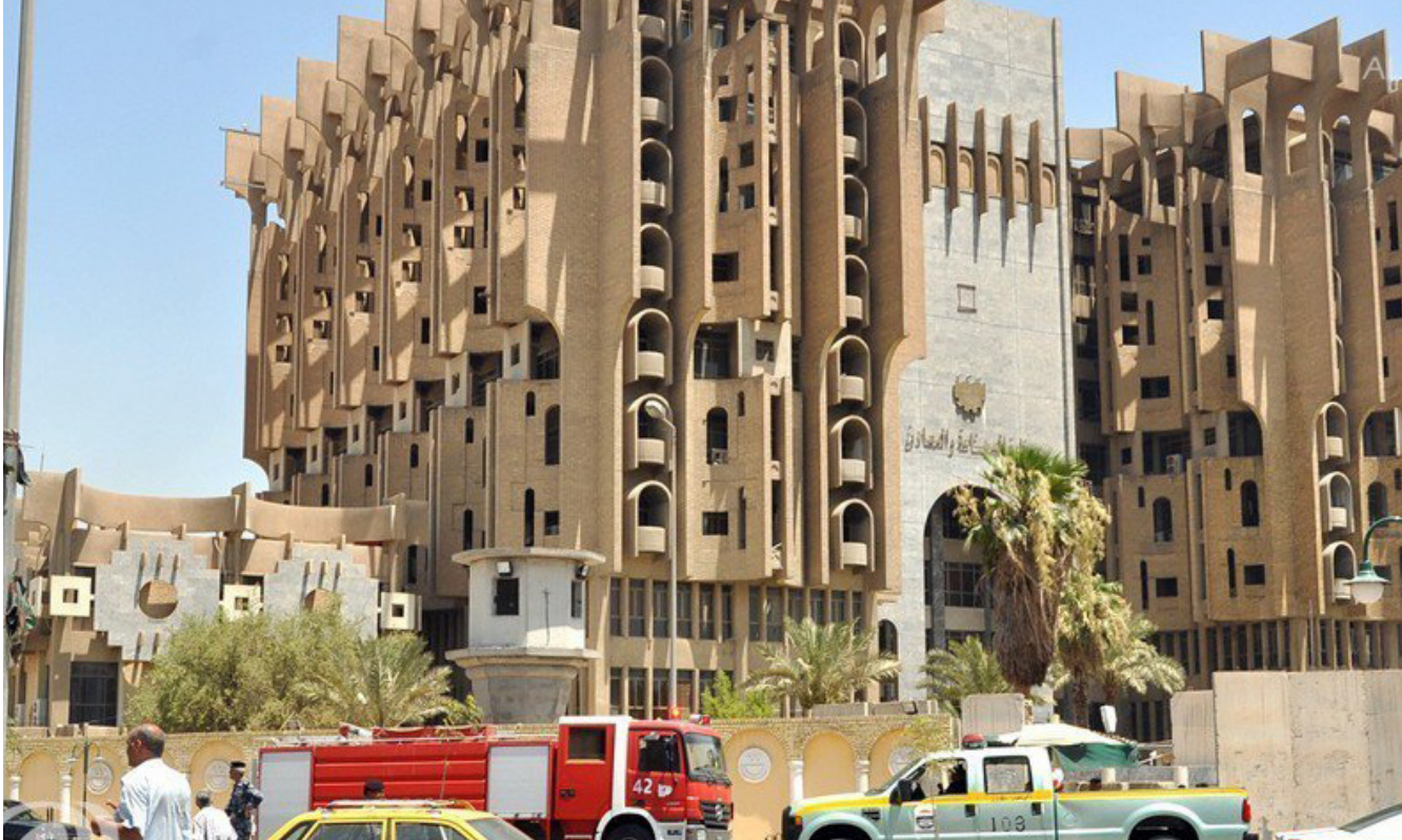
مبنى وزارة الصناعة والمعادن

بين الوزارتين لغرض فحص نماذج من المادة المنتجة . مشددا على ضرورة دعم المنتج المحلي في ضوء الظروف الاقتصادية التي يمر بها البلد وعدم اللجوء الى الاستيراد من دول اخرى للحفاظ على الأموال والحد من استنزاف العملة الصعبة .