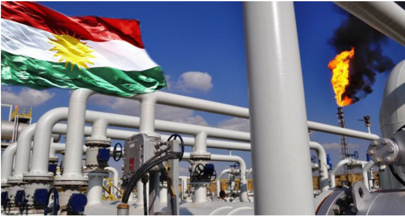
أحدى محطات انتاجالنفط في الإقليم

تسلم الإقليم مستحقاته. وسط تبادل للاتهامات بين الطرفين. وتؤكد تقارير محلية ودولية أن العراق كان يحصل قبل الأزمة الاقتصادية وانخفاض أسعار النفط على أكثر من 300 مليون دولار يوميا من مبيعات النفط عند سعر 110 و120 دولارا. بينما يحصل اليوم على 100 مليون دولار فقط.