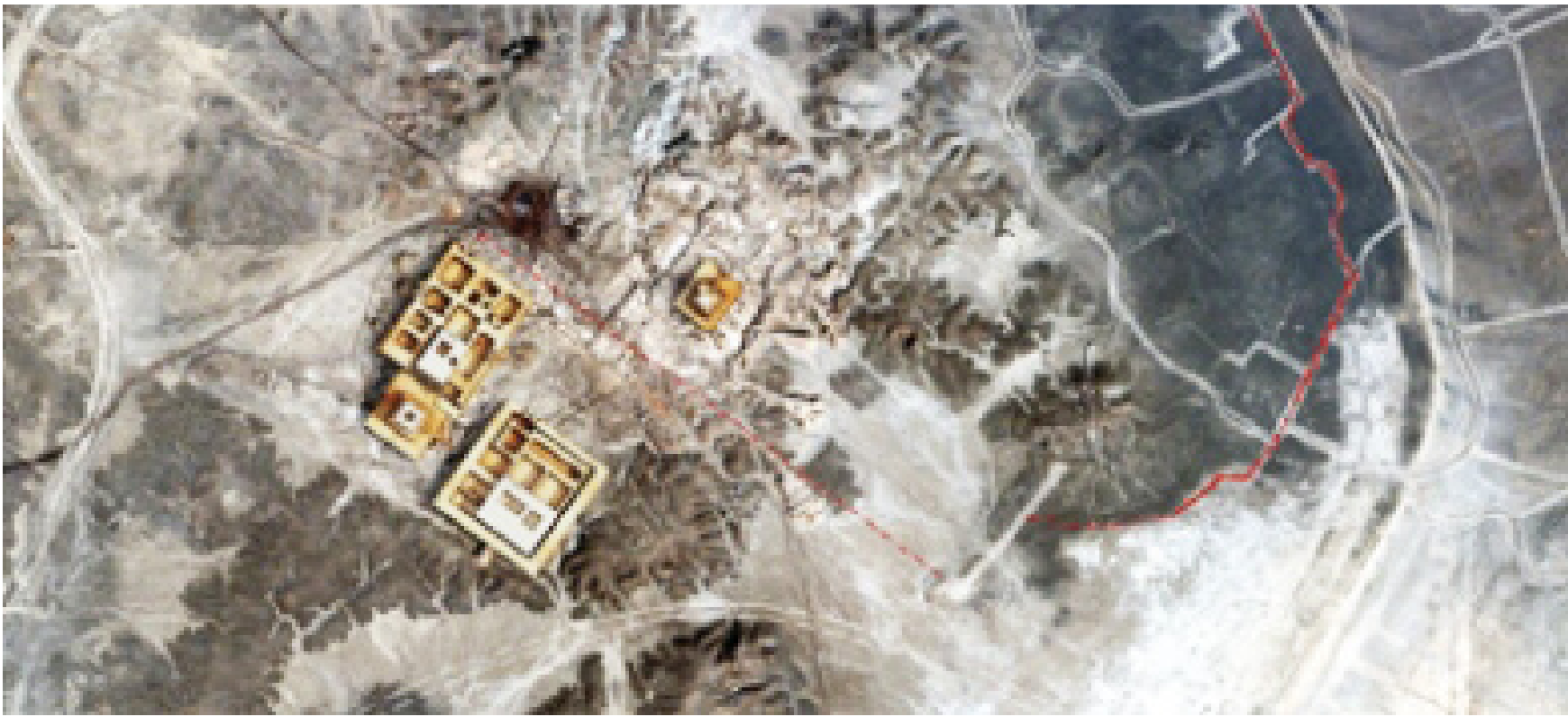
مدينة أوروک مشهد جوي تخيلي

جبهته.. قال الرجل:أنا قرأت التأريخ فوجدت إن في كل عصر مثل هؤلاء الذين يستغلون الدين لصالحهم وهم ينتصرون ..ولكن خسارتهم مؤلمة.. كان كتاب ملحمة كلكامش بين يدي .. أحاول قراءة ما تيسر للرجل الذي ضحك وقال: من هناك بدأ الصراع والحكاية ولم تنته بعد تفاصيل السماء؟ ثم زاد: إذا أردت محاكمة الواقع عليك محاكمة التأريخ لأنه صاحب الفتنة.وهو الذي يجعل السلطة والقوة هي صاحبة الانتصار النهائي لتبقى البشرية في داخل الصراع. لم تهدأ حلبة الصراع. ظُلت في صراخ الناصرين والمتهجين برؤية أنكيبدو وكانوا.. كانت النساء أكثر ارتفاعا في الأصوات وهن يبحثن عن نصر لتستريح أوروک من ظلم كلكامش الذي كان يريد الإحتفال أمام الملك ليعيد له البهجة.. أشار لي أنكيديو أن أسجل التفاصيل بروح متفائلة.. وأن أرى من ينتصر في التحدي.. كنت أشاهد كلكامش وهو يخطو في الحلبة وكانت الأرض تهتز خت قدميه وكانت جدران المعبد تضيق بذراعيه وهي ترتفع إلى الأعلى لتبنيان عضلاته القوية، حتى إذا ما دار الصراع، سقط أنكيبدو أرضا.. فيما كانت نورة كلكامش تخيف كل الحاضرين في الحلبة.. حينها نهضت لأعادر مكاني وأسجل في دفترتي الصغير:إن الخاسر دائما يلجأ إلى المديح ليزيل عن وجهه تراب الهزيمة، ويبحث عن قول ليعيد الصداقة، فالسلطة قوة مكانها في القصور التي خرسها عيون تخاف النظر إلى أعلى النوافذ.