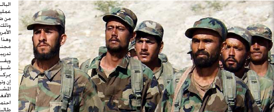
عناصر من الجيش الأفغاني

البالغ نحو 170 ألف جندي بسبب عمليات الهروب من الخدمة وما يسقط من ضحايا وانخفاض معدلات التجنيد وذلك وفقا لراقام التي نشرها الجيش الأمريكي في الشهر الماضي. وهذا معناه أن ثلث الجيش يتكون من مجندين جدد تخرجوا لتوهم من دورة تدريبية استمرت ثلاثة أشهر. ويقول مايكل كوجلمان الباحث في شؤون جنوب آسيا وجنوب شرقها بمرکز وودرو ويلسون الدولي للباحثين إن وتيرة تغيير الأفراد واحدة من أخطر المشاكل التي تواجهها قوات الأمن الأفغانية. وأضاف أن هذه المشكلة تزيد احتمال عجز القوات الافغانية عن صد طالبان عندما تخرج القوات الأمريكية بالكامل من البلاد. وعندما تولى الجيش الأفغاني جميع العمليات القتالية بالكامل في 2015 للمرة الأولى منذ الإطاحة بطالبان زادت الخسائر البشرية بنسبة 26 في المئة وفقا لما ذكره ضابط في حلف