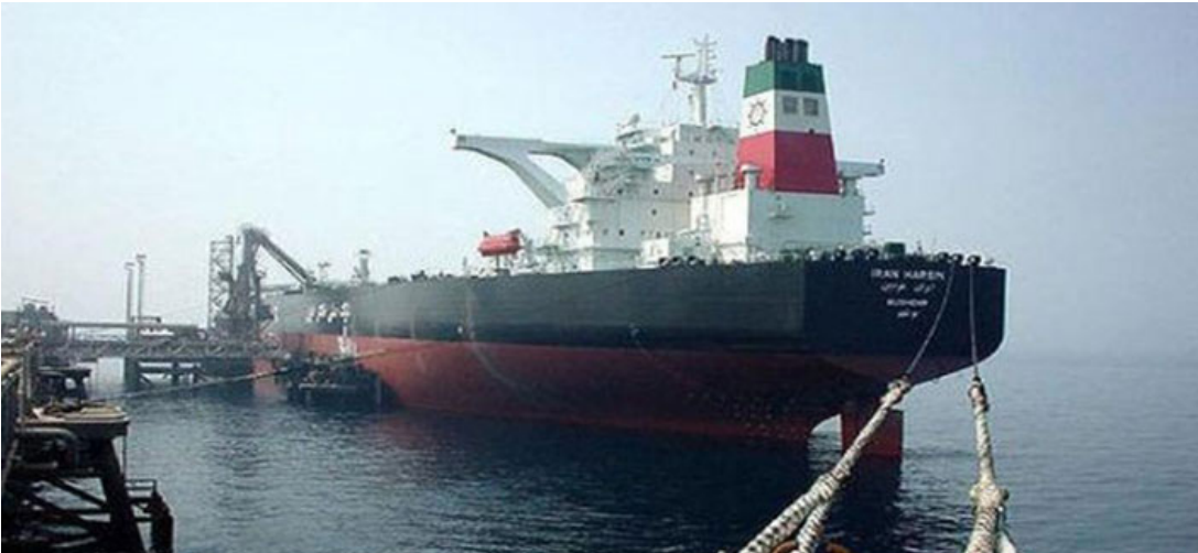
بآخرة لنقل النفط الإيراني

في الشأن ذاته. قالت سوق «لويدز لندن» للأمين إنه أصبح بوسع وكلاء التأمين في الاتحاد الأوروبي توفير التأمين وإعادة التأمين على نقل النفط والمنتجات النفطية الإيرانية. بعد رفع العقوبات عن طهران. برغم وجود بعض القيود المتعلقة بالتجارة الأميركية.