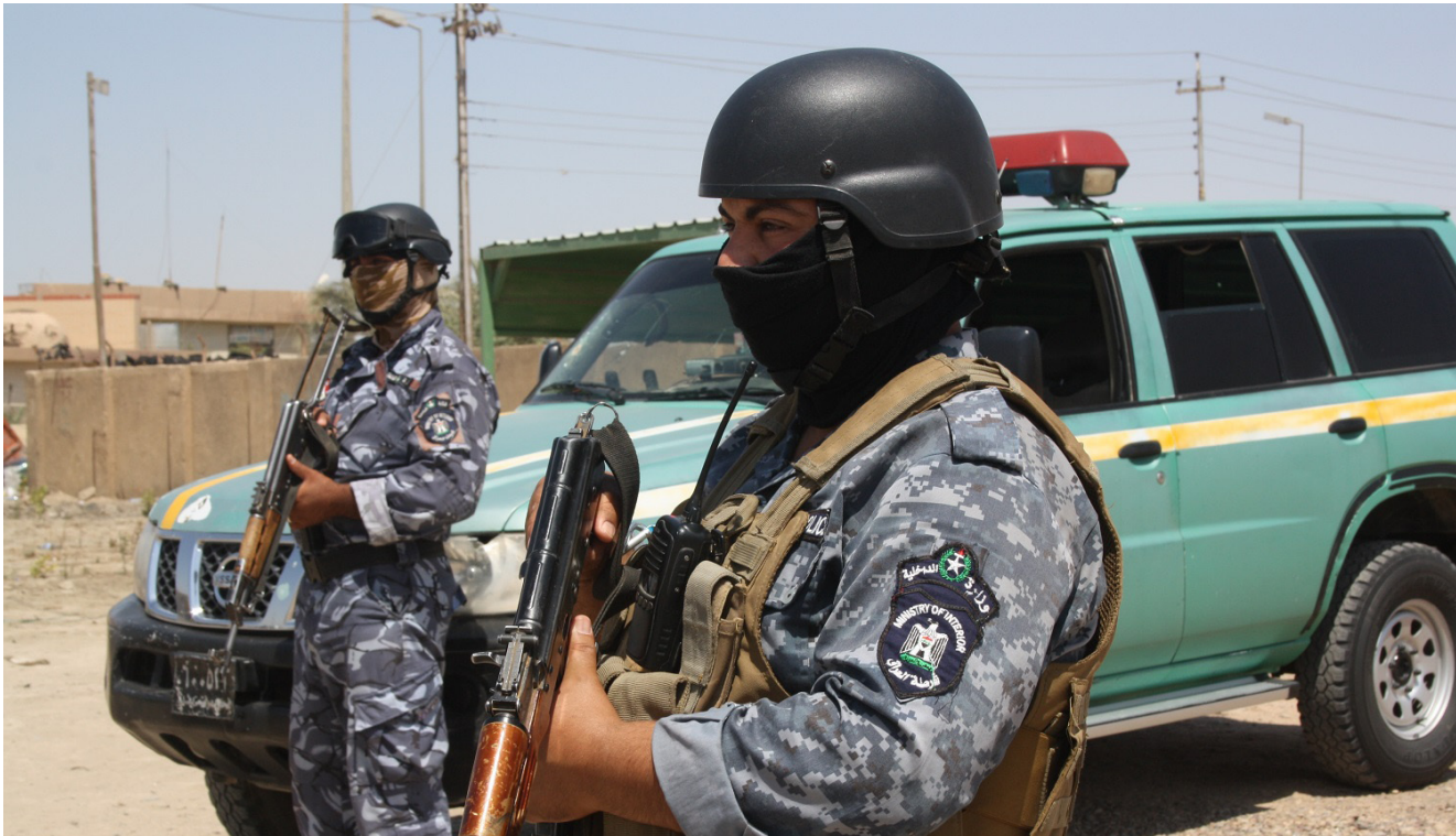
ما زالت القوات العراقية تبحث عن المحتطفين الثلاثة

المؤتمر سيخلق ردود أفعال سلبية اكبر وتضع مربرات اكبر لبعض الدول لعدم حضور المؤتمر». وأشار زبياري إلى إن «هذه العملية هي استهداف للعملية السياسية في العراق واستهداف للانفتاح العراقي على المحيطين الإقليمي والدولي وأعداء العراق هم من يقومون بهكذا أعمال مهما كانت هويتهم او انتماءهم».