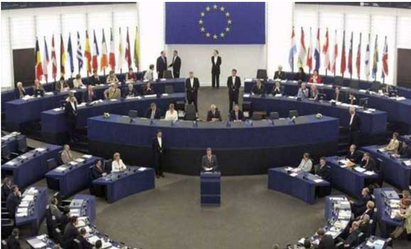
اجتماع الاتحاد الاوروبي لحل الأزمة في ليبيا

يديران العاصمة طرابلس بمساندة خالف جماعات مسلحة تحت مسمى «فجر ليبيا» ولا يحظيان باعتراف المجتمع الدولي. وقد حث المجتمع الدولي باستمرار على تشكيل حكومة الوفاق في ليبيا على أمل توحيد سلطات البلاد في مواجهة الخطر الجهادي المتصاعد فيها والمتمثل خصوصاً في تنظيم الدولة الإسلامية الذي يسيطر على مدينة سرت (450 كلم شرق طرابلس) ويسعى للتمدد في المناطق المحيطة بها الغنية بآبار النفط.