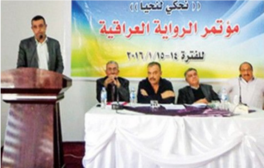
جانب من مؤتمر الرواية العراقية

والبوسنت هو تساؤل لطالبا طرحة كثيرون وعبروا فيه عن عدم رضاهم عن مجمل عمل الاخاد وقيادته الحالية التي تلنزم الصمت هي الاخرى ولا ترد على الاسئلة التي يثيرها بعض المثقفين والمتعلقة بصميم عملها الاداري. كل ما جرى قد لا يكون المشكلة اساسا وانما التجاهل وجعل الامر يمر مرور الكرام دون مراجعة وتقييم من قبل اخاد الادباء واعادة النظر بما طرح من مشاريع وافكار ونشاطات خصوصا اليريد ومؤتمر الرواية والعمل على تلافي الاخطاء في المرات المقبلة هو المشكلة الحقيقية، واذا كانت نتائج المهرجانات هي القطيعه بين المثقفين والاتحاد وشحن الجو الثقافي بالانفعالات والتراشق الاعلامي وتبادل الاتهامات فالأحرى الغاء جميع المهرجانات والعمل على ايجاد بدائل لها.