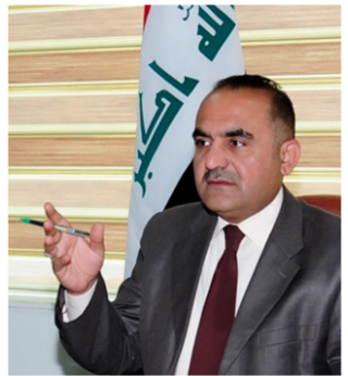
عبد الستار بيرقدار

الأخيرة وما ورد بخصوص تفعيل دور الادعاء العام بشأن ملفات الاسترداد التي تخص المتهمين والمحكومين الهاربين، ولاسيما في القضايا التي تتعلق بالإرهاب والفساد المالي. وأوضح أن «مفرد هذه الشعبة سيكون في رئاسة جهاز الادعاء العام» مبيناً أنه «تم تخصيص مدعي عام للإشراف على الشعبة وتكليف معاونين قضائيين متخصصين للقيام بمهامها». وتابع، أن «تقارير هذه الشعبة ترفع شهريا إلى رئاستي مجلس القضاء الأعلى وجهاز الإعاء العام».