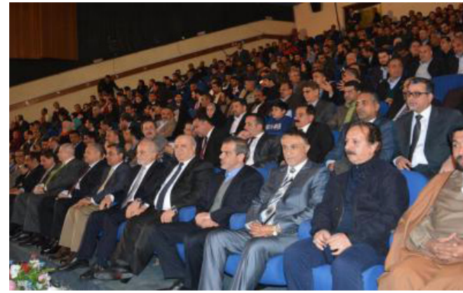
جانب من العرض

انتظر هذه اللحظات لعرض الفيلم، فهو حصيلة سبع سنوات من العمل الشاق مع السينمائيين الإيرانيين والعالميين ففي هذه الأيام