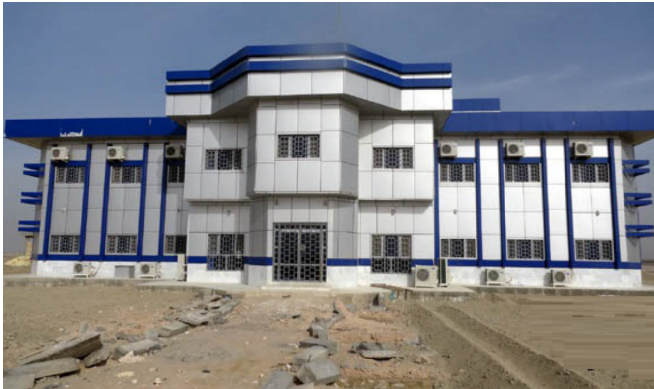
مشروع المدينة الصناعية في ذي قار