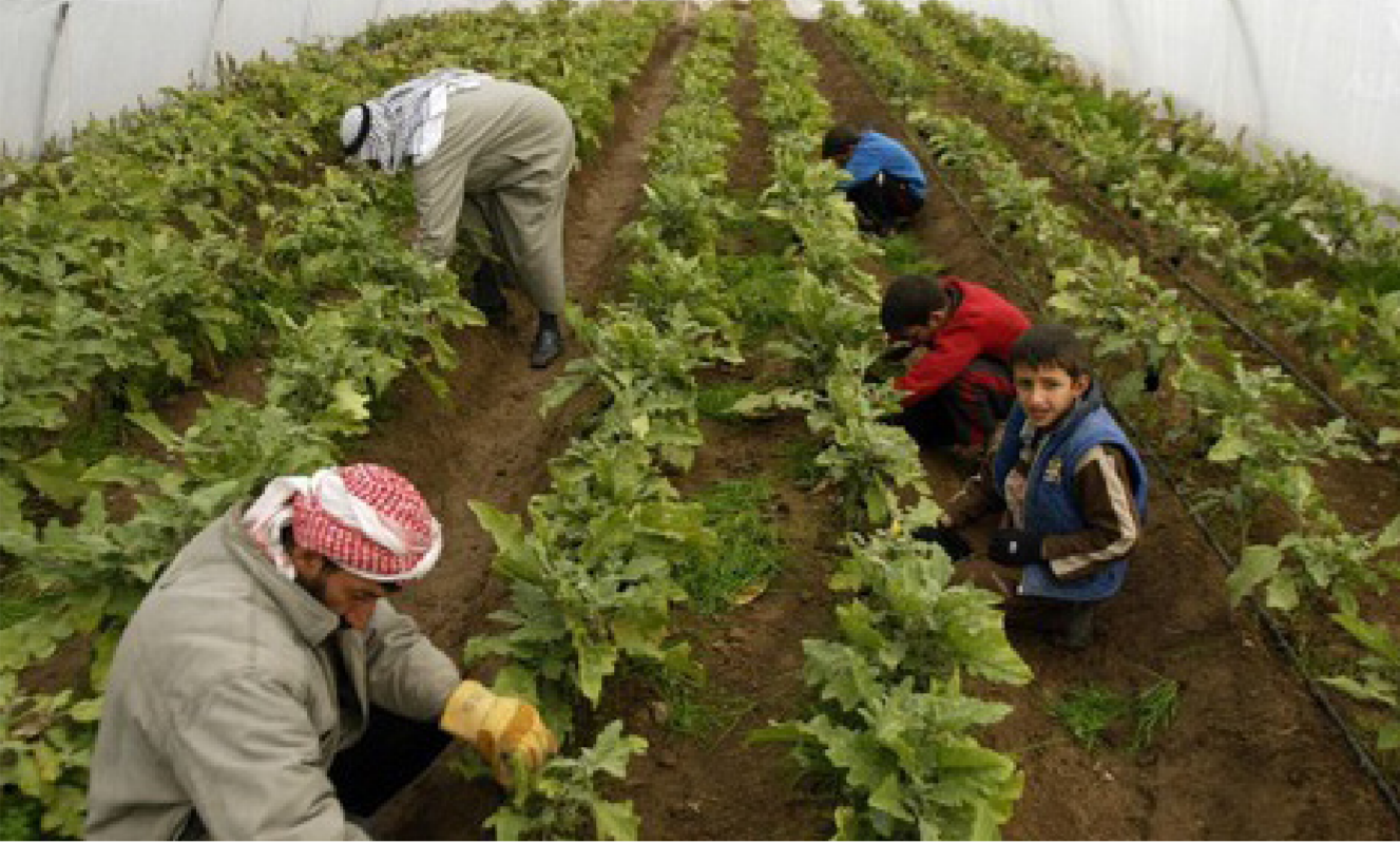
أحد المشاتل في العراق

العمل كانت في القرى وتم فرش مجموعة من الشوارع في القرية العصرية بالخصي الخابيط وجعلها سالكة بصورة جيدة أمام الحركة إضافة إلى تأهيل خدمات الماء والكهرباء فيها . يذكر أن قضاء بدرة يقع على مسافة (80 كم شرقي واسط) بحاذي الحدود الإيرانية ويضم القضاء ناحيتي جصان وزرباطية ويشتهر بالزراعة والسيارات إضافة إلى وجود الكثير من معامل إنتاج الحصى والرمل والسببس مع وجود حقل بدرة النفطي الذي يعد أهم المشاريع الاستراتيجية في القضاء.