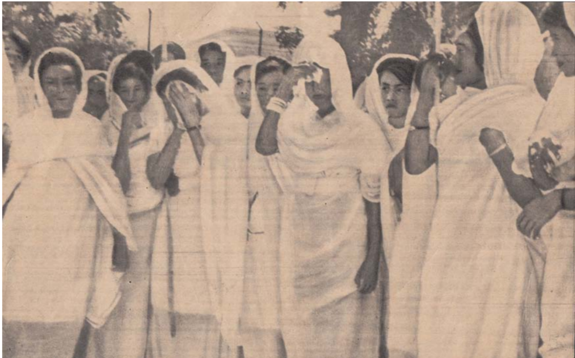
مراسيم الفأخة البرزي الوطني في السودان

وحارة جداً وإذا وقف الإنسان ختها يصاب بضربة شمس وصدفوني وجدت بهذا (الركود) لذة وراحة نفسية متناهية وبدأت أسألها عن السودان وعاداتهم وقضيت وقتا متعا والغريبة الخاصة بأفريقيا.