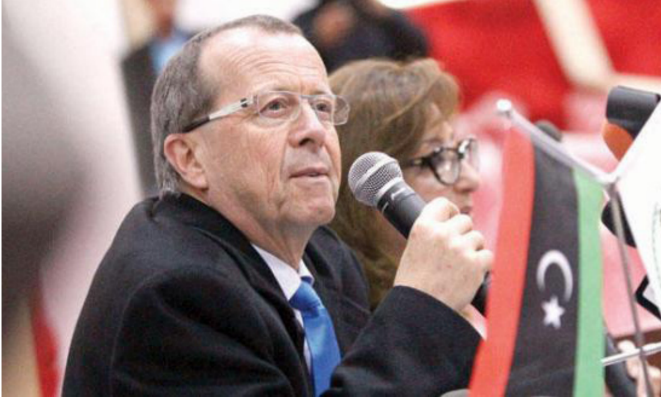
المبعوث الأممي في ليبيا مارتن كوبلر

والمدينة في طرابلس من التعامل مع المجلس الرئاسي لحكومة الوفاق الوطني، ووصفته بـ«الجسم غير الشرعي» الذي يسعى لإشغال حرب أهلية بين الليبيين. وهددت بمعاقبتهم. واعترض النائب في المجلس الرئاسي علي القطراني، على تكوين اللجنة المؤقتة لتيسير الترتيبات الأمنية، معتبراً أنها كوّنت من غير توافق ولا تصويت من الرئيس ونوابه وهو ما يخالف المادة 1 من الملحق رقم 6 الخاص بالترتيبات الأمنية وفي وثيقة الاتفاق السياسي.