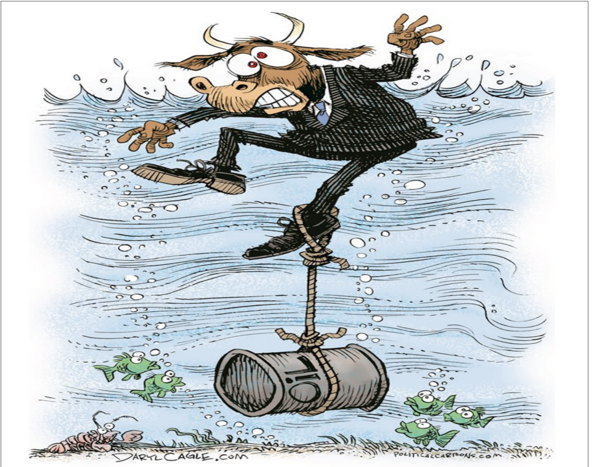
عن موقع «كارتون سياسي»