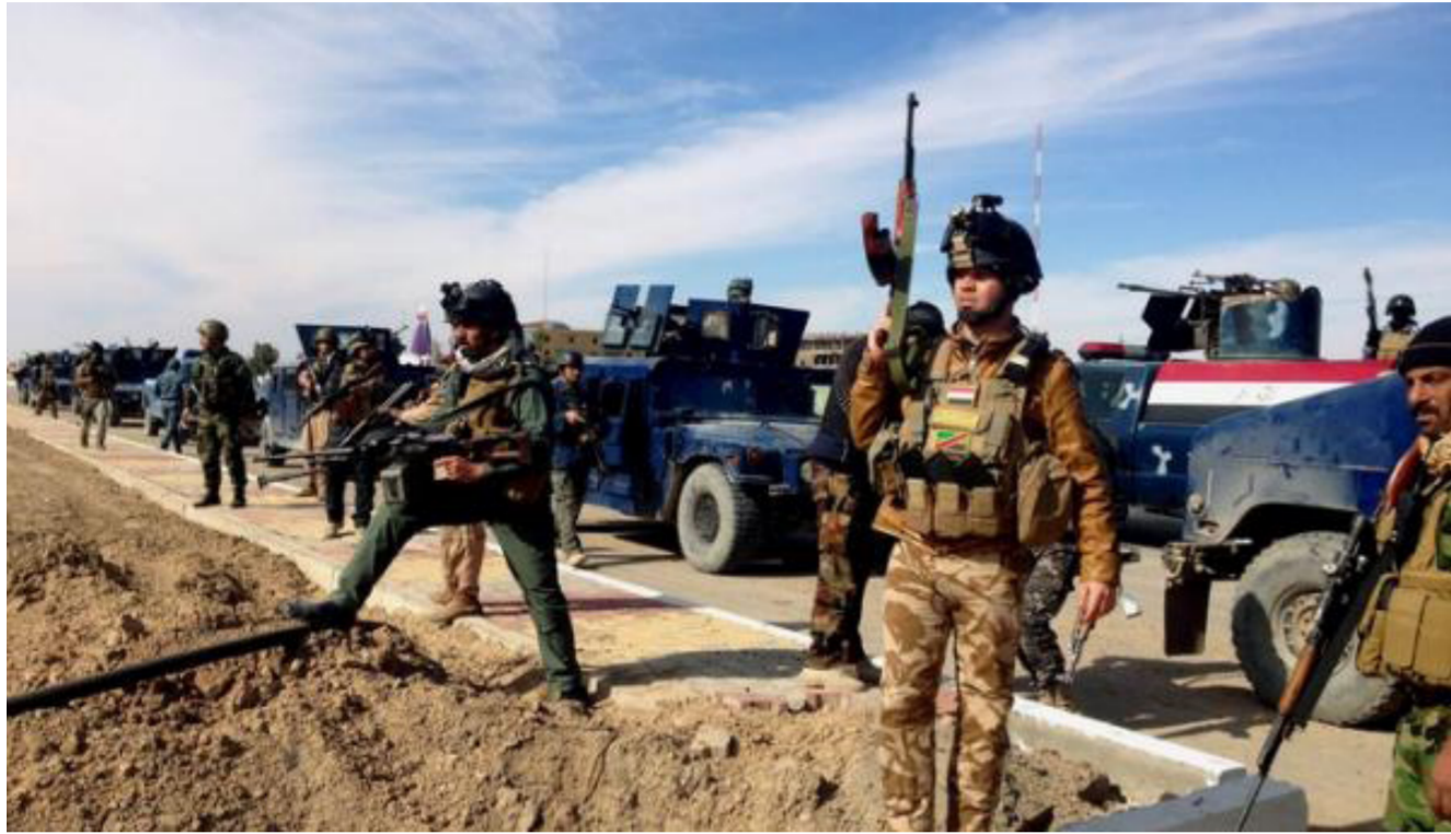
استعداد القوات الأمنية لاقتحام الحويجة

إلى أن «الغارة الجوية أسفرت عن مقتل نحو 40 مسلحاً من التنظيم وتدمير المستودع بالكامل». وتنتج قرية بشير لناحية تازة بدورها لقضاء داقوق جنوبي كركوك، وتضم القرية نحو 1150 منزلاً وفيها أكثر من 2500 عائلة وهي تبعد بنحو (25 كم عن مركز المدينة).