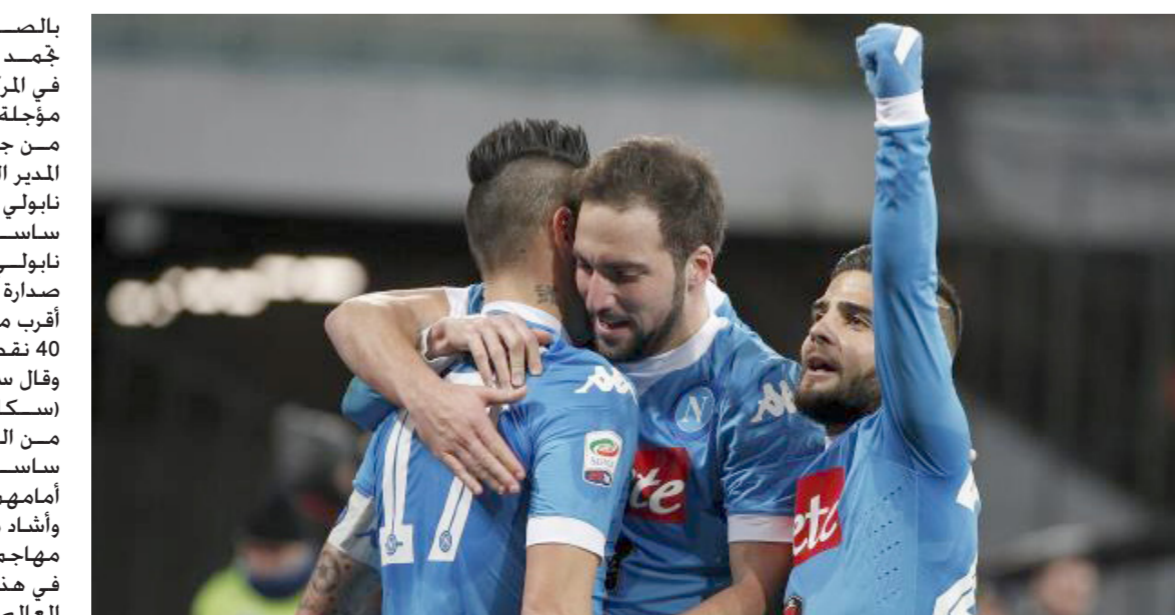
فرحة لاعبي نابولي بالفوز

هدفه الأول. سيقدّم ما هو أفضل هو لا يتحرك كثيرا ولكن إمكانيته تسمح بذلك». وسجل هيغو واين هدفين من ثلاثية فريقه ليتربع على عرش هدافي الدوري الإيطالي. برصيد 19 هدفا من أصل 20 مباراة. وبفارق 8 أهداف عن إيدير مهاجم سامبدوريا. ويرى ساري أن يوفنتوس المرشح الأقوى للفوز بالأسكوديتو. قائلا: «لقد حققنا لقب الدوري 4 مرات متتالية. كما فازوا بالكأس ووصلوا إلى نهائي دوري أبطال أوروبا الموسم الماضي. مساواتنا بهم جنون». وأدى اوزبيو دي فرانثيسكو المدير الفني لفريق ساسولو. سعادته بأداء فريقه رغم الخسارة أمام نابولي بثلاثة أهداف مقابل واحد في الجولة 20 من الدوري الإيطالي لكرة القدم. وقال دي فرانثيسكو في تصريحات لشيكة (ميدياست برعميوم): «قدما مستوى جيد ونافسنا نابولي في المباراة. ولكن لم يكن بوسعنا تقديم ما هو أفضل».