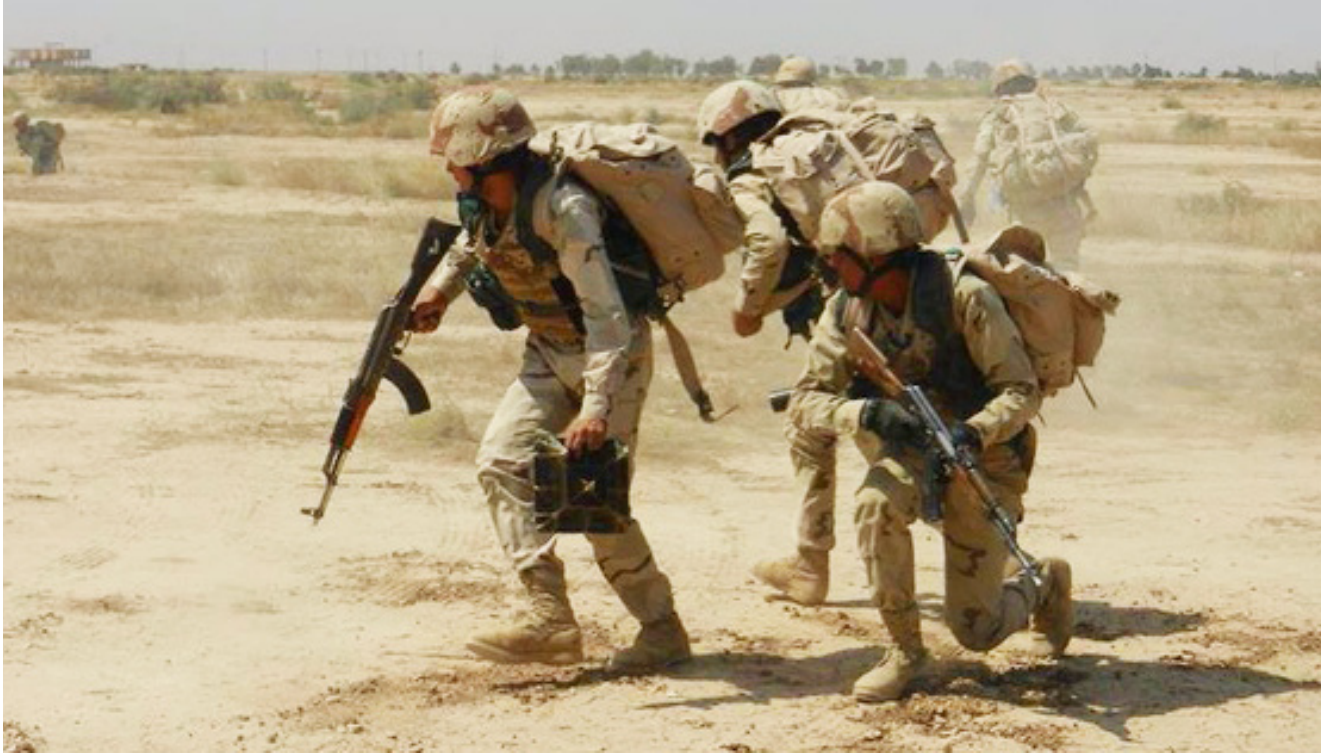
القوات الأمنية في كركوك

المسليح وإرباكهم وإعاقة حركتهم وتنقلهم في المناطق التي يسيطرون عليها وهي الشرايط والزوية والمسحك. موضعاً أن «القصف الجوي استهدف تحديداً مناطق تدعى محمد الموسى والشيوخ على وقرى قريبة من جبل مححول ومعمل الطابوق». وبعد قضاء الشرايط منطقة مهمة من الناحية الجغرافية، لأنه يتوسط ثلاث محافظات، حيث يقع على بعد (115 كم) جنوب محافظة نينوى، وعلى بعد (125 كم) شمال تكريت مركز محافظة صلاح الدين، وعلى بعد (135 كم) غرب محافظة كركوك.