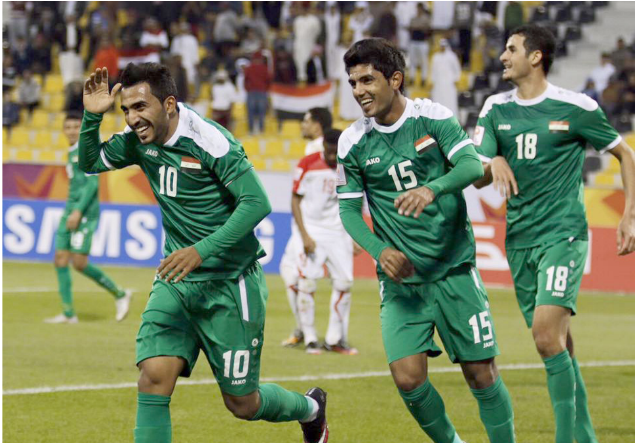
الفرحة العراقية في مباراة اليم

واضطر المنتخب الصيني للعب بعشرة لاعبين اعتبارا من الدقيقة 41 عندما اشهر الحكم البطاقة الحمراء بوجه الحارس دو جيا بسبب ارتكاب الخالفة التي احتسبت بسببها ضربة الجزاء وبهذه النتيجة رفع المنتخب القطري رصيده الى 6 نقاط من مباراتين. مقابل 3 نقاط لكل من إيران وسوريا. في حين بقي رصيد الصين خاليا من النقاط.