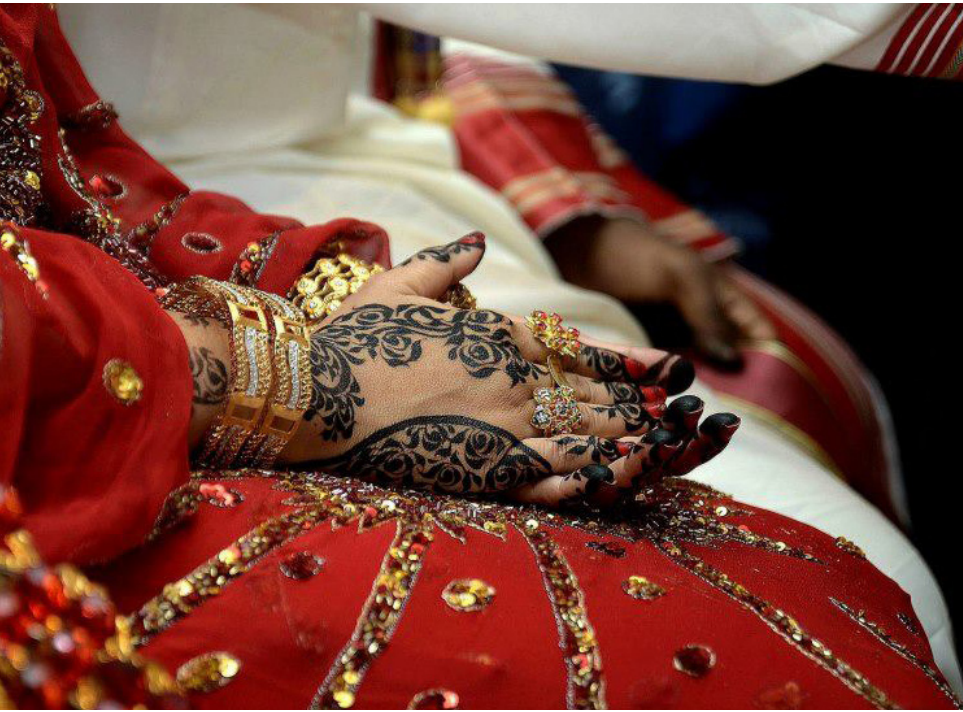
نقش اليد بالحناء

دكاكين خياطين على الرصييف مع مكانتهم ومقدورك أن تشتري الفماش وتعطيه الى الخياط ويحيط أنواع الجلابيات ويزوقها بالقيطان الأبيض. فكنت أرسم لهم الموديل الذي أریده وكانت أجمل هدية أخذتها لبغداد لأهلي وأصدقائي.