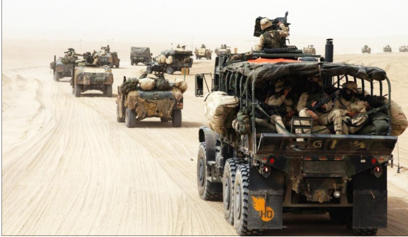
القوات الأمنية في الأنبار

بعد تصدي القوات الأمنية وأبناء المدينة، مشيرين إلى أن "تصدي القوات الأمنية لهجوم التنظيم والضربات الجوية التي شنها طيران الجيش العراقي الذي دمر إمدادات لجبرته على إرهابيين في الرمادي من قيادات "داعش" يعود تدريجيا إلى سيطرة القوات الأمنية".