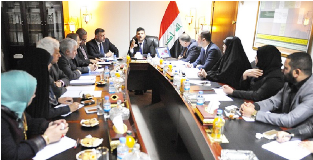
اجتماع لجنة الخدمات والإعمار النيابية

بغداد - محمد الرائد: أكدت لجان نيابية متخصصة، أمس السبت، أن العراق ينتج حتى الآن 50% من حاجته الفعلية للكهرباء، متوقعة "صيفاً قاسياً" من ناحية ساعات التجهيز بسبب سوء إدارة اللطف، وقلّة التخصصات، وفيما كشفت عن البدء بمشروع العدادات الرقمية الذي انيط تنفيذه إلى شركات من القطاع الخاص، أشارت إلى أن الحصول على الطاقة بموجب هذا المشروع على وفق بطاقات شحن مسبقة كما هو حال ارضدة الهاتف النقال.