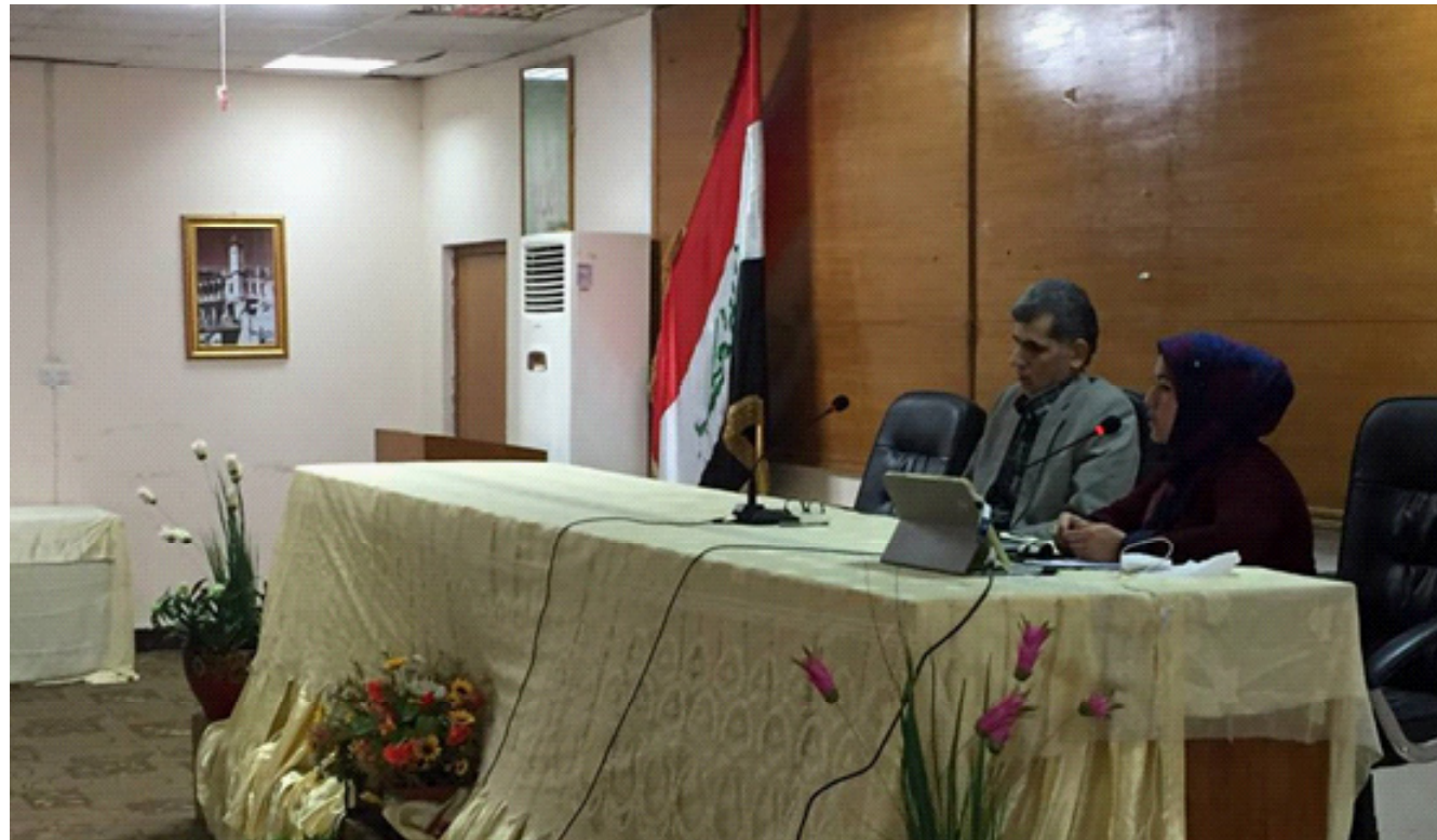
جانب من الحلقة النقاشية عن دور الجامعة في تنمية المجتمع البصري