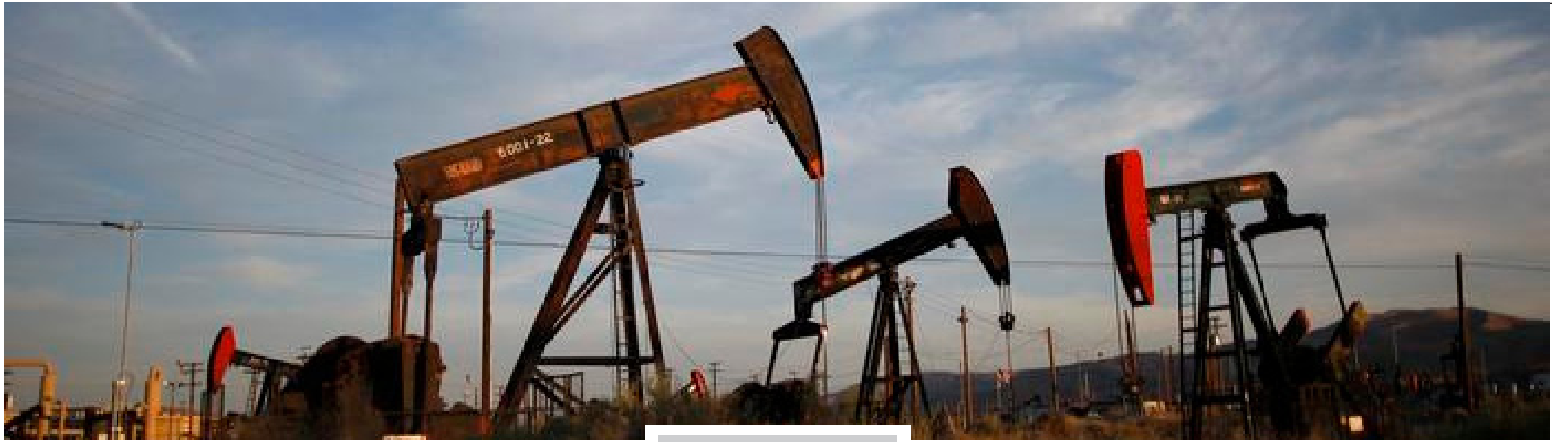
الحلقة الحادية عشرة