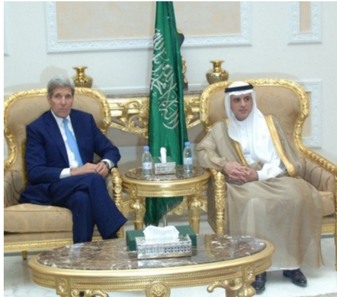
وزير الخارجية الأميركي ونظيره السعودي

لا تستطيع المملكة العربية السعودية التحكم بمسار أيديولوجيتها الجهادية إلا إذا أوقفت الوعظ بها بالكامل. فمتى نادى أحدهم بوجوب «محاربة المرتدين» أو «الدفاع عن الإسلام» في إحدى الدول، يكون بذلك قد سمح للأخريين بالبدء في شن الجهاد الهجومي في نيويورك أو باريس أو موسكو أو حتى في مكة، ولا تملك الحكومة السعودية آلية لوقف هذا التحريف للرسالة.