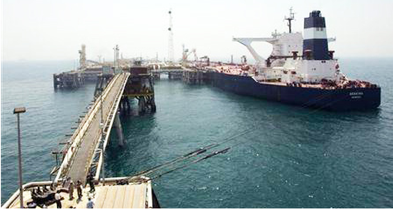
منصة عائمة لتصدير النفط جنوبي العراق

لأن تتجاوز 200 ألف برميل في الفترة المقبلة. وقال المتحدث باسم وزارة النفط إن «تأسيس هذه الشركة يأتي ضمن توجه الوزارة إلى تأسيس شركات وطنية في المحافظات التي تشهد زيادة في الإنتاج. لإعطاء مرونة عالية والإسهام في تطوير المحافظة».