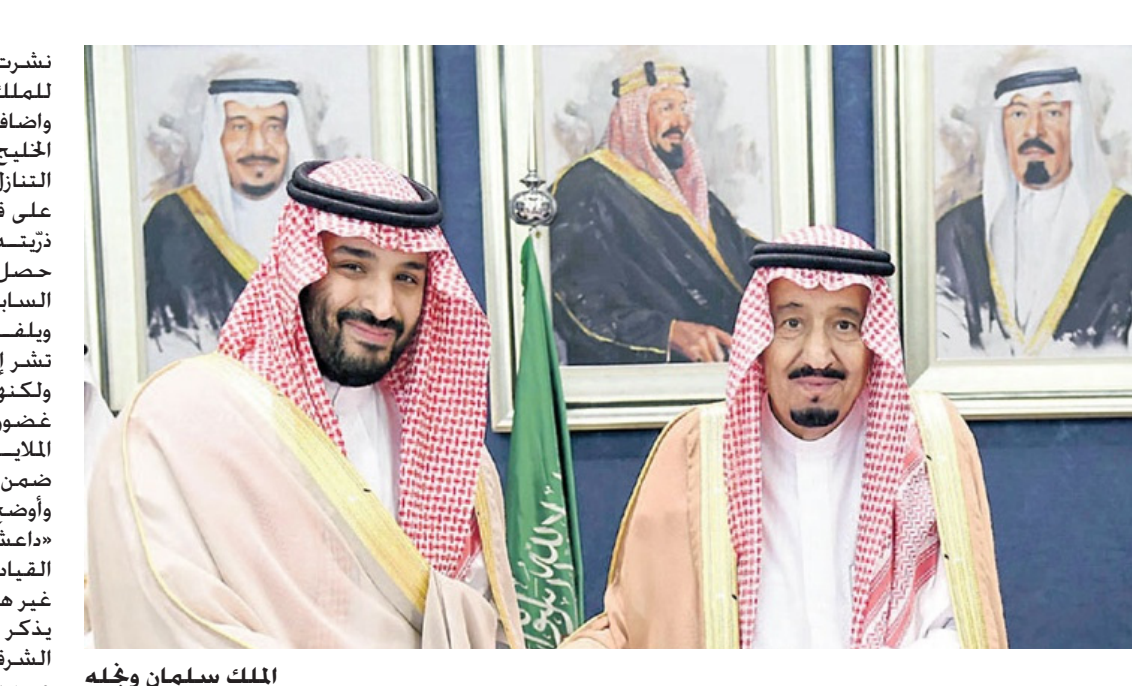
الملك سلمان ونجله

نشرت خلال الأسابيع الماضية. صورا للملك سلمان وهو يزور أخوته. وأضاف تقرير معهد واشنطن لشؤون الخليج العربي: إن الملك سلمان ينوي التنازل عن العرش لابنه وهو لا يزال على قيد الحياة ليضمن عدم تهميش ذريته وإخراجها من السلطة كما حصل مع أبناء الملوك السعوديين السابقين. وبلغت التقرير إلى أن المصادر لم تنشر إلى وقت محد للعلية التنازل ولكنهم قالوا إن ذلك قد يتم في غضون أسابيع، وأن الملك بنفق مئات الملايين حالياً لشراء الدعم لقراره ضمن العائلة الحاكمة. وأوضح التقرير «أنه في ظل هجمات «داعش»، والحرب في اليمن، يبدو أن القيادة السعودية الجديدة تسير على غير هدى». وذكر أن تعرض مسجدين في المنطقة الشرقية لهجومين إرهابيين، ما أسفر عن «استشهاد» 11 شخصاً، وفي