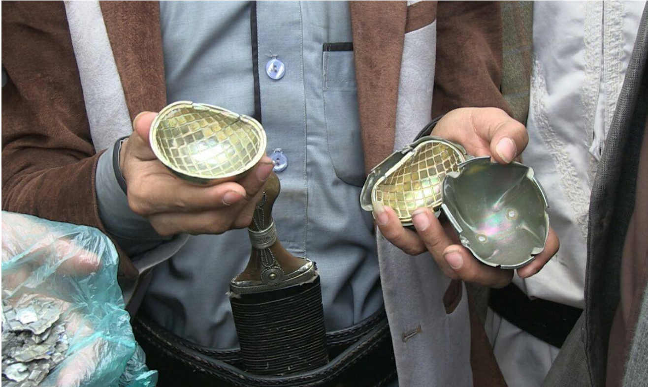
بقايا القنابل العنقودية في اليمن

خلال الصيف عملياته لتشمل تقديم دعم ميداني مباشر لها من خلال إرسال قوات ومعدات، والقيام بتدريب المقاتلين. وواقعت أعمال العنف في اليمن بين منتصف آذار/مارس وأواخر كانون الأول/ديسمبر 2015 نحو ستة آلاف قتيلاً بينهم 2795 مدنياً ونحو 28 ألف جريح ضمنهم نحو خمسة آلاف مدني، وفقاً لاجهزة الأمم المتحدة.