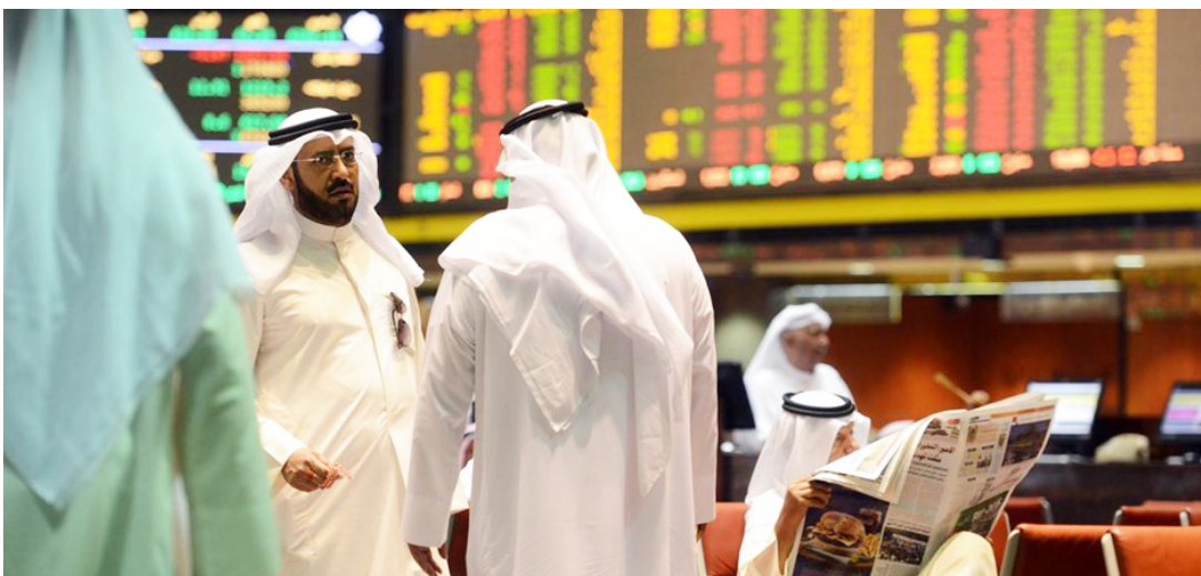
مشهد من إحدى البورصات العربية

والتى طالت الأسهم المتداولة، فيما كان لعمليات البيع العشوائي والمكثف التي نفذها مدبرو صناديق عالمية وإقليمية دور في تعميق التراجعات المسجلة».