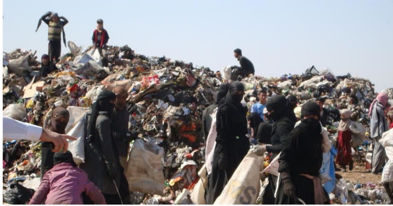
عائلات عراقية فقيرة

بغداد - زينب الحسني: أكد وزير العمل والشؤون الاجتماعية المهندس محمد شياع السوداني ان الوزارة تسعى الى التخفيف من وطأة الفقر على المواطنين من خلال استفادها الفئات التي هي دون مستوى خط الفقر . وقال السوداني في تصريحات صحفية ان المشمول على وفق القانون القديم كان يمنح الاعانة الاجتماعية على اساس الفئات المحددة بالقانون كالأرامل والمطلقات وذوي الاعاقة واليتامى من دون النظر الى المستوى المعيشي او الاقتصادي لتلك الفئات . لافتا الى ان قانون الحماية الاجتماعية الجديد يستهدف جميع العائلات والفئات المستضعفة في المجتمع من خلال معيار خط الفقر الذي حددته وزارة التخطيط .