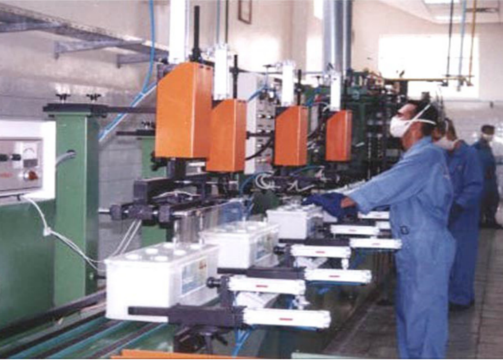
إحدى الشركات العراقية

العملة وتلبية احتياجات السوق من الدولار في ضوء قوة احتياطياته من العملة الأجنبية». ودعا البنك المركزي. بحسب البيان. المواطنين العراقيين إلى «التنبه لتلك الشائعات المغرضة، والتي تهدف إلى التشويش وإرباك السوق العراقية».