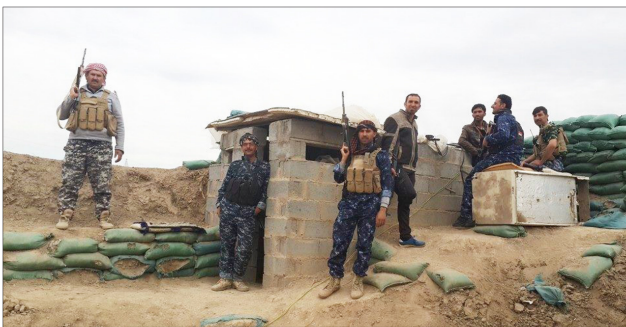
القوات الأمنية قرب الفلوجة