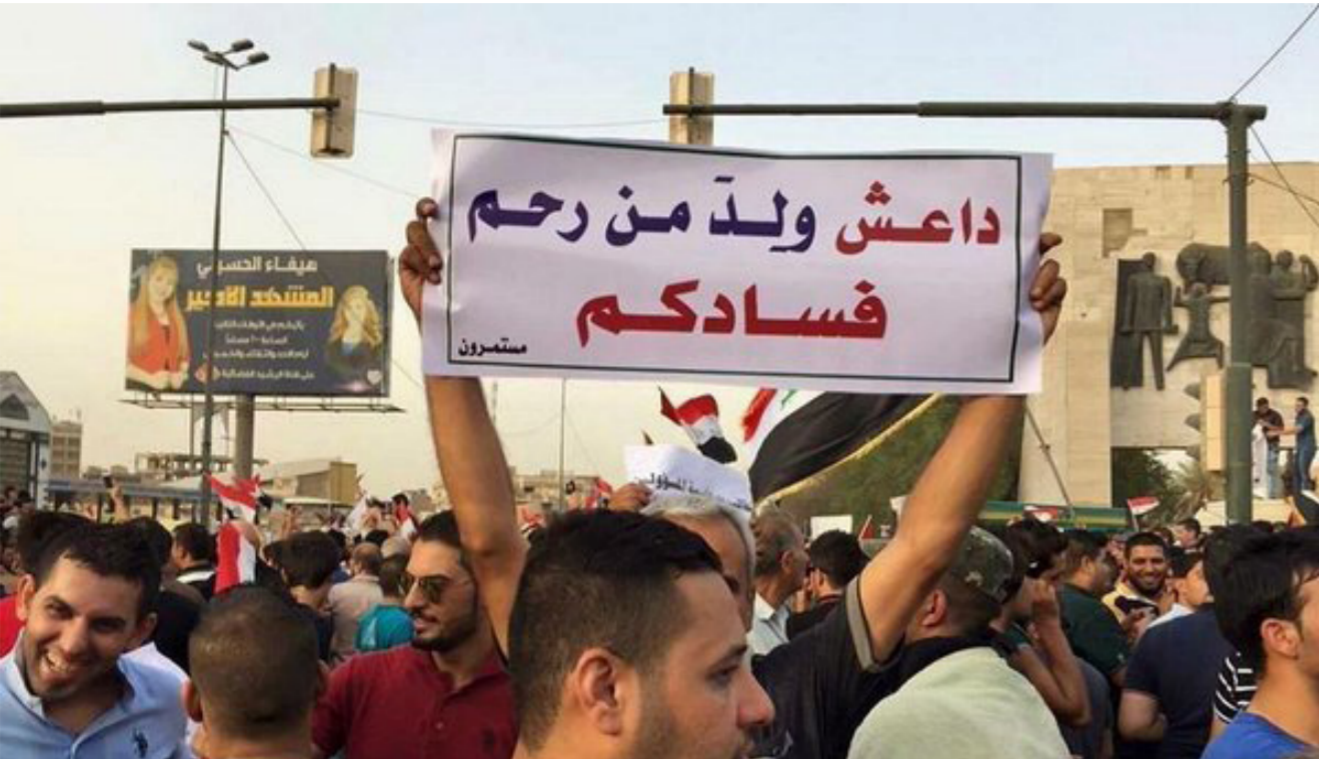
التظاهرات الشعبية طالبت بحاسبة الفاسدين

قال في كلمته باحتفالية وزارة الداخلية بالذكرى الـ 94 لتأسيس الشرطة العراقية أن «عام 2016 هو عام القضاء على الفساد وبناء أجهزة الأمن ولا يجوز أن نغطي عن الفساد من دون تطهير الجبهة الماضية. تأخر تطبيق حزم الإصلاحات السياسية والإدارية والاقتصادية وفي مجال محاربة الفساد. وغيرها. التي أعلنت عنها الحكومة منذ آب الماضي.