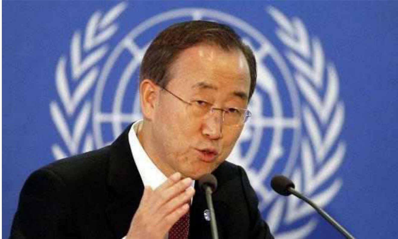
الأمين العام للأمم المتحدة بان كي مون

في اتجاه رفع الحصار (عن مناطق عدة) وانهاء هذا التفتك العائد الى القرون الوسطى». وفي الدوحة، قال المفوض السامي لحقوق الانسان في الامم المتحدة زيد بن رعد الحسين إن أولئك الذين يفرضون حصارا يهدف التجويع يجب ان يمثلوا امام العدالة.