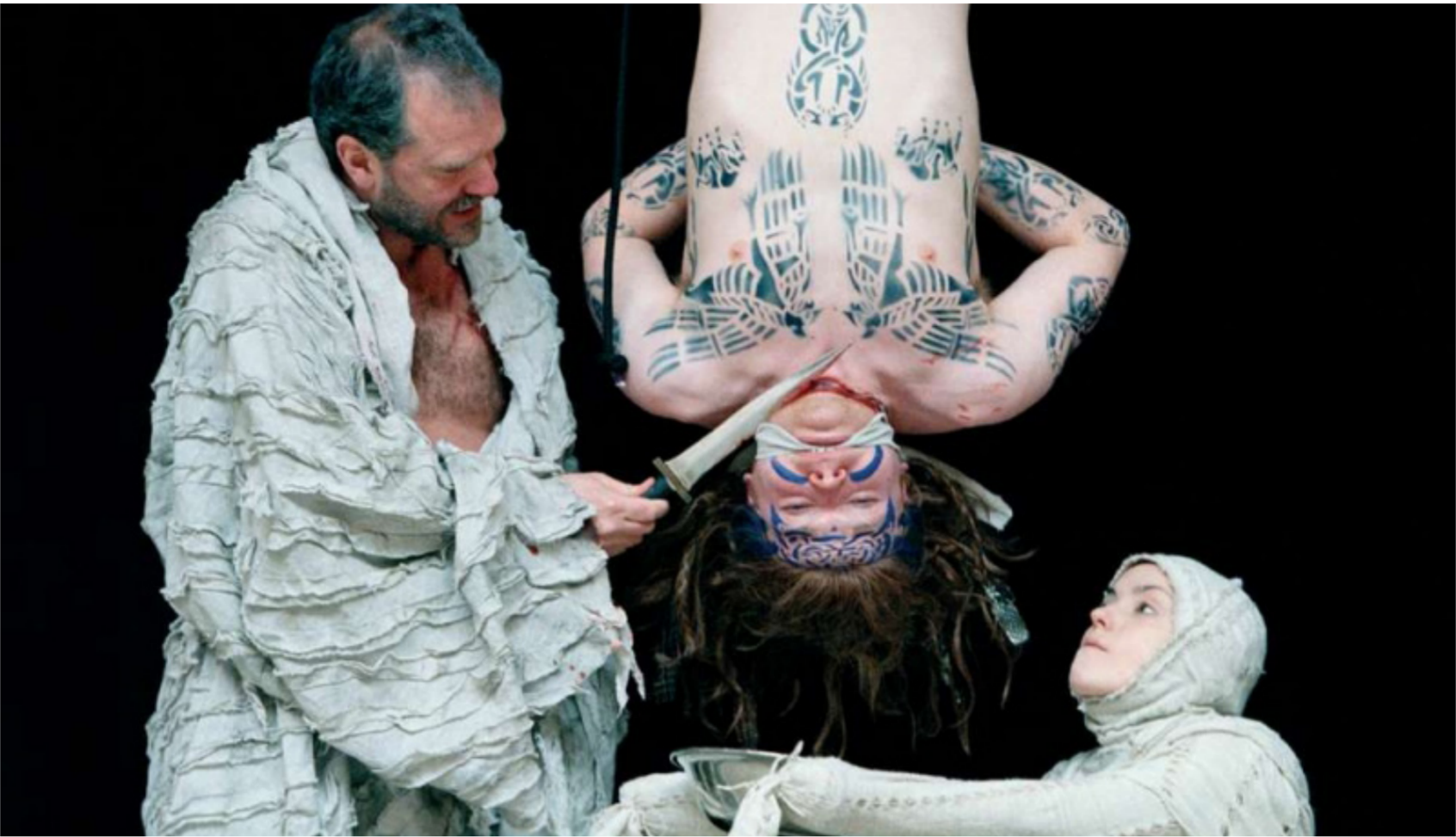
مشهد من مسرحية تيتوس اندريكوس

إن الانتقام والنار من الزوجة والابن والأخ كان سمة العنف المترسخ في نفوس الملوك والحكام عبر كل العصور.