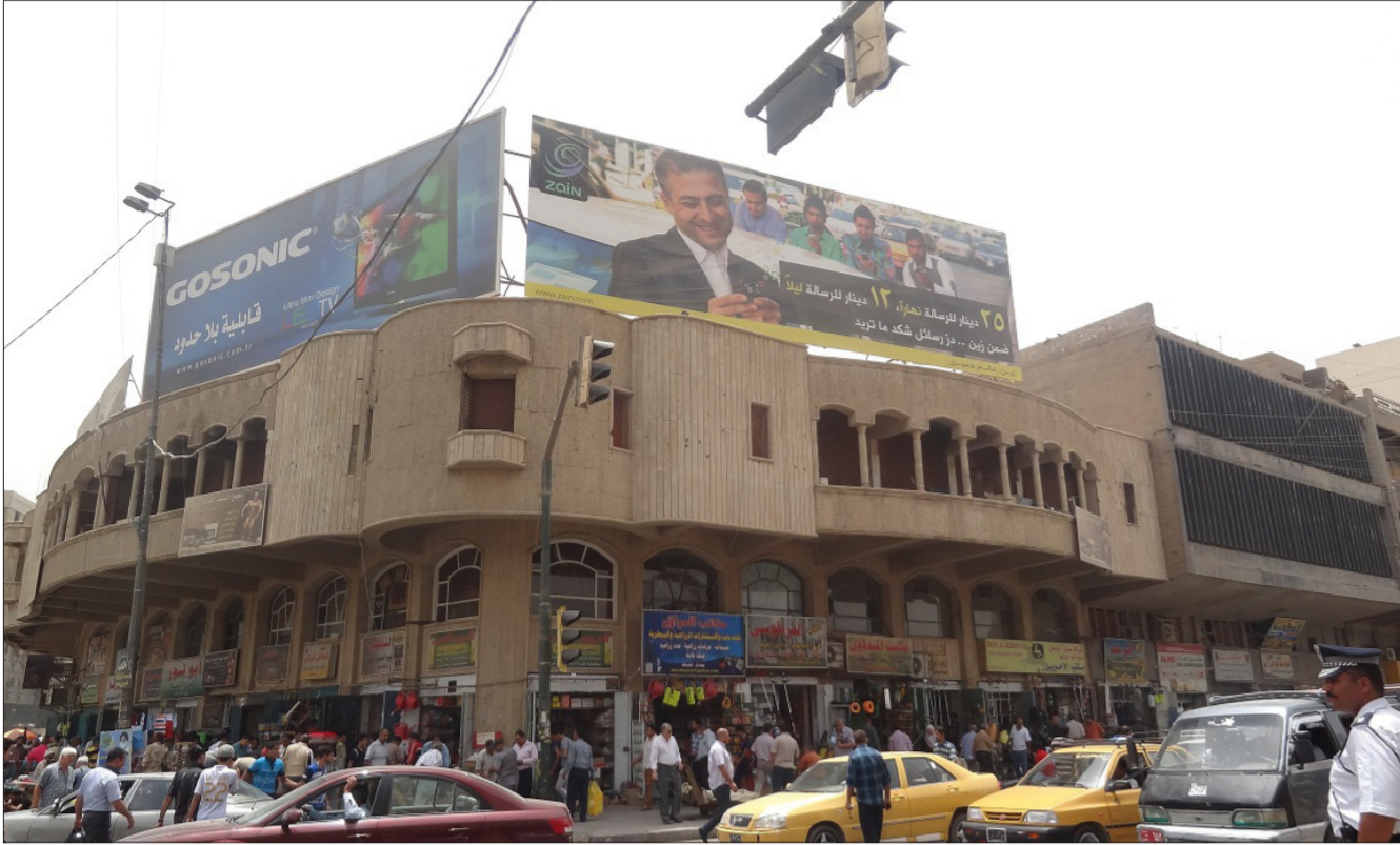
الاعلانات التجارية في شوارع بغداد

في دائرة بلدية الاعظمية بالتنسيق مع قسم التخطيط في دائرة مجاري بغداد اجرت (80%) من اعمال اصلاح تحسيف الصحي في منطقة راغية خلاتون ضمن محلة (315) رفاق (5) . وأشارت الى ان « الاعمال شملت حفر مسار الأنابيب واستبداله بأنبوب ذي مواصفات عالية بطول (90) مترا وإعادة فرش التربة واجراء الفحوصات المخبرية لمسار الأنابيب وإصلاح الأضرار الحاصلة في المنهول الرئيس .»