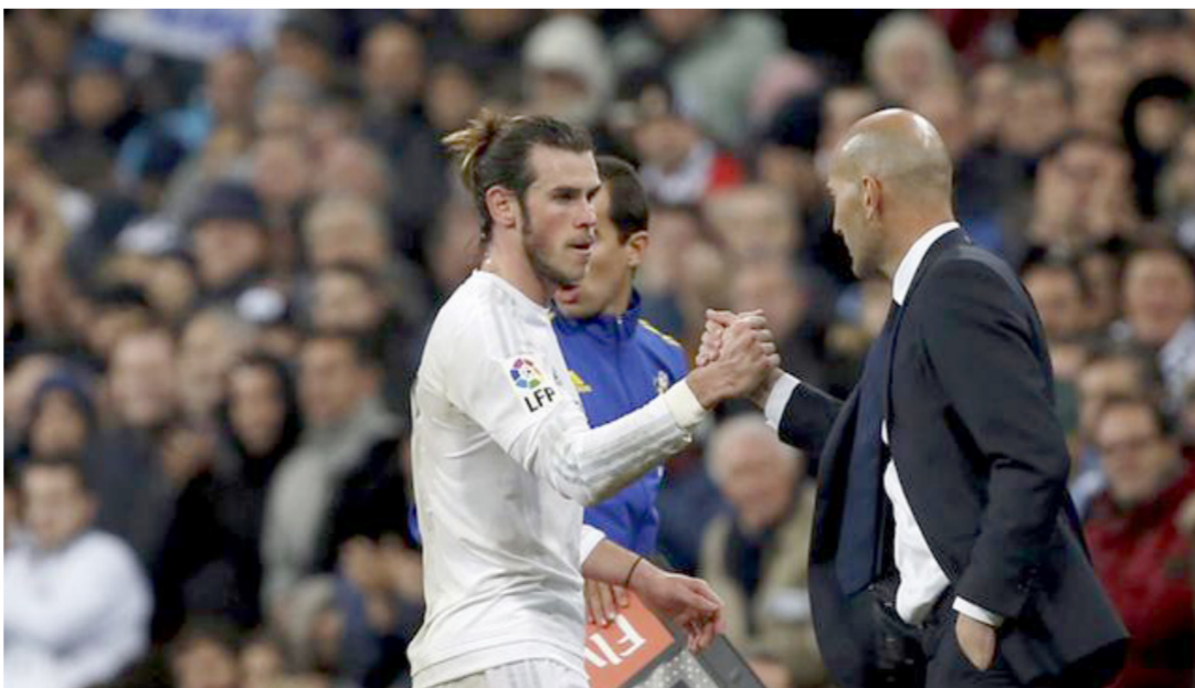
زيدان. طموحات التفوق مع ريال

«المولينون»، معقل الفريق الصاعد حديثاً لأضواء الليغا، بمثابة الفأل السيء لبدأية فترة من الانتاج السيئة خلال الأشهر الماضية تحت