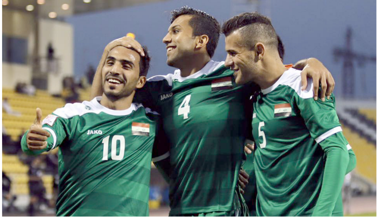
فرحة لاعبي الأولمبي بالفوز في المباراة الأولى