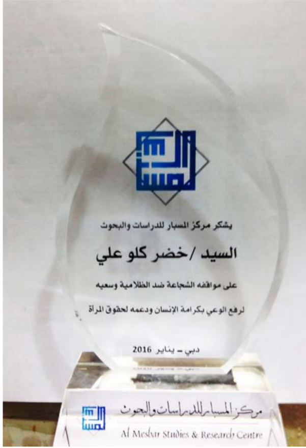
درع مركز المسبار للدراسات والبحوث

وكان العبادي وصل، يوم الأول من امس الخميس، إلى محافظة ديالى وعقد فور وصوله اجتماعاً مع المحافظ مننى