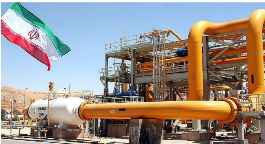
إحدى محطات تصدير النفط الإيرانية

حاددة في التكاليف النفطية. وأضاف «المهم هو النظر إلى معالم الانكماش للناتج المحلي الإجمالي... أمل أن يستمر بنك اليابان (المركزي) في سياسته التحفيزية الحالية» للوصول إلى معدله المستهدف للتضخم البالغ اثنين بالمئة. على صعيد الأسعار، سجلت أسعار النفط هبوطا جديدا في العقود الآجلة أمس في الوقت الذي تتربح فيه الأسواق زيادة الصادرات الإيرانية مع احتمال رفع العقوبات المفروضة على طهران خلال أيام. ويتجه مزيج برنت والخام الأميركي نحو تحقيق ثالث خسارة أسبوعية على التوالي والهبوط حوالي 20 بالمئة عن أعلى مستوياتها هذا العام. وقد تصدر الوكالة الدولية للطاقة الذرية تقريرها بشأن امتثال إيران لاتفاق الخاص بتقليص برنامجها