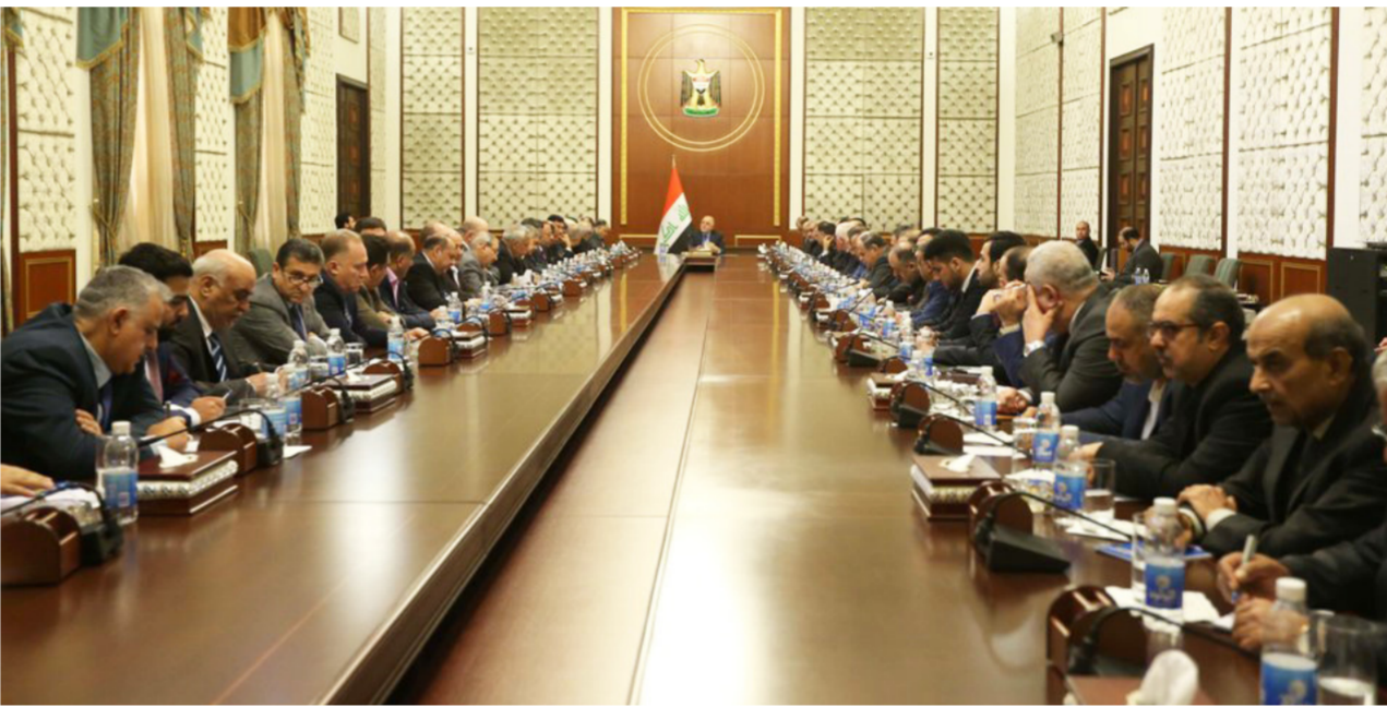
جانب من لقاء العبادي مع رجال الأعمال

بغداد - محمد الرائد: كشف مستشار لرئيس الوزراء حيدر العبادي، أمس الأحد، عن خطة لمنح شركات القطاع الخاص إجازة فتح وحدات تنويع استثماراتهم مع معاملات المواطنين. لافتاً إلى تكليف لجنة حكومية بهذه المهمة التي قال إنها أجزت نحو 25% من أعمالها. وفيما توقع أن يلمس الشارع العراقي خلال النصف الثاني من العام الحالي تغييراً على هذا الصعيد، أفادت لجنة نيابية متخصصة بأن المواطن ووجوب الآلية الجديدة سيدفع رسوماً بسيطة لتتمام معاملته قد لا تتخطى الدولارين.