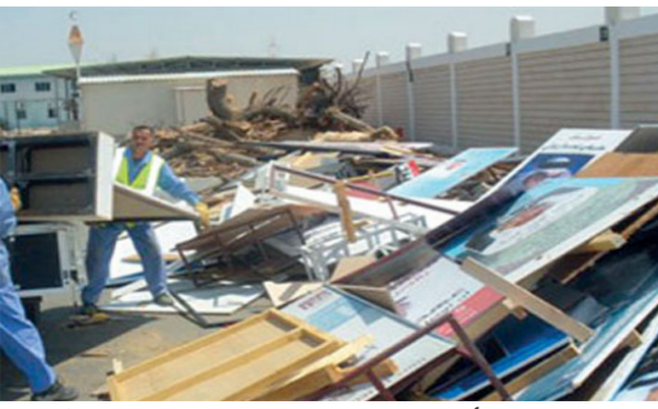
أمانة بغداد تزيل اللوحات الاعلانية العشوائية

بغداد - الصباح الجديد: أعلنت أمانة بغداد، أمس السبت، عن اتخاذها قرار بمنع نصب جميع اللوحات الاعلانية العشوائية، وفيما بينت انها ستقوم بازالتها، هدت الخالفين بإجراءات مشددة.