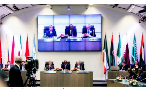
جانب من اجتماع أوبك في السعودية "داعش"

بغداد - الصباح الجديد: تراجع أسعار النفط الخام، أمس السبت، لليوم الخامس على التوالي وأهتت الأسبوع على خسارة عشرة بالمائة متأثرة باستمرار تخمة العروض العالمي وقائمة آفاق الطلب.