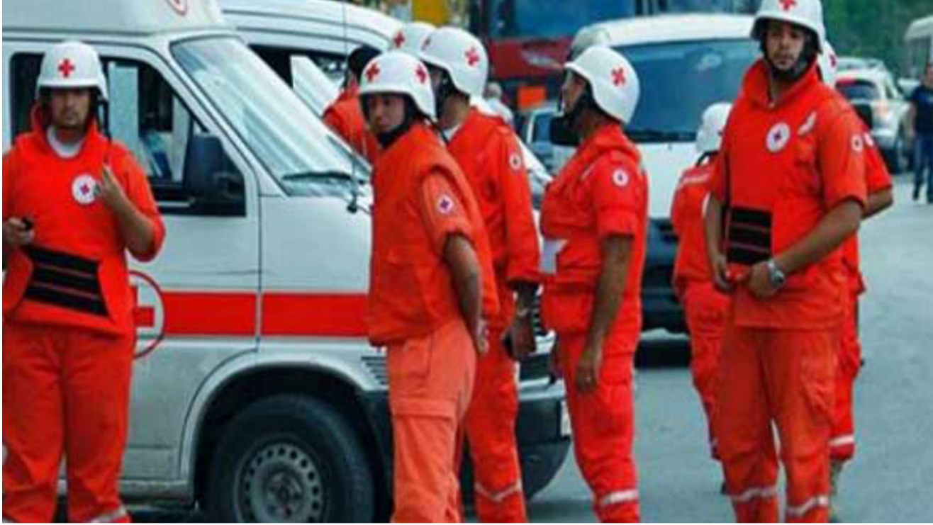
رجال الصليب الأحمر

ضخمة، مشيراً إلى أن العملية ستستكون مشتركة مع الأمم المتحدة والهلال الأحمر العربي السوري. وأعلنت منظمة "أطباء بلا حدود" أن حالات الوفاة الـ 23 هي فقط لمرضى في المركز الصحي المدعوم من المنظمة، بينما يؤكد الأهالي أن عدد الوفيات ارتفع أمس إلى 35 حالة، مطالبة بإخلاء طبي فوري للمرضى، والسماح دون أي عوائق بدخول الإمدادات الأساسية المطلوبة لإنقاذ حياة المدنيين بمدينة مضيا.