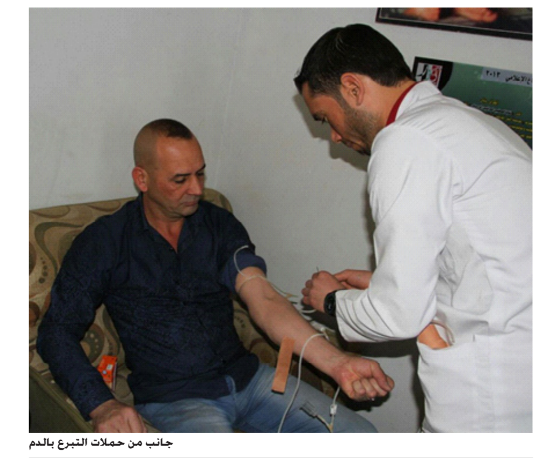
جانب من حملات التبرع بالدم