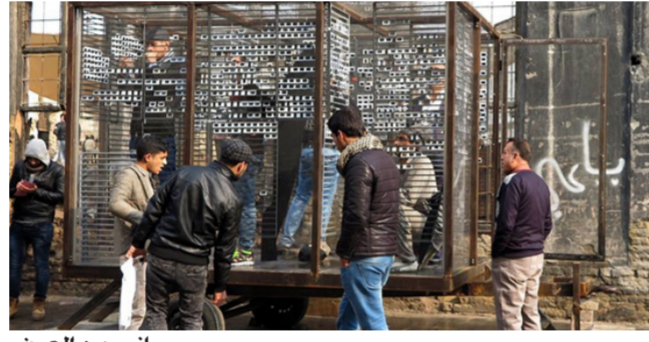
جانب من العرض

جديد للشرائح حسب تصوراتهم بما يكون بالناسي مجموعة فنية جديدة في كل مكان يتم استكمال مجموعة الشرائح بمواقع مكانية محددة لتنشأ مجموعة فنية عامة جديدة. من خلال تصميمها "Public Collection" تشكل المجموعة العامة المثبتة في المكعب الشفاف نتاجا يجمع بين الفضاء العام والفضاء المركب. بين المنتج والتلقي. وكذلك بين الفن ووسائله. وبهذا تنسجم "Public Collection" المجموعة العامة مع الفضاء العام ككل وتشكل بذلك مكانا جديدا يجسد الفن بصيغة جديدة. وبينت البصرية الألمانية. يُعد عرض الشرائح اليوم بمثابة حامل