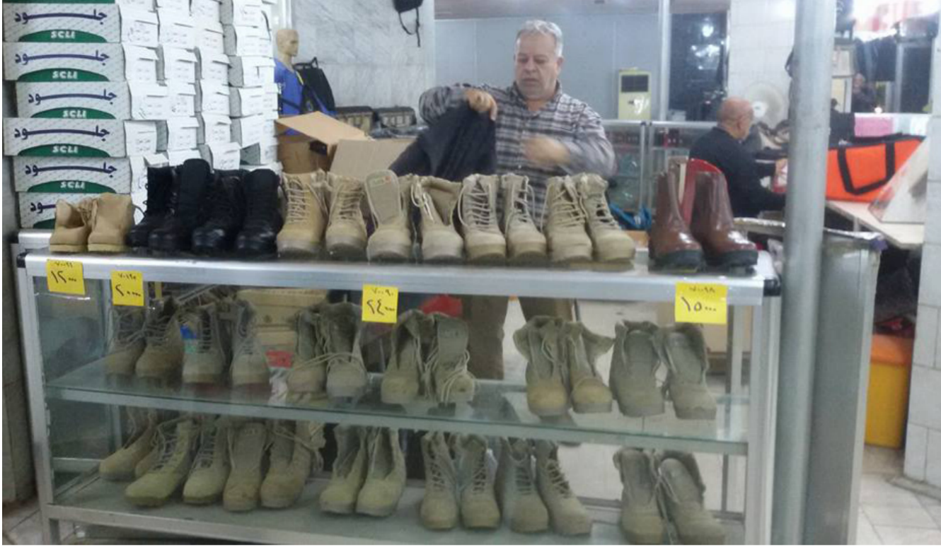
المقر العام لبيع الجلود

هذه النسبة لن تتمكن الوزارة من تحقيق نسب اجاز فعلية لمشاريها خلال العام الحالي وستبقى متوقفة فضلا عن عزوف المهجرين وشركات القطاعين العام والخاص من التعاون معها مستقبلا وتوقيع عقود جديدة . يذكر ان وزارة المالية خصصت لوزارة الصناعة والمعادن وعلى الخطة الاستثمارية لعام 2015 مبلغا قدره ( 110 ) مليارات دينار لم يتم تسلمه خذ الان.