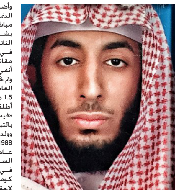
قاطع الرؤوس محمد إمامي

أثار إمامي انتباه الأجهزة الأمنية ما بين عامي 2009 و2010، عندما بدأ