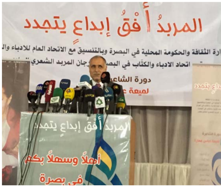
جانب من مهرجان سابق