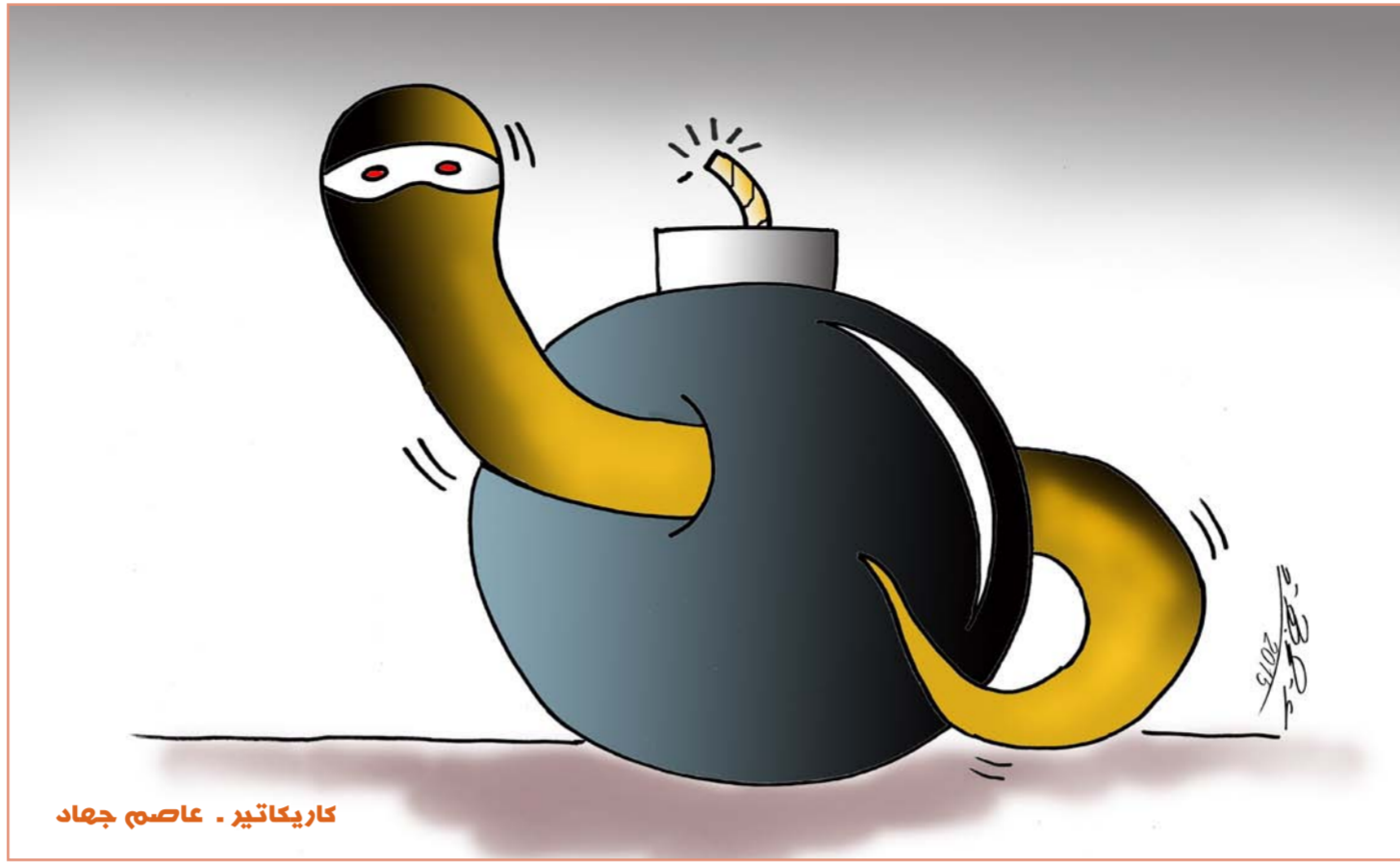
كاركاتير - عاصم جهاد

وتتيح الشبكة الاجتماعية أصلا لمستخدميها تحديد الوضع العاطفي لهم إذ بإمكانهم الاعلان عما إذا كانوا «عازبين» أو يعيشون كـ«ثنائي» أو أنهم في علاقة «معقدة» أو حتى في حالات «الطلاق» أو «الانفصال».