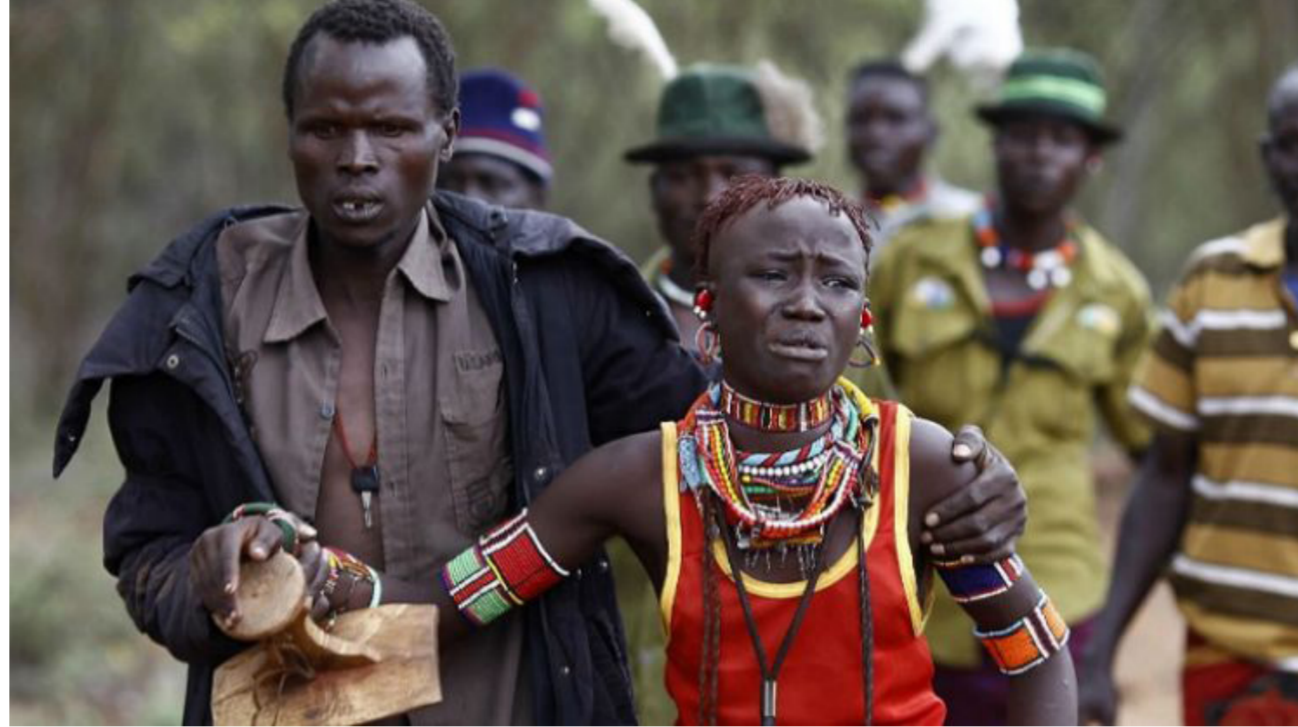
الزواج القسري في أفريقيا

«غرلز نوت براديس» (فتيات لا زوجات) التي تضم 450 منظمة من المجتمع المدني من 70 دولة، فإن نحو 10 بالمائة من النساء في العالم يتزوجن قبل سن الـ18. وبحسب منظمة اليونيسيف فإن الدول الأكثر تضرراً من هذه الظاهرة هي كل من بنغلاديش والهند والنيجر، حيث شهدت تزويج 244 ألف فتاة قاصر قبل سن الـ18، أي بمعدل ثلاث من أصل أربع فتيات حسب المصدر نفسه. وبحسب موسي صديقو عضو خالف منظمات حقوق الأطفال النيجيرية فإن «الأطفال الذين لا يذهبون إلى المدرسة، والفقر والجهل والتقاليد هي العوامل الرئيسية» المساعدة على تكرر ظاهرة تزويج المقاصرات. ويوجه الانتقاد بالأساس إلى عيوب الأنظمة التعليمية، لكن توعية المجتمعات شرط مسبق لنشر الوعي بخطورة الظاهرة، كما يوضح صديقو.