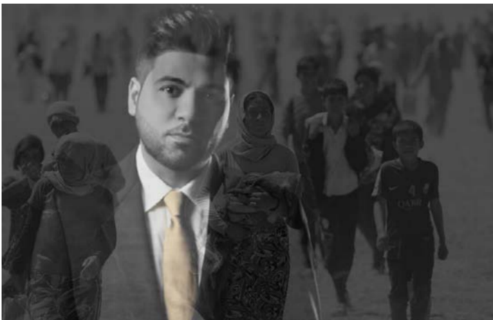
لقطة من كليب "مشينا"

وفضل وليد الشامي أن يطلق "مشينا" التي حملت كلمة ولغنا كلاسيكياً، ضمن رسالة إنسانية من أجل تسليط الضوء على هذه القضايا التي خنّج إلى وقفة ونظرة إنسانية من أجل الحد منها، مؤكداً أن الفن رسالة يجب أن تستخدم في خدمة المجتمعات في كل مكان، وهي