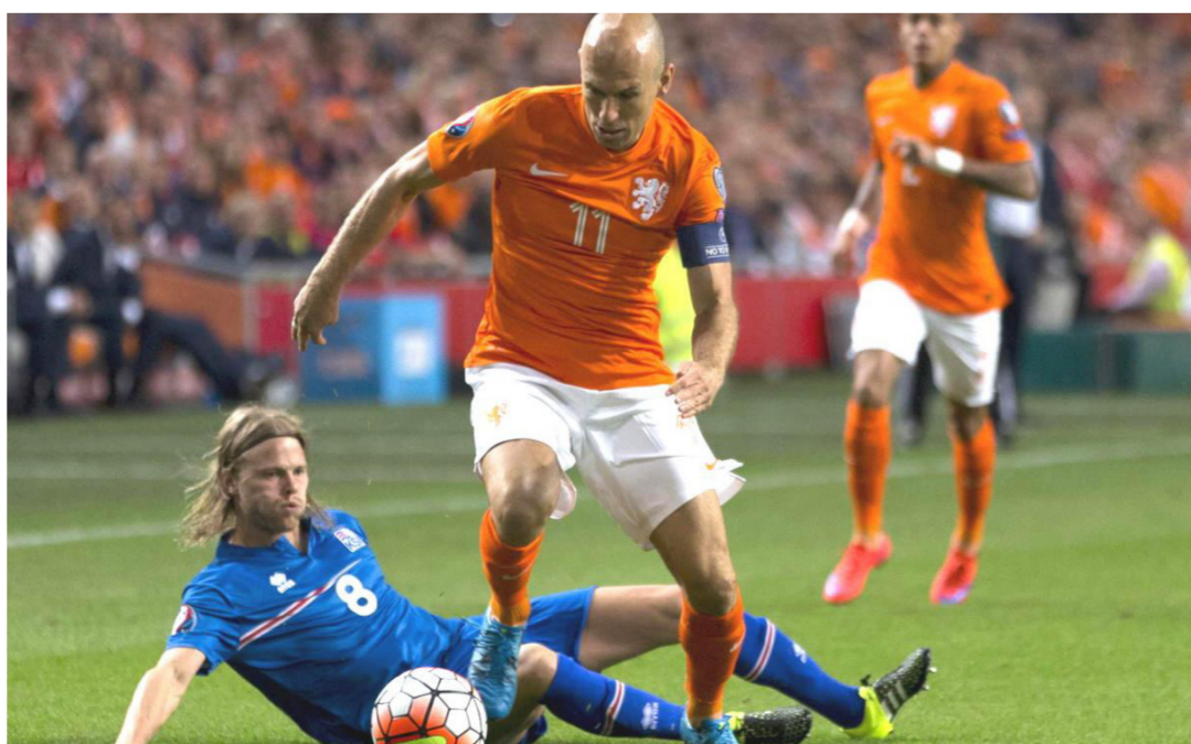
لقطة من منافسات أم أوروبا "أرشياف"