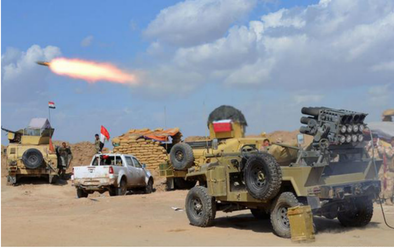
عناصر من الجيش العراقي

مقر الطاقة الحرارية قرب جسر الفتحة». ويعقد قضاء الشرجاط منطقة مهمة من الناحية الجغرافية، لأنه يتوسط ثلاث محافظات، حيث يقع على بعد (115 كم) جنوب محافظة نينوى، وعلى بعد (125 كم) شمال تكريت مركز محافظة صلاح الدين، وعلى بعد (135 كم) غرب محافظة كركوك.