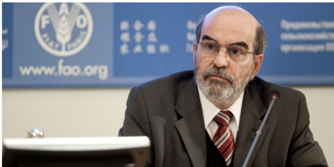
جوزيه غرازياتانو دا سيلفا

وأصبحت رسالتنا ذات مغزى أكثر من أي وقت مضى»، وأشار خديداً إلى «الهدف العالمي الجديد للقضاء المبرم على الجوع بحلول عام 2030، الذي اعتمده المجتمع الدولي في أيلول الماضي». ورأى أن المنظمة «أثبتت قدرتها على التكيف مع المتغيرات العالمية، والاستجابة للتحديات المستجدة». وأبدى حزناً وصدمة إزاء الهجمات الإرهابية الأخيرة، التي «وقعت في باريس وبيروت وأصبحت جميعاً في أنحاء العالم». معلناً «التضامن مع جميع الضحايا وأفراد عائلاتهم».