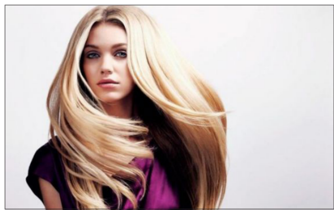
الرجم من أنه يتميز بسعوره الباهظ. لذا يمكنك استبداله بصودا الخبز كل ما عليك فعله

هو وضع صودا الخبز على فروه رأسك دلكها بلطف وبحركات دائرية. ثم اغسله كالعادي. 3 - تنظيف فرشاة الشعر الخاصة بك: إذا أغسنت النظرة في فرشاةك الخاصة. ستجدين تراكم الأثرية على قاعدة الفرشاة. فضلا عن البكتيريا والفطريات التي لا ترى بالعين المجردة. فبدلا من التخلص من الفرشاة وشراء واحدة جديدة كل بضعة أشهر. فإن كل ما عليك فعله هو وضع الفرشاة في إناء مليء بالماء الدافئ مع ملعقة صغيرة من صودا الخبز. واتركيها لمدة ثلاث ساعات. ثم اشطفيها. واتركيها حتى تجف. وستجدينها نظيفة تمامًا.