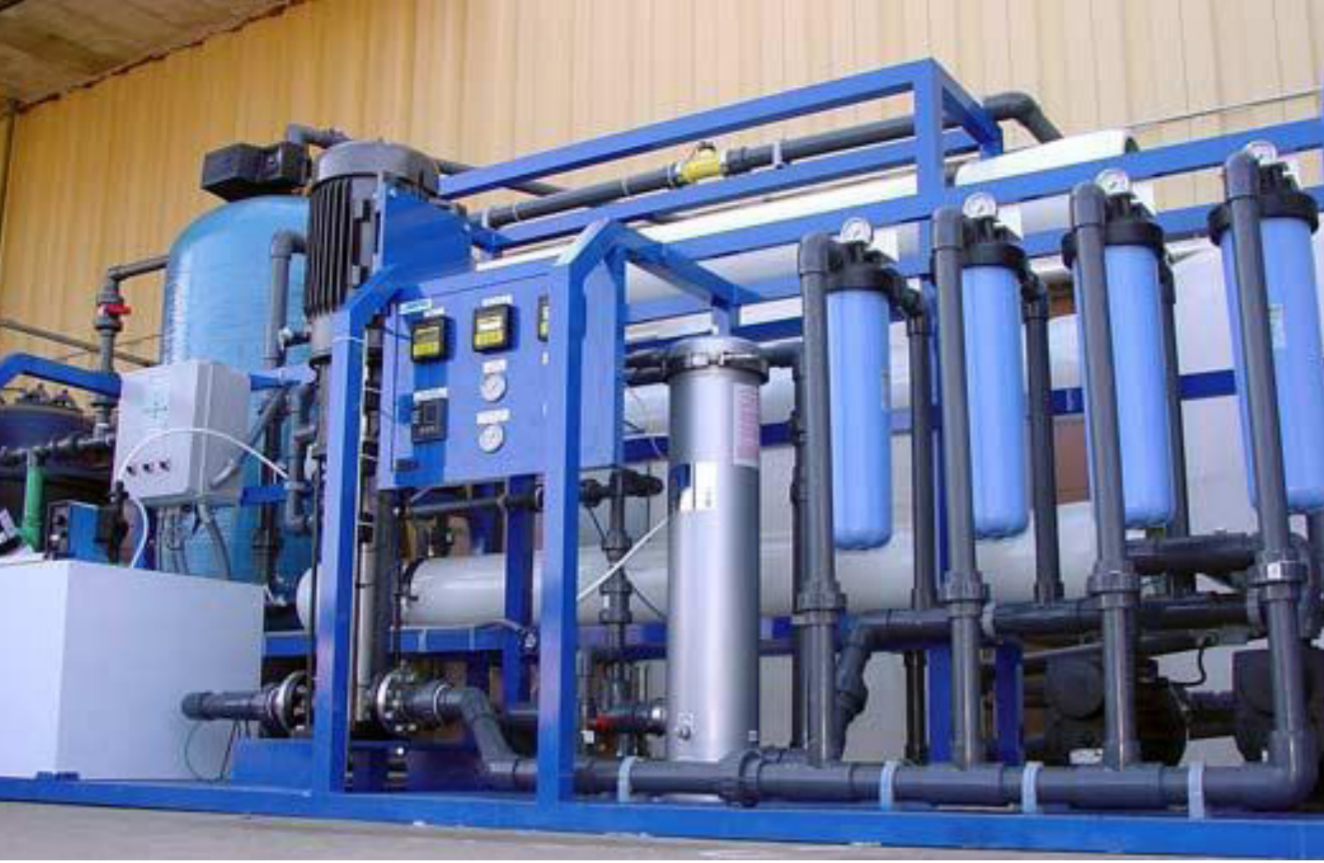
احدى مشاريع خلية المياه

مضاعفة الجهود لتقديم أفضل الخدمات للمواطنين عن طريق تنظيف وتأهيل محطات وشبكات الصرف الصحي وتأهيل الشوارع الفرعية للأحياء والأقضية مع الاهتمام بالخدمات المقدمة للنازحين وماتزال الوزارة مستمرة بتقديم الجهود والتي من شأنها خدمة عدد كبير من المواطنين في عموم أنحاء البلاد.