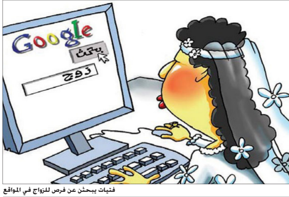
فتيات يبحثن عن فرص للزواج في المواقع

إعداد - سهر علي: في عصر انتشار وسائل التواصل الحديثة التي تمتاز باختصار المسافات والاستعانة بأجهزة ذكية لاختصار الوقت والتواصل بأقرب وقت ممكن وتلبية جميع احتياجاتنا .. بات من الصعب الاستغناء عن هذه الأمور في شتى مناحي الحياة. وقد تأثرت بهذه التكنولوجيا وأسهمت في إيجادها بصورة أسرع بغض النظر عن النتائج وهي قضية «الخطابة» أو البحث عن الزوج أو الزوجة. ففي الزمن البعيد لم يكن التعارف بين العريس والعروس إلا في يوم الزفاف. يحكم العادات والتقاليد التي كانت سائدة وما تزال موجودة عند بعض العائلات المحافظة على هذه التقاليد. وتطور الأمر إلى الرؤية الشرعية التي تسمح للرجل والمرأة بالتجاور مع بعضهما ومعرفة الآخر من خلال جلوسهم أمام العائلة قبل ختال في أمر الموافقة من الرضا. وبعد ذلك اختلفت العادات والتقاليد وأصبح هناك انفتاح بين الحضارات العربية والغربية. والتي أدى إلى نسخ بعض العادات الغربية إلى مجتمعنا فأصبح الشباب والفتاة يجلسون مرة أو أكثر معا خارج المنزل للتعرف أكثر على بعضهم البعض في مدة تنبع مرحلة «الخطابة» والتي تنسب في مرحلة «وثيق عقد الزواج» في المحكمة. وكان اختيار الزوج لزوجته في