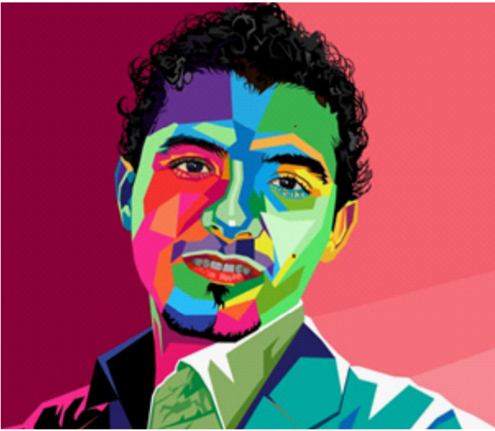
نهار حسب الله

أنفاسي مراقباً مجريات المعركة بصمت ثقيل متحملاً قساوة الجثث التي ترمي على جسدي بين لحظة وأخرى.. أفرغت ساحة المعركة من الجنود البسطاء وسيطر للملكان وحاشيتهما على الأرض.. تقابلا وجهاً لوجه بمواجهة تاريخية لم اشهدها من قبل.. مواجهة حاسمة دامية تحاصرة احدهما والاطحاه به.. انتظرت لحظة نطق (كش ملك) من أحد الطرفين.. غير انهما قالا بصوت مسموع (كش يا شعب) وتعانقا عنق الاحبة. وشربا نخب النصر من بقايا الدم المنهمر على البلاط... واختنقا بضحكة لم اسمع لها مثيلاً..