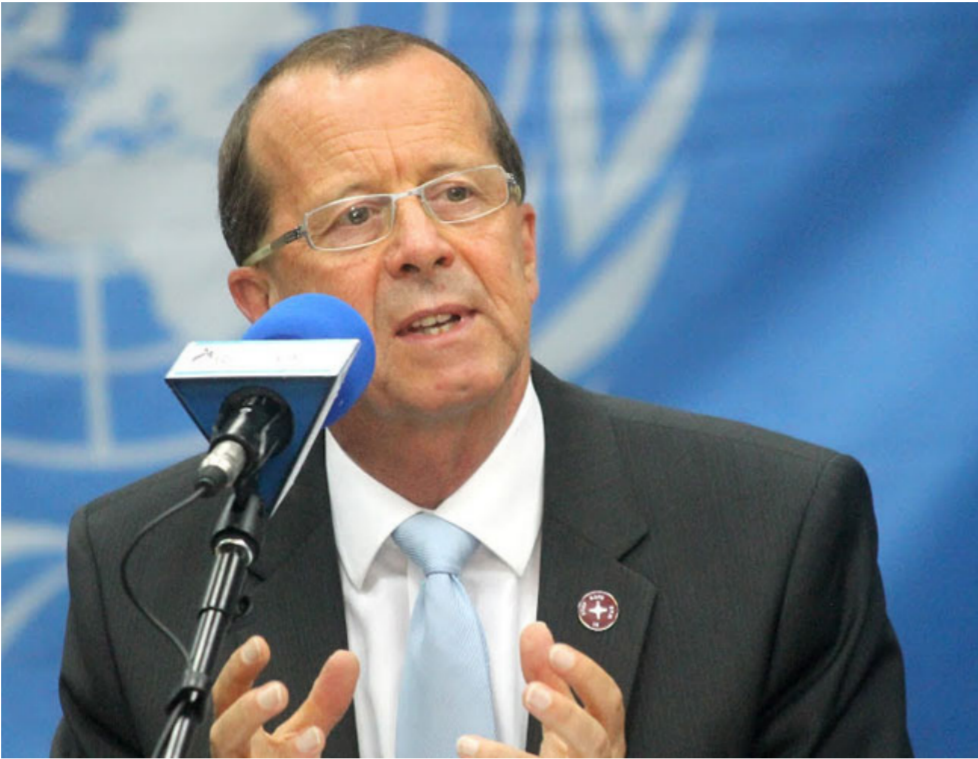
مهمة صعبة أمام المبعوث الدولي الى ليبيا

الإرهابية، فقد أوردت تقارير ، بافتحام ميليشيا المعاولة لمدينة الخمس شرقي طرابلس بعدد من الآليات المسلحة، حيث قامت بحاصرة مكتب الجريدة، كما أن الحال ماثلة في سرت، حيث تشهد المدينة نزوحاً لعشرات العائلات هرباً من سطوة مسلحي داعش، التي تسيطر على المدينة، وتكاد العائلات الظروف المعيشية والقاسية وحالة من الانفلات الأمني والاعتقالات التعسفية في صفوف الميليشيات الأخرى في المدينة، ويؤكد ذلك المشهد القلق الدولي من فنشيل الميليشيات، وعدم رغبتها في التفاوض والحوار مع أي من الأطراف الليبية الأخرى، كما يؤكد الإخفاقات من جانب ميليشيات طرابلس لتشكيل أي حكومة انتقالية ليبية تمارس عملها في طرابلس في ظل انتشار هذه العصابات الإجرامية بسبب الطامع الشخصية، أن حالة الفوضى العارمة بين الميليشيات وتصارع المصالح الشخصية، التي تغلو على المصالح الوطنية أغرقت طرابلس بأهلها، وهو ما يعقد مهمة كوبلر، يذكر أن مارتن كوبلر الذي يبلغ من العمر 62 عاماً كان سفيراً لألمانيا في كل من العراق ومصر وهو يرأس منذ عامين بعثة الأمم المتحدة في الكونغو، وعمل كوبلر في عام 2010 بصفة مساعد المبعوث الدولي إلى أفغانستان قبل أن يعين مبعوثاً خاصاً إلى العراق بين عامي 2011 و2013.