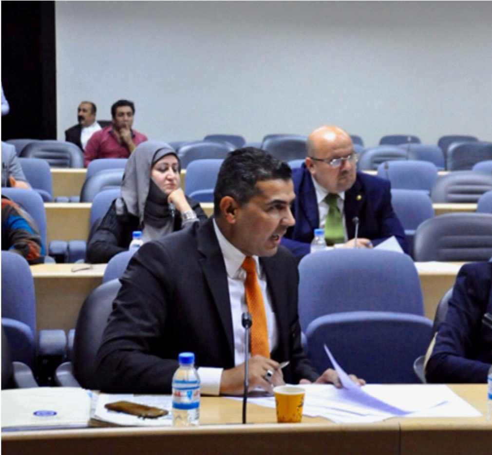
جانب من الجلسة

انطلقت في مجلس النواب الجلسات المشتركة الخاصة لمناقشة التشريعات الإعلامية والمواد القانونية التي تناول الإعلام والصحافة وحرية التعبير في قوانين العقوبات والمطبوعات ومشروع جرائم المعلوماتية ومشروع حرية التعبير والتظاهر والنشر . بمشاركة لجان الثقافة والإعلام وحقوق الانسان النيابية ووزارة الداخلية ومختصين قانونيين ومفوضية حقوق الانسان ومنظمة اليونسكو والنيابات والمنظمات الصحفية والإعلامية وإحاثين صحفيين وإعلاميين ومنظمة دعم الاعلام الدولي . وتنفذ جلسات البرنامج منظمة برح بايل للتطوير الاعلامي . وبينت المديرية التنفيذية لمؤسسة برح بايل للتطوير الاعلامي ذكرى سريسم في بداية افتتاح الجلسات وبدا الجلسة الأولى ان برنامج عمل مشترك مع لجنة الثقافة والإعلام النيابية يتكون من 1 جلسات بدأت بالمناقشات والمحاضرات يشارك فيها اساتذة مختصون في التشريعات الاعلامية لبلورة رؤية علمية لمنظومة تشريعية ناجحة تشكل مرجعا تشريعيًا وقانونيا لعمل وسائل الاعلام وتجسد مبادئ حرية التعبير والصحافة . كما تساهم في تنظيم عمل وسائل الاعلام وأجهزة الدولة وفق معايير مهنية مسؤولة تمكن وسائل الاعلام وأجهزة الدولة من خلق بيئة اعلامية شفافة وقابلة للتطور عبر مراجعة التشريعات السابقة . وتقديم رؤية واضحة لاستحداث