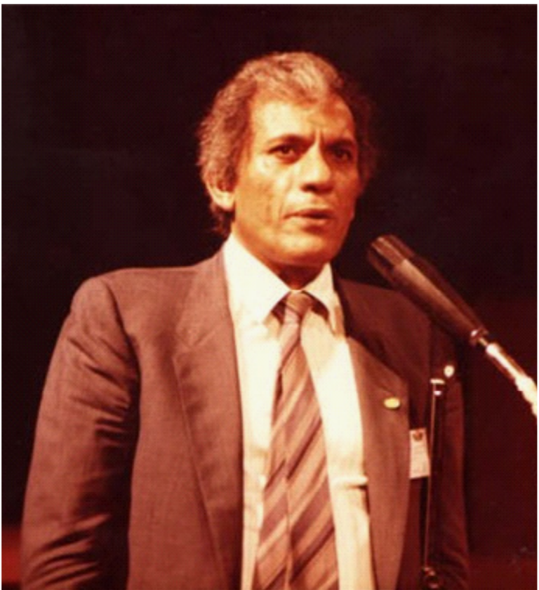
الراحل عبد الواحد

وجه أخرى. لم تعم عينيه عن أجازات عبد الناصر. عارض السادات. وكرهه الكره كله. وله موقف مشهود من اتفاقية كامب ديفيد. سيئة الصيت. احب العراق والعراقيين. وكتب ضد شيوخ الدين السلفيين. الذين كفروا طائفة كبيرة من العراقيين على خلفية انتمائهم المذهبي. ولا يخفى على أحد رسالته الجميلة والمعبرة الى الأزهر الشريف. والتي اذان فيها. أيأ إدانة. موقف بعض رجال الدين الأزهريين المؤسّف من شيعة العراق. وما تعرضوا له من وبيلات الارهاب. يتعرضون. ابدء الراجل الكبير في كل ما كتبه. وليس ادل على ذلك من كتاباته عن طرائق صنع السجاد. التي درسها دراسة مستفيضة. واجداً بين صانع السجاد الماهر. وبين الروائي محمد وشائج. وصلات قري. رحل الغيطاني جمال. فلتترد روحه بسلام.