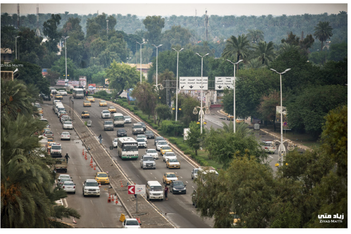
زياد متي ZIYAD MATI