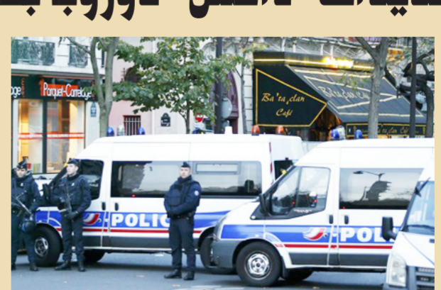
الإستنفار الأمني في فرنسا عقب التفجيرات الأخيرة

2015 في رحلته من امستردام الى باريس. بعد ان اطلق شباب يبلغ من العمر 26 عاماً من اصل مغربي النار على الركابي وهو يحمل رشاشاً ومسدساً وسلاحاً أبيض. الجديد في تدخل فرنسا وبريطانيا بتوجيه ضربات جوية ضد التنظيم في سوريا والعراق. حذرت المحابرات البريطانية يوم 29 أكتوبر 2015 من هجمات واسعة وجماعية لـ "داعش" من المنتظر أن يقع تنفيذها في بريطانيا بنحو قاتل واستعراضي.