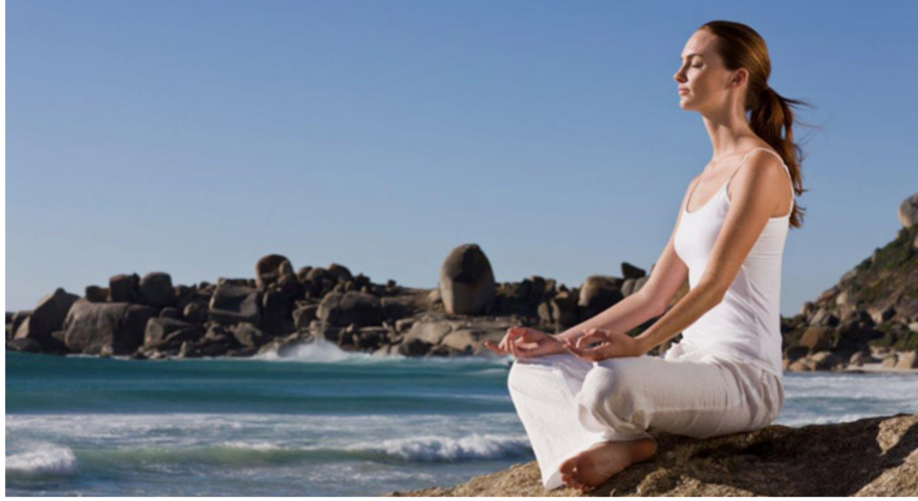
تأمل على الشاطئ

إغلاقها ليس بنحو كلي. لابد وأن يكون الفك واللسان في وضع الاسترخاء. 4. التنفس مهم وضروري في عملية التأمل. تنفس بعمق وهدوء، وبمجرد أن تبدأ في التأمل ستجد أن عملية التنفس تنعم ببطء وبعمق فور انصهار همومك. 5. من الأفضل أن تتم عملية التأمل في الصباح. أي في بداية اليوم لأن الملح يكون خالياً من أية أفكار. كما أن هذا التوقيت يساعدك على توليد الطاقة والسلام الداخلي الذي يمكنك من الاسترخاء ويجعلك منتجاً في يوم شاق عليك، ولا يشترط أن يكون المبدأ في الصباح الباكر لأن ذلك يعتمد على أسلوب حياة كل شخص. 6. ليس من المجبذ أن تتأمل وأنت تحت تأثير الكحوليات أو أي عقار من العقاقير أو عندما تكون مثلاً. 7. اعطي الفرصة لنفسك لكي تمارس التأمل مرة أو مرتين في اليوم الواحد على أن تستغرق كل مرة من 20 - 30 دقيقة. 8. بعد الانتهاء من التأمل لا تعود فجأة إلى نشاطك اليومي. 9. عليك بفتح عينيك والقاء نظرة على الأشياء التي تحيط بك أي لابد وأن تتكيف أولاً مع كل شيء من حولك. والعودة بنفسك إلى تذكر مهام الحياة اليومية. 10. يمكن فتح العين أو إغلاقها اختر الوضع الأكثر راحة لك. ولكن إذا شعرت بالنعاس عند غلق العين عليك بفتحها وأن تتجول بها فيما حولك لبضعة دقائق وعندما تنتبه ويعود إليك الوعي والرأس متعامدة على الكتفين. كلما كان العمود الفقري في وضع مستقيم كلما تمت عملية التنفس بسهولة أكثر وكلما انتظمت الدورة الدموية. من الممكن إمالة الرأس قليلاً إلى الأمام لإعطاء المزيد من الاسترخاء. مع ارتكاز اليدين على الركبتين. 3. يمكن فتح العين أو إغلاقها اختر الوضع الأكثر راحة لك. ولكن إذا شعرت بالنعاس عند غلق العين عليك بفتحها وأن تتجول بها فيما حولك لبضعة دقائق وعندما تنتبه ويعود إليك الوعي