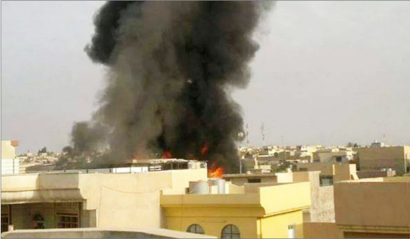
آثار احدي غارات القصف الجوي على الموصل