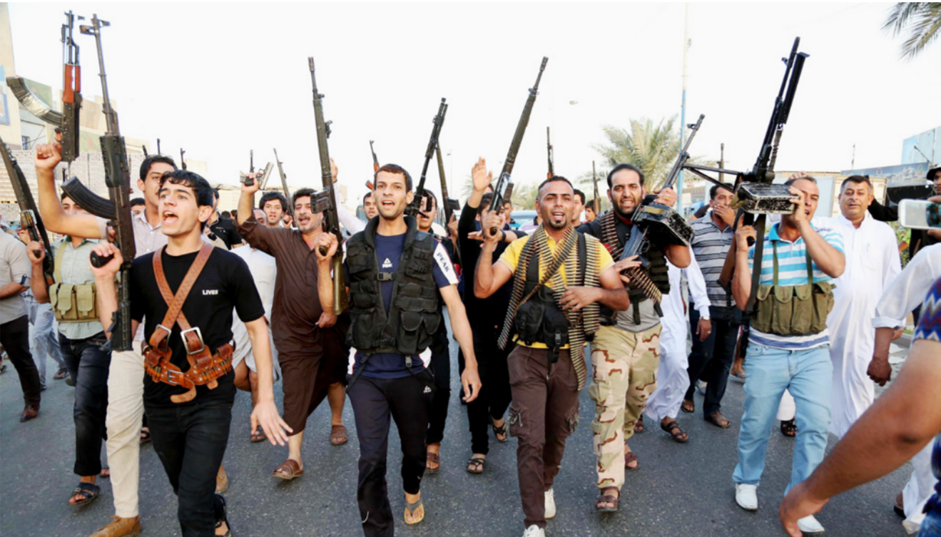
مقاتلون من عشائر شروين في بعقوبة