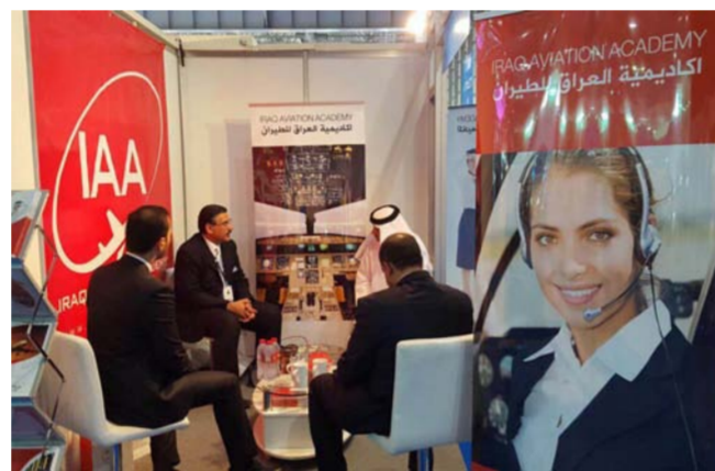
جانت من المعرض

مفتوح لهم أفقاً جديدة ومستقبلاً مشرقاً في عالم الطيران". وتشارك في هذا المعرض الذي يعد من أكبر معارض صناعة الطيران في العالم أكثر من 1100 شركة، في حين تشير التوقعات إلى ارتفاع عدد الزوار بنسبة 7% ليصل إلى 65 ألف زائر. الجدير بالذكر أن أكاديمية العراق للطيران تمتلك أسطولاً حديثاً من الطائرات المخصصة للتدريب ومن المؤمل أن تخرج الأكاديمية طيارين وضباط عمليات ومضيفين وملاكات هندسية وفنية متخصصة بصيانة الطائرات.