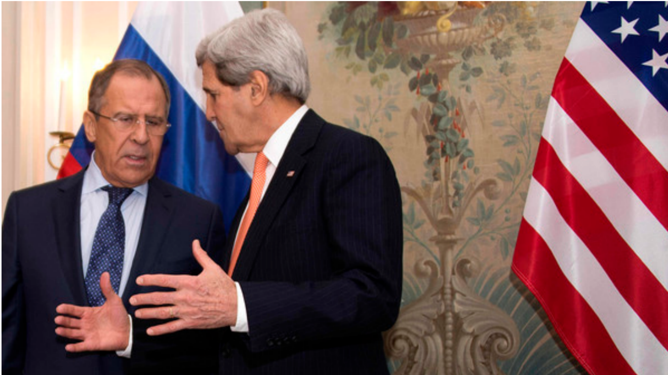
اختلافات روسية - أميركية بشأن مستقبل سوريا

الرفق المرتقب لأسعار الفائدة في الولايات المتحدة، واستعادة التوازن في الصين فسيفاقش القادة أيضا الحرب على الإرهاب وضد تنظيم «الدولة الإسلامية» الذي أصبح يشكل خطرا يهدد الأمن العالمي. بالإضافة إلى أزمة اللاجئين. ويسعى قادة الدول من قمة مجموعة العشرين، التي تأسست عام 1999، إلى بلورة الأفكار وإيجاد الحلول التي تقضي على تلك المشاكل وحل دون استمرارها. وقال مسؤولون إنها المرة الثانية التي تبحث فيها مجموعة العشرين مشكلات خارج نطاق اهتمامها الرئيسي المتمثل في تنسيق السياسة الاقتصادية العالمية.