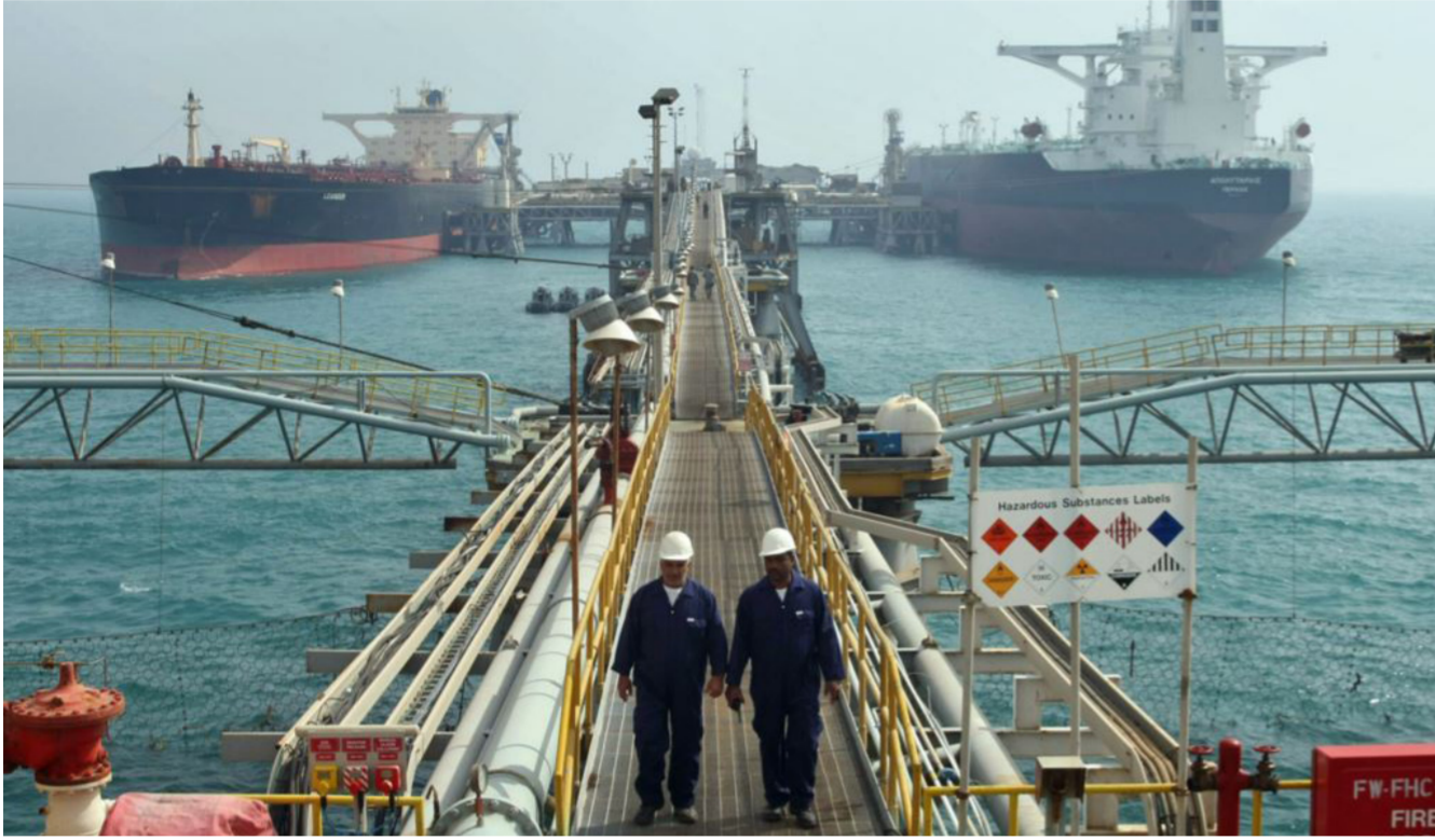
احد الموانئ النفطية في البلاد

تتمكش إمدادات المعروض من خارج أوبك بأكثر من 600 ألف برميل يوميا في العام المقبل. ورفضت الوكالة تقديراتها للطلب على نفط أوبك في 2016 بمقدار 200 ألف برميل يوميا إلى 31.3 مليون.