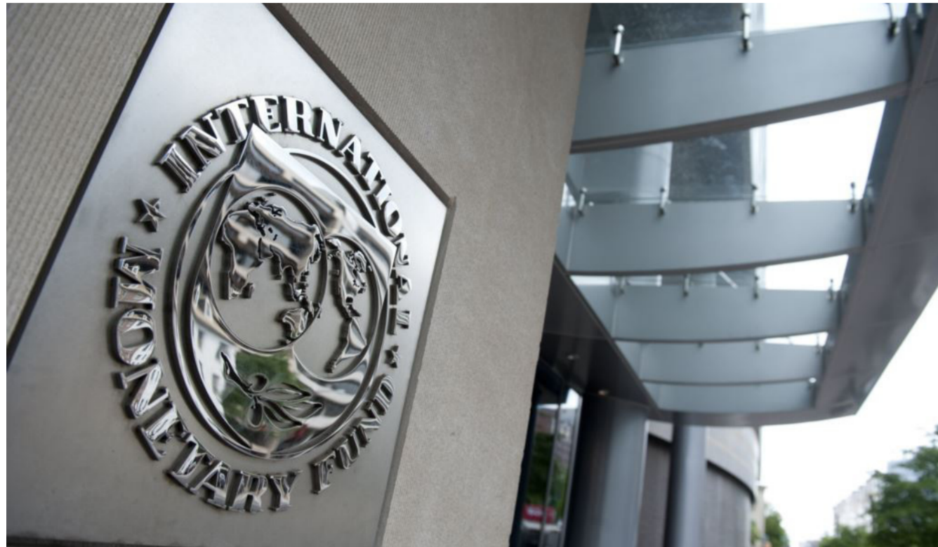
مبنى صندوق النقد الدولي