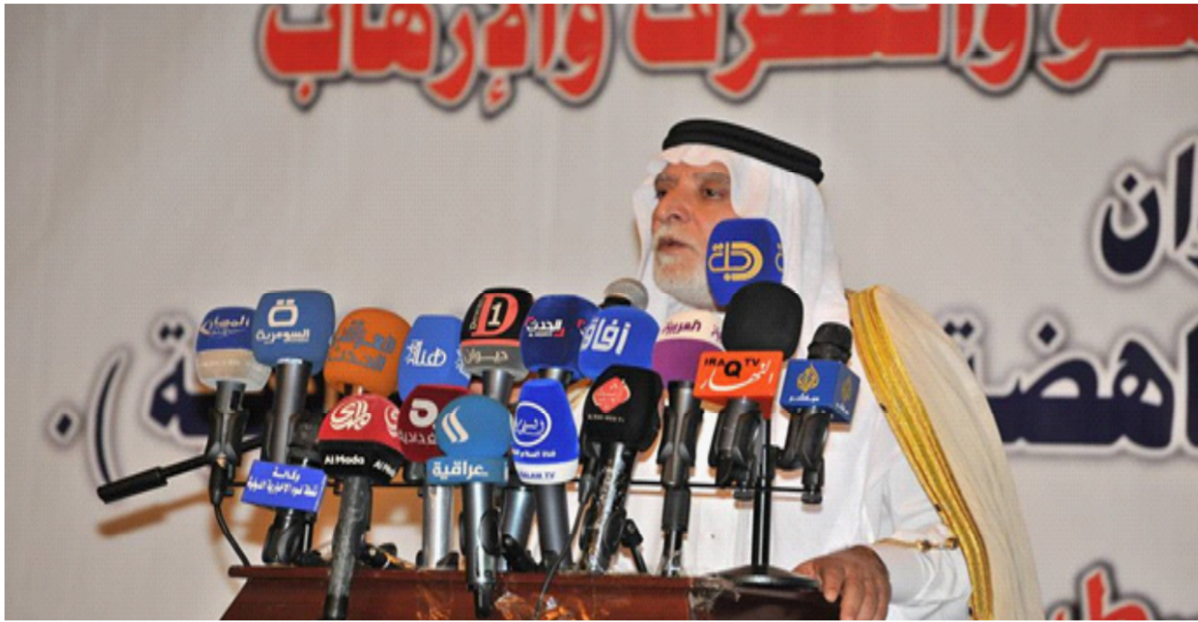
رئيس ديوان الوقف السني يختتم المؤتمر العلمي الثاني لمناهضة الارهاب

الجمعة الذي أفرح مشرق أن جهود ديوان الوقف السني البذولة في أغانة الناظرين واضحة للعبان، مبينة أن زيارتها المتكررة إلى الناظرين في عدد من المناطق يتم توجيه الشكر للديوان لتوفيره جميع متطلباته، متمنة الوقف المشرف للعلامة الدكتور عبد اللطيف الهميم لمبادراته الإنسانية المتكررة والتي كان آخرها فتح المساجد أمام الناظرين لياوتهم من الأمطار.