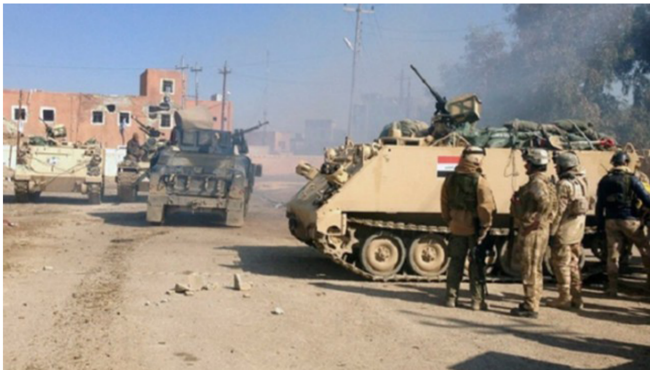
تقدم القوات الأمنية

عدد سكانها نحو ٢٠ ألف نسمة تقريبا. وتقع على الجهة الغربية من نهر دجلة. ويقابلها في الجهة الأخرى من النهر ناحية الزاب التابعة لقضاء الحويجة جنوب غربى محافظة كركوك. ويقطن الزوية عدد كبير من قبيلة «الجبور» التي تعد من القبائل العربية السننبة الكبرى في العراق. في حين يعمل أغلب أبنائها في سلك الشرطة والجيش العراقي.