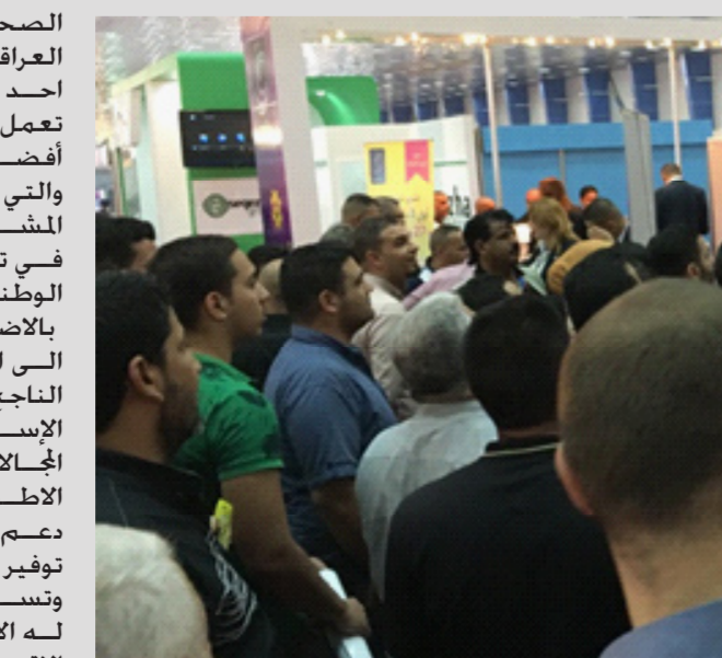
جانب من جناح زين العراق في معرض بغداد الدولي العراقي.

الصحفي بان خدمة المواطن العراقي بطريقة مبتكرة هو احد اهداف الشركة ولذلك تعمل بوتيرة متصاعدة لتقديم أفضل الخدمات للمشاركين والتي تعكس إيجاباً على تحسين المشترك من التواصل وتسهم في تسريع عجلة الاقتصاد الوطني.