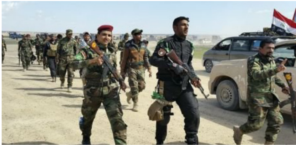
القوات الأمنية في الأنبار

بغداد- وعد الشمري: خاصر القوات الأمنية وفي مقدمتها جهاز مكافحة الإرهاب مقر قيادة عمليات الأنبار، وفيما أكد مسؤول في الحشد العشائري أن الاقتراب منه يجري على محوريين الشمالي والغربي، حذرت عن مفاجآت خملها الأيام المقبلة على صعيد معركة تحرير الرمادي. يأتي ذلك في وقت كشف شيخ عشيرة مقاتلة ضد تنظيم داعش عن تهديدات اطلقها الارهابيين باعدام اهالي الرمادي الذين لم ينزلوا الرايات البيض من فوق منازلهم جنباً للضربات الجوية.