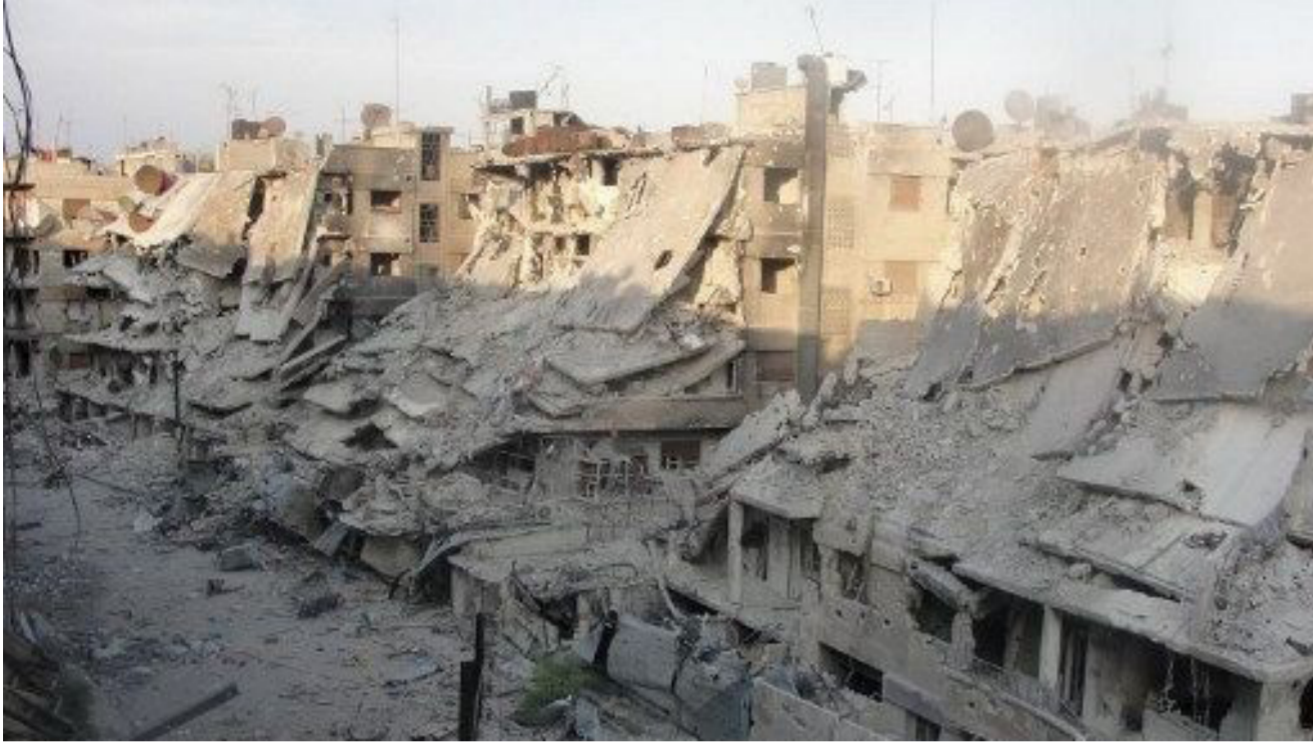
قدمت المسودة مقترحات لوقف الدمار في سوريا

أغلبية الأصوات وستتملك السلطة التنفيذية الكاملة. - يتولى رئيس سوريا المنتخب في انتخابات شعبية وظائف القائد العام للقوات المسلحة والسيطرة على الخدمات الخاصة والسياسة الخارجية. 8. عقد اجتماع لمجموعة دعم سوريا للمساعدة في إعداد المؤتمر ومعاونة الأطراف السورية خلال عملها في التوصل إلى اتفاق متبادل. ومن الممكن أن تشمل مجموعة دعم سوريا الأعضاء الخمسة الدائمين في مجلس الأمن والسعودية وتركيا وإيران ومصر والأردن وسلطنة عمان وقطر والإمارات والعراق ولبنان وألمانيا وإيطاليا والمبعوث الخاص للأمم المتحدة وجامعة الدول العربية ومنظمة التعاون الإسلامي والأخاد الأوروبي.