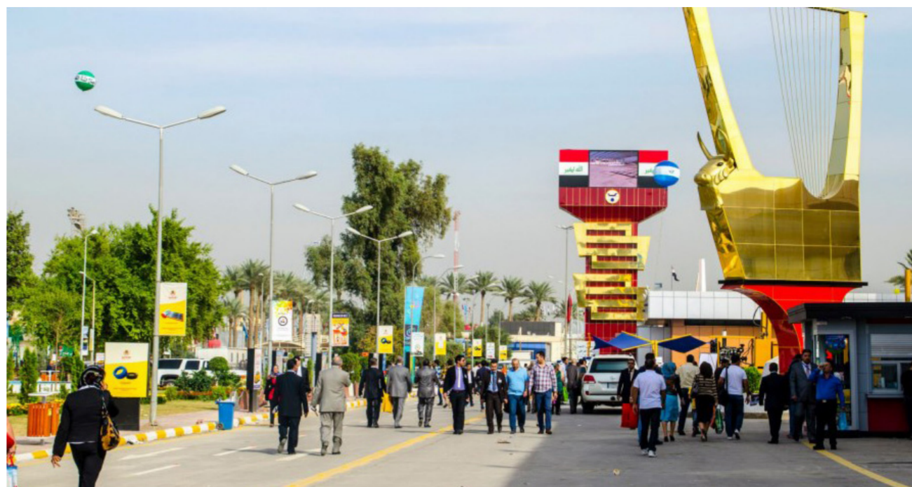
من أجواء المعرض

استعراض لبعض الدول تشمل فلكلورها الخاص. وأوضح ان المعرض شهد تفاعلاً جماهيرياً من خلال التواجد المستمر برغم الظروف المناخية حيث كانت هناك اجنحة خصصت للبيع المباشر لمنتجاتها لاقت استحسان المواطن العراقي. ويذكر ان المعرض بدأ فعاليته في الاول من تشرين الثاني الجاري إذ شهد اقبالا جماهيرياً واسعاً، وكان فرصة للشركات المشاركة لتحقيق الارباح عن طريق البيع المباشر والاستثمار مع القطاعين الخاص والعام، فضلاً عن كونه رسالة من الدول المشاركة لرغبتهم في مد جسور التعاون مع العراق.