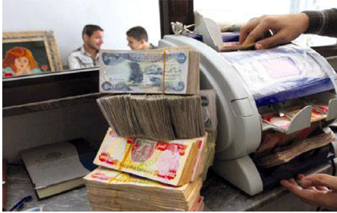
تعاملات مصرفية يومية

الأعمار والاستقرار إلى المناطق التي استعبدت من داعش و350 مليون دولار لمشروع طريق أم قصر - البصرة جنوبي البلاد». وأشارت الوزارة إلى أن الحكومة ستتحذ سلسلة من الإجراءات الإصلاحية في عدد من مرافق الاقتصاد لتفادي الهدر وترشيد الإنفاق.