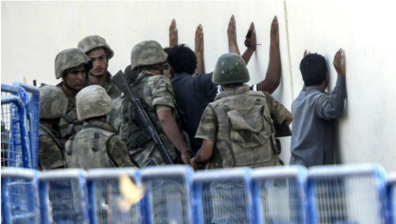
اعتقال مشتبه بهم في مطار اسطنبول

الأول الخميس أن سنبرلي أوغلو لم يستخدم تعبير «عملية (عسكرية) على الأرض» مضافاً أن «كل الخيارات قد تكون على جدول الأعمال». وشن الطيران التركي الأحد الماضي سلسلة من الغارات الجوية على أهداف لحزب العمال الكردستاني في جنوب شرق تركيا. حيث يمثل الأكراد غالبية السكان. وفي الجبال في شمال العراق. وحدثت مواجهات عنيفة في الأيام الماضية أيضاً بين المتمردين والقوات الأمنية التركية في عدة مدن تركية. أدت إلى مقتل جنديين على الأقل وأربعة مفاتلين أكراد.