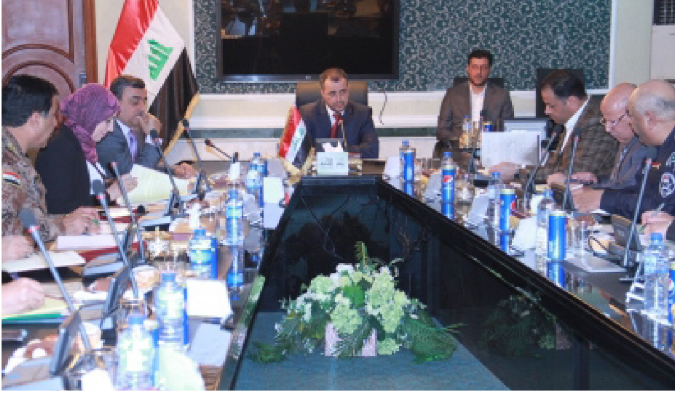
جانب من الاجتماع

بذكر ان نسبة الاجاز بلغت 33% وان الوزارة مستمرة في تنفيذ العديد من المشاريع في عموم البلاد للنهوض بالواقع العمراني والخدمي . كما أعلنت الوزارة ان الملاكات الهندسية والفنية في دائرة ماء كربلاء احدي تشكيلات الوزارة اجرت مشروع الخط الناقل لماء قرية ابو السواد في ناحية الخيرات بمحافظة كربلاء المقدسة . وقال المركز الاعلامي للوزارة ان «المشروع يعد من المشاريع المهمة في معالجة شحة المياه فضلا عن توفير الماء الصالح للشرب للمواطنين اذ تعد قرية ابو السواد من المناطق النائية وتضمن العمل مد انبوب ناقل بطول 2050م» .