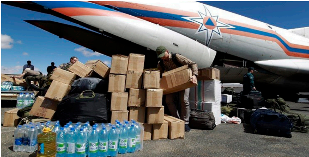
وصول المساعدات الروسية إلى اليمن

طفل يعاني من سوء التغذية. في حين حذر نقابة الأطباء من نفاذ المخاليل الطبية. كما يواجه الثناث الموت بسبب انعدام الادوية اللازمة لجلسات الغسيل التي تقدمها المستشفيات الحكومية. برنامج الغذاء العالمي كان تمكن من إيصال مساعدات غذائية لليوميين ونصف الليون شخص خلال الشهر الماضي. لكن أكثر من سبعة عشر مليون ينتظرون وصول هذه المساعدات أيضا.