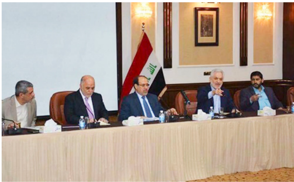
اجتماع سابق لدولة القانون

بغداد - وعد الشمري: أجاب رئيس الوزراء حيدر العبادي عن أسئلة ائتلاف دولة القانون عن دستورية القرارات المتخذة تحت مظلة الاصلاحات. لكن هذه الردود لم تلق قبولا لدى بعض اوساط كتلته التي تنهج وبحسب أحد نوابها إلى إجراءات جديدة عبر التحالف الوطني ومجلس النواب في إشارة إلى إمكانية سحب التفويض عنه. وهو ما أيدته تحالف القوى العراقية. لكن الائتلاف الوطني (الصدريون وكتلة المواطن) حذروا من خول هذا الملف إلى استهداف شخصي. وشهدت العلاقة بين العبادي وائتلافه توتراً عقب ما عد عدم تفعيل الحكومة للتحالف الرباعي وشارك روسيا في ضربات مواقع تنظيم داعش