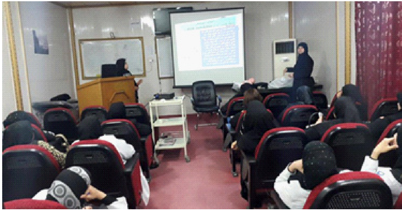
جانب من الندوة التي عقدها مستشفى الفيحاء العام بالبصرة

منذ الساعات الأولى بعد الولادة. بحيث تعزز الرضاعة العلاقة بينهما. كذلك تمنح الطفل المواد الغذائية التي يحتاجها لتقويته وحمايته. كذلك تعود الأثني الطفل وأمه على العملية الجديدة. يرضع الطفل قليلاً في الأيام الأولى. ولكن مع مرور الوقت فإنه يرضع وفقاً لاحتياجاته. ينبغي عدم إجباره على الرضاعة. ويجب عدم إرضاعه حليب الأم من الفئذية. لأن ذلك قد ينسب بعدم رغبته في الرضاعة. يتم وقف الرضاعة بعد فترة تتراوح بين ستة أشهر وحتى سنتين من الولادة. ويتم ذلك عندما يتوقف الطفل عن الشعور بالحاجة للرضاعة.