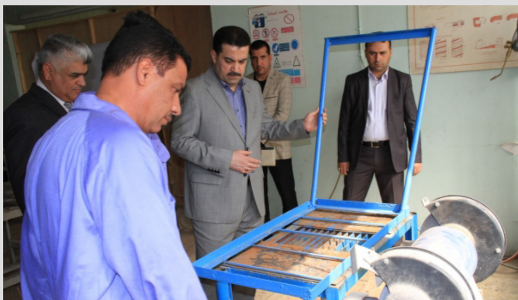
جانب من زيارة الوزير الى احد المراكز التدريبية

من الخطوات العملية التي تتبعها الوزارة في ظل الازمة المالية والتعاون مع المنظمات الدولية لتردد المركز باحتياجاته والاستفادة من خبرات الدول المتطورة في مجال التدريب فضلا عن الاهتمام بالمهنة الحديثة المعتمدة في العالم كنظام التدريب المبني على الكفاءة (CBT) الذي نفذته الوزارة ضمن برنامج تنمية المهارات وبرنامج (تعرف على عالم الاعمال) وبرنامج ابتكار الاعمال فضلا عن الاهتمام بالمهنة غير الشائعة كصيانة المصانع التي تعد من افضل المورثات التدريبية التي يتفدها المركز لما يتمتع به المدربون من خبرة واسعة في هذا المجال . وأشار السوداني الى ان الوزارة تعاونت مع العديد من المنظمات الدولية في مجال التدريب المهني