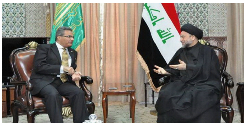
جانب من لقاء الموسوي مع السفير المصري