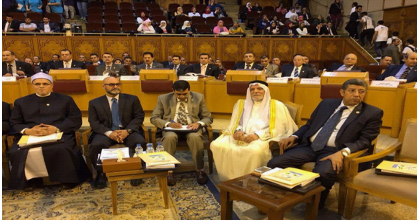
جانب من احدي مخازن الطحين

اجناسهم ليتعارفوا وأن التعايش في تاريخ الإسلام أدى إلى اعتناقه من العديد . مبيناً أن التعايش الإسلامي في المجتمعات يكون من خلال التعايش بين أهل الملة الواحدة والتعايش بين أهل الملة المختلفة. فضلاً عن التعايش بين الدول المختلفة سياسياً. من جهته رحب الأمين العام للمنتدى العالمي للوسطية المهندس مروان الفاعوري بجميع الحضور والمشاركين. مبيناً أن هذه الندوة أتت في وقت أليم تمر به الأمة الإسلامية، وأنها مقدمة لمؤتمر دولي سيعقد في مطلع العام المقبل بعنوان (خطر الصراع المذهبي)، بالتعاون مع ديوان الوقف السني العراقي ومنظمة التعاون الإسلامي.