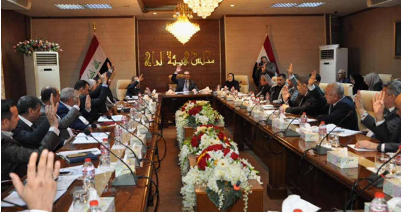
وزير الصناعة والمعادن المهندس محمد صاحب الدراجي

ووضع الاقتراحات التي تعالج أوجه الإبحرافات والإسراف وذلك في سبيل توجيه الأداء نحو تحقيق الجوانب الأساسية الكفاءة . والفعالية . والإقتصادية والنزاهة . الإداري والمالي وتفتيش الأنشطة والعمليات .