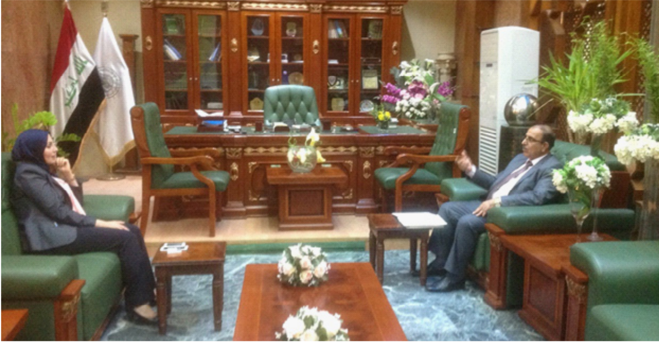
جانب من لقاء رئيس الحكومة المحلية مع أمينة بغداد

يوجد في محافظة بغداد ( أكثر من ثلاثة آلاف عائلة نازحة ) كان معظمها يعيش في العشرات من ابنية المدارس المنتشرة في أنحاء العاصمة قبل أن ينتقلوا إلى المجمعات التي أنشأتها المحافظة . وإن محافظة بغداد افتتحت خمسة مجتمعات كرفانية لغرض إسكان أعداد إضافية من العائلات النازحة وإنهاء مشكلة شغلهم للمدارس .